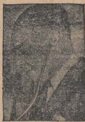
Brytyjski minister wojny Hore-Belisha przybył wczoraj do Neapolu.

Redaktor lub jego zastępca przyjmuje od g. 3 do 4 po poł. — Administracja czynna — od g. 8 rano do g. 10 bez przerwy. — Wydział Ogłoszeń tel. 182-48 Filia ul. Piotrkowska 11, tel. 102-29 Wydział Prenumeraty tel. 182-48 Opłata pocztowa uiszczona gotówką.