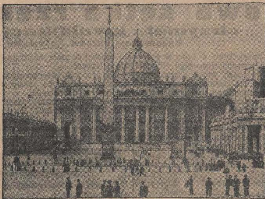
Bazylika św. Piotra i Pawła w Rzymie.

Obecnym kierownikiem sekretariatu stanu jest kardynał Pacelli, były Nunciusz papieski w Berlinie, powołany na to stanowisko przez obecnego Papieża Piusa XI, który w kardynale ceni jego dojrzałość dyplomatyczną i odważną decyzję, miarkowaną tą głęboką mądrością, jaka od dziesiątków lat jest cechą dyplomatów watykańskich.