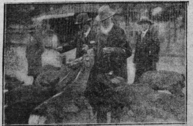
W bieżącym miesiącu bawił w Tokio przez kilka dni Bernard Shaw. Na zdjęciu naszym widzimy Shaw'a karmiącego zwierzęta we wspólnym zwierzyńcu w parku Nara, najpiękniejszym parku japońskim