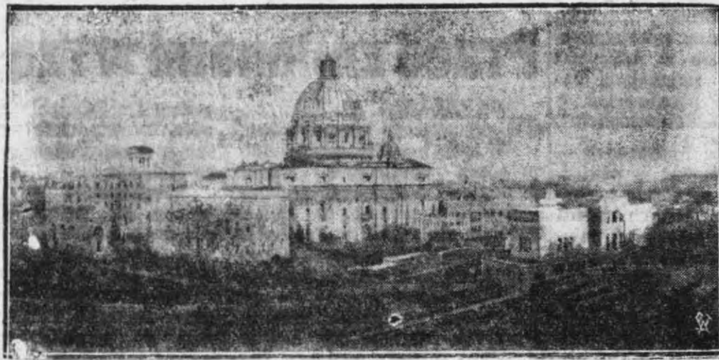
Na zdjęciu naszym widzimy panoramę stolicy Apostolskiej Citta del Vaticano ze wspaniałymi ogrodami Watykańskimi i Katedrą św. Piotra na pierwszym planie.