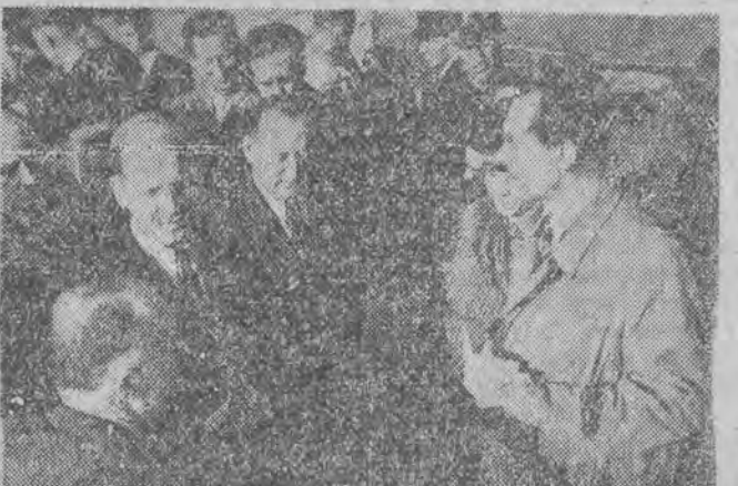
W ub. czwartek powróciła do kraju z Paryża delegacja polska na Światowy Kongres Obróńców Pokoju. Delegacja powitana została uroczystie przez ludność Warszawy. Na zdjęciu z lewej strony - delegacja w chwili po opuszczeniu samolotu, z prawej - delegaci udzielają wywiadu przedstawicielom prasy i radia.