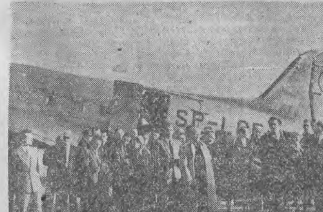
W ub. czwartek powróciła do kraju z Paryża delegacja polska na Światowy Kongres Obróńców Pokoju. Delegacja powitana została uroczystie przez ludność Warszawy. Na zdjęciu z lewej strony - delegacja w chwili po opuszczeniu samolotu, z prawej - delegaci udzielają wywiadu przedstawicielom prasy i radia.