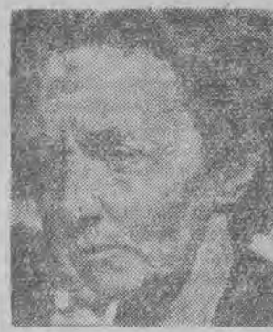
prof. Irena Joliot - Curie