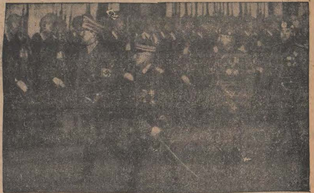
Kanclerz Hitler przechodzi w towarzystwie króla Wiktora Emanuela przed frontem kompanii honorowej. Za szefami obu państw podążają Mussolini i Ciano.

Moment serdecznego powitania kanclerza Hitlera przez Mussoliniego na dworcu Ostyjskim w Rzymie. Po lewej stronie stoi król Wiktor Emanuel III i minister spraw zagranicznych hr. Ciano. Obok kanclerza Hitler, ministrowie Hess i Ribbentrop.