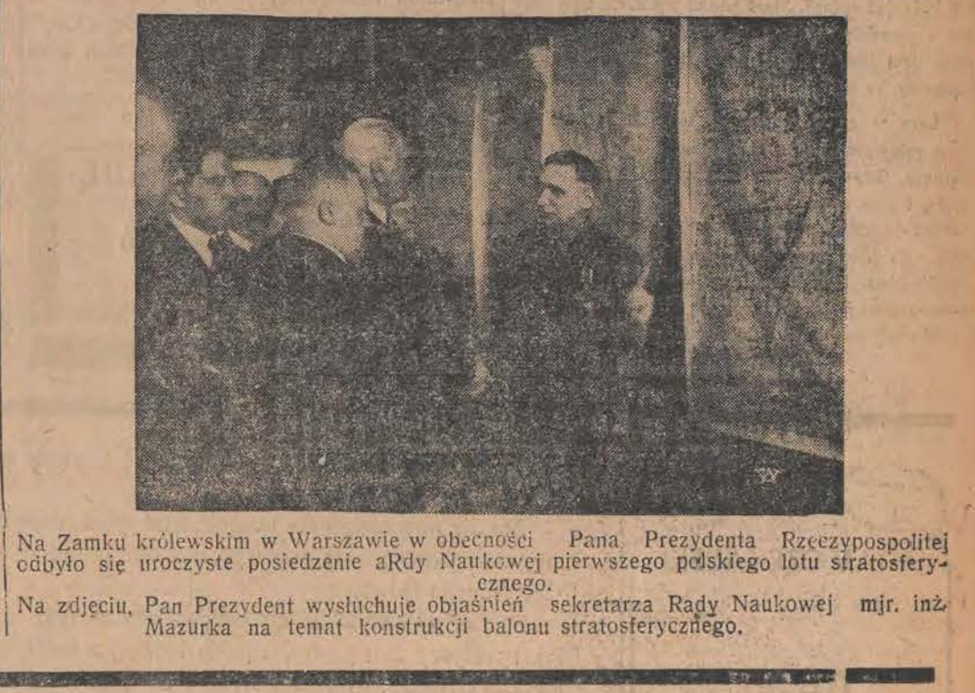
Na Zamku królewskim w Warszawie w obecności Pana Prezydenta Rzeczypospolitej odbyło się uroczyste posiedzenie Rady Naukowej pierwszego polskiego lotu stratosferycznego.

listy 52 osób prawie bez wyjątku pochodzenia żydowskiego, pozbawionych obywatelstwa Rzeszy. Minister spraw wewnętrznych Rzeszy zastrzega sobie przy tym decyzję pozbawienia obywatelstwa również krewnych, wymienionych w liście osób.