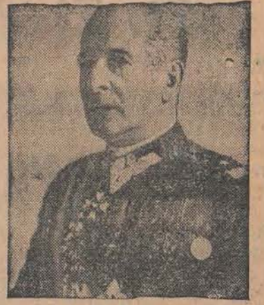
Pan Prezydent Rzeczypospolitej mianował ambasadorem R. P. przy Kwirynale gen. Bolesława Wieniawę-Długoszowskiego.

Redaktor lub jego zastępca przyjmuje od g. 3 do 4 po poł. — Administracja czynna — od g. 8 rano do g. 10 bez przerwy. — Wydział Ogłoszeń tel. 182-48 Filia ul. Piotrkowska 11, tel. 102-29 Wydział Prenumeraty tel. 182-48 Opłata pocztowa uiszczona gotówką.