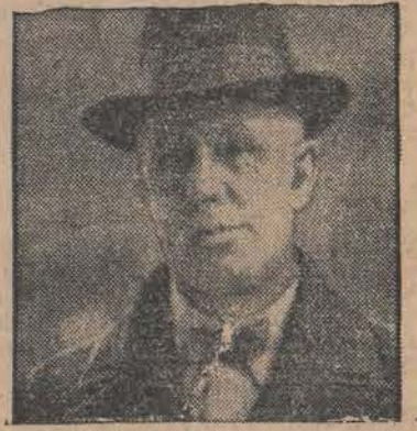
Ambasador brytyjski w Rzymie lord Perth odgrywa doniosłą rolę w rokowaniach wisko-francuskich.

Redaktor lub jego zastępca przyjmuje od g. 3 do 4 po poł. — Administracja czynna — od g. 8 rano do g. 10 bez przerwy. — Wydział Ogłoszeń tel. 182-41 Filia ul. Piotrkowska 11, tel. 102-29 Wydział Prenumeraty tel. 182-48 Opiata pocztowa uiszczona gotówką.