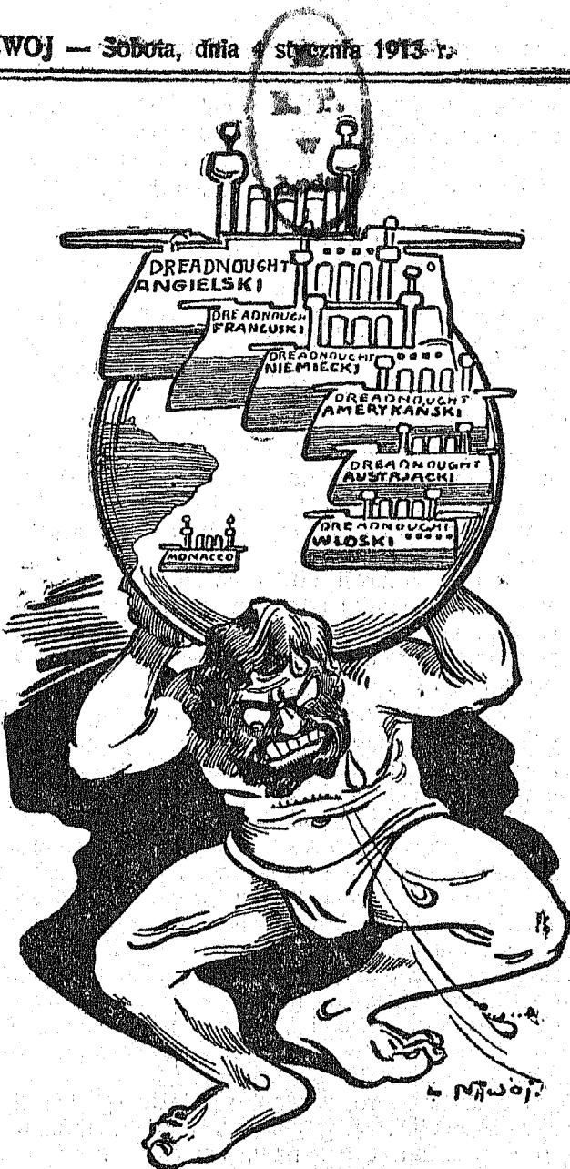
Atlas. Ja, syn tytana Japetosa i Klimeny, ledwie dźwigam ten podarek, który otrzymują ludzie na gwiazdkę od swych kojących rządów.