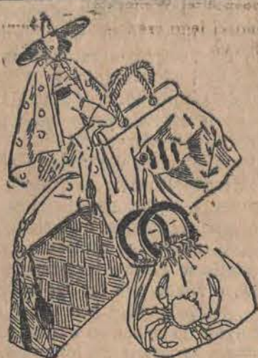
Modne torebki plażowe.

żowego, podbitego tak modnym w tym roku, materiałem w grochy. (rys. 3).