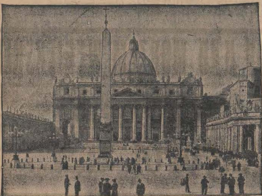
Bazylika św. Piotra i Pawła w Rzymie.

Tygodniowo konsumuje zaś każdy Francuz (1932-34 r.) 3.4 litra, Włoch — 1.6 litra, Hiszpan — 1.5 litra, Szwajcar — 0.8 litra, Węgier — 0.6 litra, Austriak — 0.3 litra.