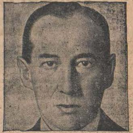
Min. spr. zagr. Józef Beck na zaproszenie rządu estońskiego odwiedzi w połowie bież. miesiąca Tallin.

Redaktor lub jego zastępca przyjmuje od g. 3 do 4 po poł. — Administracja czynna — od g. 8 rano do g. 10 bez przerwy. — Wydział Ogłoszeń tel. 182-48 Filia ul. Piotrkowska 11, tel. 102-29 Wydział Prenumeraty tel. 182-48 Opiata pocztowa uiszczona gotówką.