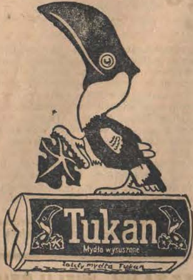
Wysuszone mydło TUKAN oszczędne i tanie.

sprawa ta wybiła się na pierwsze miejsce, góruje nad polityką, owszem wywołuje uchwały polityczne, bezpośrednio wynikające z wielkich zagadnień gospodarki narodowej. Opinia publiczna w Polsce dziś żyje pod znakiem niezaprzeczonej preponderancji gospodarczej... Nie odbywa się żadne zebranie polityczne, na którym wszyscy bez wyjątku mówcy nie podnosiliby w pierwszej mierze zagadnień gospodarczych, a przede wszystkim nie dążyliby w swych wywodach do najrychlejszego zlikwidowania stanu upośledzenia gospodarczego Polaków w Polsce. Jesteśmy w dobie, kiedy cała ludność polska zastanawia się nad poprawą swej sytuacji gospodarczej, tak bardzo zagrożonej. W tym względzie osiągnęliśmy absolutną jedność i konsolidację opinii narodu; głosy są nabrzmiałe troską, argumenty — są o nieodpartej mocy przekonywania. Stan umysłów przypomina okres z wojny 1920 r.