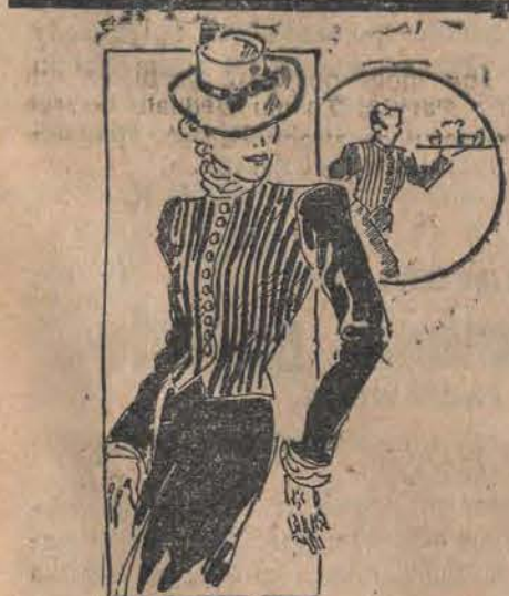
Panie wzorują się w tym roku na boyach hotelowych, nosząc kamizelki z wełny w paski z gładkimi rękawami.

Sport rowerowy i motocyklowy również wymaga stroju zbliżonego do męskiego. Połączono więc estetykę z praktycznością, wykonując kostium z wełny w kratę brązowo-beż, o spódniczce - spodniach poszerzonych wstawianym plisowaniem. Kombinezon i mankiety są z wełny beż. Nowością jest chusteczka, zawiązana na sposób wiejski pod brodę, znakomicie ochraniająca głowę i uszy od nadmiernego wiatru (rys. 2).