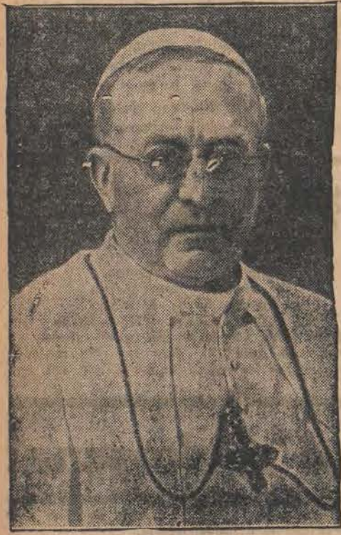
Ojciec św. Pius XI.

W chwili, gdy ponad nowym Rzymem przechodzi powiew historii, tworzą się po rozumienia państw totalnych, gdy Mussolini wygłasza wielkie mowy polityczne, gdy na tle historycznego Rzymu powstaje nowe faszystowskie imperium, jest w tym Wiecznym Mieście jedna część, do której