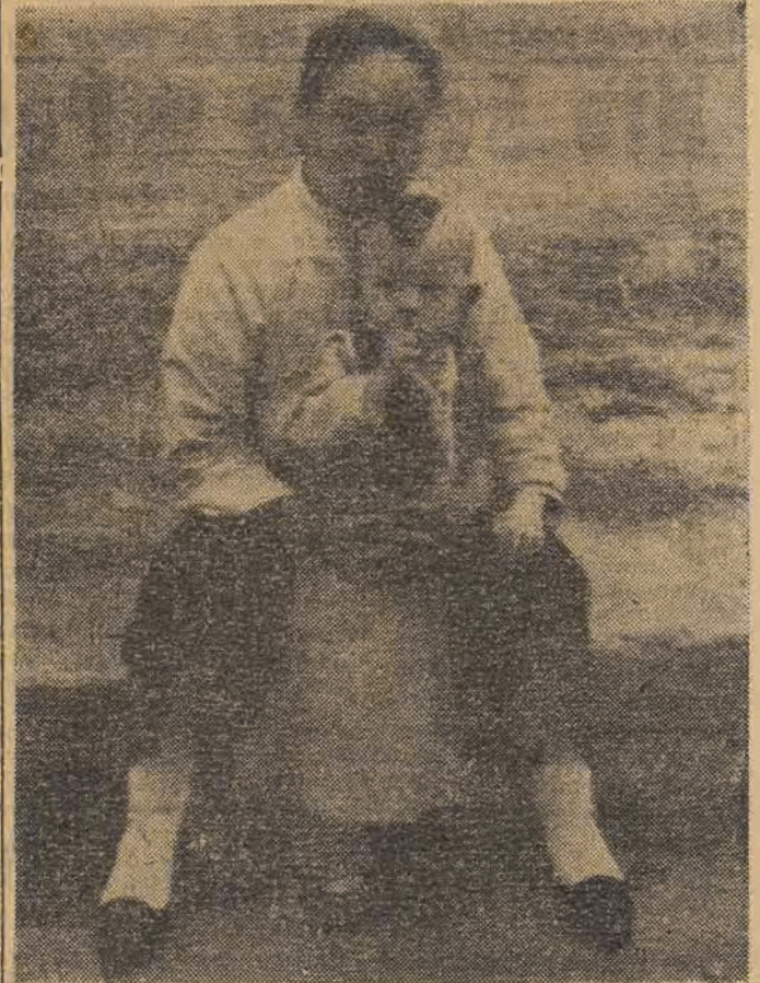
Zwycięska armia ludowa po raz pierwszy w historii Chin — przyzwała kobietom chińskim wolność i ludzkie warunki.

„Pragniemy powołać kobiety polskie do nieustannej troski o wzrost i jakość naszej produkcji. Pragniemy, aby wzięły one na swe barki obowiązek przedterminowego wykonania planu budowlanego Polski Ludowej, pragniemy, by kobiety polskie były hucem, walczącym pod hasłem: „nigdy więcej wojny”, w imię braterstwa wolnych narodów, w imię solidarności międzynarodowej.