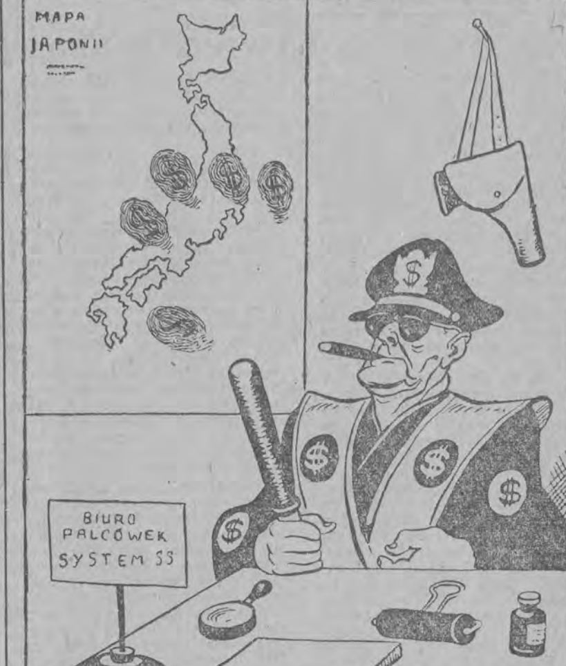
Jak donoszą z Japonii — amerykańskie władze okupacyjne postanowiły zaopatrzyć wszystkich Japończyków w „palcówki” z odciskami kciuków. Do zorganizowania tej masowej „restracji” palcówkowców — zaproszono z Zachodnich Niemiec cały sztab „fachowców” z byłego SS, którzy „nabrali wprawę” w przeprowadzaniu „palcówkowania” w Polsce.

WARSZAWA (PAP). Zarząd Główny Związku Samopomocy Chłopskiej ogłosił konkurs na zorganizowanie wzorowej zabawy na wsi. Jednym z głównych warunków konkursu jest urządzenie zabawy estetycznego bufetu bez wódki.