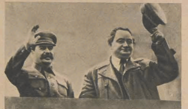
9 Wiele czasu i energii poświęcił Stalin pracom Międzynarodówki Komunistycznej, która odegrała wielką rolę w ukształtowaniu się samodzielnych partii proletariatu w krajach kapitalistycznych. Stalin pomagał mądrymi wskazówkami Dymitrowowi, kierownikowi Międzynarodówki Komunistycznej, sławnemu bohaterowi procesu lipskiego, późniejszemu premierowi Bułgarii Ludowej.