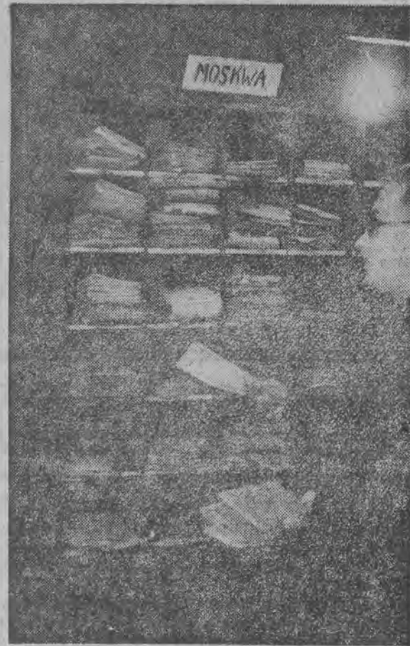
Takiego „zatrzęsienia” listów wysyłanych za granicę nie pamiętają nawet starzy pracownicy pocztowi. Oto jedna z wielu szafek w Urzędzie Pocztowym Łódź 2 przeznaczonych tylko na korespondencje do Moskwy.