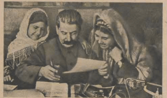
8 Tadžyckie kobiety u Stalina. Symbol równouprawnienia narodów i symbol równouprawnienia kobiet. Tylko w państwie socjalistycznym kobieta otrzymuje naprawdę pełne prawa, ma dostęp do wszystkich zawodów i stanowisk i cieszy się powszechnym szacunkiem.