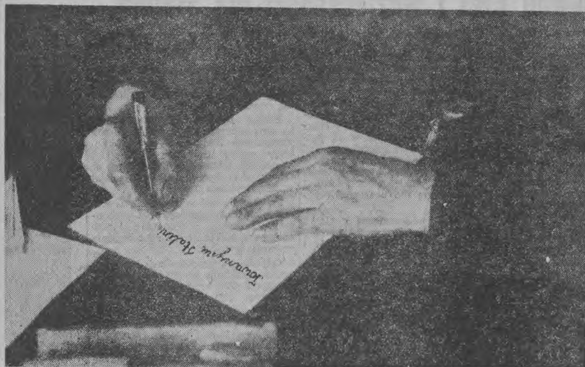
Robotnicze ręce — twarde, żyłaste, spracowane ręce tkacza, kreślą na kartce papieru życzenia zaczynające się od słów: „Towarzyszu Stalinie!”