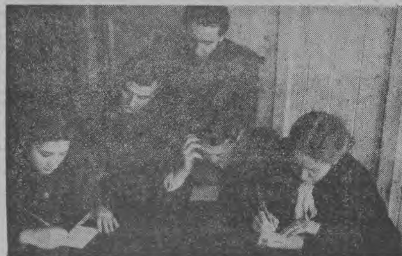
Chwilka wolnego czasu znaleźć się nawet i na poczcie, gdzie panuje ustawiczny ruch. Pracownicy pocztowi w takiej właśnie chwili piszą listy do Towarzysza Stalina.