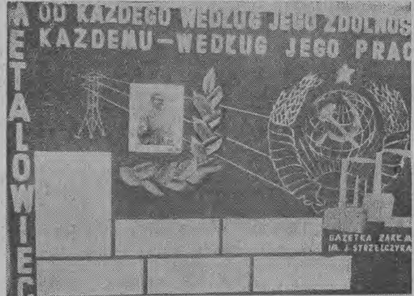
A oto efektowna gazetka ścienna Zakładów im. Strzelczyka