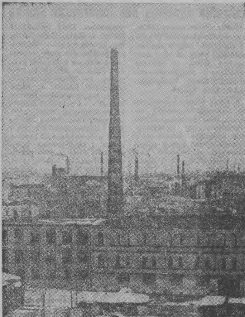
Dymią kominy robotniczej Łodzi, wse wzmożona praca...