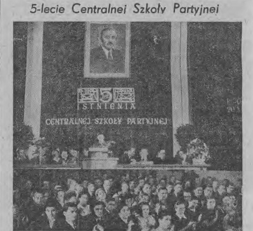
Jak już donosiliśmy, Centralna Szkoła Partyjna w Łodzi obchodziła w ubiegłą sobotę 5-lecie swej działalności. — Na ilustracji: Prezydium uroczystej akademii zorganizowanej z okazji 5-lecia Szkoły oraz widowek na salę.

Władysław Broniewski Słowo o Stalinie Fragmenty Rewolucjo! Któż wiatr powstrzyma, Kto ziemię zawróci w biegu? Rewolucjo, tablice praw Rzymu obalamy od Chin po Biegum! Rewolucjo! Siedemdziesiąt lat Stalinowych powiewa nad światem. I rodzi się nowy świat, świat stary pęka jak atom. VIII Miliony ludzi Związku Rad i krajów idących drogą Socjalizmu tworzą świat nowy, niosąc w sercach i na ustach imię STALIN. Ludowa armia chińska wypęda ze swego kraju przemoc obcą i niewolę pieniądza. Kroczy naprzód Z IMIENIEM STALIN. W Vietnamie, Burmie, na wyspach Majałskich bojownicy wolności, niepodległości i sprawiedliwości walczą przeciw kolonizatorom wołając: STALIN. Górnicy francuscy trwają w strajkach i wyciągają dłoń na wschód z okrzykiem: STALIN!