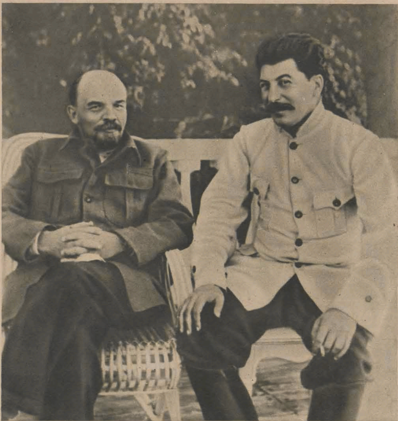
10 Gdy Lenin, zraniony w zamachu kontrrewolucyjnym 1918 r. i wyczerpany nadmierną pracą, odczuwać zaczyna ubytek sił, proponuje w kwietniu 1922 r. na sekretarza generalnego partii bolszewickiej swego najbliższego ucznia i współpracownika — Stalina. Lenin zmuszony jest przenieść się na leczenie do miejscowości podmoskiewskiej Gorki, gdzie Stalin często go odwiedza. Przez dwa lata Stalin prowadzi partię w ścisłej i serdecznej współpracy ze swoim wielkim nauczycielem.