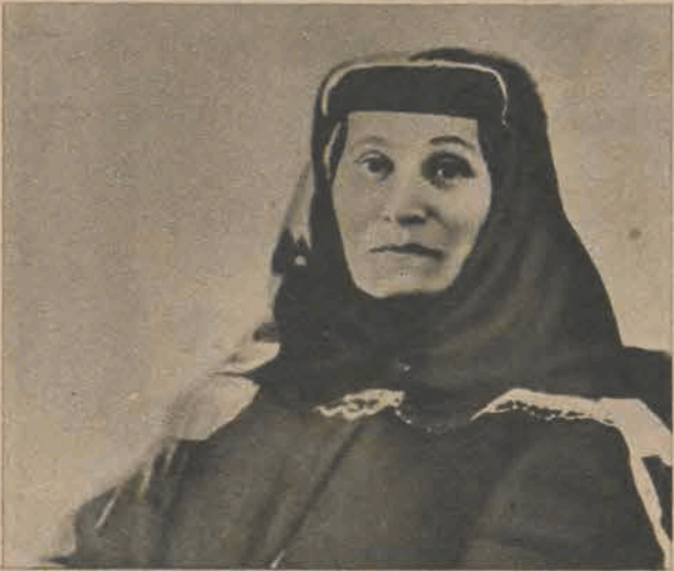
2 Stalin gorąco kochał swoją matkę. Otaczał ją do końca jej życia najtroskliwszą opieką i odwiedzał, ile razy pozwalało na to jego surowe i burzliwe życie rewolucjonisty.