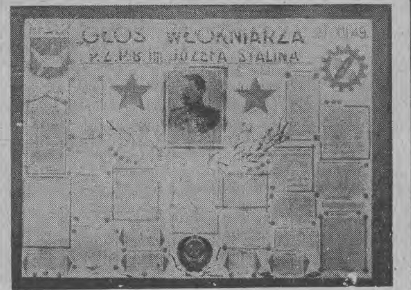
Gazetka PZPB im. Józefa Stalina