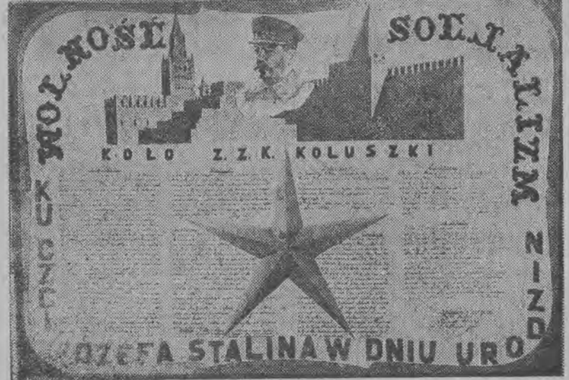
Kolejarze z Koluszek również przysłali swą gazetkę na Wystawę.