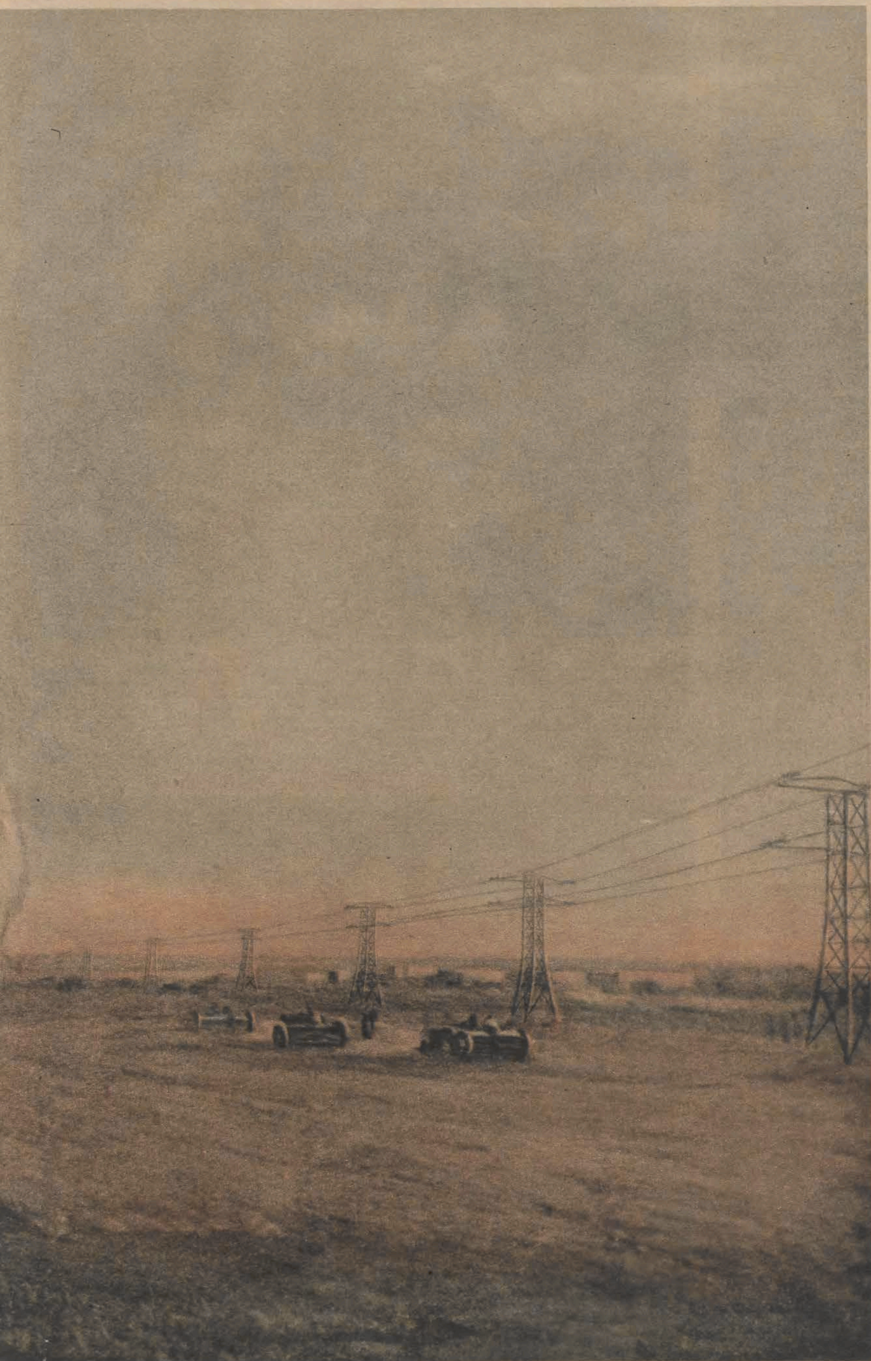
(Obraz F. Szurpina)