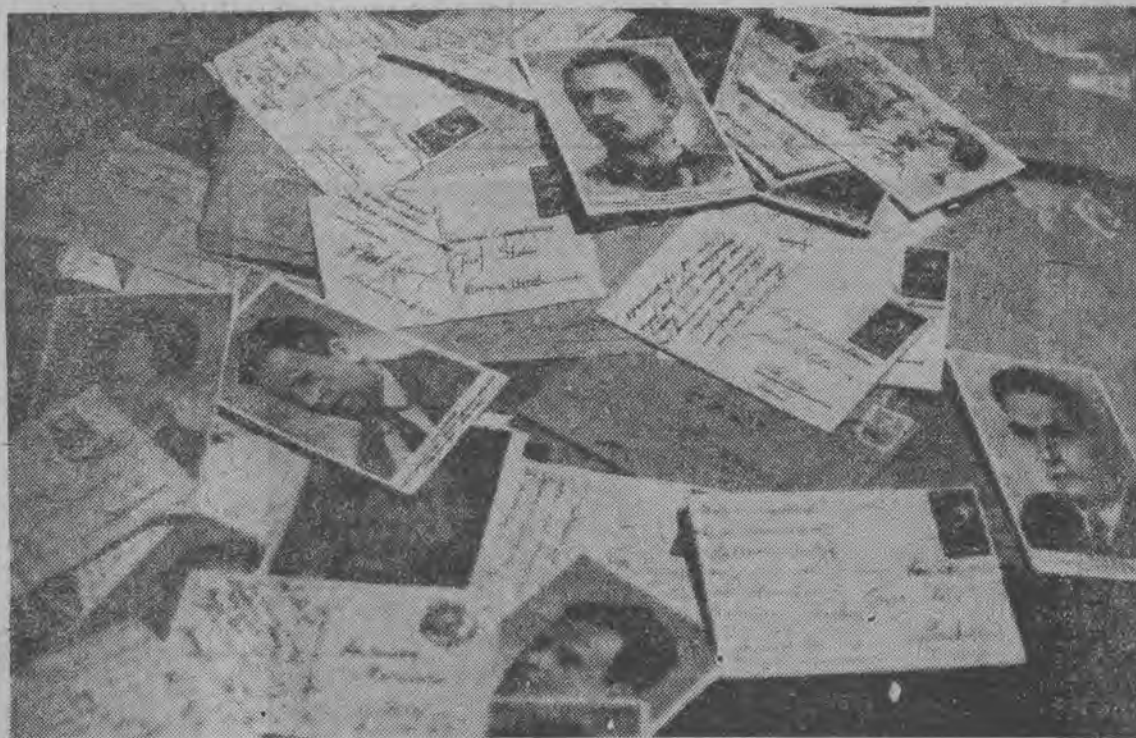
Co dzień pracownicy pocztowi wysypują na stoły z pakietów worków dziesiątki tysięcy listów i pocztówek z wizerunkami bohaterów klasy robotniczej. Adresy wszędzie jednakowe: „Towarzyszu Stalin, Moskwa-Krasni”. Jeszcze przed porankiem nie ma ich tyle, co teraz.