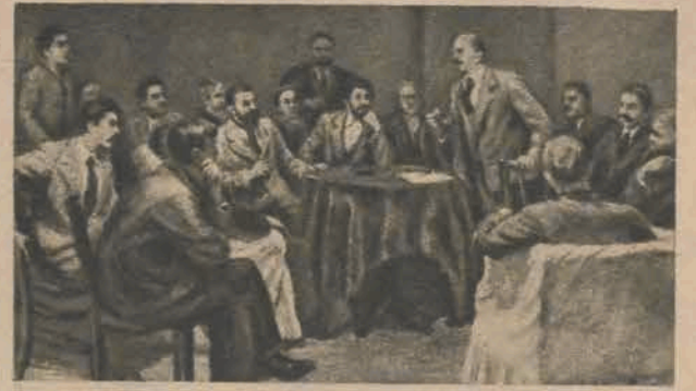
5 Mijają lata wypełnione walką, znaczone więzieniami, zesłaniami, ucieczkami z zesłania. Stalin stał się najwierniejszym uczniem Lenina. W 1912 r. odwiedza Stalin dwukrotnie Lenina w Krakowie. Tu zaczyna pisać swoje klasyczne dzieło „Marksizm a sprawa narodowa”, w którym uzasadnia leninowskie hasło o prawie każdego narodu do samostanowienia o sobie i do utworzenia odrębnego państwa.