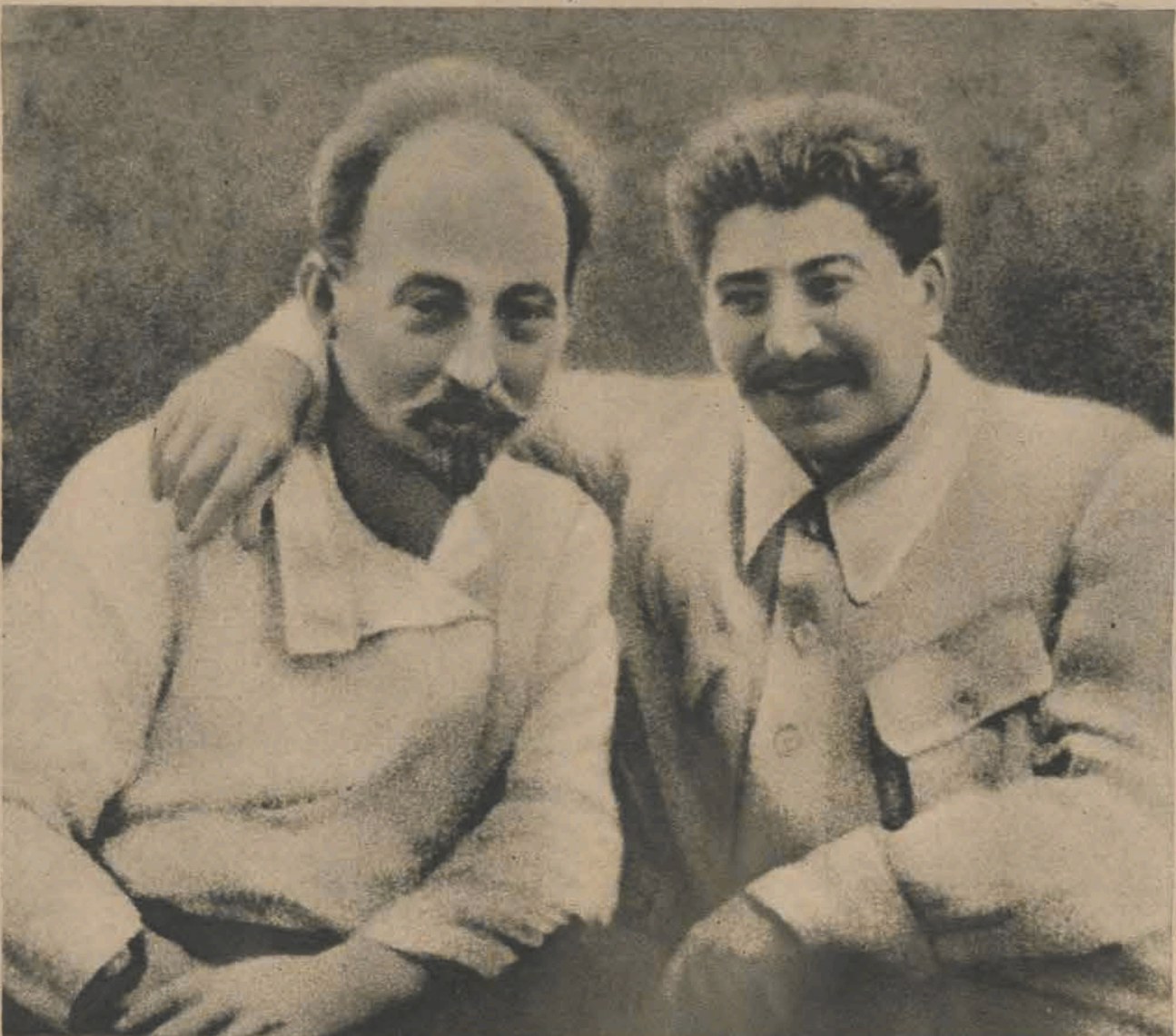
11 Mocne więzy przyjaźni łączyły Stalina z wybitnym rewolucjonistą polskim, Feliksem Dzierżyńskim. Łączyło ich bezgraniczne oddanie sprawie klasy robotniczej i ludu pracującego, głębokie przywiązanie do Lenina i niezłomna wierność jego nauce, głęboka wiara w zwycięstwo komunizmu.