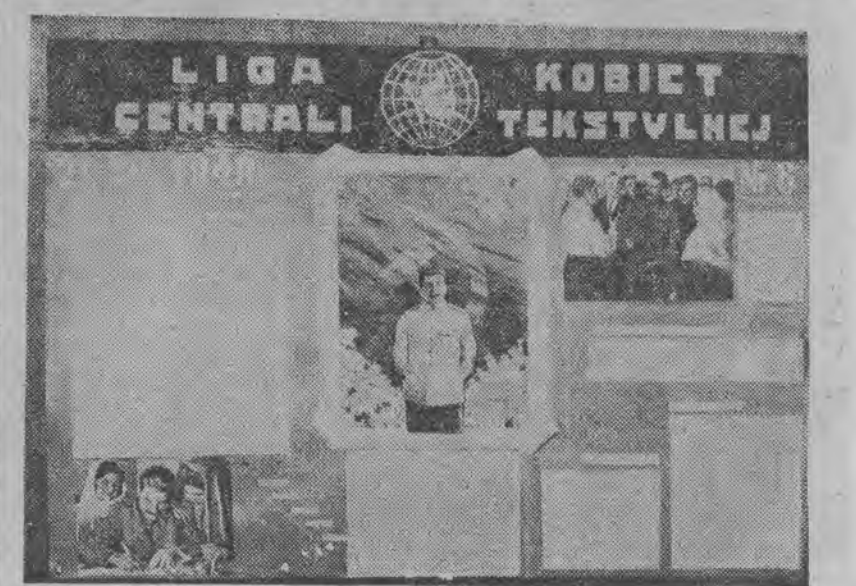
Gazetka kół Ligi Kobiet przy C. T.