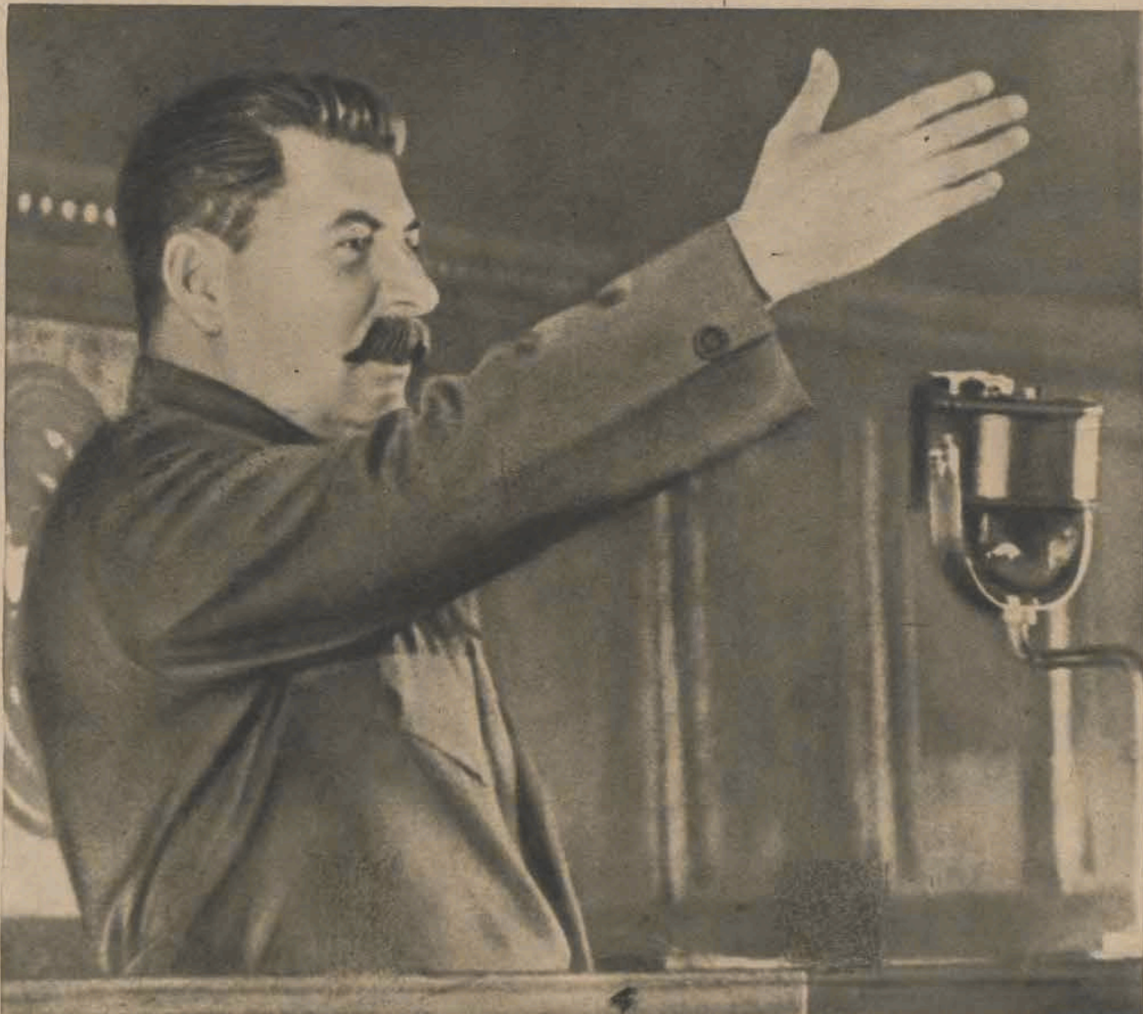
13 Śmiało i przezornie, mądrze i czujnie poprowadził Stalin Związek Radziecki do socjalizmu. Dawno w niepamięć poszła Rosja carska, kraj zacołania, nędzy i bezprawia. Pod kierownictwem Stalina zbudowany został potężny przemysł socjalistyczny, klasa wyzyskiwaczy w mieście i na wsi została całkowicie zlikwidowana, chłopcy z pomocą robotników złączyli się w gospodarstwa zbiorowe — kolchozy, które przyniosły im dostatnie i kulturalne życie. Zniesiony został ostatecznie i na zawsze wyzysk człowieka przez człowieka, powstało pierwsze w świecie społeczeństwo socjalistyczne. Stalin proponuje ludowi radzieckiemu przyjęcie nowej Konstytucji, Konstytucji wolności i równości ludzi i narodów, najbardziej demokratycznej konstytucji świata.