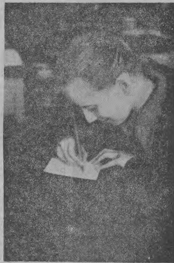
Najlepsza uczennica klasy 9a niedawno zbudowanej szkoły TPD im. Fornalskiej — kol. Lipke opisuje Towarzyszowi Stalinowi, w jakiej to pięknej szkole uczą się teraz robotnicze dzieci,