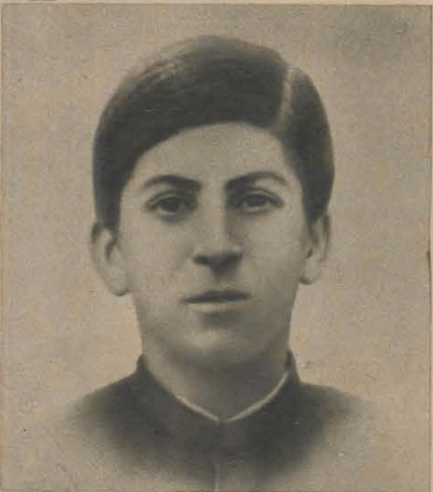
3 15-letni Józef Dżugaszwili, uczeń seminarium duchownego w Tyflisie, nawiązuje pierwsze kontakty z marksistami przybyłymi z Rosji, zakłada kółka rewolucyjne wśród współuczniów i — zostaje wydalony z seminarium.