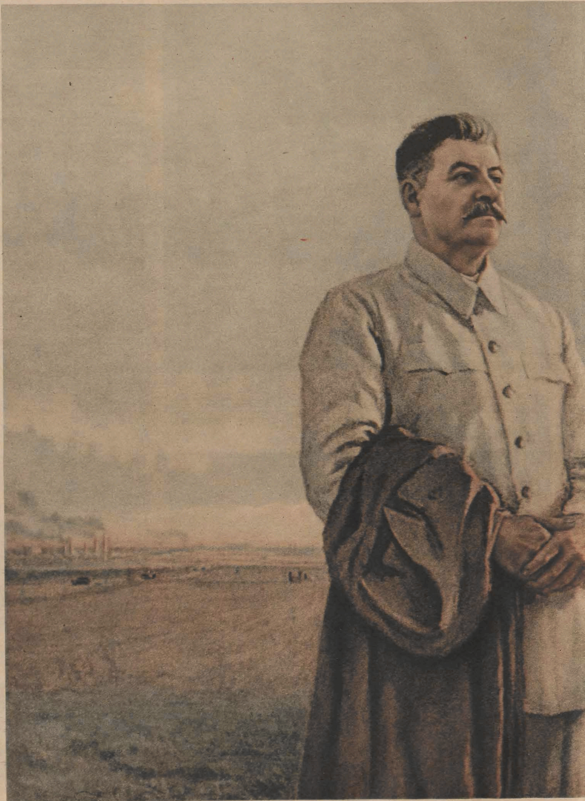
„Poranek naszej ojczyzny“