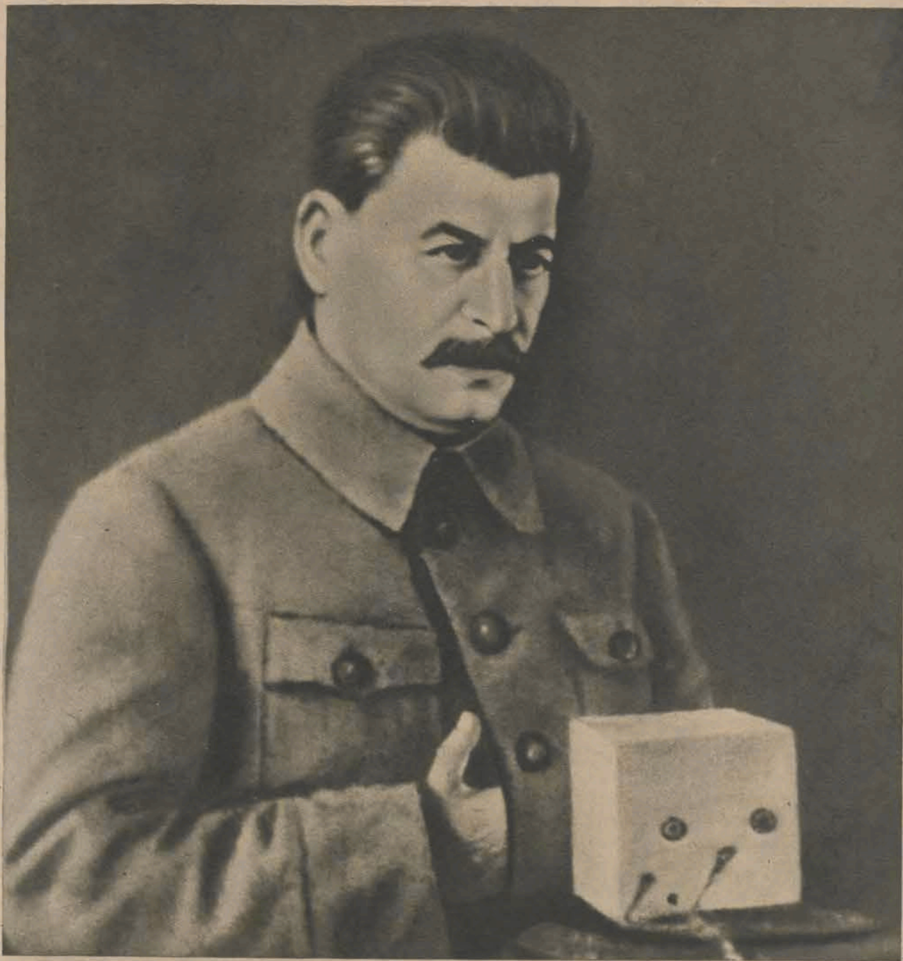
12 21-szy stycznia 1924 r. Straszliwy cios spadł na partię, na ZSRR, na całą postępową ludzkość. Lenin umarł. Stalin składa imieniem partii wstrząsającą przysięgę, w której między innymi mówi: „Nie ma nic chlubniejszego ponad miano członka partii, której twórcą i kierownikiem jest towarzysz Lenin... Odchodząc od nas nakazał nam towarzysz Lenin wysoko dźierać wielkie miano członka partii i strzec jego czystości. Przysiegamy Ci, towarzyszu Leninie, że z honorem wykonamy to Twoje przykazanie!”