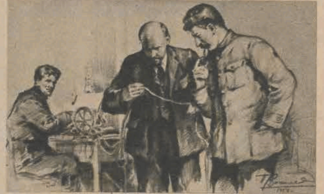
6 Lenin miał bezgraniczne zaufanie do Stalina. W czasie Rewolucji Październikowej powierzał mu najtrudniejsze zadania. Z polecenia Lenina, Stalin kierował przygotowaniem do powstania i samym powstaniem. Później, w okresie wojny z kontrrewolucją i interwencją zagraniczną, Lenin posyła Stalina na najbardziej zagrożone odcinki frontu.