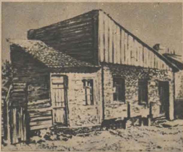
1 Domek w miejscowości Gori koło Tyflisu (Gruzja). Tu mieszkał przed 70-ciu laty szewc Wissarion Dżugaszwili z żoną Katarzyną, pochodząca z rodziny chłopów pańszczyźnianych. 21-go grudnia 1879 r. urodził im się tutaj syn Józef, którego dziś czczą i miłują prości ludzie całego świata, pod imieniem Stalin.