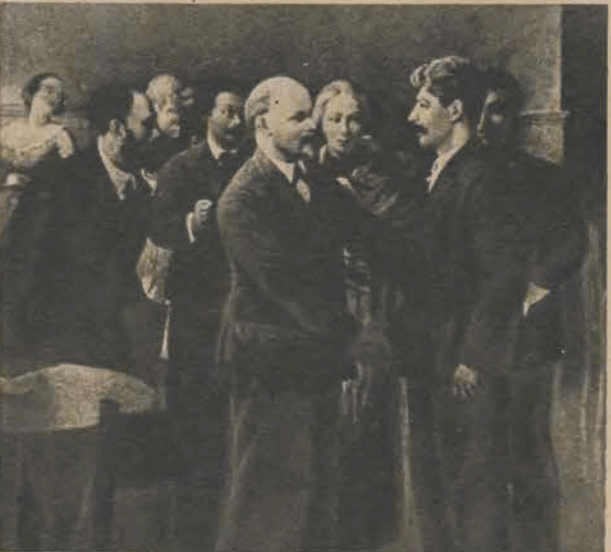
4 Stalin poświęca się całkowicie pracy rewolucyjnej. Studiuje pilnie Marksa i Lenina. W myśl Lenina buduje Stalin rewolucyjną partię proletariatu w Gruzji, organizuje strajki i manifestacje i przygotowuje kraj do powstania przeciw caratowi. W grudniu 1905 r. wyjeżdża Stalin na Konferencję Bolszewików do Finlandii i tu po raz pierwszy spotyka się osobiście ze swoim wielkim nauczycielem.