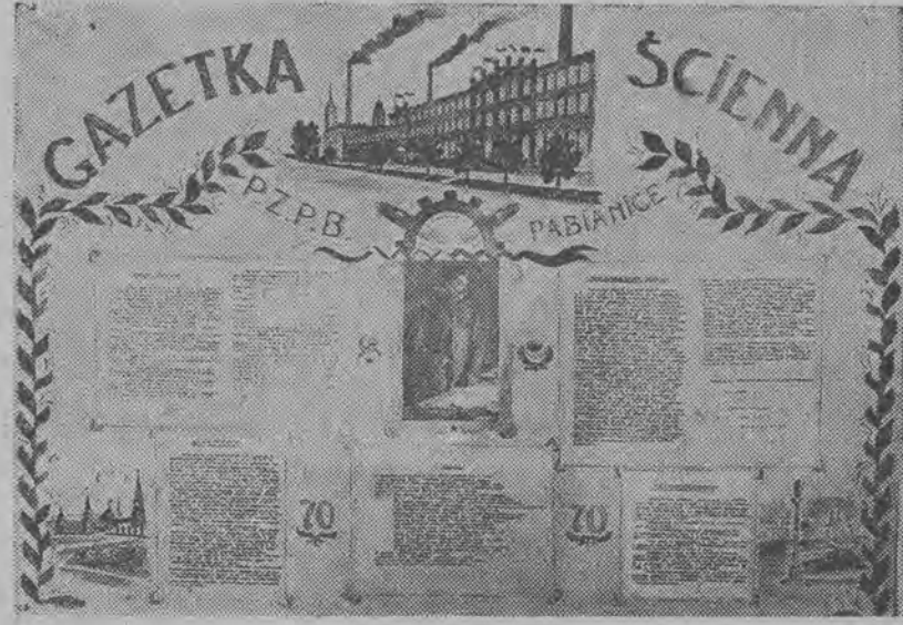
Gazetka PZPB z Pabianic jest wyrazem czci robotników tych zakładów dla Towarzysza Stalina.