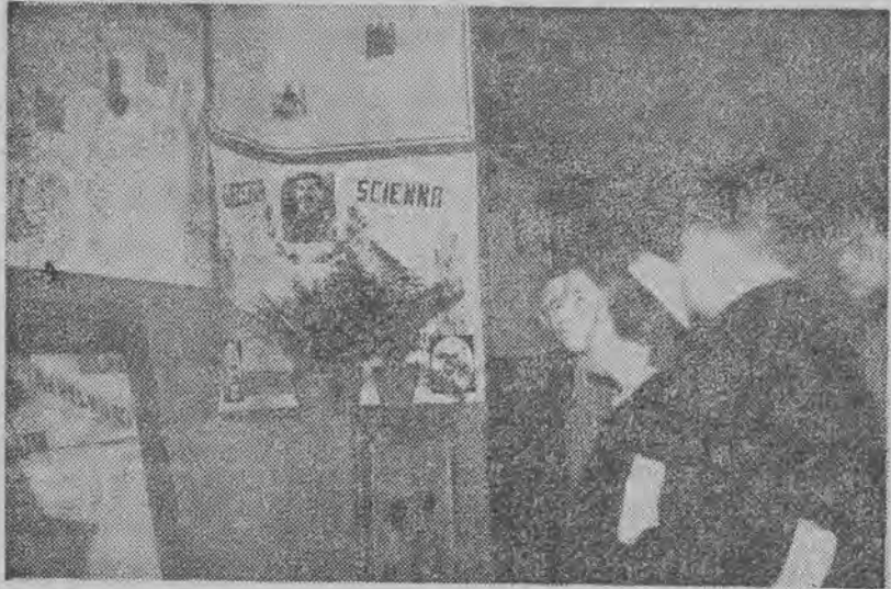
Łodzenie z ciekawością oglądają IV Wystawę Gazetek Sciennych, poświęconą 70 rocznicy urodzin Towarzysza Józefa Stalina.

Już w ciągu pierwszych dwóch dni po otwarciu Wystawy Gazetek Sciennych, poświęconych 70 rocznicy urodzin Towarzysza Józefa Stalina, zwiedziło ją powyżej 1000 osób, z których większość wzięła udział w głosowaniu na najlepszą gazetkę. Według tymczasowych obliczeń, największym uznaniem zwiedzających cieszy się dotychczas gazetka TOR „Torowiec”, która w pierwszym dniu uzyskała blisko połowę głosów. Drugie miejsce zajmuje gazetka MZK „Tramwajarz”, dalsze zaś „Głos Włókniarza” i gazetka Skarbowców.