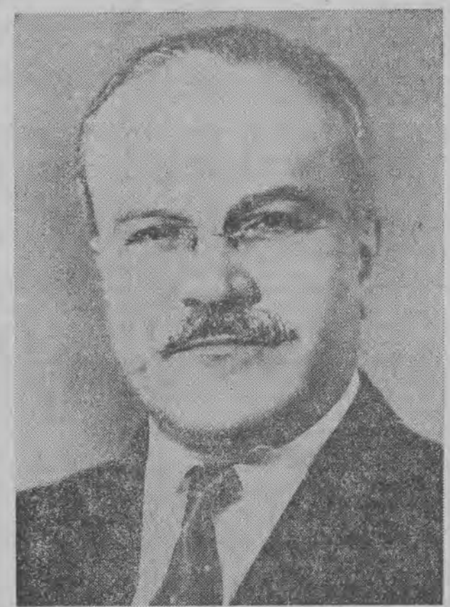
Tow. W. Mołotow

czyły w ciągu ostatnich lat doniosłe zmiany. Do niedawna Związek Radziec-