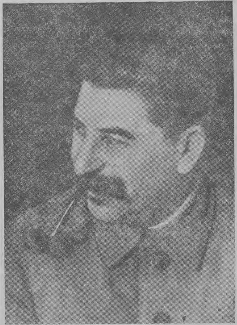
(Dalszy ciąg na str. 2-ej)