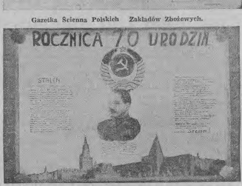
Gazetka Scienna PZPJK Nr 4