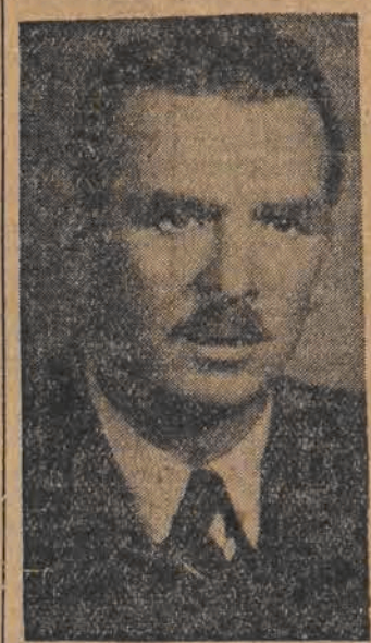
WARSZAWA (obsł. wł.) W środę odbyło się pierwsze posiedzenie nowego prezydium Związkowej Rady Kultury Fizycznej i Sportu K.C.Z.Z. W skład nowego prezydium weszli przedstawiciele wszystkich 9-ciu zrzeszeń