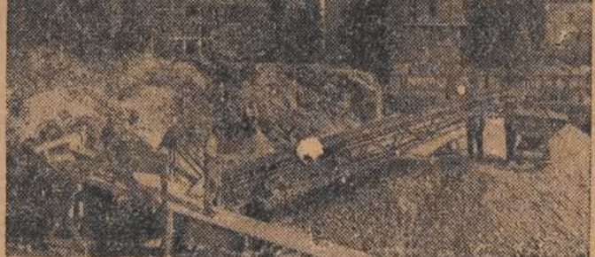
Budowa Centralnego Domu PZPB, w Warszawie szybko postępuje naprzód

E. Piechocki korespondent fabryczny „Głosu” z Fabryki Metalowej nr. 2