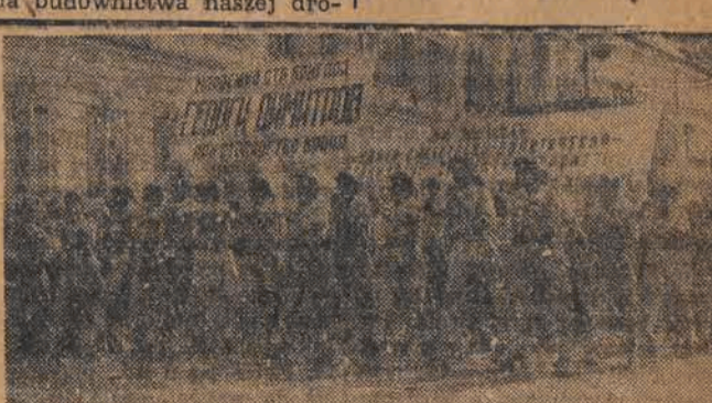
Młodzieżowa brygada pracy im. Georgi Dymitrowa, manifestująca na ulicach Sofii w rocznicę wyzwolenia Bułgarii.

Zjednoczenie bułgarskiej młodzieży ludowej umożliwi wykorzystanie wszystkich jej sił i tego wielkiego entuzjazmu, jaki znalazł tak wspaniały wyraz na tym Kongresie, dla budownictwa naszej dro-