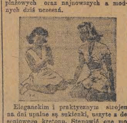
Eleganckim i praktycznym strojem na dni upalne są sukienki, uszyte z deseniowego kretonu. Stanowią one mogą jedną całość lub też składać się z dwóch części — spodni i zakleciek. Stosunkowo proste w kroju, wykonane być mogą własnymi siłami w domu. Pierwsza z tych sukienek uszyta jest z materiału w poprzeczne pasy. Służyć nam może jako stroj na ulicę lub jako sukienka plażowa, gdyż cała od góry do dołu zapisana jest na guziki. Bluźka

plażowych oraz najnowszych a modnych dniach nieszczęśliwych. Efektownym przybraniem tej sukni jest duży, wykładany kołnier i jedwabny szalik wiązany pod szyją.