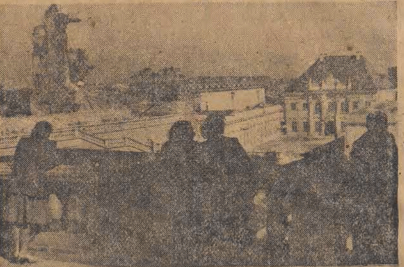
Dnia 2 lipca br. Sejm Ustawodawczy powziął uchwałę o odbudowie zabytkowego Zamku Królewskiego w Warszawie. Odbudowa Zamku rozpoczęła się w roku 1950, zostanie zakończona najpóźniej w roku 1954. Na zdjęciu — ruiny Zamku Królewskiego obok pięknie odbudowanego Pałacu pod Blachą.