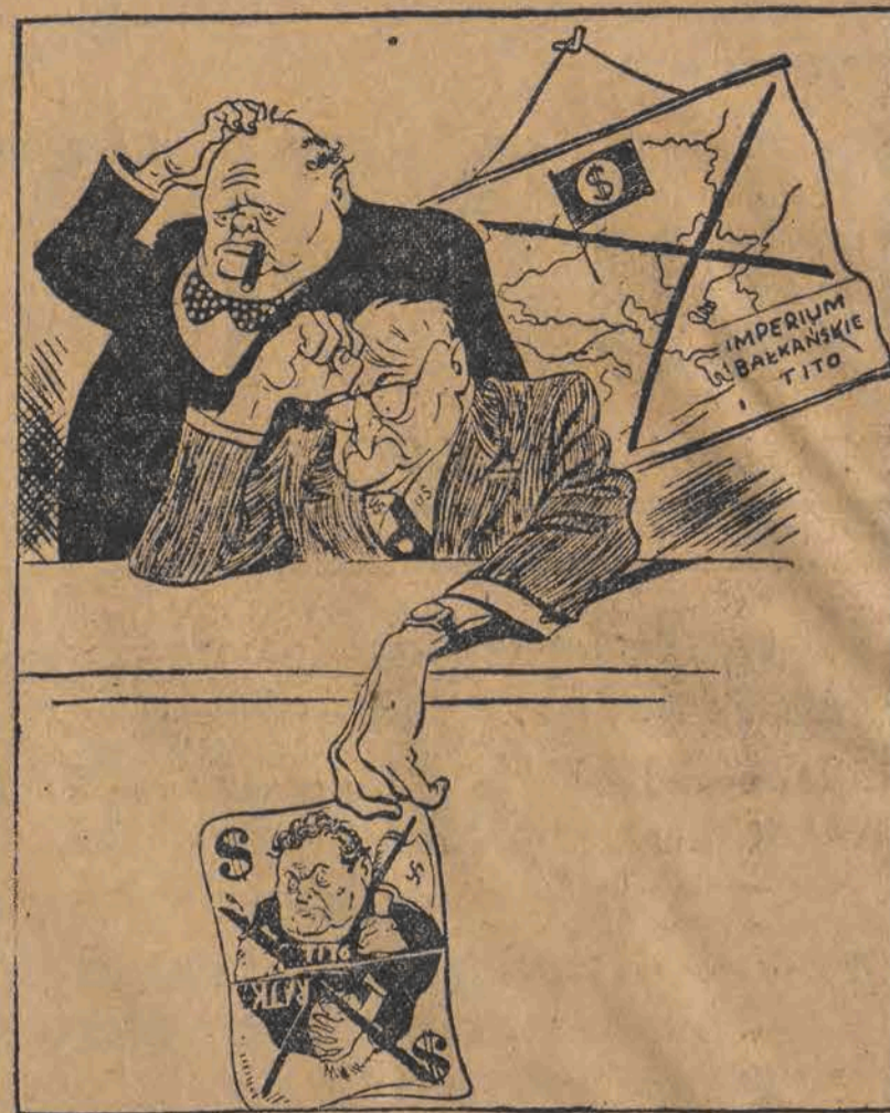
Przegrane karty podlegaczy wojennych

zobowiązać organizacje partyjne do zwiększenia zainteresowania oraz do okazywania konkretnej pomocy organizacjom wychowania fizycznego i sportu.