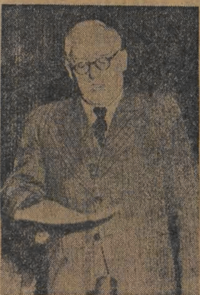
Minister Spraw Zagranicznych A. Wyszyński.

Na wstępie konferencji, minister Wyszyński oświadczył dziennikarzom, że pragnie omówić zagadnienie zbliżających się wyborów trzech niestałych członków Rady Bezpieczeństwa na miejsce ustępujących przedstawicieli Argentyny, Kanady i Ukrainy, a to ze względu na pewne szczególne okoliczności tej sprawy.