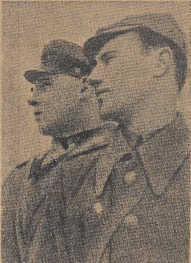
Polsko — radzieckie braterstwo broni

W czwartą rocznicę Oswobodzenia Łodzi myśli i uczucia nasze wracają się ku Temu — który kierował gigantyczną walką z hitlerowskim najazdem, walką zakończoną wiekopomnym zwycięstwem.