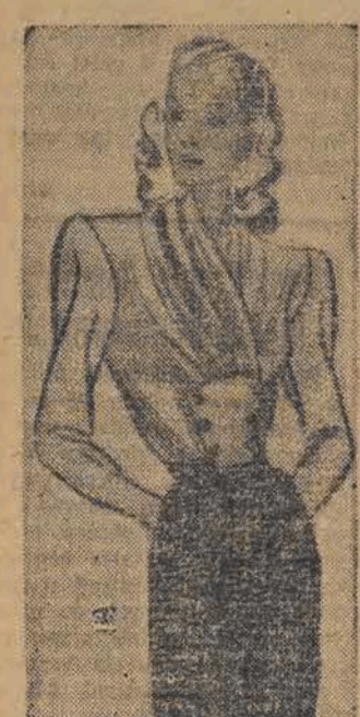
Na załączonych rysunkach przedstawiamy naszym czytelnikom

ozkom wzory sukien, bluzek i wizytowej torebki. Sukienki to typowe modele przróbkowe. Powstać powinny z zestawienia z tkanin różnobarwnych, bądź też z połączenia materiału gładkiego z deseniowym. Tego typu fasony mogą być wykorzystane przy przeróbce naszej zeszlorocznej wiosennej garderoby. Kombinowane suknie umożliwiają przedłużenie zby-