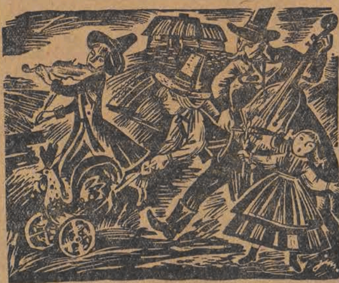
Chłopcy chodzą z „kogutkiem”