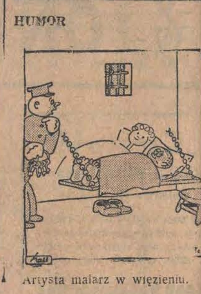
Artysta malarz w więzieniu.

CENY PRENUMERATY z niedzielnym dodatkiem ilustr. i dod. dziec. „MAŁY KURIER”.