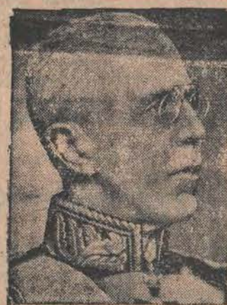
PARYŻ, 25. 4. — Król szwedzki opuścił wczoraj o godz. 11-ej Paryż udając się do Szwecji.

Redakcja: ul. Zwirki Nr. 2. — Administracja: ul. Piotrkowska Nr. 11. Ekspedycja: ul. Piotrkowska Nr. 11. Telefony: Redakcji Nr. 102-28 i 138-28. Administracji Nr. 182-48. Skrzynka pocztowa Nr. 132. Redakcja otwarta dla interesantów tylko od godz. 2 do 5-ej po poł. Redaktor lub jego zastępca przyjmuje od g. 4 do 5 po poł. — Administracja czynna — od g. 9 rano do g. 21 bez przerwy. — Wydział Ogłoszeń tel. 182-48. Filia ul. Piotrkowska 11, tel. 102-29 Wydział Prenumeraty tel. 182-48. Opłata pocztowa uiszczona gotówką.