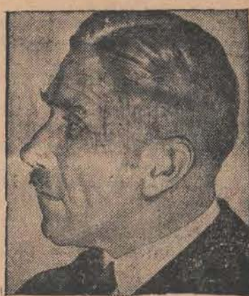
STAMBUL, 27. 4. Przybył tu wczoraj ambasador Rzeszy w Turcji von Papan.

Redakcja: ul. Zwirki Nr. 2. — Administracja: ul. Piotrkowska Nr. 11. Ekspedycja: ul. Piotrkowska Nr. 11. Telefony: Redakcji Nr. 102-28 i 138-28. Administracji Nr. 182-48. Skrzynka pocztowa Nr. 132. Redakcja otwarta dla interesantów tylko od godz. 2 do 5-ej po poł. Redaktor lub jego zastępca przyjmuje od g. 4 do 5 po poł. — Administracja czynna — od g. 9 rano do g. 21 bez przerwy. — Wydział Ogłoszeń tel. 182-48. Filia ul. Piotrkowska 11, tel. 102-29 Wydział Prenumeraty tel. 182-48. Opłata pocztowa uiszczona gotówką.