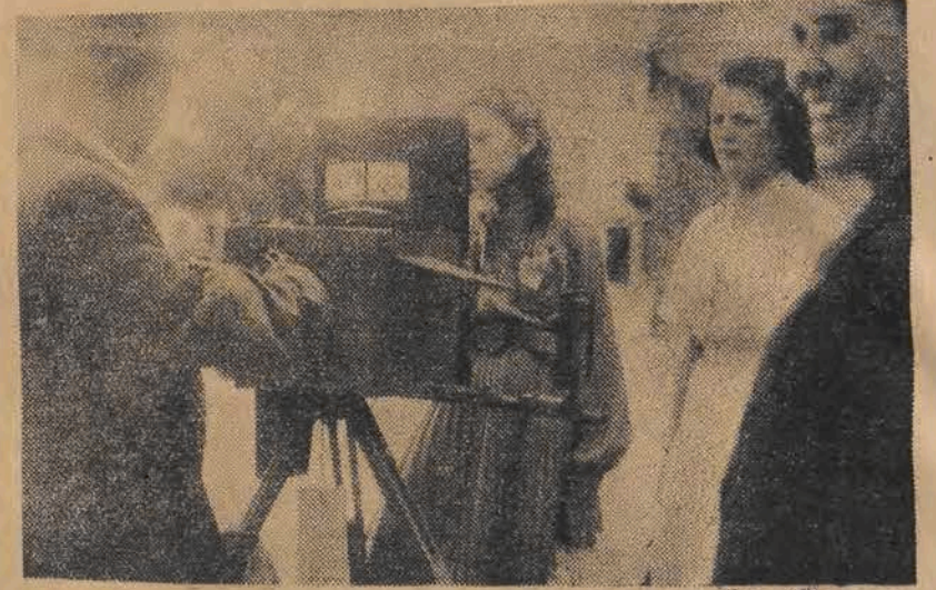
Nieraz w małych miasteczkach i we wsiach podczas większych uroczystości spotkać można fotografów, do konających rdeń licząc zgłaszających się amatorów utrwalenia swej podobizny...