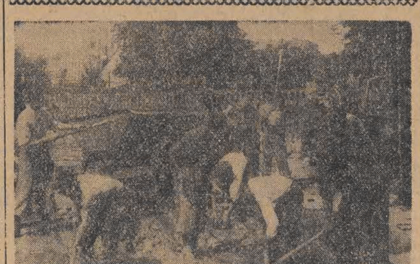
Junacy hufca SP przy Średniej Szkole Tow. Salezjańskiego z inicjatywy ZMP-owców powzięli zobowiązanie przepracowania 3 dni z przeznaczaniem zarobku na Odbudowę Warszawy.

zorganizowana, każdy ma swój dział i ściśle wykonuje swe obowiązki. Załatwia się tu sprawy, związane z zmianą miejsca zamieszkania, mel-dunkowe itp.