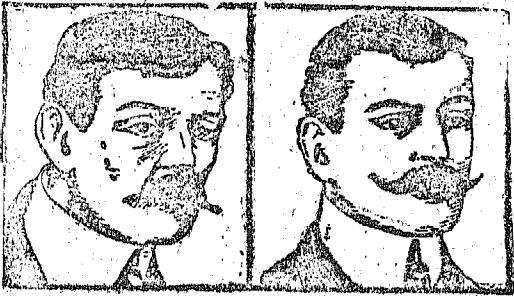
Przed użyciem. Po użyciu.