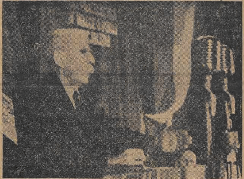
Tow. Marcel Cachin wygłasza przemówienie na III Plenum KC PZPR

Trzeci film pt. „Uczymy się języka rosyjskiego” zilustruje wyniki nauczania języka rosyjskiego wśród dorosłych i młodzieży.