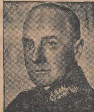
RZYM, 7. 5. — Gen. Brauchitsch w towarzystwie włoskiego podsekretarza stanu w min. spraw wojsk. przybył w południe z Tripolisu do Rzymu.

Redakcja: ul. Zwirki Nr. 2. — Administracja: ul. Piotrkowska Nr. 11. Ekspedycja: ul. Piotrkowska Nr. 11. Telefony: Redakcji Nr. 102-28 i 138-28. Administracji Nr. 182-48. Skrzynka pocztowa Nr. 132. Redakcja otwarta dla interesantów tylko od godz. 2 do 5-jej po poł. Redaktor lub jego zastępca przyjmuje od g. 4 do 5 po poł. — Administracja czynna — od g. 9 rano do g. 21 bez przerwy. — Wydział Ogłoszeń tel. 182-48. Filia ul. Piotrkowska 11, tel. 102-29 Wydział Prenumeraty tel. 182-48. Opłata pocztowa uiszczona gotówką.