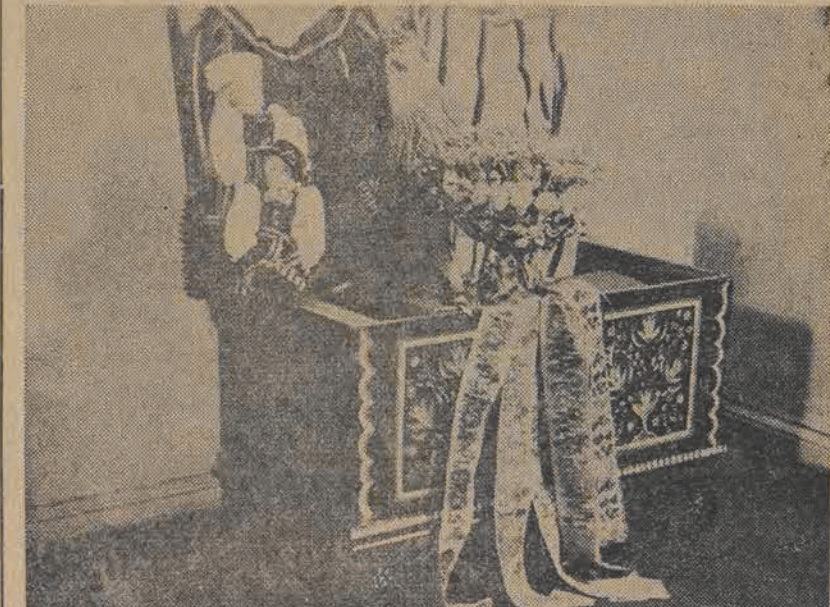
Dar robotników i pracowników gminy Bielawa pow. łowicki — malowana skrzynia pełna regionalnych strojów łowickich. —