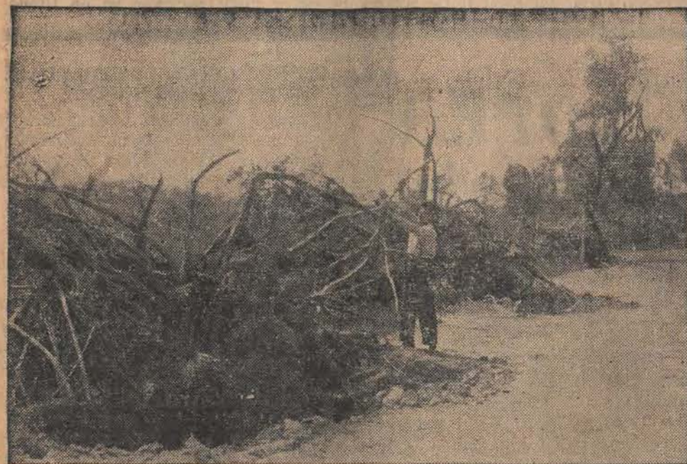
Zniszczone doszczętnie topole wzdłuż szosy we wsi Laski.

Na szczęście obyło się bez ofiar w ludziach, szkody materialne jednak są bardzo poważne, nie mówiąc już o zniszczeniu na długie lata pięknego zadrzewienia. Wyczekiwane z utęsknieniem upalne