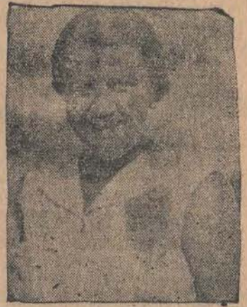
Znakomita nasza tenisistka Jadwiga Jedrejewska po raz czwarty z rzędu zdobyła tytuł mistrzyni Londynu.

Redakcja: ul. Zwirki Nr. 2. — Administracja: ul. Piotrkowska Nr. 11. Ekspedycja: ul. Piotrkowska Nr. 11. Telefony: Redakcji Nr. 102-28 i 138-28. Administracji Nr. 182-48. Skrzynka pocztowa Nr. 132. Redakcja otwarta dla interesantów tylko od godz. 2 do 5-ej po poł. Redaktor lub jego zastępca przyjmuje od g. 4 do 5 po poł. — Administracja czynna — od g. 9 rano do g. 21 bez przerwy. — Wydział Ogłoszeń tel. 182-48. Filia ul. Piotrkowska 11, tel. 102-29 Wydział Prenumeraty tel. 182-48. Opłata pocztowa uiszczona gotówką.