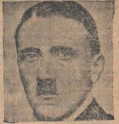
BERLIN, 27.6 — kandydat Hitler w głosni w Bremie 1 lipca podczas spuśczenia na wodę nowego krążownika przemówienie polityczne.