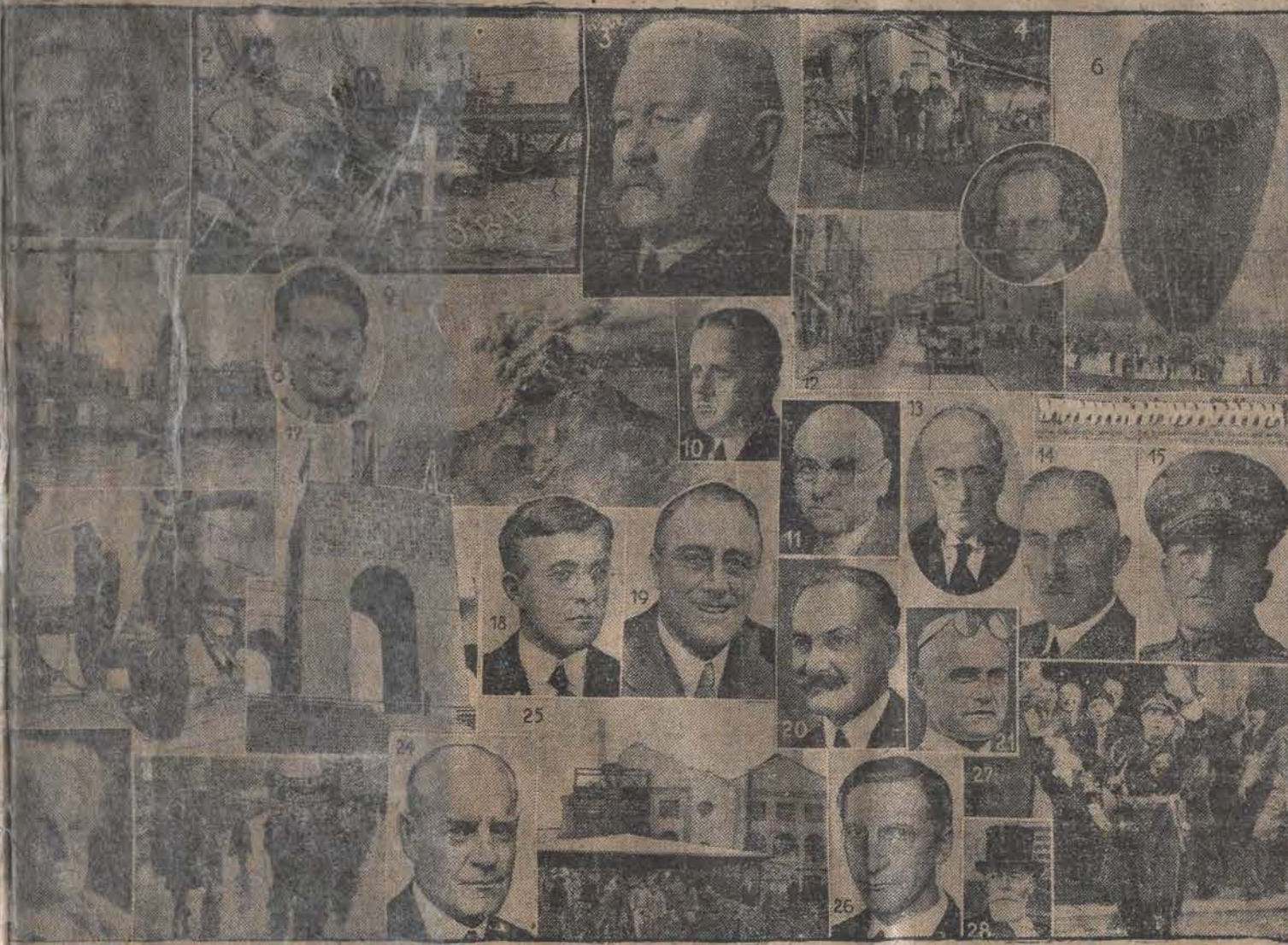
1. Władca świata obchodzi 100-letnie śmiertelną, jednego z najsłynniejszych poetów ludzkości. 2. Wrak (szkatki kadłuba) łodzi podwodnej „Niebia” która w lipcu zatoniła z 59 załogą. 3. Hindenburg 10 kwietnia został po raz drugi prezydentem Rzeszy. 4. Zgon strasznie trzęsienia ziemi 12 dni w Grecji. 5. Prof. Piccard na spekulowanym balonie (6) wzniósł się do słońca. 7. Poszukiwania na miejscu katastrofy angielskiej wódki podwodnej, w której zginęło 55 ludzi załogi. 8. Leczenie przelatał ponad pustyniami Australii. 9. Wybuch obrabianego walkami w latach w Ameryce Południowej. 10. Nominacja dr. Brachta kom. szarzem Rzeszy w Prusach spowodowała doniosły konflikt ustrojowy w Niemczech; kabinety pruski Brauna (11) złożył skargę do trybunału stanu w Lipsku. 12. Krwawa wojna japońsko-chińska w Szanghaju. 13. W małej dymisji rządu Brueninga w Niemczech wprowadza do władzy skrajną prawicę. 14. Papen, następca Brueninga. 15. Schleicher — następca Papena. 16. Grouan dokonał lotu dookoła świata. 17. Wejście na stadion Olimpiady w Los Angeles. 18. Dr. Langmuir z Ameryki otrzymał nagrodę Nobla w dziedzinie chemii. 19. Roosevel, obrany prezydentem St. Zjedn. 20. Lohran objął prezydenturę we Francji po zamordowanym prez. Doumerze. 21. Heroiczny nasz lotnik Fr. Zwirko, zdobywa Challenge Europy i wkrótce ginie wraz z żoną Wigura w tragicznej katastrofie. 22. Gerhardt Hauptmann, wielki dramaturg niemiecki, obchodzi 70-letnie urodziny. 23. Marsz głodu bezrobotnych w Londynie. 24. John Galsworthy, wielki pisarz angielski otrzymał nagrodę Nobla. 25. Wybuch trujących gazów w fabryce pod Rathenow (Prusy Wsch.) zdradził tajemnie przygotowania wojenne w Niemczech. 26. De Valera obrany prezydentem Irlandji. 27. Wyczerpiecie do autu śmiertelnie rannego przez Gorgulowa prezydenta Francji, Doumera.