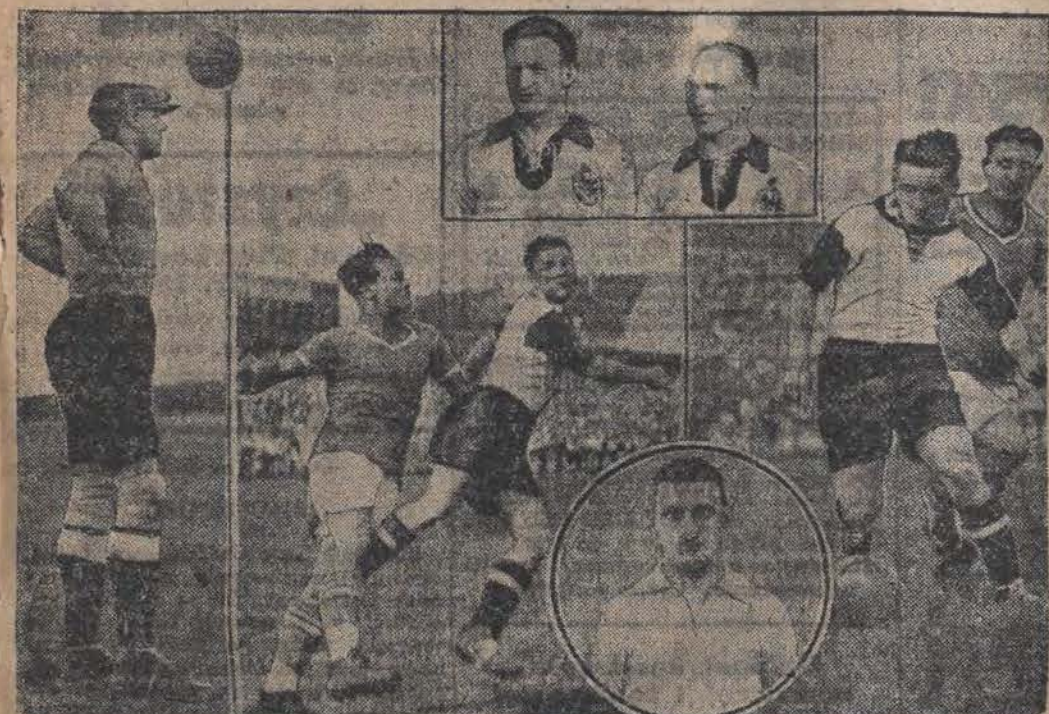
Drużyna niemiecka, która w ubiegłą niedzielę przegrała w Bolonii mecz piłkarski z Włochami w stosunku 1 do 3.

da się po większej części z zawodników IKP. Głośna ta i przewlekła sprawa na tem się jednak nie skończy, gdyż IKP. po zebraniu jeszcze niektórych dowodów, zwróci się z prośbą o interwencję i wydanie odpowiedniej decyzji do najwyższej instancji, a mianowicie do Związku Związków. Według dotychczasowych statutów Z. Z. nie jest władzą dla Związków i towarzystw sportowych, wobec czego protest IKP nie ma szans powodzenia.