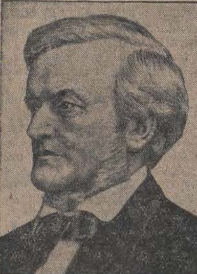
RYSZARD WAGNER genjalny reformator twórczości muzycznej. W tym roku przypada 50-letnie jego zgonu.