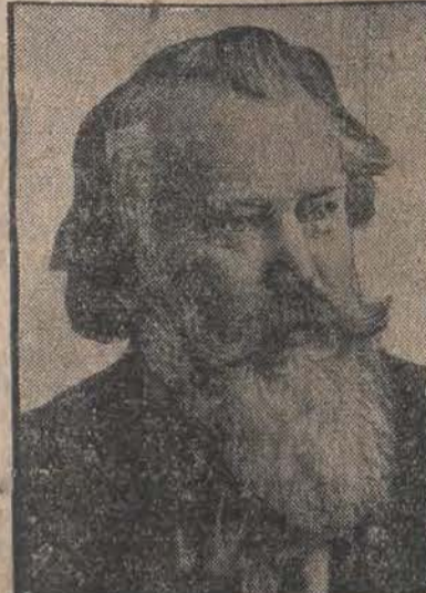
JAN BRAHMS wybitny kompozytor, 100-letnie urodziny którego przypada w maju tego roku.