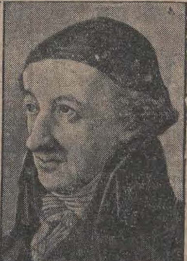
MARCIN WIELAND klasyczny poeta niemiecki — w tym roku Niemcy obchodzą będą 200-letnie jego urodziny.