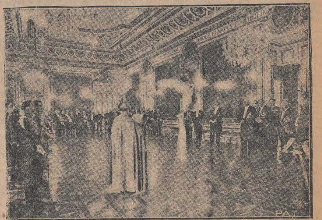
Zgodnie z przyjętym zwyczajem Pan Prezydent R. P. przyjmował na Zamku życzenia z okazji Nowego Roku. Na zdjęciu naszym widzimy Pana Prezydenta w otoczeniu członków domu wojskowego i cywilnego, słuchającego przemówienia, wygłaszanego w imieniu korpusu dyplomatycznego przez Nuncjusza Apostolskiego.