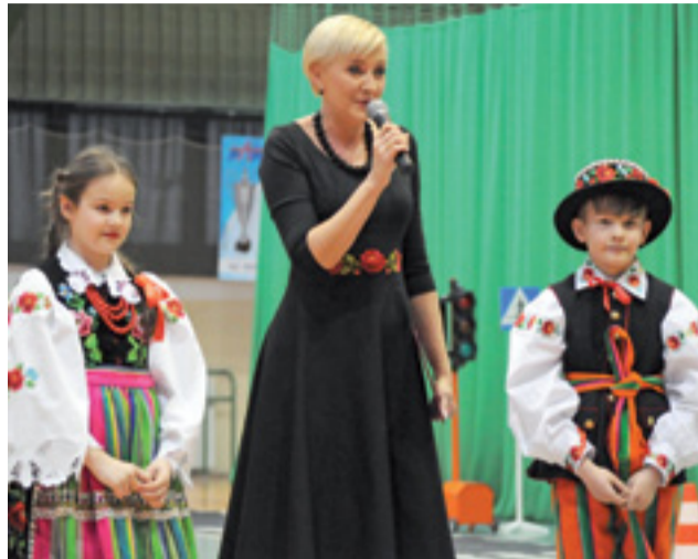
Elementów łowickich nigdy za mało. Prezydentowa też miała je na sukience.

Nagrody będą do odebrania w salonie Recman w Łowiczu na ul. Zduńskiej 55 w dniu urodzin, czyli we wtorek 28 lutego. red