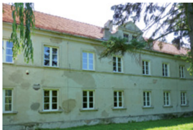
Zlicytowany budynek, w którym jeszcze kilka lat temu mieścił się Zespół Szkół Ponadgimnazjalnych nr 3 w letniej scenarii (na zdjęciu) prezentuje się okazale niż w obecnej porze roku.