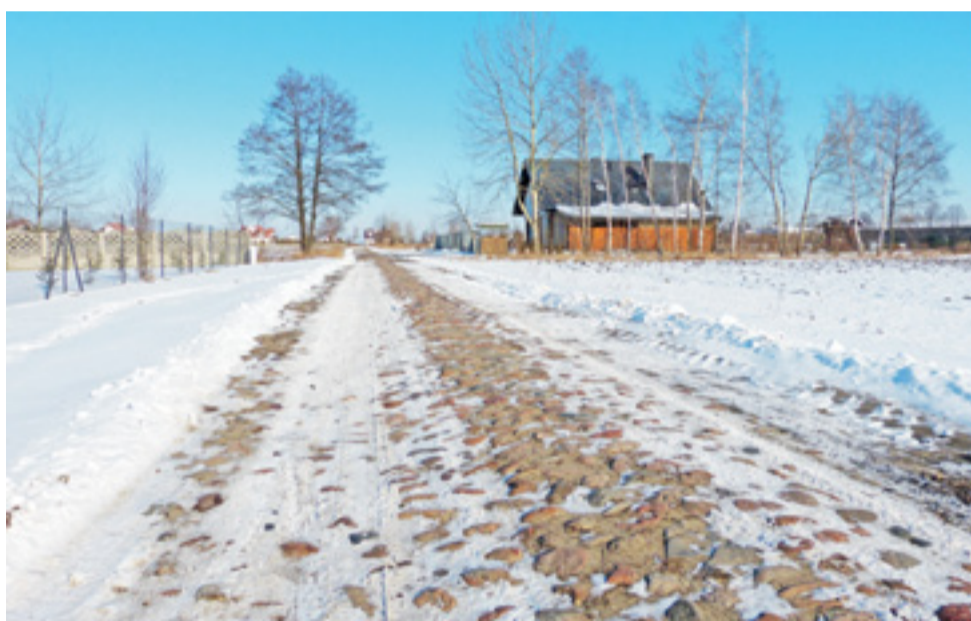
To właśnie ten odcinek ul. Płockiej, tzw. brukowanka, miałby odciążać ruch ciężarówek ulicą Armii Krajowej.

– Dopiero rozpoczęliśmy wydawanie wniosków na przyznanie bonów, zainteresowanie jest średnie. Bony wydawane są w trybie ciągłym, do kiedy są pieniądze na tę formę pomocy, nie ma daty granicznej – powiedziano nam w PUP. Biorąc pod uwagę doświadczenia z poprzednich lat, im szybciej bezrobotni, którzy mają perspektywę na zatrudnienie, złożą stosowne wnioski, tym lepiej. ■