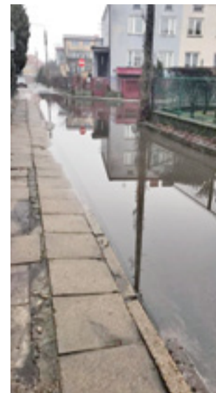
Ulica Słowackiego po niedużych opadach deszczu.

Do tematu wracamy, ponieważ poziom zarywania mieszkańców znacznie wzrósł wraz z roztopami i opadami deszczu sprzed kilku dni. Jeden z mieszkańców przysłał