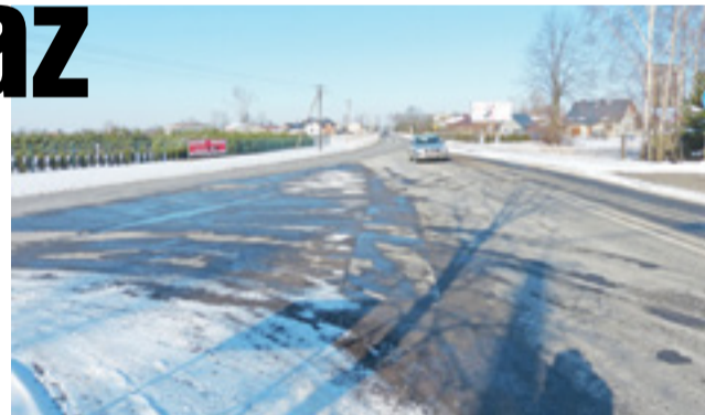
Na tym skrzyżowaniu ulicy Płockiej z Kiernozką i drogą wojewódzka nr 584 będzie trzeba pobudować rondo. Inwestycja może być więc droga.

– Inne zadania inwestycyjne zaangażowały nas teraz technicznie i finansowo, ale ten pomysł nie został wyrzucony do kosza – w odpowiedzi na pytanie o tzw. brukowankę mówi Grzegorz Pełka, naczelnik Wydziału Inwestycji i Remontów w Urzędzie Miejskim w Łowiczu. Głównym powodem nie umieszczenia tej inwestycji w kolejnych kilku budżetach miasta są spodziewane jej wysokie koszty, które mogą przekroczyć 3 mln zł.