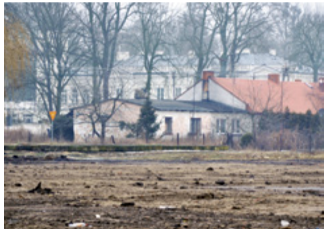
Charakterystyczny dla miast rynek ma szansę powstać w przyszłości na pustym obecnie placu po zburzonym budynku komunalnym. W tle, za drzewami, widać pałac w Sannikach.

Możliwy będzie dostęp do pieniędzy unijnych, rozpisywanych wyłącznie dla ośrodków miejskich.