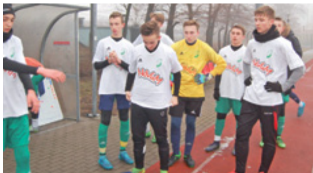
Pelikan 2001 zremisował w Łowiczu z AKS SMS Łódź 2:2.

Przed zespołem Pelikana w sobotę 25 lutego kolejny sprawdzian.