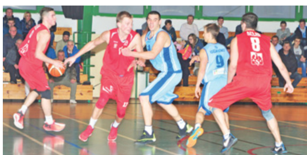
W sobotę Syntex jedzie na rewanżowy mecz derby. W Łowiczu nasi koszykarze wygrali 81:74.