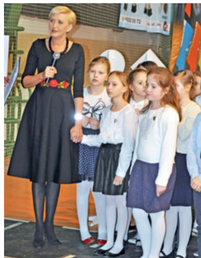
Agata Kornhauser-Duda miała doskonały kontakt z dziećmi. Tutaj – na placu „miasteczka ruchu drogowego”.