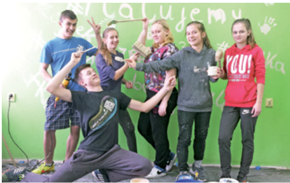
Dobra zabawa towarzyszyła młodzieży z Łaguzzewa podczas malowania klasy.

Nie oznacza to, że była to dla nich tylko i wyłącznie praca, bo czas ten obfitował w śmiech, żarty i dobrą zabawę. Czasami po skończonej pracy gimnazja-