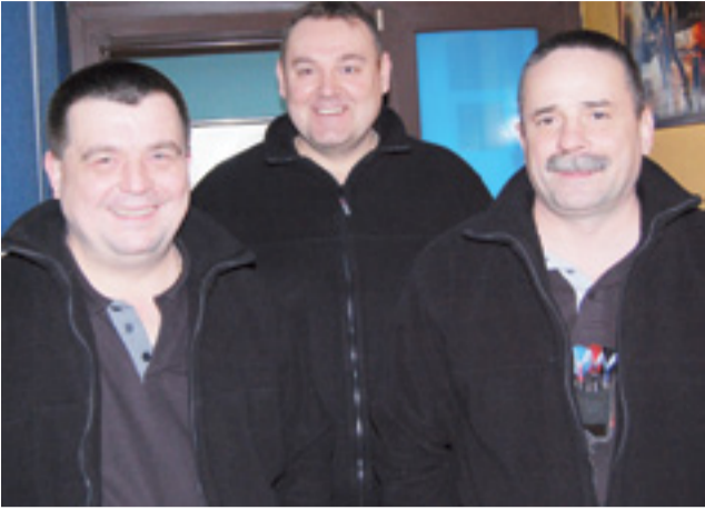
Trzech spośród czterech łowiczanie, którzy zmierzili się z liderem I ligi ŁSD.