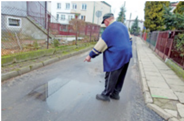
– Tutaj była studzienka, został ślad na asfalcie – pokazuje jeden z mieszkańców.

Temat tych prac wykonanych przez ekipę Zakładu Usług Komunalnych w grudniu ubiegłego roku, poruszaliśmy już w poprzednim numerze Nowego Łowiczana. Głównie w kontekście tego, że roboty zostały rozpoczęte, wykonano ich część, dokończone mają zostać natomiast dopiero za jakiś czas – według naczelnika Wydziału Inwestycji i Remontów Łowickiego Urzędu Miejskiego w połowie roku. Naczelnik uspokajał, że w budżecie obywatelskim jest zapisane na ten cel 100