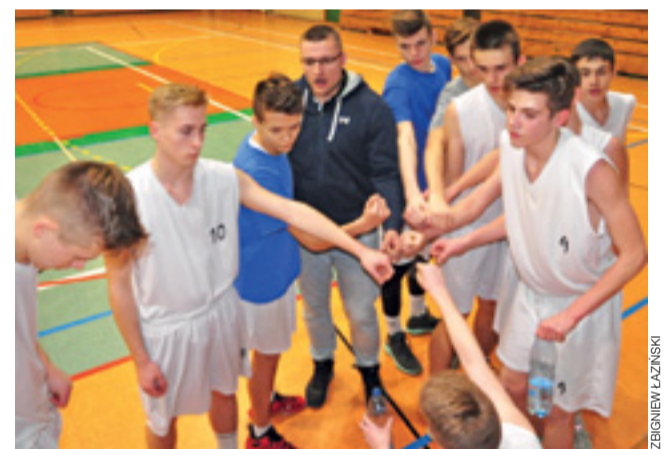
Kadeci Książaka sprawili ogromną niespodziankę i pokonali w Łodzi lidera ŁKS.

Po tej wygranej nasz team nadal liderem grupy finałowej, zatem jest ogromna szansa na awans do rozgrywek centralnych (wychodzą dalej dwa zespoły). Teraz czas na wygraną z ekipą z Kutna w piątek.