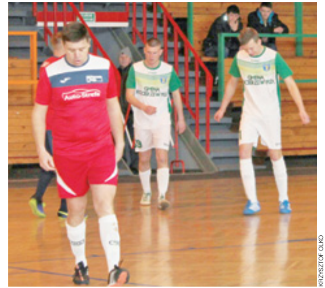
FC Jeziorko (białe stroje) wygrało w ostatniej kolejce z Załogą 3:1.