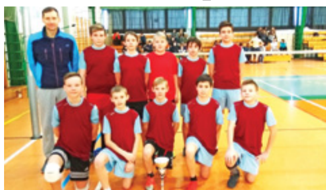
Siatkarze z SP 2 Łowicz wygrali zawody powiatowe.