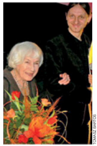
19 lutego w Warszawie w wieku 102 lat zmarła aktorka Danuta Szafliarska.

Warto pamiętać, że 10 lutego 2008 roku, była ona gościem Och Film Festiwalu. Odpowiadała wtedy na pytania publiczności, po seansie filmu pt. „Pora umierać”, w którym zagrała główną rolę. Na zakończenie otrzymała od organizatorów duży bukiet kwiatów. Na zdjęciu wspólnie z łowiczanie Adamem Heinca, który wówczas prowadził to spotkanie. tb