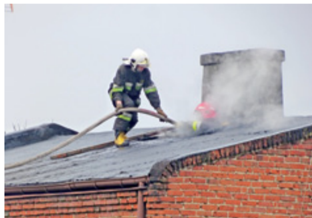
Strażacy na dachu palącego się budynku. Udało się ugasić pożar nim zdążył rozszerzyć się na cały dom i poddasze.

Przeszło 80-letnia mieszkanka domu nie doznała obrażeń bezpośrednio z powodu pożaru, ale ponieważ źle się czuła, wymagała pomocy medycznej. Wspierali ją też sąsiedzi oraz członkowie rodziny, którzy szybko pojawili się na miejscu. W ZRM podjęto decyzję o zabraniu jej do szpitala w Łowiczu. tm