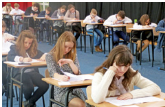
Finałiści konkursu 21 lutego rozwiązują arkusze finałowe. Warto było się postarać, bo nagrody w konkursie są atrakcyjne.

Temat konkursu brzmiał w tym roku: „Siostra, brat, przyjaciele – razem mogą zdziałać