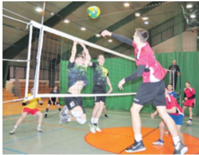
UKS Korabka stracił szansę na mistrza.