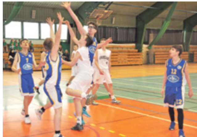
Drugi zespół kadetów Książaka zagrał nieźły mecz z ekipą z Kutna.

Książacy do przerwy nie spisywali się najlepiej, nie wierząc w możliwość podjęcia równej walki. Po dwóch kwartach nasz team przegrywał 16:41. Dużo lepiej było po zmianie stron. Mecz był wyrówn-