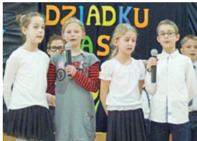
Uczniowie szkoły w Popowie zaprezentowali program artystyczny, dedykowany seniorom.