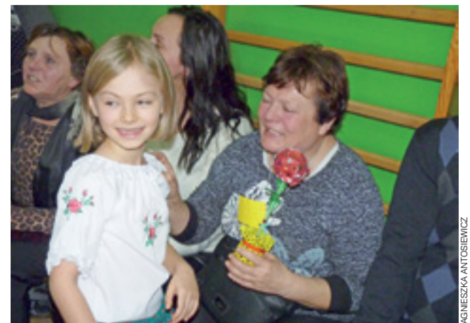
Dzień Babci i Dziadka to radość nie tylko przyjmowania prezentów, ale jak widać na zdjęciu – też wielka radość z ich wręczania.