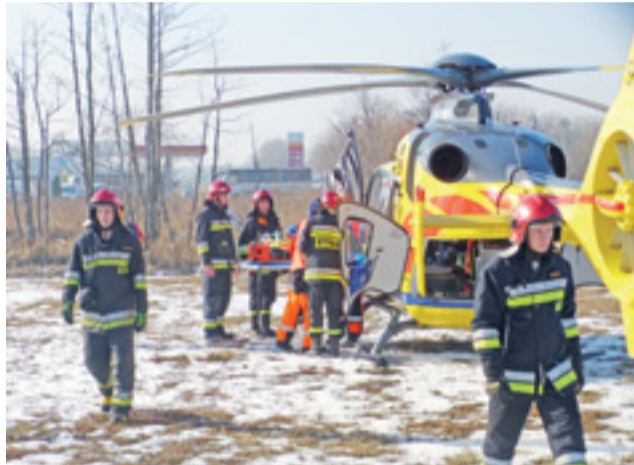
„Ratownik 16” zabrał ranną kobietę z miejsca wypadku. Strażacy przygotowali i zabezpieczyli lądowisko.

Osobowym BMW podróżowała tylko kierująca - 34-letnia mieszkanka Sochaczewa. Jechała od strony Łęczycy w kierunku centrum Łowicza. Prowadzenie nad kierownicą straciła na prostej drodze, tuż za stacją benzynową. Asfalt nie jest w tym miejscu idealnie równy, co w połączeniu z nie najlepszymi warunkami drogowymi i nadmierną prędkością mogło