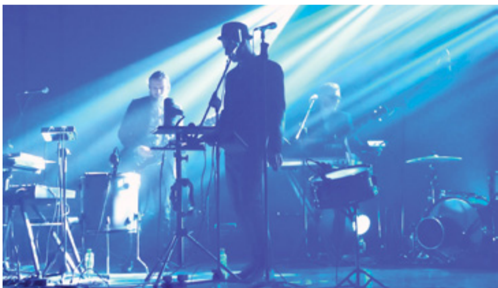
Dwugodzinny koncert Fisz Emade Tworzywo był połączeniem muzyki i światła.