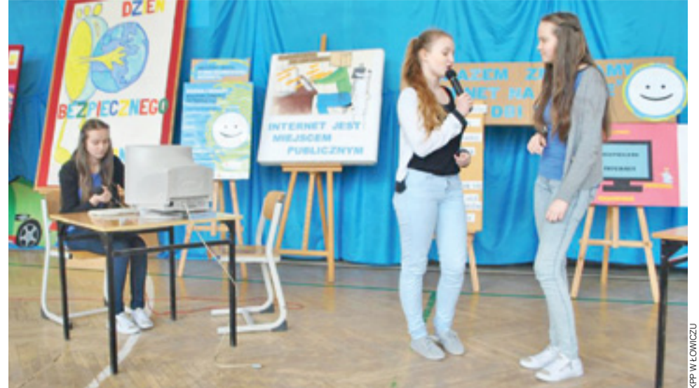
Młodzież z Gimnazjum w Nowych Zdunach temat bezpieczeństwa w sieci pokazała w swoim przedstawieniu.