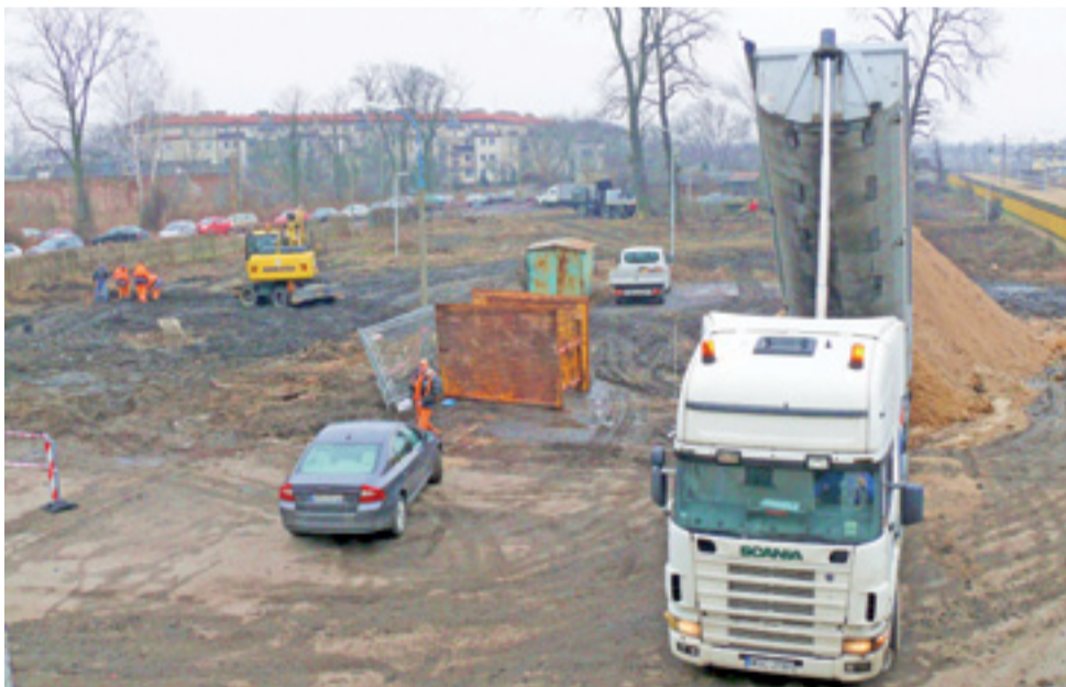
Tak wygląda plac budowy parkingu, widziany z okien dworca Łowicz Główny. Będzie on miał powierzchnię ponad 4 tys. m 2 , a stanie na nim 178 samochodów.

Czy jednak w takim razie na parking, w wykopie obok przewodów energetycznych, którymi zasilane będą latarnie, nie należałoby teraz ułożyć także światłowodu pod monitoring? Zapytany przez nas o to naczelnik odparł, że nie widzi takiej możliwości. Potrzebny byłby projekt realizacyj-