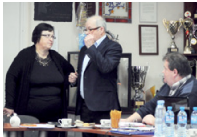
Co Sanniki zyskałyby na tej zmianie? – radni dyskutowali na ten temat już na 2 sesjach.