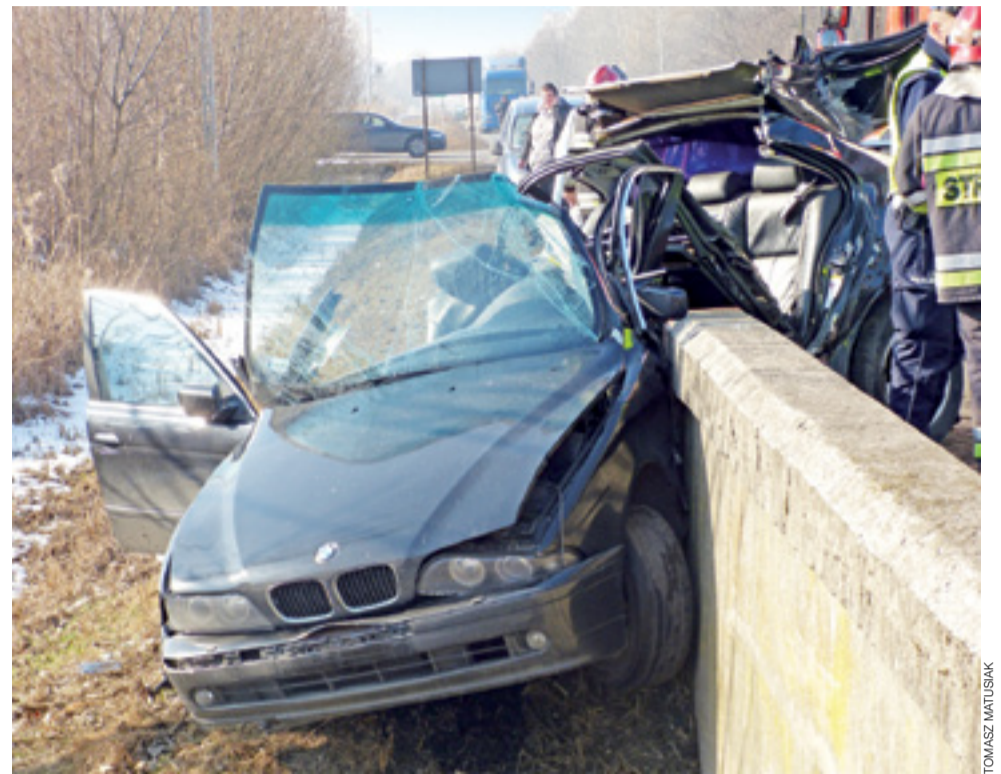
BMW niefortunnie uderzyło w barierę mostu akurat od strony siedzenia kierowcy.

Była ona nieprzytomna, z poważnymi obrażeniami, ale - co najważniejsze - żyła. Na pomoc wezwano śmigłowiec LPR „Ratownik 16”, którym ranna kobieta została przetransportowana do szpitala specjalistycznego w Ło-