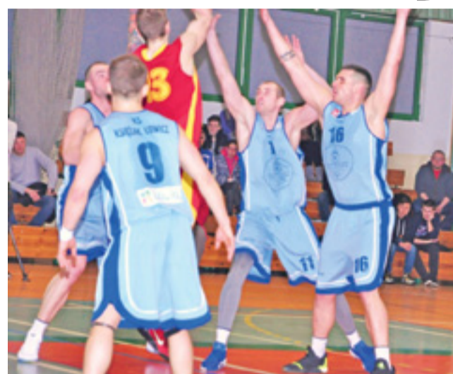
W obronie Syntex-Książaka było nie najgorzej, ale zabrakło skuteczności w ataku.