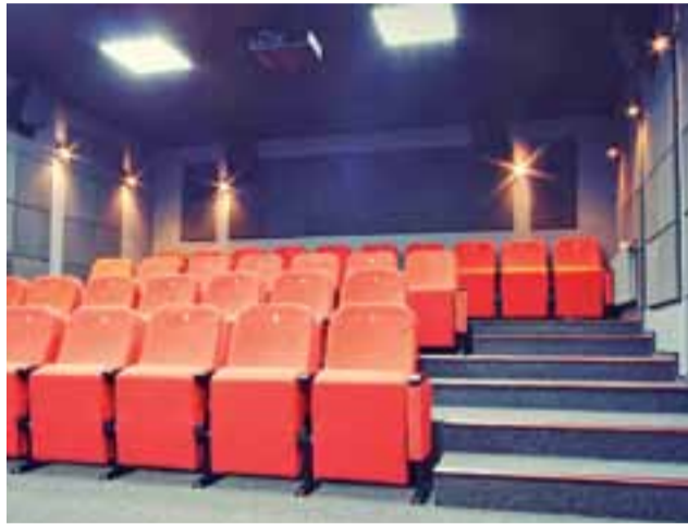
Kameralna sala kinowa w Kostrzynie nad Odrą. To przykład rozwiązania, które ma być zastosowane w Łowiczu.

Łowicz | Klimatyzacja, bilety on-line i dodatkowa, kameralna sala