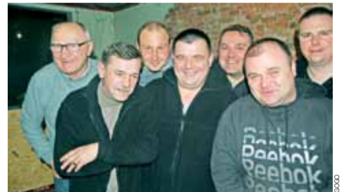
Dobre humory nie opuszczają zawodników darta.