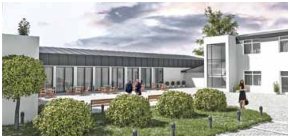
Widok na wizualizację powstających budynków przy ul. Starorzecze z południowo-zachodniego narożnika podwórza Hotelu Eco.

Nowy właściciel od początku, gdy z nim rozmawialiśmy na temat nieruchomości, która ma powierzchnię 2272 m 2 , widział na jej terenie nową zabudowę. Chciał, po wyburzeniu wszystkich budynków na jej terenie: komórek, dwukondygnacyjnych budynków od strony ul. Podrzecznej i budynku wzdłuż wschodniej granicy działki, wybudować na niej dwa budynki, w których znalazłoby się 30 mieszkań. W 2014 roku, czyli krótko