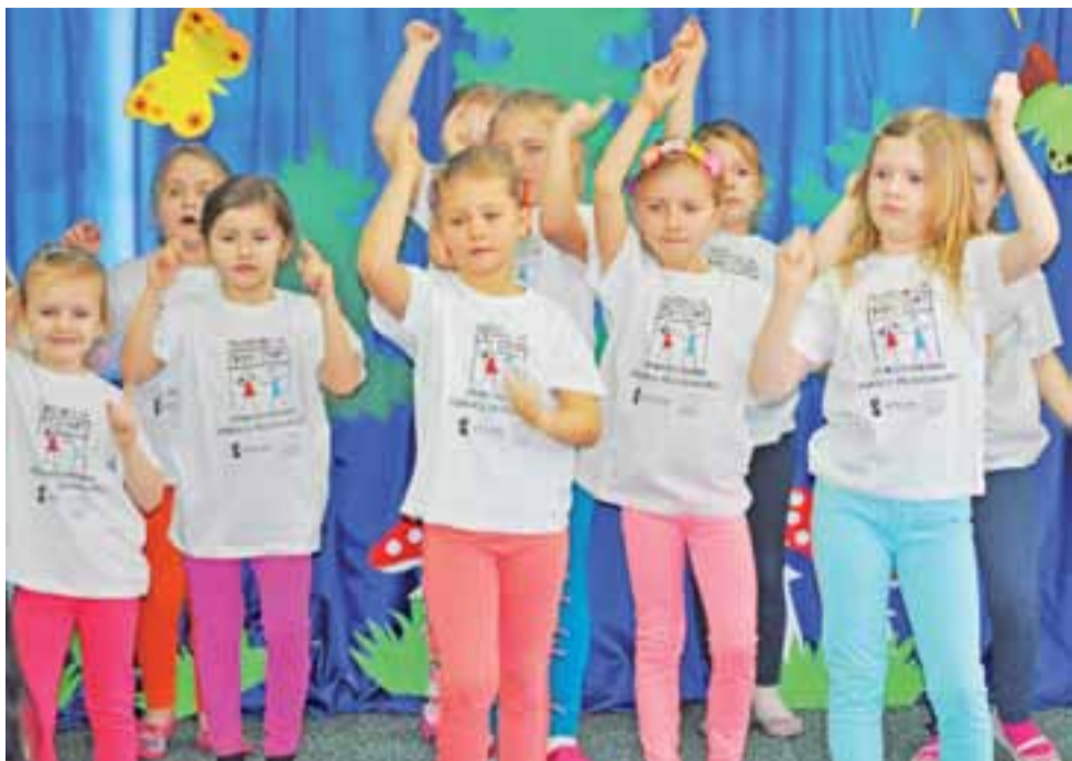
Tęczowe przedszkolaki tańcem zachęcały do zapisywania się do „ich” przedszkola.