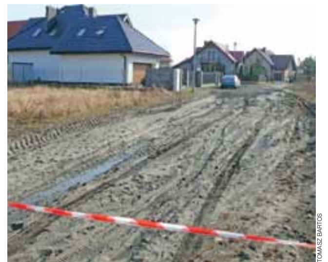
Fragment ul. Szafirowej, przed skrzyżowaniem z ul. Bursztynową, po ostatnich roztopach i deszczach stał się nieprzejezdny. Nawierzchnia z kostki rozwiązałaby ten problem w przyszłości.

W planach jest dokończenie nawierzchni na ul. Szafirowej na długości ok. 200 m wraz z sięgaczami w inne ulice oraz wykonanie 120 m nawierzchni na ul. Topazowej, pomiędzy skrzyżowaniami z ul. Szafirową a Tuszewską. Roboty rozpoczną się w najbliższym czasie, gdy tylko zakład rozstrzygnie przetargi na dostawę materiałów potrzebnych do wykonania prac. Nawierzchnia ma szansę być zrealizowana przed wakacjami. tb