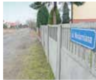
Ulica Niciarniana i położona obok niej ulicy Polna do końca lipca ma mieć nawierzchnię z betonowej kostki.

Decyzja o realizacji inwestycji wiązała się z koniecznością dokonania przesunięć w zaplanowa-