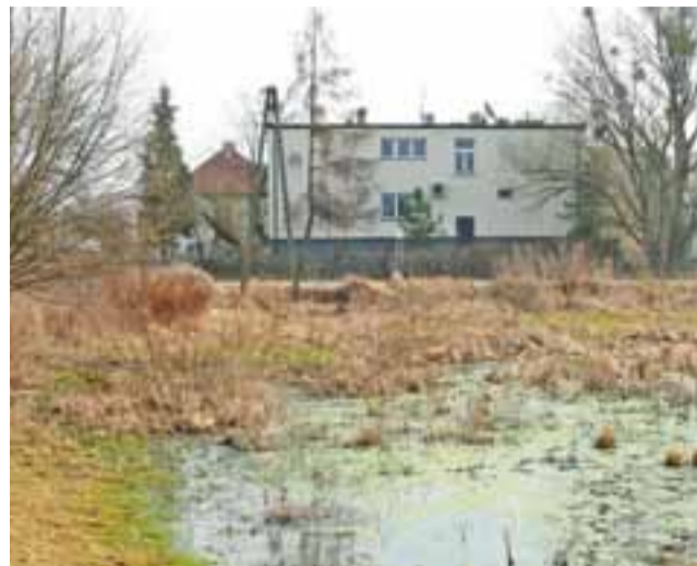
Widok na budynek ośrodka zdrowia z działki, na której planowana jest budowa marketu.

Właściciel nieruchomości nie zgodził się z negatywną odpowiedzią gminy i odwołał się do Samorządowego Kolegium Odwoławczego w Skierniewicach, podnosząc w swoim piśmie fakt, że w przeprowadzonej przez gminę analizie są niespójności. Wynika z niego, że gmina w wykonanej analizie unikała wskazania terenów usługowych w sąsiedztwie planowanej inwestycji. Właściciel podkreślił, że na wykazanych graficznie terenach usługowych, na których znajduje się np.: Urząd Pocztowy, Urząd Gminy, apteka, sklep spożywczo-przemysłowy, zaś w części opisowej tego nie wykazano. Zwrócił też uwagę na bezpośrednie sąsiedztwo ośrodka zdrowia, który znajduje się względem jego działki po drugiej stronie ul. Wodociągowej. Podkreślił, iż ma wjazd nie tylko od strony ul. Łowickiej, ale także od strony ul. Wodociągowej. SKO w grudniu 2016 uznało zastrzeżenia inwestora, prze-