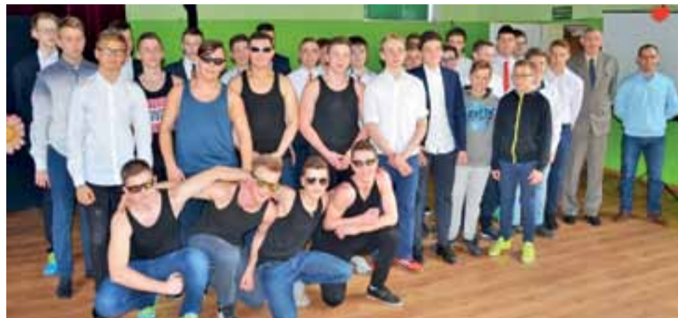
Grupa, która przygotowała szkolny Dzień Kobiet. Dziewczęta były zachwycone niespodzianką.

Bieżących, niezwykle istotnych spraw, wykraczających oczywiście poza lokalne podwórko, jest oczywiście wiele, więc ciąg dalszy uwag i refleksji felietonisty niebawem nastąpi. ■