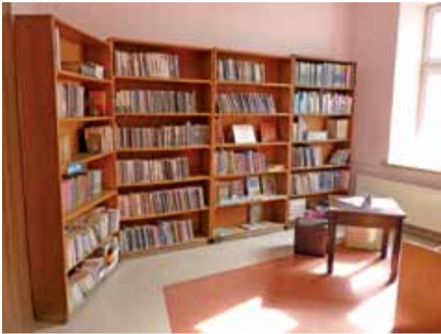
Filia Biblioteki Miejskiej w ŁOK. Zgodnie z planami, po jej przeniesieniu do budynku Gimnazjum nr 1, to tu ma powstać kameralna sala kinowa.