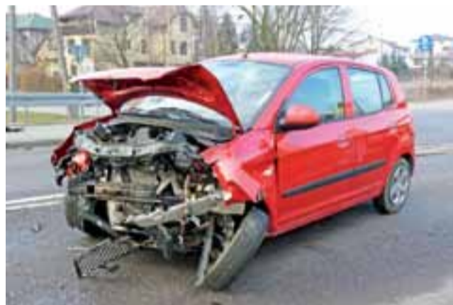
Przód samochodu Kia Picanto został całkowicie zniszczony.