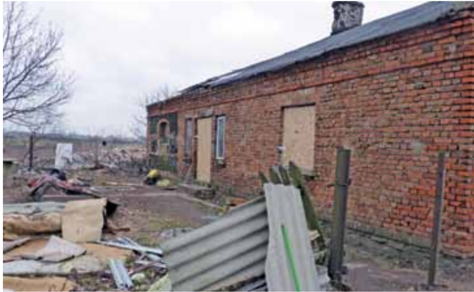
Tak wygląda dom i obejście, w którym doszło do rodzinnej tragedii w Modelu, gmina Pacyna. Brud, bałagan, a za domem widać mnóstwo butelek i popiołu.