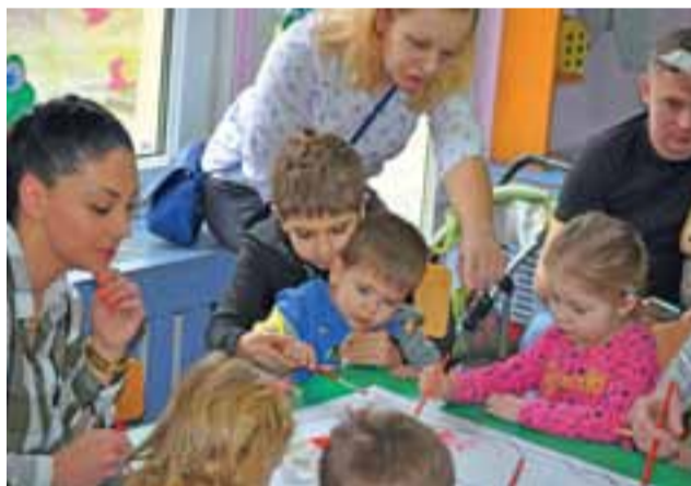
Wspólne malowanie, rysowanie i „poszukiwanie skarbów” było nie lada atrakcją dla najmłodszych.