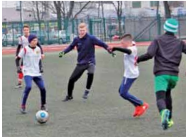
GKS Ksawerów nie poradził sobie z Pelikanem 2003.