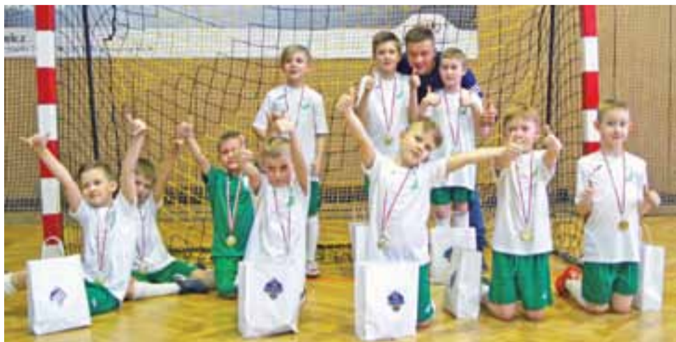
Pelikan 2008 zaprezentował się z dobrej strony.