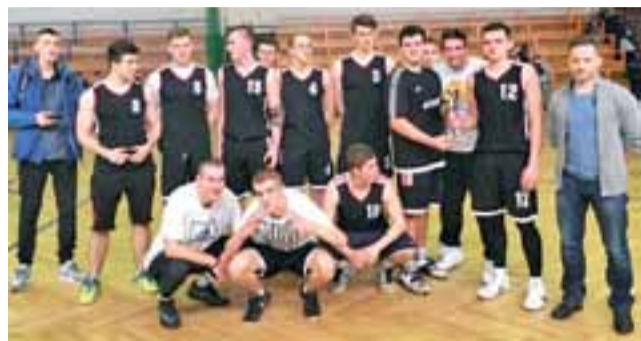
Ekipa koszykarzy z ZSP nr 4 Łowicz wywalczyła mistrzowski tytuł.