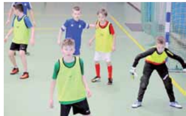
Piłkarze Akademii 2006/07 sprawdzili formę w Skierniewicach.