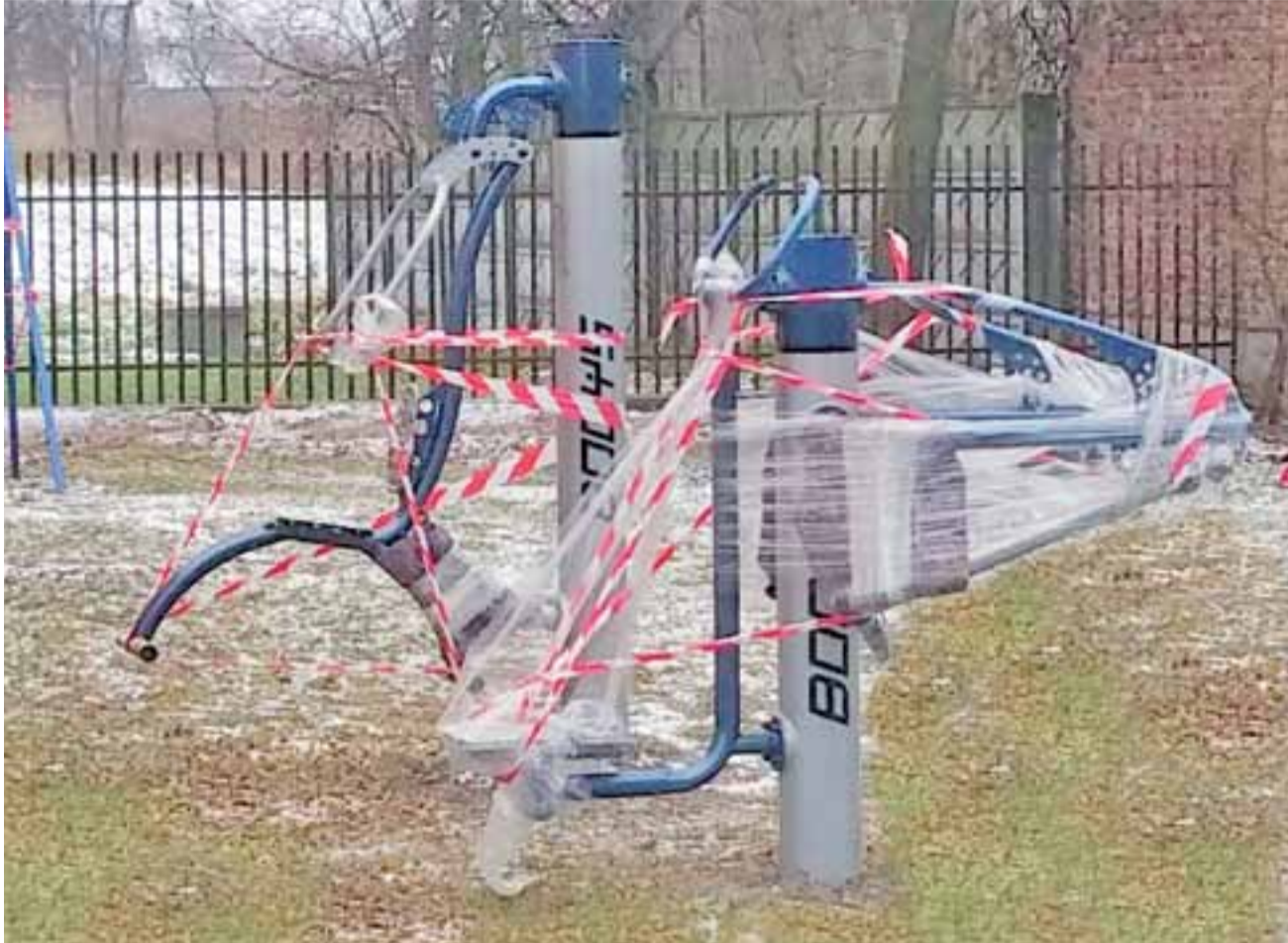
W tym roku z funduszu sołeckiego mają zostać zakupione kolejne urządzenia do siłowni plenerowej, która już w ubiegłym roku zaczęła powstawać przy GOK w Nieborowie (na zdjęciu).

Stachlew za 4,6 tys. zł chce zakupić zabawki na plac zabaw, za 13 tys. z urządzenia typu fitness, za 6 tys. zł wyremontować kuch-