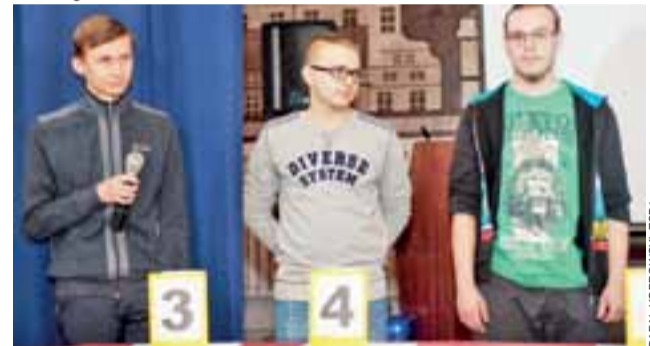
Uczestnicy konkursu odpowiadali na trzy serie pytań: z matematyki, fizyki oraz przedmiotów przyrodniczych.

Po każdej serii pytań oglądali krótkie filmiki, dotyczące motywu przewodniego tegorocznej edycji konkursu, którym były odnawialne źródła energii. Podczas starcia finałowego uczestnicy odpowiadali na pytania dotyczące in-