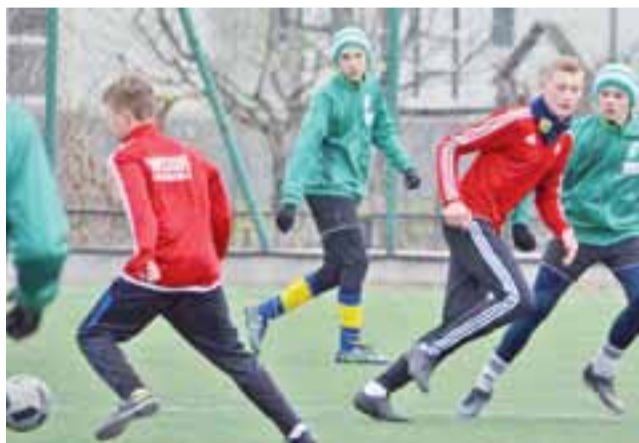
Pelikan 2002 nie przestraszył się Widoku.

Spotkanie z Belchowem było pod naszą całkowitą kontrolą. Można powiedzieć, że był to rozrachunek przed meczem z Ksawerowem rozgrywanym dzień później. Bardzo szybkie pięć goli w 25 minut. Później grali w większym wymiarze zawodnicy, którzy do tej pory mniej wychodzili na boisko. Kolejny mecz z zespołem, który zajął drugie miejsce w I lidze wojewódzkiej był bardzo ciężki. Wygrana, która po raz kolejny wzmacnia nas i powoduje, że coraz lepiej funkcjonujemy taktycznie i motorycznie jako zespół. Mecz był rozgrywany w systemie 3x30 minut. W ostatniej tercji było jednak widać, że spotkanie z poprzedniego dnia dało nam się mocno we znaki. Po dwóch tercjach wygrzywamy 5:2, po bardzo dobrej grze całego zespołu, zarówno w defensywie, jak i ofensywie. W trzeciej tercji opadliśmy z sił, ale mimo problemów udało się strzelić jeszcze jedną bramkę i odnieść tym