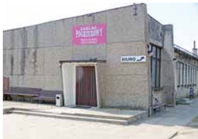
Powiat podjął decyzję o sprzedaży budynku przy ul. Ułańskiej ze względu na remonty, które trzeba w nim przeprowadzić.

Jak się dowiedzieliśmy w starostwie, zanim wynik przetargu uprawomocni się, musi minąć 7 dni na ewentualne zaskarżenie czynności przetargowych, potem przez 7 dni informacja o wyniku musi być wywieszona do publicznej wiadomości. Dopiero później ustalone zostanie kie-