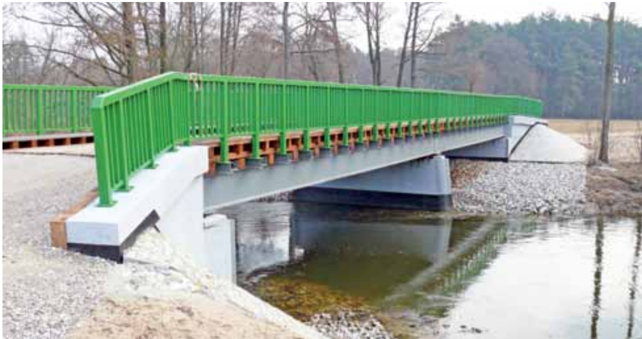
Po gruntownej przebudowie most w Sokółce prezentuje się okazale.