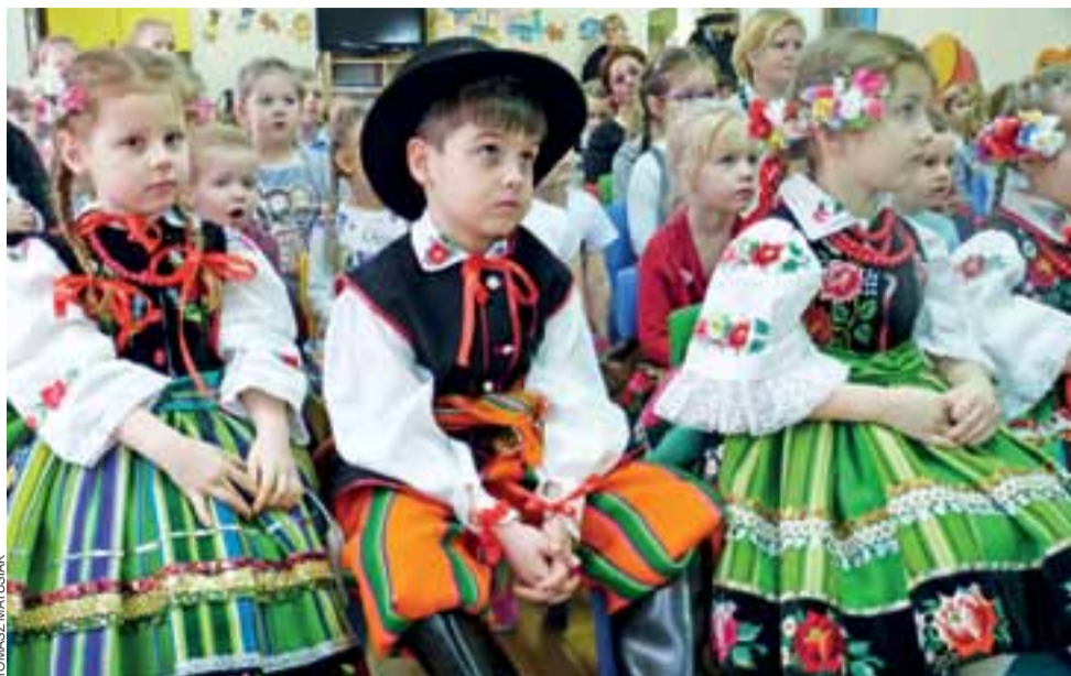
Podczas Dnia Książaka znaczna część przedszkolaków zaprezentowała się w strojach ludowych.