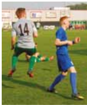
Jeżeli Ursus Warszawa nie zmieni swojej gry, to być może niedługo będzie musiał grać w IV lidze.