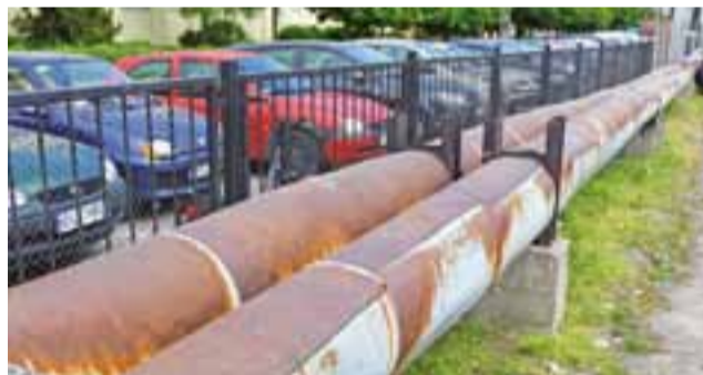
Stary ciepłociąg wkrótce zniknie z terenu targowiska miejskiego.

Dlaczego więc będą przerwy w dostawie ciepłej wody w kierunku Bratkowice? Otóż, żeby przeprowadzić remont sieci trze-