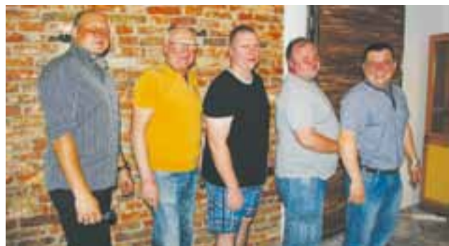
Zdecydowany „pociąg” do darta mieli uczestnicy 33. turnieju OML.