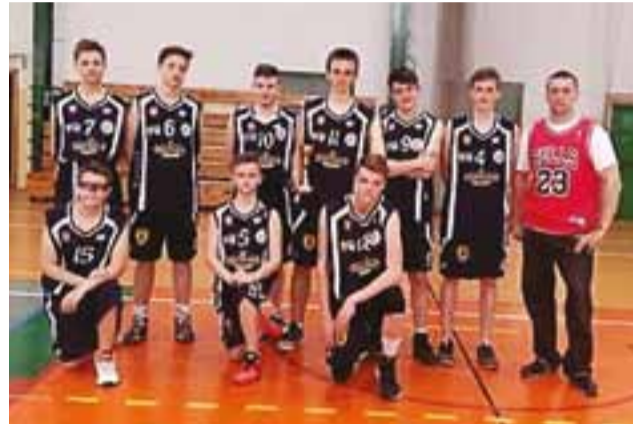
Kadeci UMKS Księżak zakończyli turniej na IV miejscu.

W sezonie 2017/2018 łowiczanie zagrają w gronie kadetów w roczniku dominującym. W minionym sezonie jako rocznik młodszy przegrali wszystkie pojedynki. Na jesieni będzie na pewno dużo lepiej. Na medal