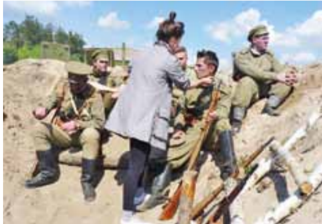
Charakteryzacja na planie. Jednym ze skutków działania chloru było czernienie twarzy, dlatego makijażystki musiały malować twarze odtwórców ról ruskich żołnierzy właśnie na czarno.

pod belgijskim Ypres, jednak na znacznie mniejszą skalę niż pod Bolimowem. Powstał tu nawet specjalny 36. pułk gazowy (równoległe do 35. w Belgii), odpowiedzialny za przeprowadzenie ataków gazowych.