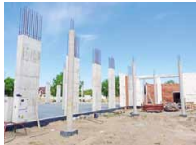
Trwają prace na budowie. Po lewej stronie powstaje duża sala weselna, która będzie mogła ugościć nawet 400 osób.

– Mamy teraz dwie sale, a „Eden” (1999 rok) był pierwszą prywatną salą w Łowiczu. Uznaliśmy, że rynek może przyjąć jeszcze jedną – mówi. Inwestor zapytany, o to czy sądzi, że biznes weselny przeżywa swój rozkwit, odpowiada: – Myślę, że zapotrzebowanie na takie usługi jest duże – mówi. – Teraz klient jest coraz