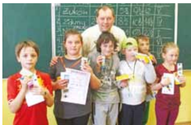
Zwycięska ekipa żółtodziobów UKS „Pałac” Nieborów.

Ostatecznie po 5-rundowej rywalizacji na pierwszym miejscu zameldowała się znów drużyna z Nieborowa, która zwyciężyła we wszystkich swoich meczach. W całym cyklu rozgry-