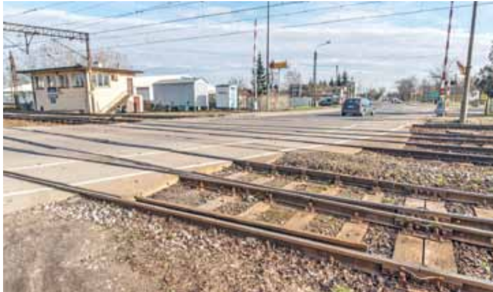
Jaki jest stan torowiska i rozjazdów w bezpośrednim sąsiedztwie przejazdu kolejowego na 3 Maja widać gołym okiem. Większość podkładów jest jeszcze drewniana.

Integralną częścią inwestycji jest budowa wiaduktu, który zastąpi przejazd w ciągu ul. 3 Maja w Łowiczu. Przygotowania i przebudowa infrastruktury kolejowej, która będzie prelude do budowy samego obiektu wiaduktu, rozpoczną się również w drugiej połowie czerwca. Kiedy wiadukt ma szansę zostać otwarty? Wiele