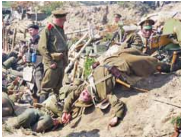
Przygotowania do nakręcenia sceny, w której Niemcy wchodzą do okopów i widzą zagazowanych Roskich. Niektórzy z nich konają w konwulsjach.

W swoim filmie twórcy pragną wyeksponować też wątek, iż po obu frontach bitwy walczyli i ginęli Polacy. – Polscy żołnierze walczyli przeciwko sobie w obcych armiach dwóch mocarstw: