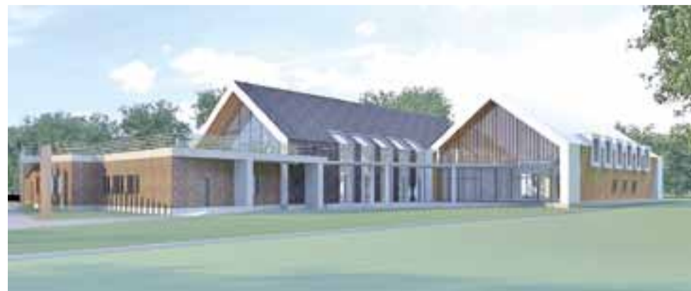
Wizualizacja nowego domu weselnego w Strzelce, który będzie nosił nazwę „Mediolan”.