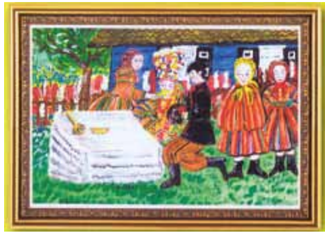
Pożegnanie przed odjazdem do ślubu – jedna z ilustracji autorstwa Ewy Tomczak zamieszczona w publikacji.