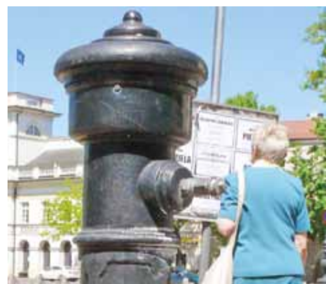
Zród uliczny na Starym Rynku, jeszcze na początku tego tygodnia był pozbawiony zaworu.