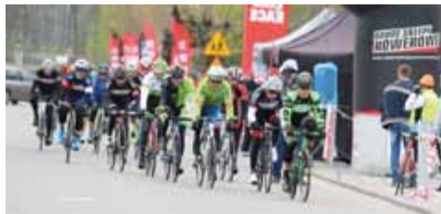
Organizatorzy, mimo pewnych trudności, chcą aby Rally Łyszkowice odbywało się co roku.

Największym problemem było znalezienie źródła finansowania oraz miejsca na rozstawienie głównej bazy zawodów, z miejscami na zaparkowanie. Naturalnym