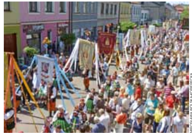
Boże Ciało 2015. Procesja z chorągwiemi na ul. Zduńskiej. Ciasnota dokuczala tam szczególnie. W tym roku procesja już Zduńską nie przejdzie.

Warto jednak podkreślić jest to, że nowa trasa spowoduje szereg ograniczeń, które wpłyną tego dnia na komunikację. Przede wszystkim, zamknięciu ulegnie wjazd do centrum Łowicza od strony ul. Klickiego oraz od ul. 3 Maja, a to oznacza, że kierowcy jadący od Skierniewic, a szczególnie turyści, którzy przyjadą od zjazdu