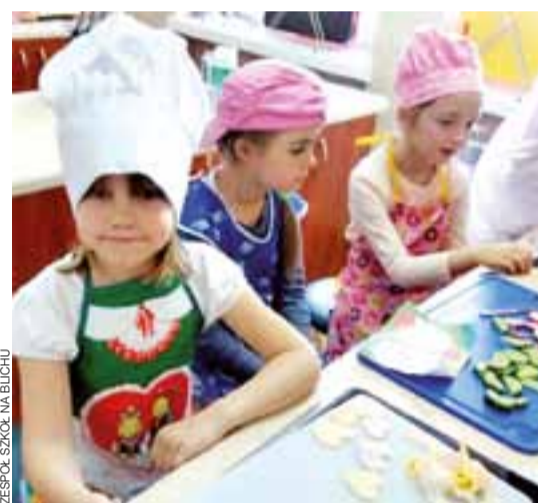
ZESPÓŁ SZKÓŁ NA Blichu

RZUT OKIEM | DLA DZIECI O ROLI WITAMIN W ŻYWIENIU