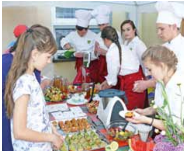
W czasie pikniku towarzyszącemu Dniu Rodziny w Nieborowie dużym powodzeniem cieszyło się stoisko ze zdrową żywnością, które przygotowali uczniowie szkoły blichowskiej.

Po zakończonych występach w sali gimnastycznej wszyscy przeszli na zewnątrz, gdzie czekało wiele atrakcji, jedną z nich był suto zastawiony zdrową żywnością stół. Przygotowaniem m.in. owsianych ciasteczek ze słonecznikiem, kanapek z soczewicą i groszkiem, sałatek zajęli się uczniowie z I klasy Technikum Żywności i Usług Gastronomicz-