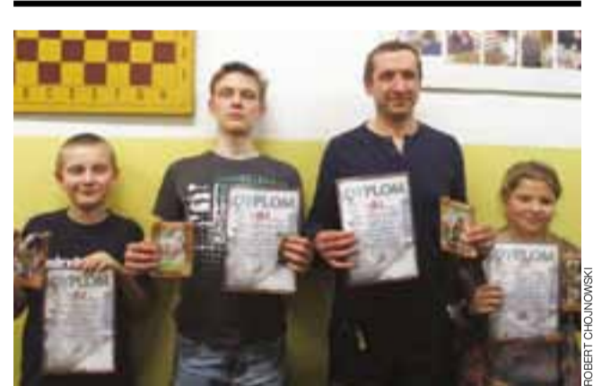
Najlepsi zawodnicy maja w poszczególnych kategoriach

Wiele atrakcji przewidziane jest dla młodych sportowców. Każde dziecko, które z rodzicami przybędzie na te zawody ma szansę sprawdzić się w biegu na wybranym dystansie w swojej kategorii wiekowej. zt