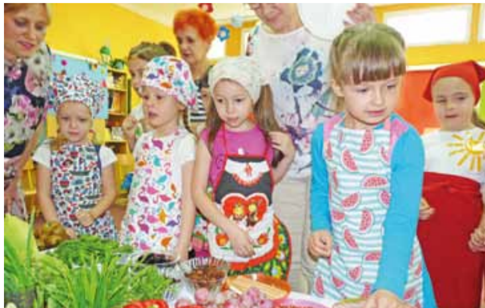
Do przygotowania konkursowych dań przedszkolaki mogły wybierać produkty ze spiżarni „Master Szefa”.