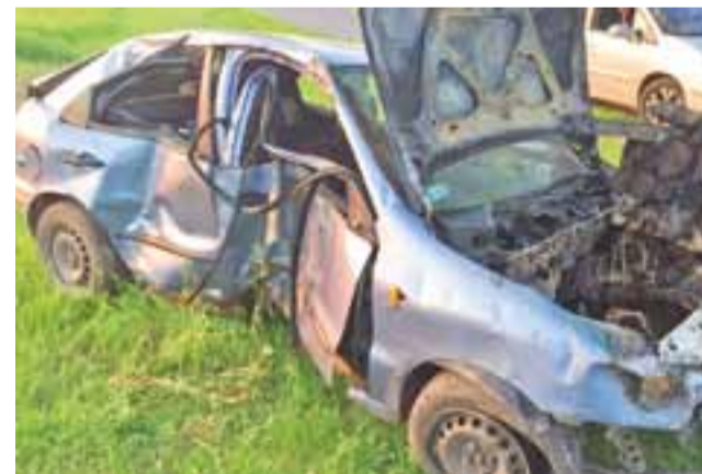
Jak widać po uszkodzeniach samochodu - było blisko tragedii.

Mężczyzna miał poważne obrażenia twarzy, mocno krwawił. Interwenujący Zespół Ratownictwa Medycznego zabrał