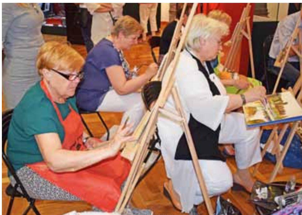
„Kopiujemy Chełmońskiego” – warsztaty łowickiego Uniwersytetu III Wieku w Muzeum w Łowiczu.