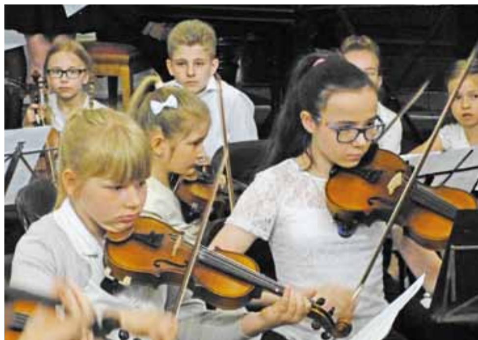
Koncert Centrum Edukacji Muzycznej. Dominowały w nim kompozycje muzyki klasycznej.