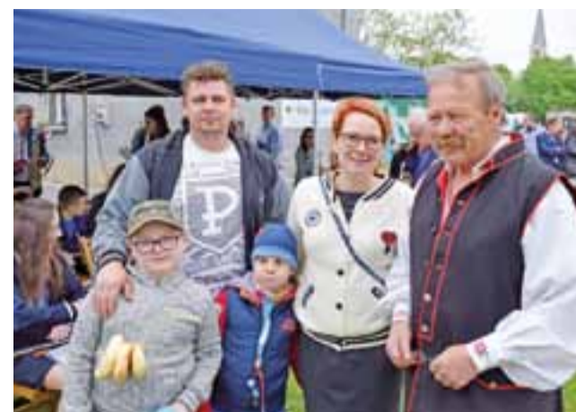
Festyn był okazją do ciekawego spędzenia czasu w gronie rodzinnym, a także spotkania z sąsiadami.

Sporo gorących emocji wzbudza loteria fantowa. Przez cały czas dostępny jest kącik dla dzieci, z dmuchanym zamkiem, kolejką