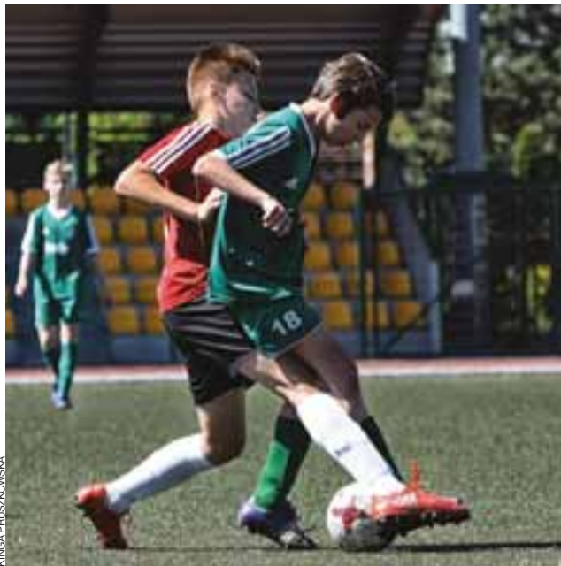
Pelikan 2004 walczył, ale był zdecydowanie słabszy od Widoku.

LKS Victoria Bielawy – MUKS Pelikan-2004 Łowicz (s, godz. 10.00), MLKS Widok Skierniewice – RKS Mazovia Rawa Mazowiecka (cz, godz. 17.15), GOKSiR Jutrzenka Drzewce – LKS Pogoń Bełchów (s, godz. 12.00), LZS Kopernik Kiernozia – GLKS Laktoza Łyszkowice (s, godz. 13.30), Pogoń Godzianów – Orleża Cielądz (n, godz. 14.30).