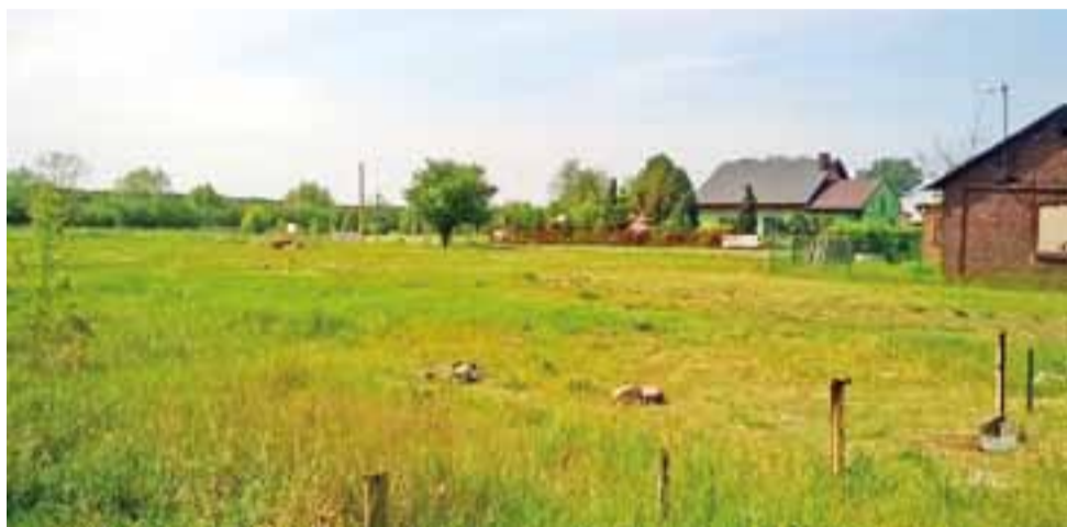
Miejska działka przy ul. Młyńskiej na Górkach oddalona jest ok. 50 m od ul. Łęczycy.