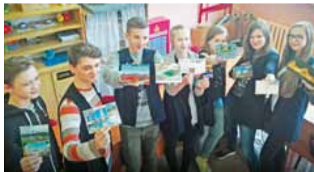
Młodzież pokazuje pocztówki, które do nich już przysłali rówieśnicy z innych krajów.