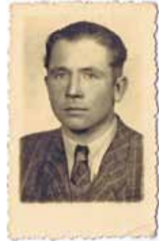
Autor w okresie po ukończeniu wyższych studiów.