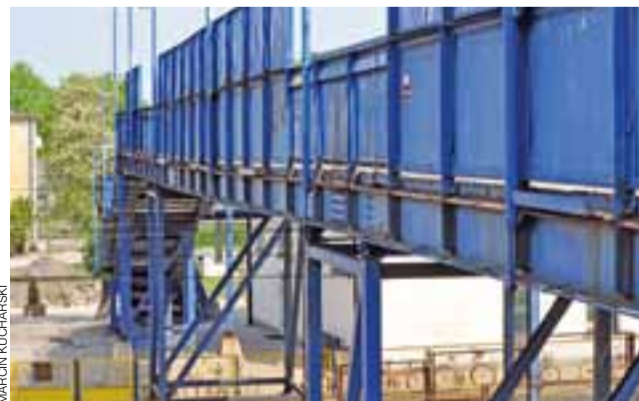
Niebieska kładka nad torami również zniknie z okolicy stacyjnego krajobrazu. Najpierw jednak musi powstać przejście podziemne.