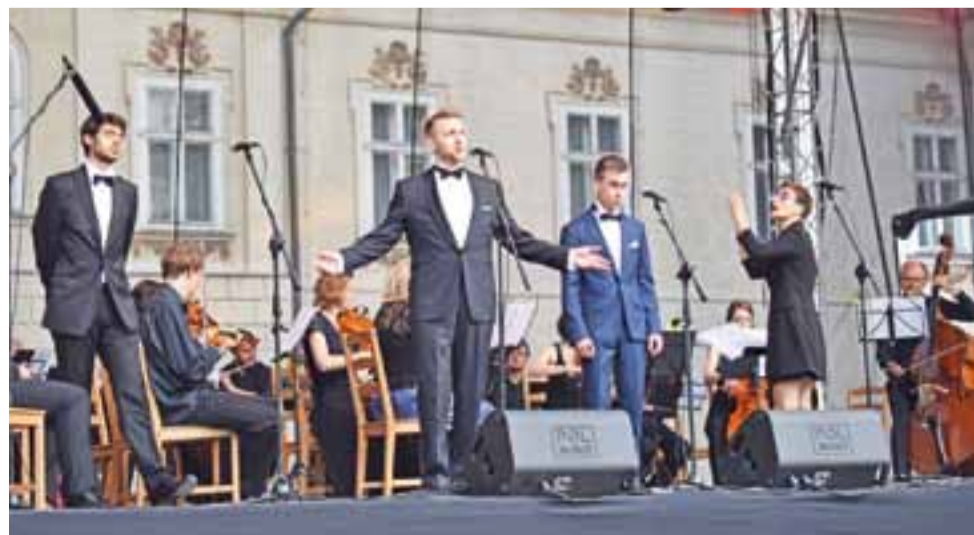
„Don Giovanni” Mozarta na dziedzińcu przed pałacem – koncert operowy godzin księżąt. Wystąpiła mocna grupa artystów Warszawskiej Opéry Kameralnej i wydziału wokalnego Uniwersytetu Muzycznego im. F. Chopina.