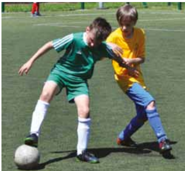
Ciekawe widowisko stworzyli gracze MUKS Pelikan i AP Champions.