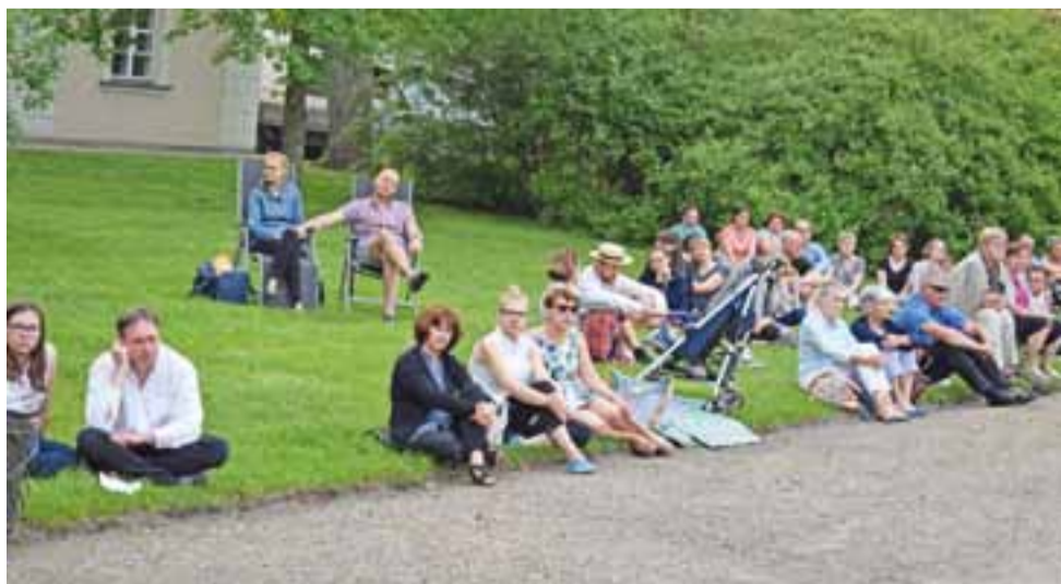
Krzesełka na koncercie przed pałacem w Nieborowie były pozajmowane przez słuchaczy, ale przy pięknej pogodzie przyjemnie było posłuchać arii operowych, siedząc na trawce.