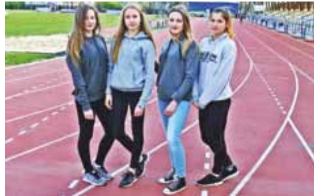
Lekkoatletki z Domaniewic zawsze w dobrych humorach.