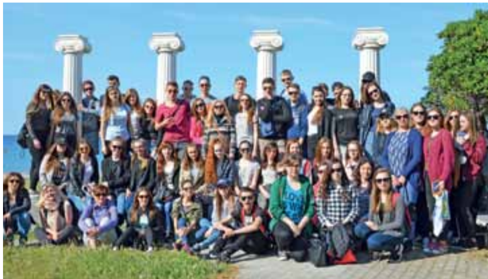
Uczniowie „Ekonomika” mieli też czas na zwiedzanie Grecji.

U nas nie zawsze sprzedawca jest zainteresowany klientem, natomiast tam, gdy tylko ktoś zjawi się w sklepie, ekspedient zostawia wszystko i poświęca mu całą swoją uwagę.