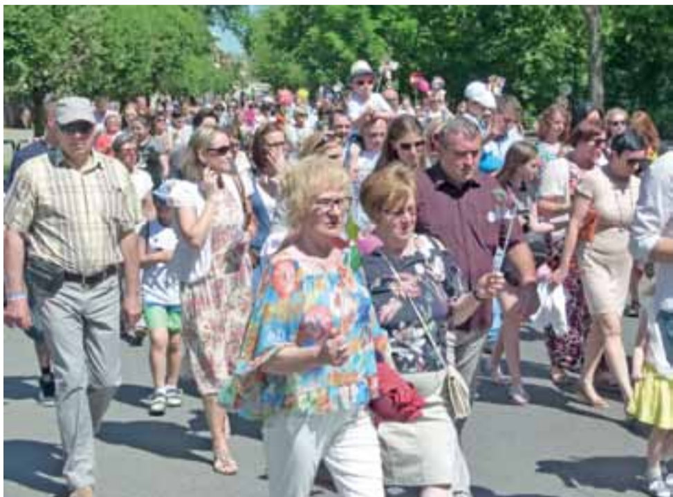
W samym marszu szło około 700-800 osób.