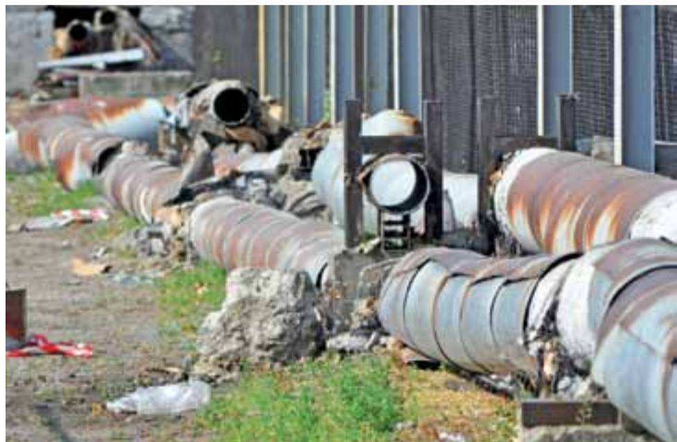
Rury na targowisku od strony ul. Sikorskiego w części już zostały zdemontowane i czekają na wywiezienie.

na prawach powiatu. Rozporządzenie nie przewiduje natomiast wyświetlaczy z sekundnikami na drogach miejskich czy gminnych. Ulice Sikorskiego i Kurkowa w Łowiczu są drogami miejskimi, czas pozostały do zmiany światła tam zamontowane są „sekundniki” – dobrze przyjęte przez mieszkańców, prawdopodobnie nie będą mogły tam pozostać – choć w ratuszu na to liczono. tm