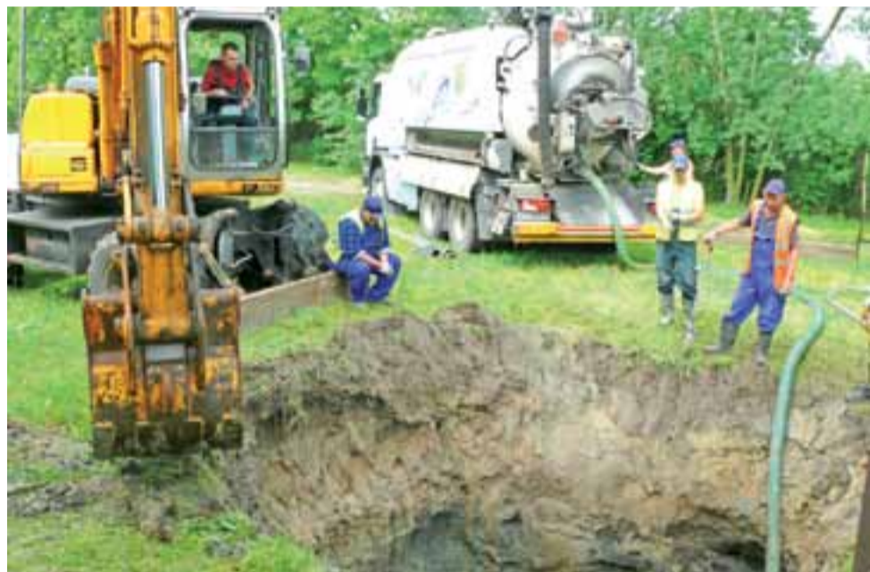
Pracownicy ZUK musieli wykopać głęboki na ok. 3 m dół, aby dostać się do pękniętej rury.

Tematem spotkania mają być problemy, z jakimi borykają się mieszkańcy naszego regionu, ale rzecznik liczy też na informacje na temat dobrych doświadczeń. – Adam Bodnar uważa bowiem, że o stanie praw człowieka w Polsce nie można się dowiadywać tylko z pism przysyłanych do Biura Rzecznika Praw Obywatelskich – czytamy w informacji na temat tego spotkania, która została przygotowana przez to biuro. mwk