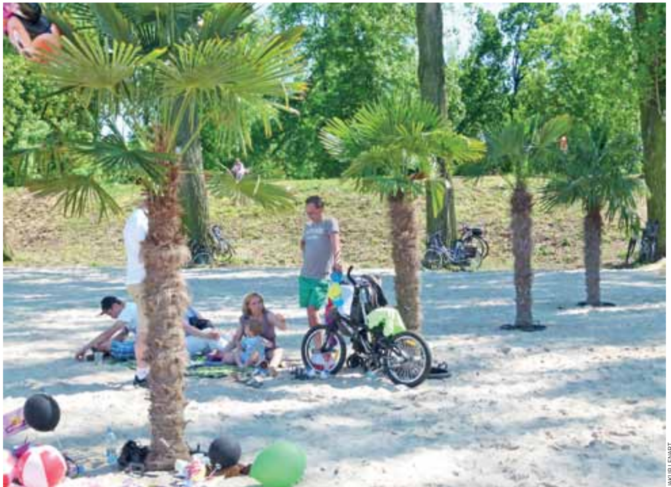
Dzięki palmom nad Bzurą powiało egzotyką.

W niedzielę rozstrzygnięto także organizowany przez ŁAS i Urząd Miejski konkurs plastyczny dla najmłodszych „Plaża nad