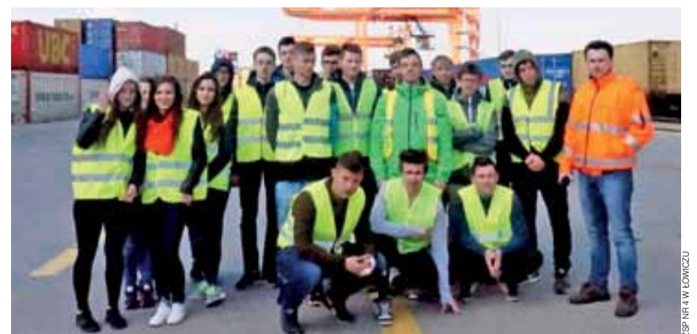
Uczniowie „Ekonomika” podczas zwiedzania terminalu kontenerowego PCC Kutno.