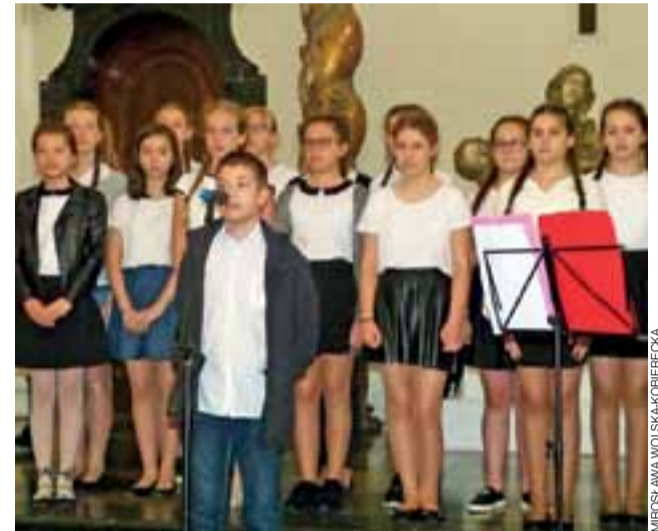
Program artystyczny imprezy tym razem rozpoczął występ dzieci ze Szkoły Podstawowej nr 1 w Łowiczu.

Po występie wszyscy mogli spróbować tortu, na którym widniał napis „Dzień Matki”. mwk