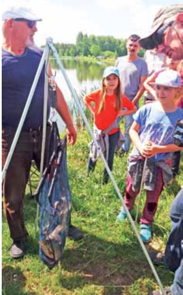
Dziewczeta bacznie przyglądały się ważeniu złowionych ryb po zakończeniu zawodów.