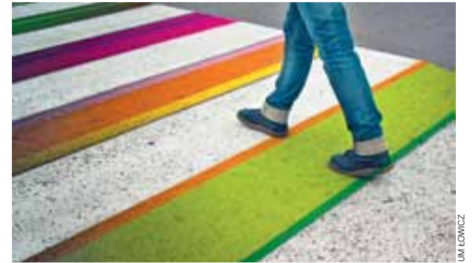
A tak wygląda jedna z propozycji pomalowania pasów na przejściach dla pieszych w motyw księżackiego pasiaka.

szczególnie do spacerów po wale, który stanowi przecieź piękną promenadę. Po trzecie: blokuje możliwość zasadzenia na ich miejsce innych, cenniejszych a mniejszych drzew. Za dużo wydano pieniędzy na Błonia, by łatwo odpuszczać temat gawronów – i topól, bez których by ich nie było. I nie można się zastania argumentem, że RDOŚ stawia opór. Przed dwoma laty ratusz zasłaniał się oporem innego urzędu tłumacząc, dlaczego nie da się nad Bzurą urządzić plaży. Dziś widać, że się dało. Z gawronami też trzeba dać sobie radę. Ich obecność sprawia, że Błonia tracą połowę swego uroku. Wojciech Waligórski