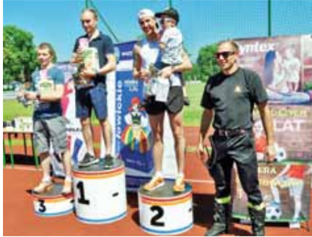
Najlepsi biegacze III Crossu w Domaniewicach z mistrzem Zbigniewem Bródką

Czubiak, 2. Malwina Pańczyńska, 3. Daria Mikituła