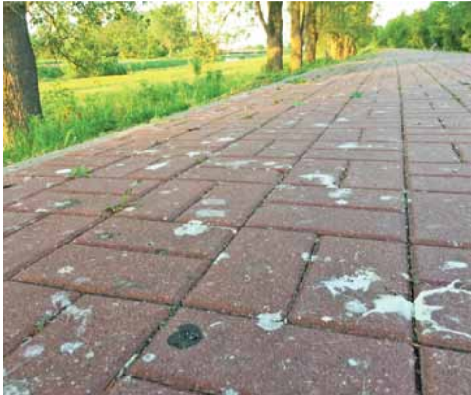
Spacer po wale przeciwpowodziowym na Błoniach nie jest dziś przyjemnością.

– Niestety, termin na wykonanie inwentaryzacji był bardzo krótki i tuż przed rozpoczęciem okresu lęgowego. Realizacja tego zalecenia okazała się niemożliwa, a ponadto było to bardzo kosztowne. Dlatego zrezygnowaliśmy – wyjaśnia Gawroński. Dodał, że w przyszłości można spodziewać się podobnych wymagań. Jak podkreślił, ze skutkami obecności gawronów w parkach ratusz będzie walczył przez dbanie o czystość miejsc, nad którymi się gnieźdzą. tb