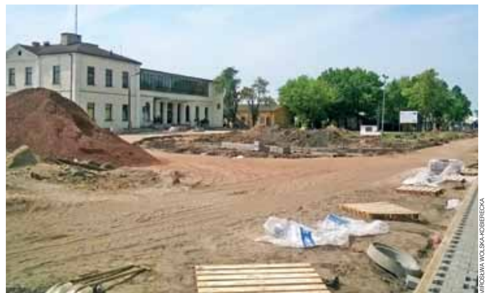
Okolice dworca PKP Łowicz Główny wciąż są wielkim placem budowy, ale postęp prac jest tu widoczny.

Przy skwerze nie będzie już żadnych miejsc parkingowych, pozostanie tam tylko postój taksówek i zatoka autobusowa.