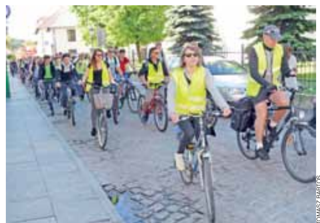
Na święto szkoły w skansenie w Maurzycach uczniowie pijarskiej udali się w większości na rowerach.

jem przyjętym na święcie szkoły, w przeciąganiu liny zmierzyli się nauczyciele i uczniowie szkoły, po raz kolejny pojedynek wygrali ci drużdy. W trakcie imprezy jej uczestnicy mogli skosztować kiełbasek z grilla, ciast i lodów, a także zwiedzić skansen i wziąć udział