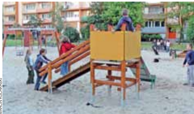
Ten plac zabaw został zorganizowany w 2008 roku, później był modernizowany – zamontowano m.in. ogrodzenie oraz oświetlenie, kilka razy wymieniany bądź dosypywany był też piach. Fot. archiwalne z 2008 r.

Ponieważ okres, w którym dokonano wielu wymian stolarki okiennej już minął, w ubiegłym roku spółdzielnia powinna zakończyć wypłacanie z opóźnieniem. W przypadku zaległości czynszowych, zwrot „za okna” trafia w pierwszej kolejności na pokrycie lokatorskich długów. mak