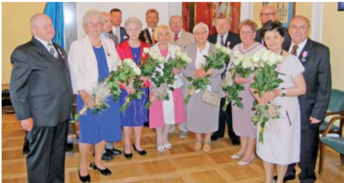
– To Wy tutaj jesteście ważniejsi – mówił burmistrz ustawiając się wraz z przewodniczącym Rady Miejskiej do pamiątkowego zdjęcia za jubilatami.

Łowicz | Złote Gody sześciu par małżeńskich w ratuszu