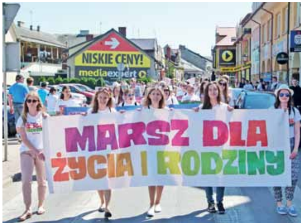
Marsz dla Życia i Rodziny niemal u celu wędrówki.

Łowicz | Sukces Marszu dla Życia i Rodziny