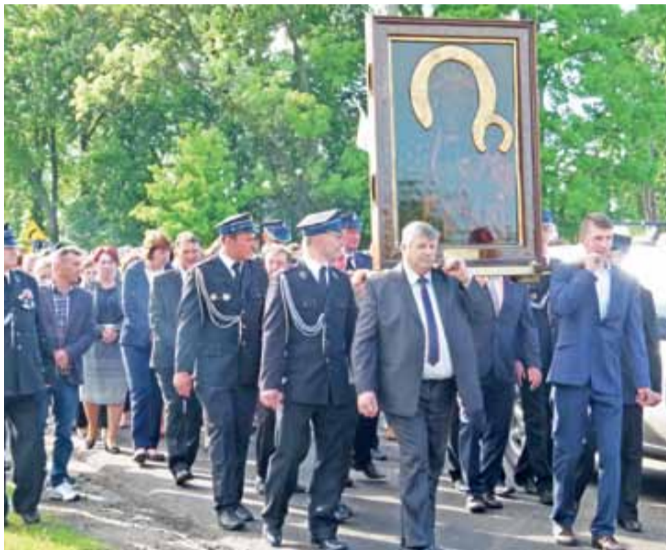
Obraz niosą przedstawiciele rady parafialnej w asyście strażaków.

Stary Waliszew – pierwsza na trasie peregrynacji parafia z dekanatu głowienieckiego – powitał kopię cudownego obrazu w poniedziałek, 29 maja. Podobnie jak w innych miejscowościach, także i tutaj droga do świątyni została udekorowana wstążkami oraz flagami: polskimi, watykańskimi