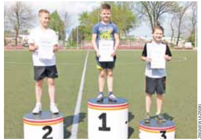
Najlepsi młodzi lekkoatleci dumnie prezentują się na podium.