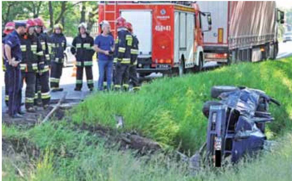
BMW zatrzymało się w przydrożnym rowie. Strażacy musieli odciąć dach, żeby uwolnić kierowcę.

Na tę chwilę policja nie przesądza o winie żadnego z kierowców. – Ustalamy okoliczności zdarze-