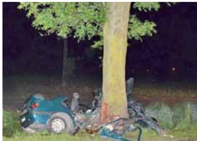
Z Peugeota, po uderzeniu w to drzewo, niewiele zostało.