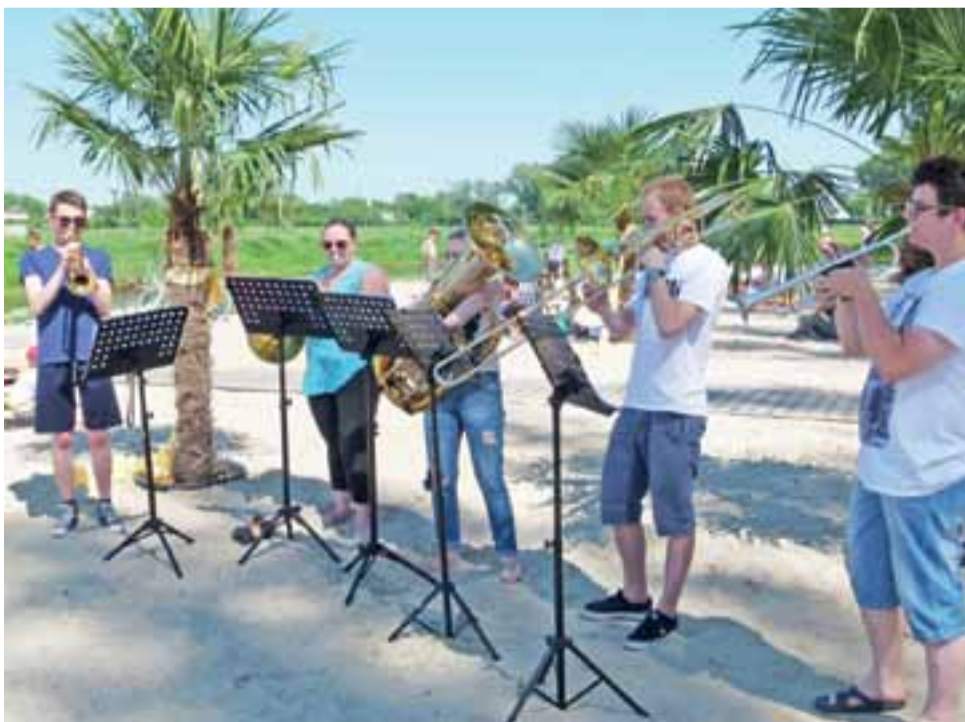
Orkiestra SmArt Bass w czasie inauguracji zaprezentowała próbkę rytmów latino.