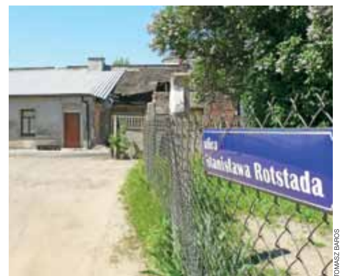
Ulica Stanisława Rotstada – w tle widać budynki, przez które już niedługo przejdzie droga do ul. Aptekarskiej.

Kolejnym krokiem ma być wykonanie nawierzchni z betonowej kostki, ale naczelnik Pełka przyznał, że w tym roku nie ma na to pieniędzy w budżecie. O tym, czy zadanie to znajdzie się w budżecie na rok 2017, zdecydują miejscy radni. Niestety, naczelnik Pełka przyznał nam, że jego wydział nie opracowywał połączenia ul. Aptekarskiej z ul. Pijarską, na przedłużeniu ul. Rotstada. Połączenie to jest także od dawna planowane przez miasto, ale droga koliduje w tym przypadku ze stacją transformatorową, której przenosiny w tym miejscu byłyby kłopotliwe. tb