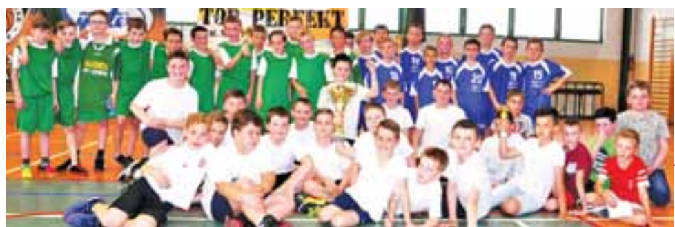
Wszystkie ekipy chłopców kończyły rywalizację w dobrych nastrojach.