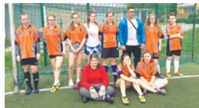
Najlepsze w mieście okazały się piłkarki z Gimnazjum nr 2 (K.Olko)