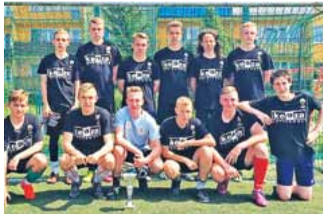
Ekipa Gimnazjum nr 4 pewnie sięgnęła po tytuł mistrza powiatu.

■ Gimnazjum w Łaguszewie – Gimnazjum w Nowych Zdunach