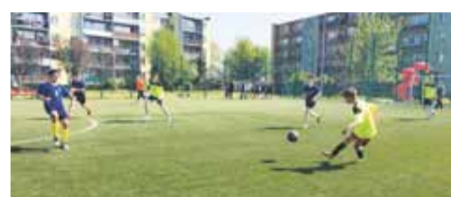
W miejskich zawodach nikt nie powalczył z ekipą Gimnazjum nr 4.