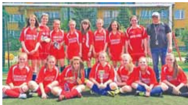
Dziewczyny z Kocierzewa Północnego okazały się najlepsze w powiecie.

Na 3. lokacie uplasowały się podopieczne Cezarego Dołowca z Gimnazjum w Łaguszewie, któ-