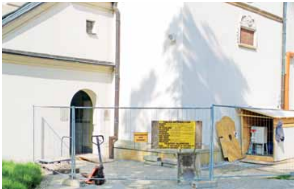
Jakie jeszcze tajemnice skryte są pod południową nawą łowickiej bazyliki? W najbliższym czasie możemy się spodziewać kolejnych odkryć archeologicznych.

Zaskakującego odkrycia dokonano w pierwszym przejściu nawy południowej, przed kaplicą św. Wiktorii, gdzie odsłonięto dużo pochówków dziecięcych. Prawdopodobnie pochodzą one z jednego okresu, być może z końca epoki nowożytnej, ale dokładne określenie chronologii wymaga dalszych analiz. Badane będą też trzy znalezione monety, będące na razie w zbyt złym stanie, by pokusić się o ustalenie ich czasu powstania i wartości. Znaleziono zostało też sporo fragmentów ceramiki,