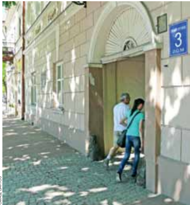
Biuro ds. Kultury, Sportu, Turystyki łowickiego ratusza oraz siedziba oddziału PTTK przeniosą się w czerwcu do pomieszczeń w kamienicy przy Starym Rynku 3 w Łowiczu.

Łowicz | PTTK wróci do starych pomieszczeń