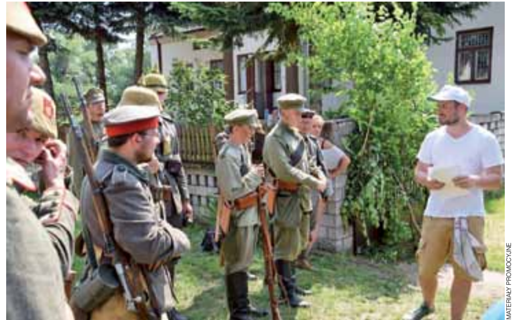
Obtoki śmierci – Bolimów 1915. Odprawa rekonstruktorów, z prawej reżyser.

W kwietniu, pod Ypres doszło natomiast do pierwszego użycia śmiertelności broni chemicznej w postaci chmury 171 ton chloru, rozpylonego na odległość 6,5 km frontu i niesionego z wiatrem w kierunku linii alianckich. Miesiąc później Niemcy wykorzystali chlor ponownie. Tym razem przeciwko Rosjanom blokującym dostęp do Warszawy na umocnionej linii frontu wzdłuż Rawki i Bzury. Pierwszy atak pod Bolimowem miał miej-