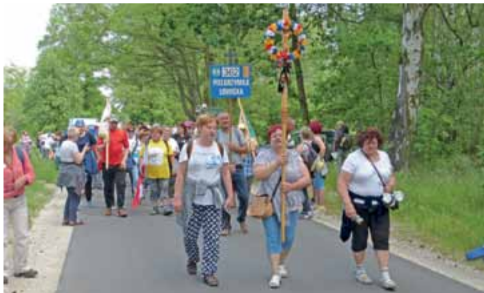
Koniec przerwy w Uchaniu. Czoło pielgrzymki z krzyżem i tabliczką już rusza w dalszą drogę. Rozbrzmiewa też odgłos bębna – niewidocznego na zdjęciu.

Powitanie łowickiej pielgrzymki na Jasnej Górze zaplanowano w sobotę, 3 czerwca o godz. 14.30. Godzinę później, o 15.30, pątnicy wezmą udział w mszy św. w kaplicy obrazu Matki Bożej. Osoby, które zostaną w Częstochowie do niedzieli, wezmą udział w mszy św. w kaplicy o godz. 6.00 oraz w drodze krzyżowej na wałach o godz. 7.00. Uroczyste pożegnanie w kaplicy zaplanowano na godz. 13. mwk