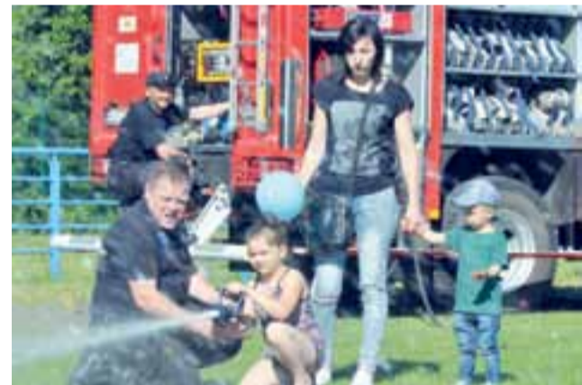
Ciekawą atrakcją dla dzieci była zabawa polegająca na strącaniu pacholek prądem wody podawanym ze strażackiego samochodu.

Na miejscu zaprezentować się również mogli strażacy z Ochotniczej Straży Pożarnej w Czatolinie. Można było obejrzeć zakupiony w ubiegłym roku duży samochód strażacki oraz spróbować swoich sił w strącaniu pacholek z wykorzystaniem strumienia wody. Murawie na boisku nadmiar wody w gorący dzień nie przeszkadzał. – Co najmniej kilkoro dzieci de-