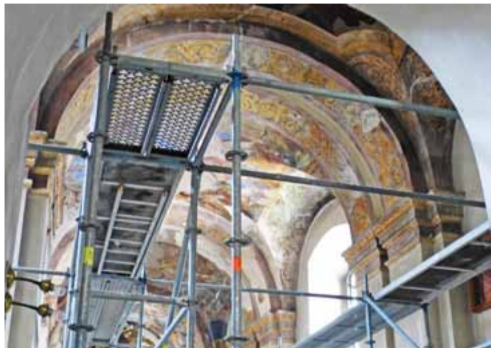
Rusztowania to w ostatnich latach częsty widok w kościele ojców pijarów – świadczy to o tym, że prace nad odnowieniem i konserwacją zabytkowych polichromii w miarę możliwości postępują.

Na przyszłość – być może na przyszły rok – zostaną do odnowienia jeszcze dwa przęsła z malowidłami oraz ściany. tm