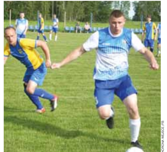
Gracze Korony przystąpią do nowego sezonu z nowym trenerem.

1. kolejka skierniewickiej klasy A (19-20 sierpnia): LKS Miedniewiczanka Miedniewice – LKS Start Złaków Borowy GKS Głuchów – LKS Wola Wola Chojnata MGKS Białka Biała Rawska – GLKS Olimpia Jeżów SKS Astra Zduny – GKS Rawka Bolimów LKS Czarni Bednary – GLKS Sierakowianka Sierakowice Lewe LKS Korona Wejście – LZS Macovia Maków GLKS Laktoza Łyszkowice – GLKS RZD Żelazna