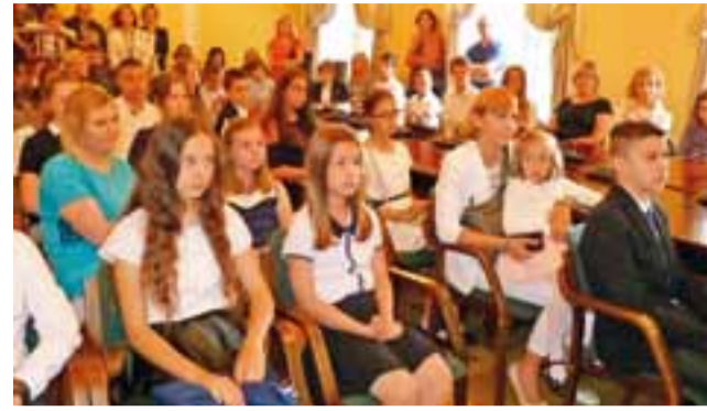
Stypendyści zostali zaproszeni do ratusza w dwóch turach. Za zdjęciem grupa uczniów szkół podstawowych.

Miasto na te stypendia wyda łącznie 54.680 zł, z czego 44.120 zł na stypendia burmistrza, które otrzymują uczniowie będący mieszkańcami Łowicza, a 10.560 zł na stypendia dyrektorów szkół – które otrzymują uczniowie spoza Łowicza. W tym drugim przypadku na listach gratulacyjnych poza podpisem burmistrza widnieje też podpis dyrektora. Wręczenie jednych i drugich miało miejsce pod-