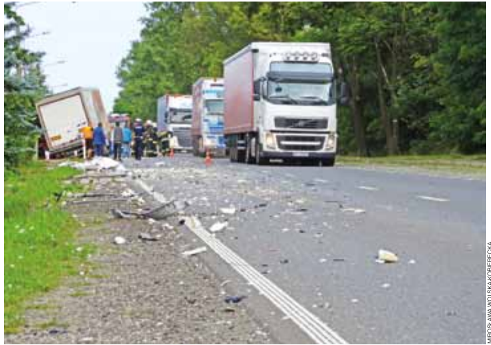
Utрудnienia na drodze do Skierniewic, spowodowane kolizją, trwały przez 4 godziny. Ruch odbywał się wahadłowo.

Jak się dowiedzieliśmy od straży, że zgłoszenia na numer alarmowy 112 wynikało, że jeden z kierowców nie opuścił kabiny i była obawa, że trzeba będzie go z niej wydobyć. Ostatecznie jednak nie było takiej potrzeby, kierowca wyszedł z kolizji bez obrażeń. mwk