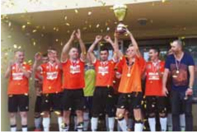
Puchar Lwówka powędrował tym razem do powiatu płockiego.