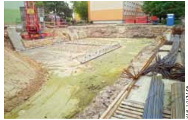
W tym miejscu stanie budynek wielorodzinny z 30 mieszkaniami.

Budynek przy Medycznej 12 został pobudowany w ramach pierwszego etapu inwestycji na Bratkowicach. Znajduje się tam 25 mieszkań. Pierwsi mieszkańcy otrzymali klucze w grudniu ubiegłego roku. Zdecydowana większość mieszkań została już sprzedana. Deweloper informuje, że