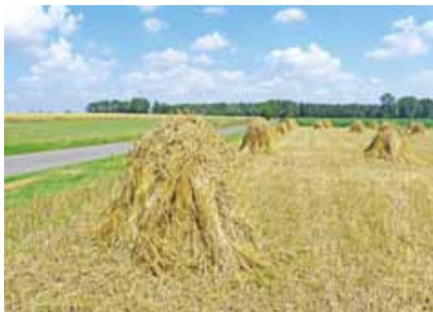
Snopki ustawione w mendle to zapomniany już widok na polskiej wsi.

wiedzieć, że w takiej technologii żniw zboże koszone było w dojrzałości tzw. włoskowej, a potem dosychało około 10 dni na polu, ustawione w mendlach, osiągając dojrzałość pełną. Aby można było zboże zebrać kombajnem, zboże musi mieć dojrzałość pełną – ponieważ ziarno – jeśli jest to tylko możliwe – nie suszy się dodatkowo. Dlatego żniwa snopowiązałką w Retkach rozpoczęły się znacznie wcześniej, niż na naszych polach pojawiły się w tym roku pierwsze kombajny.