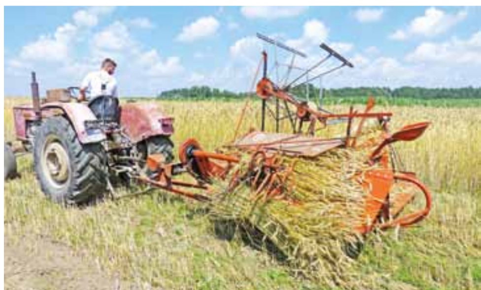
Zasada działania snopowiązałki polega na koszeniu zboża i wiązaniu go w snopki. Kiedyś używano do tego sznurka sisalowego, dzisiaj stosowany jest polipropylenowy.