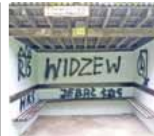
Przystanek „Zygmuntów” przy drodze stanowiącej dojazd do Nieborowa od krajowej „siedemdziesiątki”.

■ Artur Zwoliński – radny, wykazał posiadanie na prawach współwłasności małżeńskiej: oszczędności w wysokości 50 tys. zł (to nowość w porównaniu z latami poprzednimi), domu o pow. 65 m 2 i wartości 50 tys. zł oraz dwóch nieruchomości o pow. 0,49 ha i wartości 4 tys. zł, a także 0,70 ha o wartości 14 tys. zł. Z tytułu zatrudnienia w firmie Fruktodor w Bolimowie uzyskał wynagrodzenie w wysokości 38.651 zł (w 2015 roku – 37.256 zł, w 2014 roku – 36.338,92 zł, a w 2013 roku – 35.601,18 zł), z tytułu diet radnego – 3,3 tys. zł (w 2015 roku – 3.330 zł, w 2014 roku – 1.780 zł, a w 2013 roku – 2.240 zł). Radny wykazał w oświadczeniu majątkowym posiadanie samochodu Honda Civic z 2007 roku o wartości 23 tys. zł (w roku 2015 i 2014 był to Citroen C4 z 2005 roku). Radny nie wykazał zobowiązań finansowych powyżej kwoty 10 tys. zł. tb