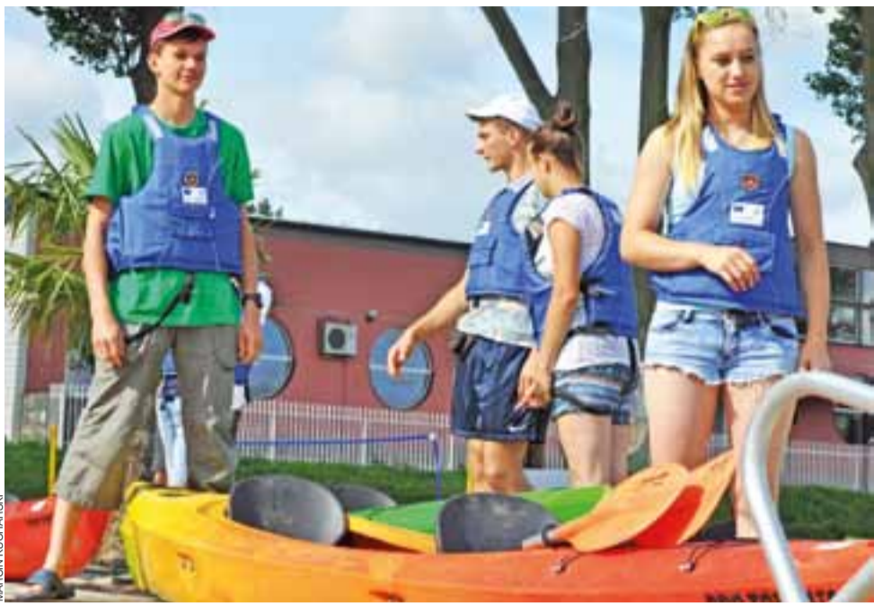
Część z młodych osób już miała doświadczenie w pływaniu kajakiem, ale jak się okazało – nie wszyscy. Kajaki wodowano na przystani przy plaży miejskiej.