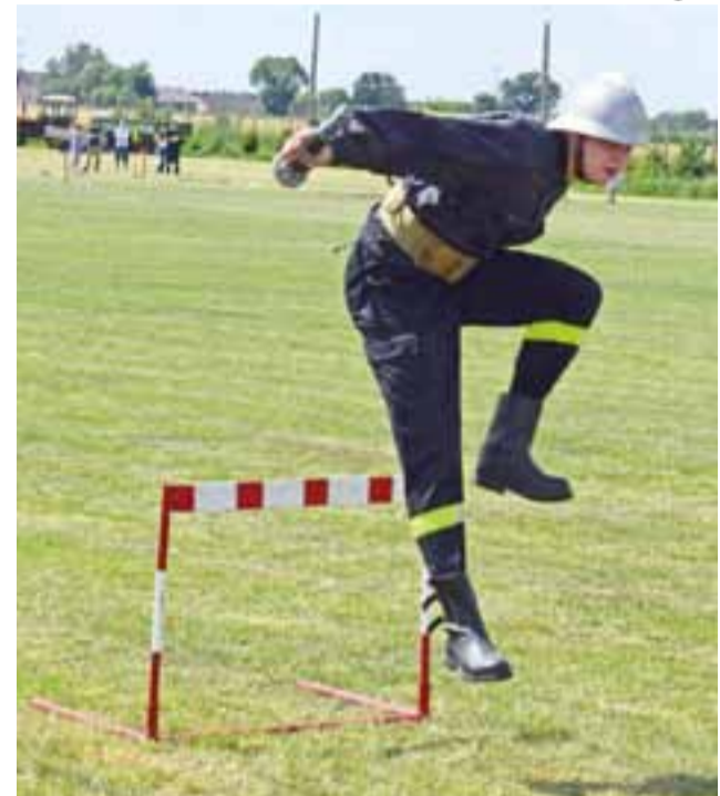
O jak najlepsze miejsce walczy OSP Kocierzew Południowy (ostatecznie na 6. miejscu).

Trzecie miejsce z wynikiem 110,5 sekundy zajęła reprezentacja OSP Jezioro. W pierwszej szóstce zawodów znalazły się jeszcze Lipnice, Boczki Chełmońskie i Kocierzew Południowy. OSP Wicia może za to cieszyć się ze zwycięstwa w kategorii C,