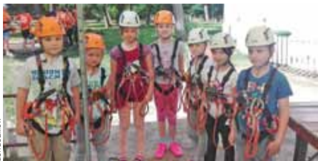
W Julinku dzieci spróbowały swych sił w parku linowym.