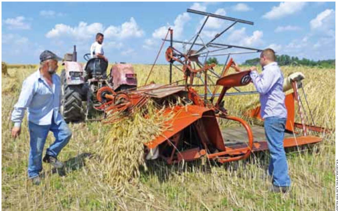
Mechanizacja – niezależnie z którego wieku i dziesięciolecia – wymaga zwykle udziału rąk ludzkich. Na zdjęciu uchwyciliśmy moment, w którym maszyna się zapchała zbożem i nie mogła związać już snopka. Żniwiarze interweniują.