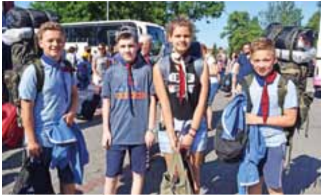
Pełne plecaki, namioty i dobre nastawienie – harcerze w pełni gotowi do wyjazdu na dwutygodniowy obóz.