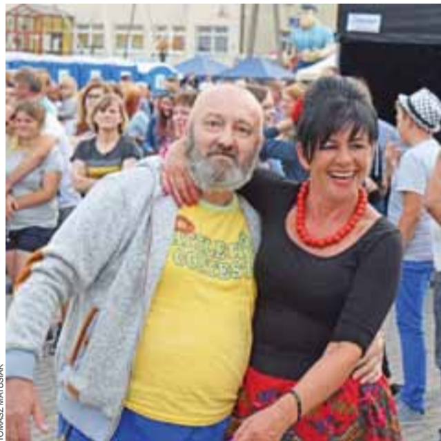
Zabawa pod sceną w trakcie występu zespołu Progress. Dominowały dobre nastroje i uśmiechy.