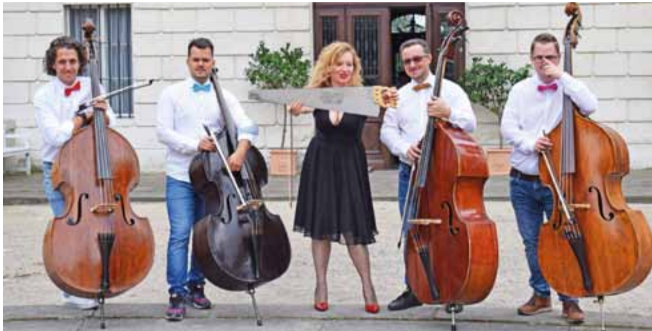
Artyści po koncercie, na dziedzińcu pałacu w Nieborowie.