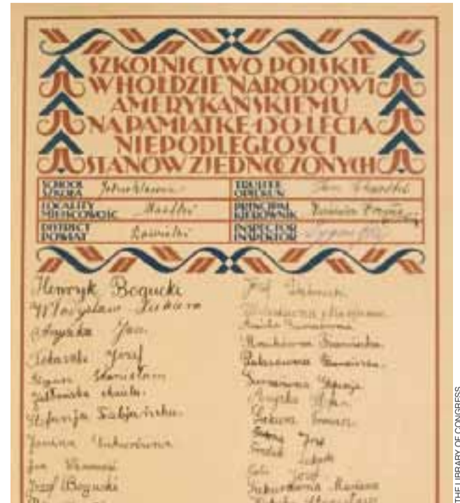
Jedna z tysięcy kart deklaracji. Na niej podpisy uczniów i kadry jednoklasowej wówczas szkoły w Mastkach.

w tych zbiorach listy z podpisami mieszkańców poszczególnych miejscowości – każda z nich na odrębnej, najczęściej obustronnej karcie, a Łowicz na kilku kartach. Ich skany można oglądać w internecie, w cyfrowej odsłonie zbiorów biblioteki – można je powiększać, podpisy są w większości czytelne. Pierwsze 13 tomów zeskanowano przed 2010 roku, resztę – dopiero w tym roku. Zbiory zostały zdigitalizowane dzięki pomocy Biblioteki Polskiej w Waszyngtonie. Polskie Towarzystwo Genealogiczne znacznie ułatwiło wyszukiwanie w niej nazwisk, pu-