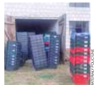
Skradzione transportery odzyskane przez policję.

Policja wyjaśnia przebieg i okoliczności zdarzenia, więc o winie uczestników wypadku na razie nic nie wiadomo. Pewne jest, że kobieta była trzeźwa, od rowerzysty pobrano krew do badania. Ze wstępnych – i jak podkreśla rzeczniczka KPP w Łowiczu Urszula Szymczak – jeszcze nie potwierdzonych ustaleń wynika, że rowerzysta mógł przejeżdżać rowerem na przejściu dla pieszych. mwk