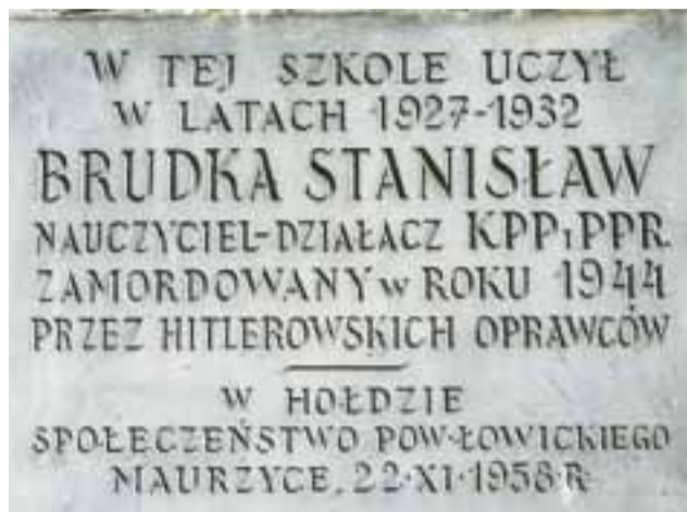
Tablica na ścianie szkoły w Maurzycach.

Natomiast PPR /Polska Partia Robotnicza/ została utworzona w 1942 roku również na mocy decyzji Międzynarodówki Komunistycznej. W programie miała wprawdzie walkę zbrojną z Niemcami, ale jej głównym celem była rewolucyjna przebudowa Polski,