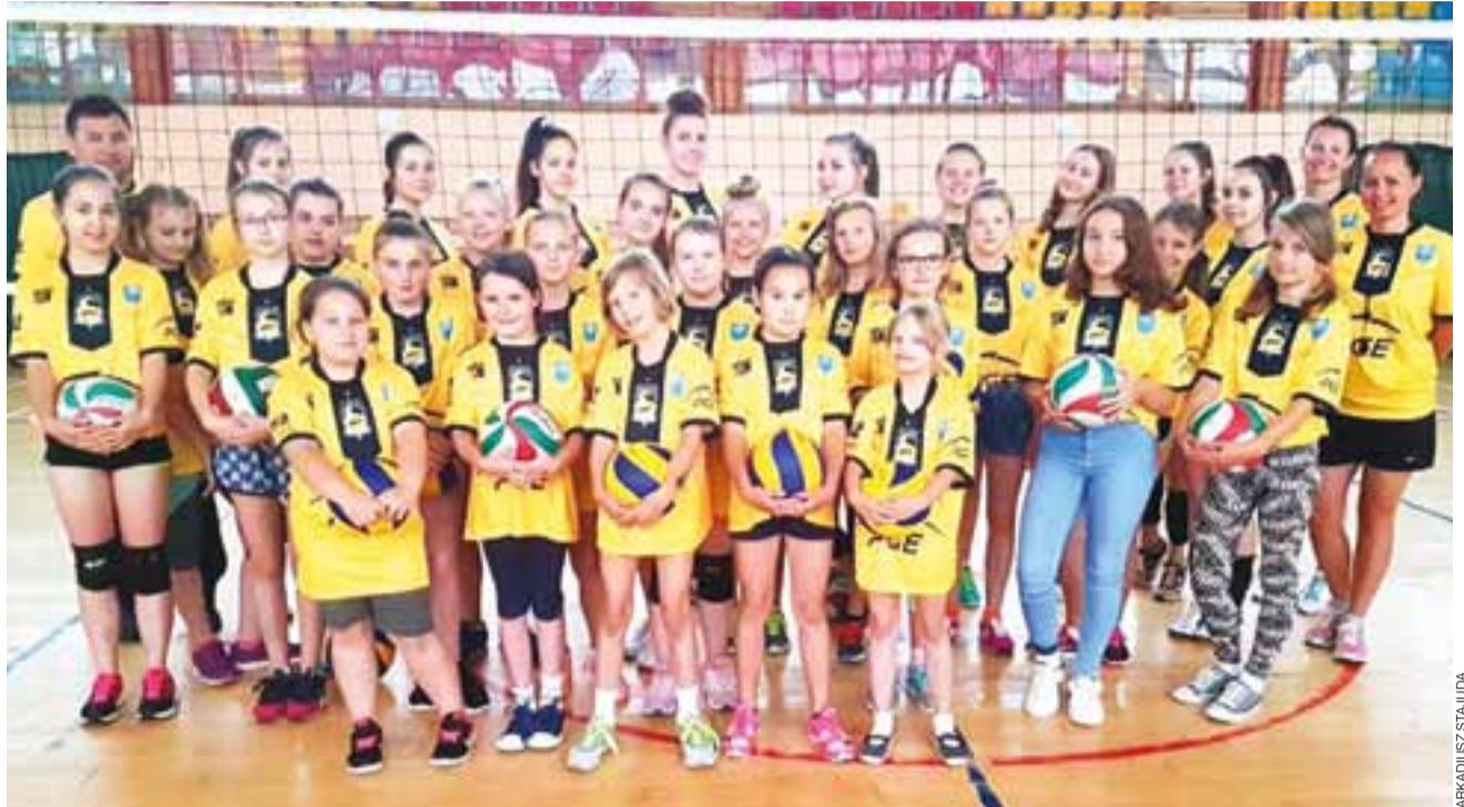
Kolorowa grupa Asika w koszulkach Skry Bełchatów

Poza typowymi treningami siatkarskimi były dwa treningi dla wszystkich przeprowadzone przez trener Patrycję. Były to treningi w rytm muzyki, czyli aerobik, albo zumba, w każdym bądź razie bardzo fajna zabawa, a po 1,5 godzinie każdy wyszedł z niej zmęczony – wspomina trener Stajuda. – Może w tym roku było wy-