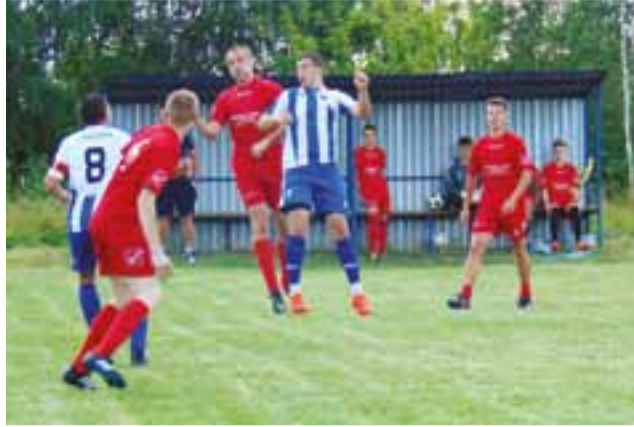
Lwówianka (biało niebieskie stroje) zajęła 1. miejsce w grupie B.

Piłka nożna | VI Międzypowiatowy Turniej Piłkarski o Puchar Lwówka