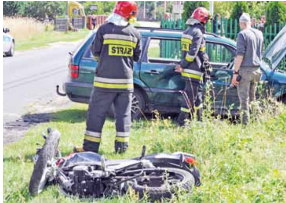
Wypadek w Parmie wyglądał groźnie. Policja ustala kto i w jakim stopniu zawinił.

Na miejscu interweniowała straż pożarna (2 zastępy straży zawodowej z Łowicza, OSP Bobrowniki i OSP Nieborów), dwa zespoły ratownictwa medycz-