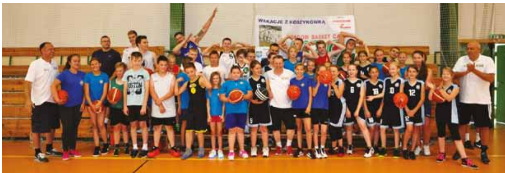
Uczestnicy Campu w Łowiczu w dobrych nastrojach

Koszykówka | Koszykarski Camp – Wakacje z Koszykówką Łowicz 2017