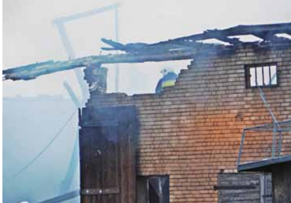
Niewiele zostało ze stodoły w Sapach.

Straż pożarna otrzymała zgłoszenie o pożarze około godziny 19.15. Płonął budynek o wymiarach 20 x 10 metrów. Ogień szybko rozprzestrzenił się i – jak stwierdzili strażacy po dojechaniu na miejsce – mógł stanowić zagrożenie dla innych budynków stojących nieopodal. Dlatego też pierwsze zastępy straży, które dotarły na miejsce (OSP Sapy i OSP Domaniewice) zajęły się przede wszystkim obroną – polewaniem wodą – budynków sąsiadujących ze stodołą. Już wtedy bowiem było widać, że stodoła nie da się uratować i to, co z niej zostanie, będzie nadawało się do zbiórki. W trakcie akcji zawaleniu uległ dach budynku oraz niektóre ściany. Oprócz straży pożarnych z Łowicza i powiatu, do pomocy