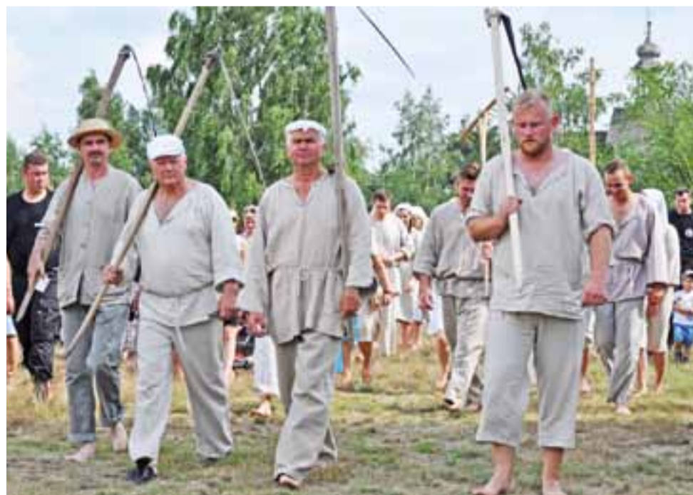
Żniwiarze wyruszyli do pracy skoro świt. Na potrzeby inscenizacji – około godziny 16.00.

Dodatkową atrakcją są też co roku stoiska Kół Gospodyń Wiejskich. U gospodyń można dobrze i tanio zjeść, a nawet napić się nalewek i innych trunków własnej roboty. Ponadto stoiska rozstawili twórcy ludowi, pszczelarze, sprzedawcy lodów, napojów, zabawek dla dzieci, przedstawiciele banków, Związku Międzygminnego Bzura. Na miejscu można