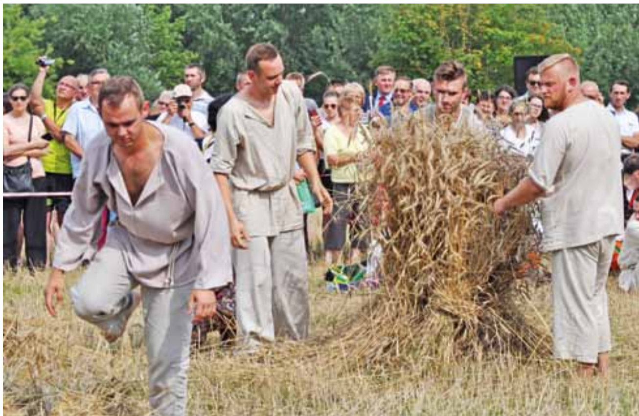
Układanie zboża w sнопki. Czy za 20-30 lat atrakcją dla turystów będzie koszenie z wykorzystaniem kombajnu?

Zapraszamy do obejrzenia obszernej galerii zdjęć na stronie www.lowiczanie.info .