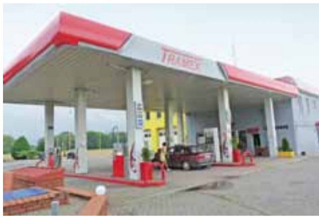
Pod nowym szyldem stacja paliw w Stroniewicach rozpoczęła swoją działalność 14 lipca.