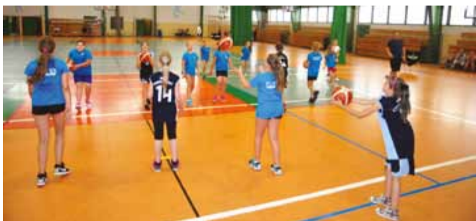
Trening dziewcząt z najmłodszych roczników UMKS Książek Łowicz.