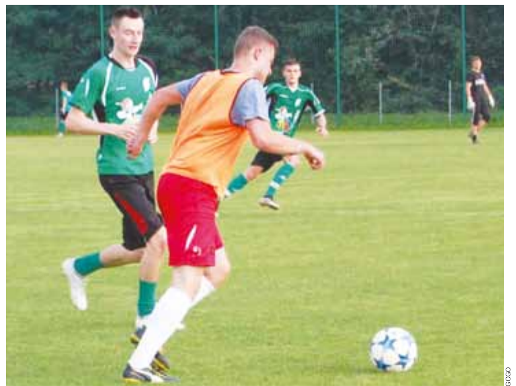
Pelikan II (zielone stroje) tylko zremisował z Olimpią 2:2