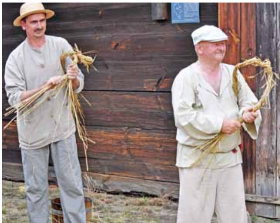
Żniwiarze pokazali też m.in. jak należy prawidłowo skrócić powrósł (przewiąsł) do związania snopów.