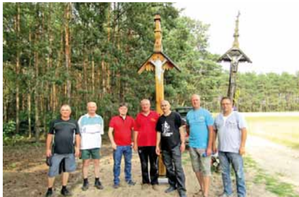
Grupa członków łowickiego oddziału PTTK po ustawieniu nowego krzyża w Świącach. Z tyłu widać jeszcze stojący stary krzyż.

W najbliższą sobotę, 29 lipca, sprawa ratowania starego drewnianego krzyża będzie miała swój ostateczny finał. O godz. 19.00 odbędzie się jego uroczyste poświę-