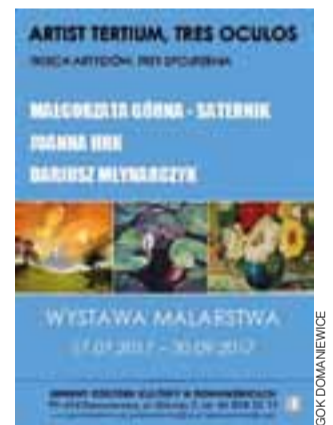
Plakat zapowiadający wystawę w Domaniewicach.