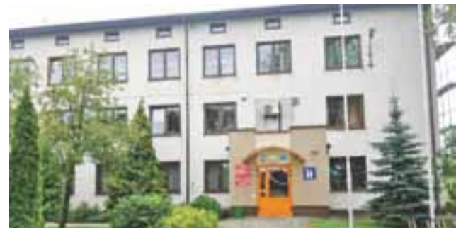
Budynek urzędu od dawna czeka na termomodernizację.

Cały budynek Urzędu Gminy zostanie docieplony 15-cm warstwą styropianu, przykryty cienkowarstwowym tynkiem mineralnym, z cokołem z tynku żywicznego oraz wykonane będą parapety z blachy powlekanej. Wykonawca ma obowiązek zdemontować i ponownie założyć rury spustowe, kraty w oknach, daszek nad wejściem i opaskę wokół budynku. Roboty mają być zakończone do 30 września. tb