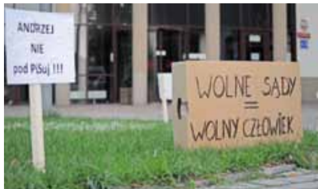
Takie oto mini transparenty pojawiły się w piątek przed budynkiem Sądu Rejonowego oraz m.in. w okolicach ronda przy Al. Sienkiewicza.

O zmianach w sądownictwie piszemy także na str. 19.