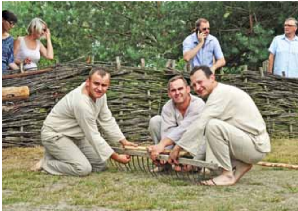
Ostatnie przygotowania do obrzędu żniwnego. Żniwiarze korzystali podczas niego z zabytkowych narzędzi.