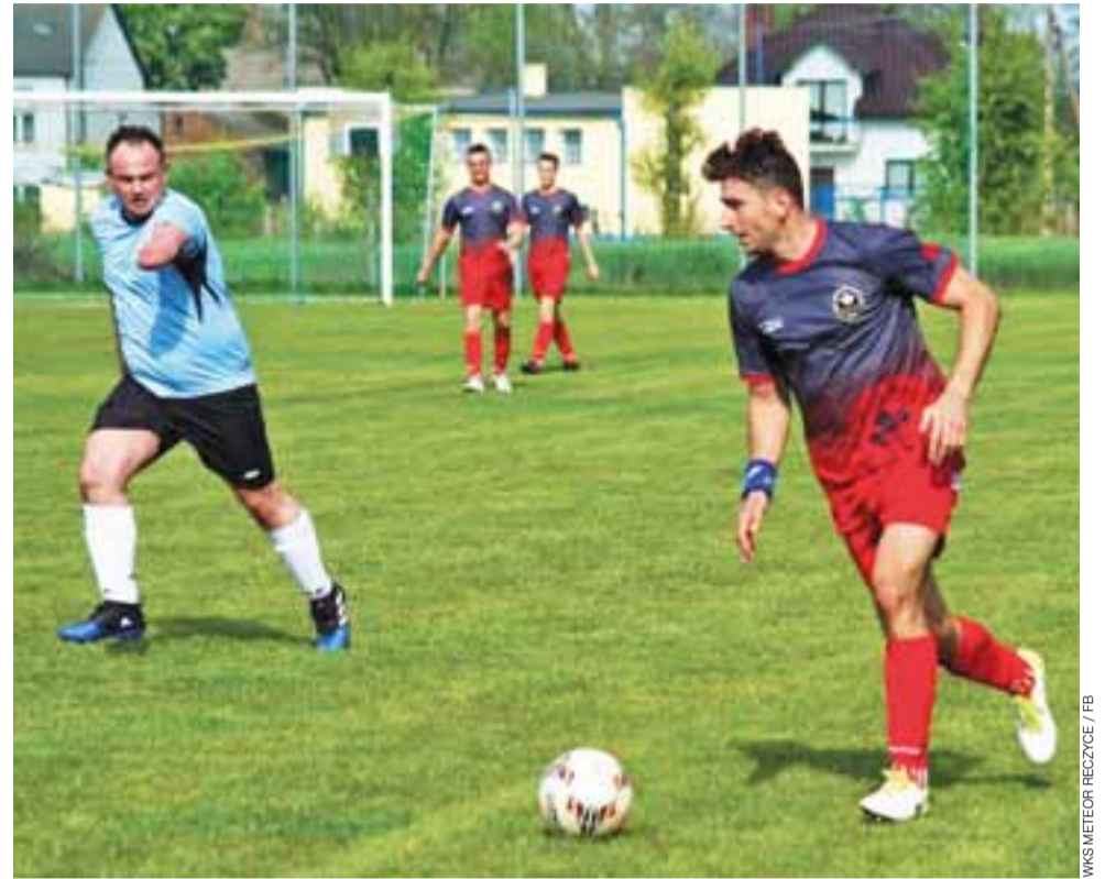
Meteor Reczyce w pierwszej kolejce zagra z Jutrzenką Mokra Prawa.

■ 1. kolejka skierniewickiej klasy B – grupa I (2017.08.26-27): SKF Naprzód Jamno – LKS Olimpia Niedźwiada KS Ostrowiec – LKS Kopernik Kiernożia UKS Płomień Piotrowice – LKS Zjednoczenie Bobrowniki Dzierzgow LKS Fenix Boczki – LKS Victoria Zabostów Duży WKS Meteor Reczyce – LKS Jutrzenka Mokra Prawa