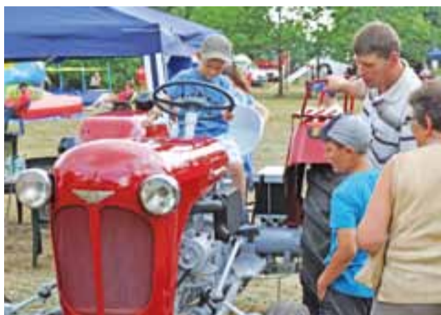
Zabytkowe traktory oraz motocykle, które pokazało w Maurzycach Muzeum Motoryzacji z Nieborowa, szczególnie podobały się młodszej części turystów.