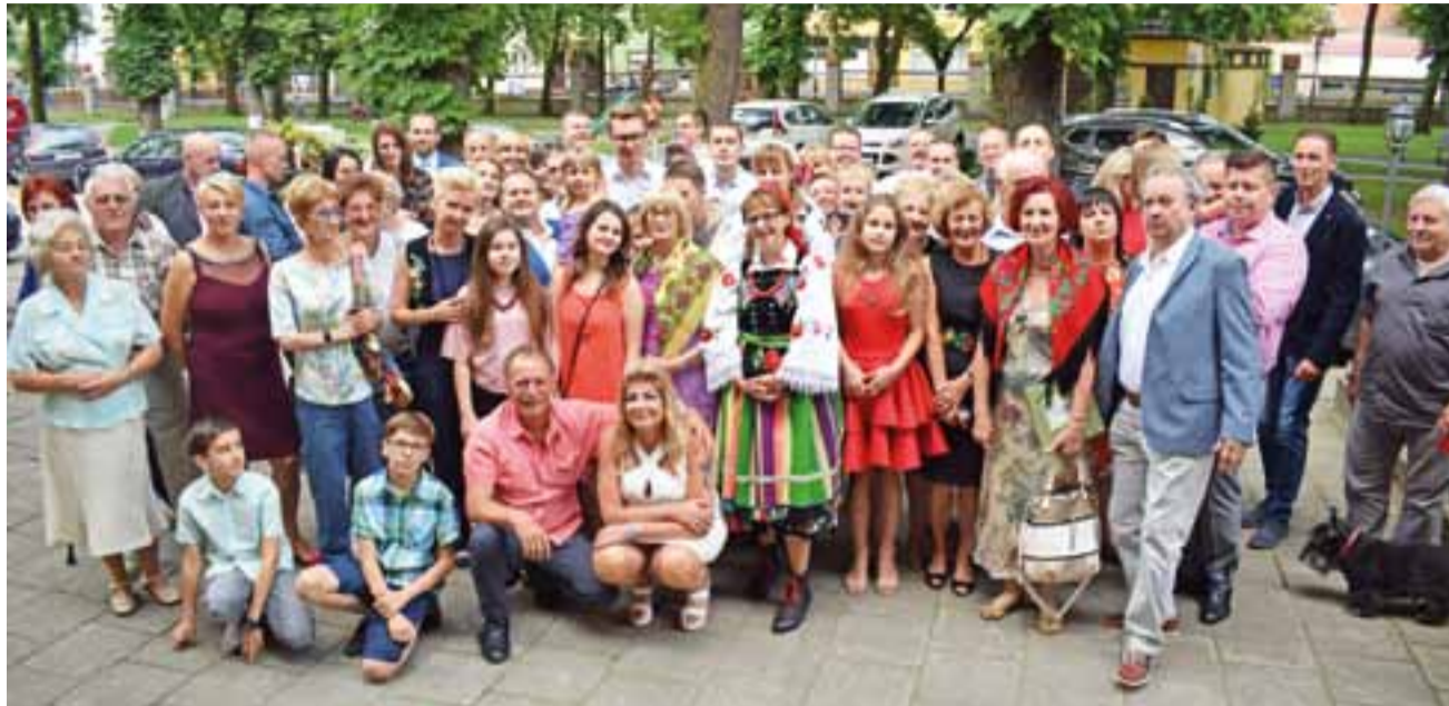
IV zjazd rodzinny – świetna atmosfera, dobra zabawa i mnóstwo rodzinnych tematów do omówienia.

Był to już czwarty zjazd tej rozległej rodziny, a pierwszy po ośmiolatej przerwie. Część ze zgromadzonych wciąż mieszka w powiecie łowickim, większość jednak przyjechała z dalszych stron: Warszawy, Łodzi, Kalisza, Szczecina, Gdańska, Sopotu czy Berlina. Dzisiaj noszą oni różne nazwiska, ale wciąż pamiętają