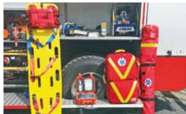
Sprzęt już jest na wyposażeniu jednostki w Kiernozi.

W skład zestawu ratowniczego wchodzi przede wszystkim torba ratownictwa medycznego oraz tzw.