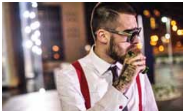
Quebonafide wystąpi 25 sierpnia na scenie plenerowej Łowickiego Ośrodka Kultury.

Quebonafide na scenie obecny jest od 2008 roku, kiedy pojawiły się pierwsze nagrania duetu Yochimu, którego jest członkiem. Popularność zyskał dzięki wydanemu w 2013 roku mixtapo-