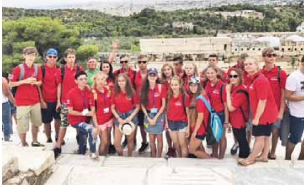
Dziecięco-Młodzieżowy Zespół Ludowy Koderki podczas zwiedzania Grecji, gdzie gościł na International Folk Dance Festiwal w Edipsos.

Poza udziałem w koncertach, zespoły korzystały z uroków greckich plaż i kosztowały regionalnej kuchni, m.in. greckiej musaki (za-