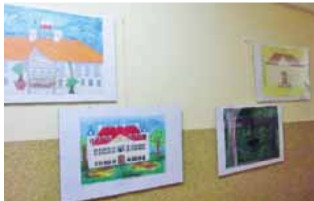
Prace na klatce schodowej Urzędu Gminy w Nieborowie, które udostępniono do oglądania.

Andrzej Czapnik, dyrektor biblioteki w Nieborowie, która przygotowała wystawę, powiedział nam, że prace można oglądać do końca miesiąca przy okazji wizyty w urzędzie. Zachęca on też do obejrzenia wystawy