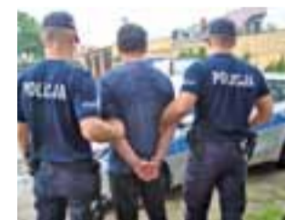
Zatrzymany Rosjanin został tymczasowo aresztowany na 3 miesiące.

19 lipca policjanci z Komendy Wojewódzkiej Policji w Łodzi ujawnili, że na ulicy Ekonomicznej w Łowiczu jest zaparkowany pojazd ciężarowy z naczepą pochodzący z kradzieży, do której