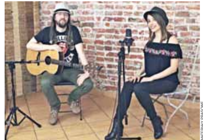
Zespół Acoustic Blues Sessions wystąpi w Barze Plaża.