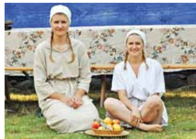
Członkinie zespołu Boczki Chełmońskie tuż przed obrzędem żniwnym miały chwilę na posilenie się jabłkami.