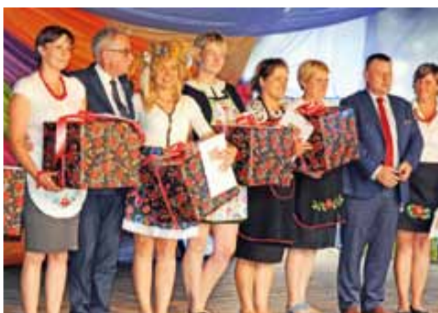
Nagrody odebrały również przedstawicielki wszystkich Kół Gospodyń Wiejskich zaangażowanych w przygotowanie Łowickich Żniw 2017.