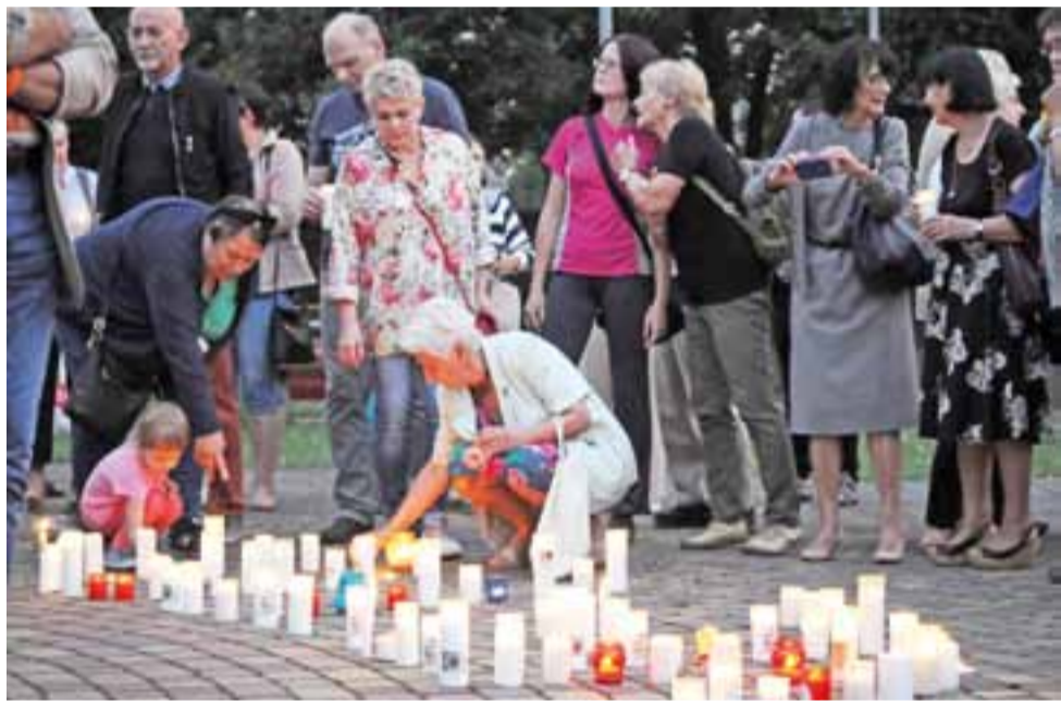
Protestujących przybywało, podobnie jak też i zniczy przed budynkiem sądu - zdjęcie z piątku, 21 lipca.

Zgromadzeni odśpiewali Mazurka Dąbrowskiego i ułożyli znicze w napis VETO. Potem skandowali hasła takie same, jakie tego dnia wznosili protestujący w Warszawie i innych dużych miastach: „wolność, równość, demokracja”, „wolne sądy” i „veto prezyden-