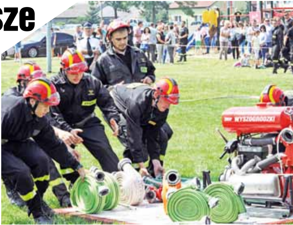
Część druhow z Pilaszkowa podczas tzw. ćwiczenia bojowego.

Druga część zawodów strażackich była bardziej widowiskowa. Na boisku przygotowane zostały dwa stanowiska startowe z dwoma motopompami, które zostały kilka lat temu zakupione przez Urząd Gminy w Łowiczu specjalnie na potrzeby rozgrywania zawodów sportowo-pożarniczych. Motopompy są bowiem praktycznie nieużywane w prawdziwych akcjach ratowniczo-gaśniczych. Pompy montowane w samochodach mają większą wydajność, są wygodniejsze w obsłudze i mniej awaryjne. – Inwestowanie