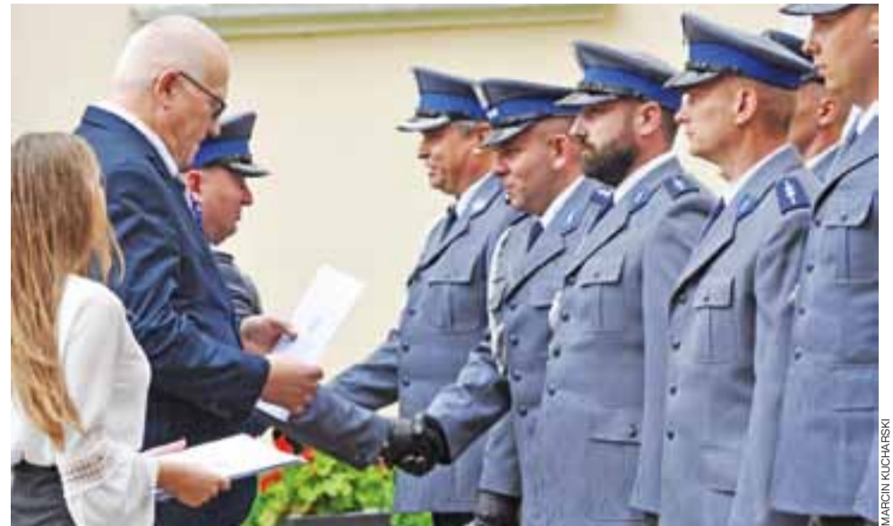
Awanse oraz gratulacje odebrało łącznie 49 funkcjonariuszy łowickiej Komendy Powiatowej Policji.

Zapraszamy do obejrzenia galerii zdjęć na naszym portalu www.lowiczanie.info