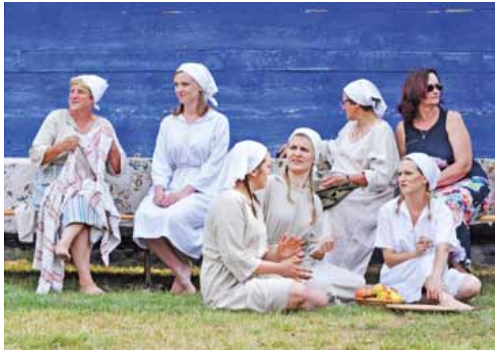
Członkinie zespołu „Boczek Chełmoński” przygotowują się do obrzędu żniwnego.

było również zbadać zawartość cukru we krwi – na stanowisku przygotowanym przez łowicki ZOZ. Były też karuzele, dmuchane zamki do skakania, kule wodne itp. Kilka ciekawych i zabytkowych ciągników oraz motocykli zaprezentowało Muzeum Motoryzacji z Nieborowa.