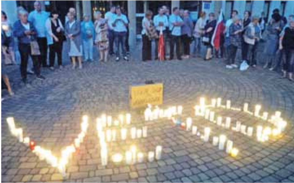
Protestujący ustawili przed łowickim sądem napis „veto” ze zniczy.

W kolejnym proteście, który odbył się o godzinie 21 w piątek, 21 lipca uczestniczyło już nie-