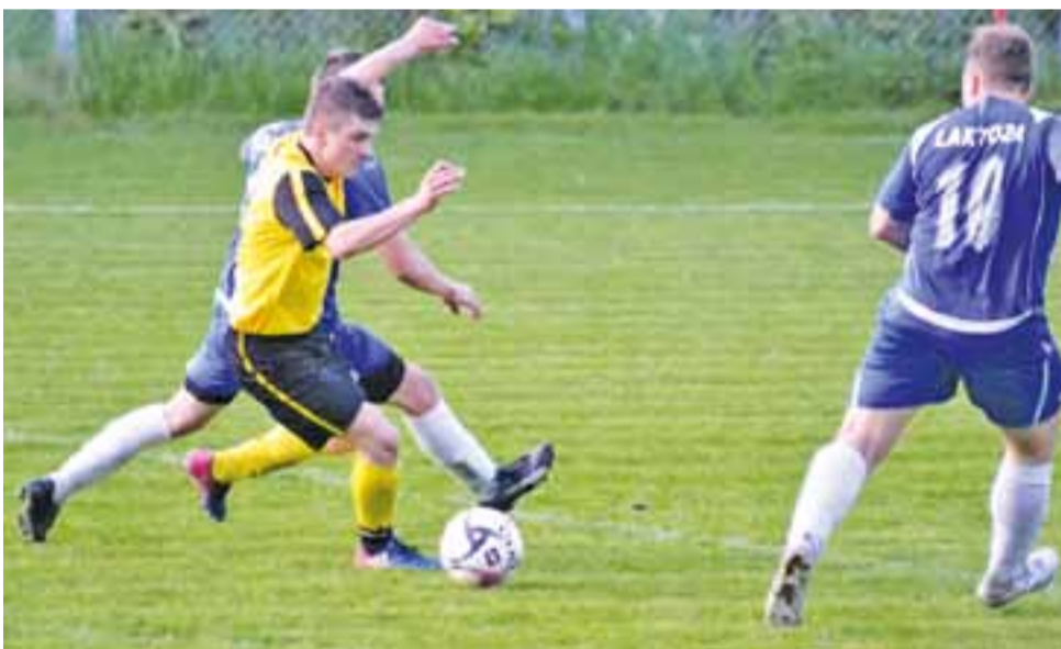
Dar zremisował w pierwszym sparingu z Promykiem Nowa Sucha

Piłka nożna | Skierniewicka Klasa Okręgowa