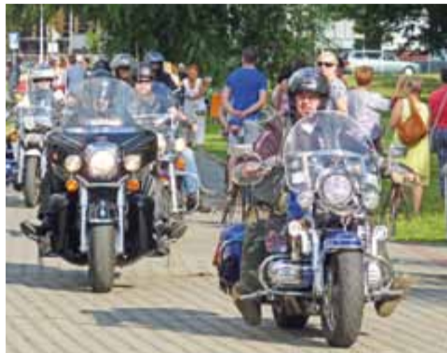
Na 11. urodziny Kubę przybyli też motocykliści z Grodziska Mazowieckiego.