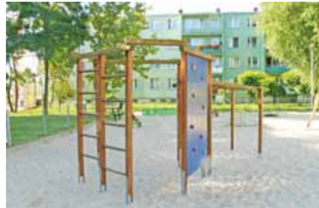
Plac zabaw pomiędzy blokami 4 a 5 na os. Bratkowice ma w tym roku zmienić swój wygląd, stare „zabawki” zastąpione zostaną nowymi.