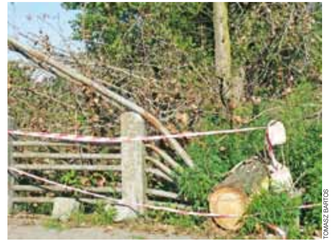
Zniszczone poręcze mostu na kanale Kostka na ul. Kaliskiej. Ciągłe widać, że zniszczeń dokonały konary potężnej topoli.

Obecnie brygady drogowa i wodociągowo-kanalizacyjna działające w ramach ZUK zajmują się głównie realizacją prac utrzymaniowych, które znajdują się w ich kompetencjach; jest to malowanie pasów na jezdniach, łatanie nawierzchni, usuwanie awarii. Nie wykonywanie miejskich inwestycji sprawiło, że ZUK nie zatrudnia już na sezon budowlany dodatkowych pracowników. Uzupełniał w ten sposób trzon swoich brygad, to samo dotyczy zatrudniania więźniów. tb