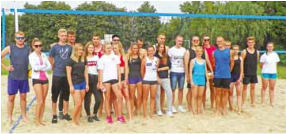
W turnieju mikstów zagrało dwanaście par.

Kolejne zmagania mikstów przewidziane są w kalendarzu imprez sportowych dopiero za rok. zł