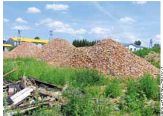
Tak od strony Bzury wygląda obecnie działka, na której stał budynek rzeźni.

Na przełomie maja i czerwca zniknął z panoramy Łowicza budynek dawnej rzeźni miejskiej z ul. Nadburzańskiej Dolnej, pobudowany w 1903 roku. Jego obecny właściciel – przedsiębiorca budowlany z Pszczonowa w powiecie skierniewickim, powiedział nam krótko, że po wykonaniu ekspertyzy okazało się, że nie ma on nawet żadnej izolacji przeciwwilgociowej ścian, więc ratowanie go byłoby zbyt kosztowne.