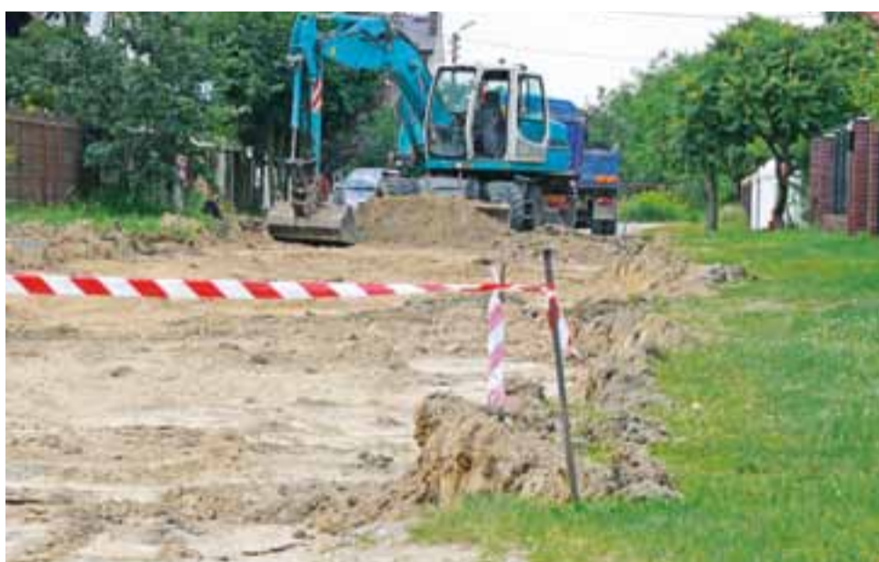
Ulica Kurpińskiego na os. Górki jest rozkopana. Trwa wykonywanie podbudowy pod nawierzchnię z kostki.

Przyjęciu uchwały nie towarzyszyła dyskusja. Po sesji burmistrz na nasze pytania wyjaśnił, że choć nowe stawki opłat za wodę i ścieki weszły w życie od 1 lipca z błędem, to będą one naliczane przez Zakład Usług Komunalnych zgodnie ze sprostowaniem. Czyli mieszkańcy zapłacą od początku miesiąca za 1 m 3 odprowadzonych ścieków 5,81 zł. tb