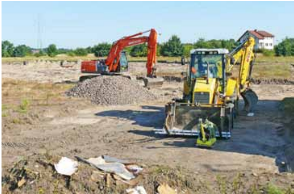
Obecnie koparki przygotowują teren pod wykonanie fundamentów.