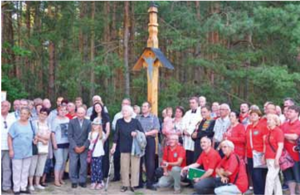
Po uroczystości poświęcenia repliki krzyża wszyscy jej uczestnicy wykonali sobie wspólne zdjęcie jako pamiątkę dla potomnych.

Pamiętający minione stulecie krzyż został już nadzarpnięty zę-