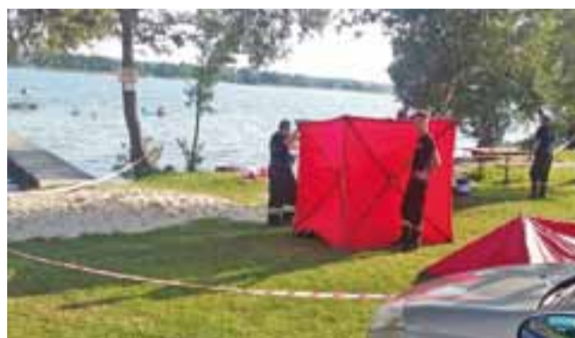
Pomimo reanimacji nie udało się uratować 43-letniego mieszkańca Sannik, którego z Jeziora Białego wyłowili strażacy.

Zgłoszenie o tej tragedii otrzymali gościniści policjanci ok. godz. 15.40. Zgodnie z jego treścią, człowiek ten skoczył z pomostu do Jeziora Białego w powiecie gostynińskim i już nie wypłynął. Na miejsce skierowano służby ratunkowe. Strażacy przy pomocy łodzi motorowej wyłowili mężczyznę. Pomimo podjętej reanimacji 43-latek zmarł. Prokurator zarządził przeprowadzenie sekcji zwłok. – Ze wstępnych ustaleń policjantów wynika, że 43-latek nad jezioro przyjechał z rodziną. Niestety przed wejściem do