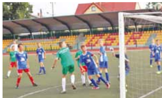
Pelikan 2005 zaczął mecze sparingowe od pewnego zwycięstwa.

– To był pierwszy mecz po dłuższej przerwie, więc była chwila zdziwienia, że drużyna która niedawno powstała może stwarzać groźne sytuacje. Chłopaki nieco się przestraszyli pierwszej groźnej kontry i zaczęli grać trochę nerwowo. Stare nawyki jednak zostają, jak się strzela kilka bramek, wszyscy chcą grać w środku pola, każdy chce strzelić gola i taktyka