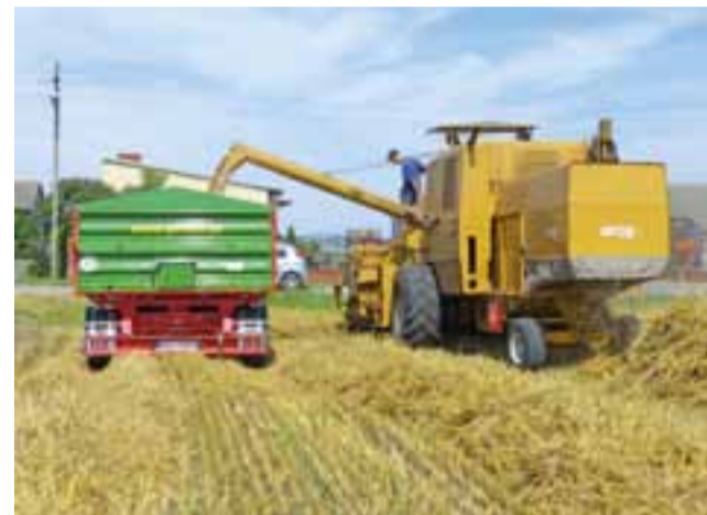
W tym roku rolnicy nie będą raczej narzekać na wydajność zboża. Ci, co je sprzedają, jak gospodarz, u którego robiliśmy to zdjęcie, chcieliby jednak, aby było nieco droższe.

się dostosować, zaczekać – mówi gospodyni. Dodaje też, że jeszcze w ostatnią niedzielę, 30 lipca, nie wszystkie zboża były całkowicie dojrzałe. Wystarczyły jednak dwa upalne dni, aby wyschły do tego stopnia, że na pewno można je kosić. Zwłaszcza gdy są one przeznaczone na paszę – co w Złakowie Borowym i sąsiednich miejscowościach jest powszechne. Bo jeśli zboże miałoby być sprzedane od razu do PZZ, to tam wy-