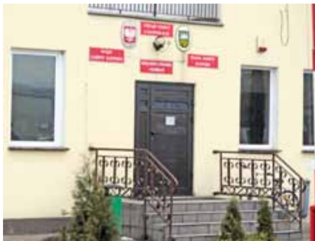
Koszt, jaki poniesie gmina Sanniki w związku nadaniem praw miejskich to m.in. wymiana tablic urzędowych oraz pieczęci.

W związku z nadaniem praw miejskich nie ma konieczności przeprowadzania wyborów samo-