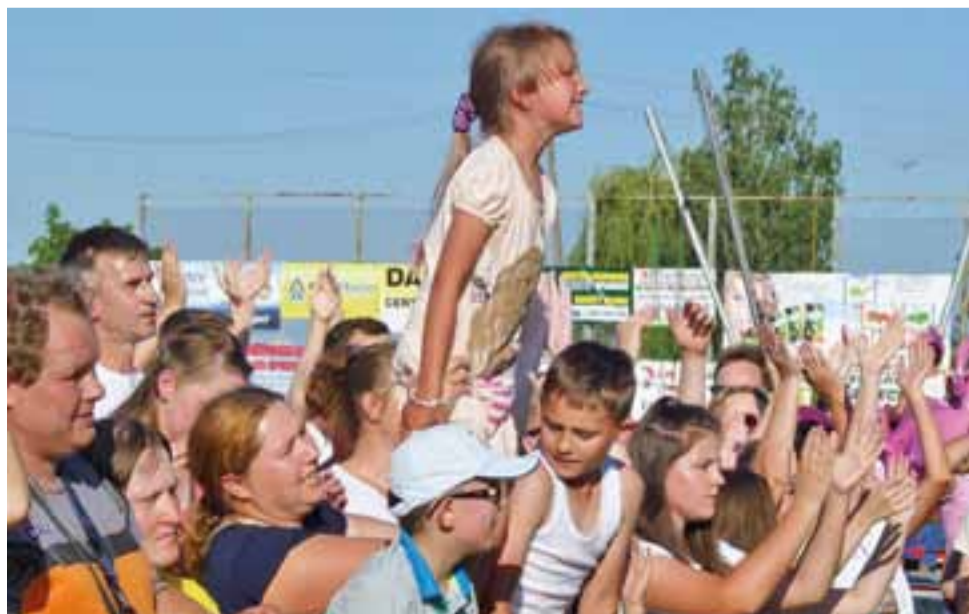
Być jak najbliżej gwiazd, w tym przypadku – muzyki disco-polo. Uczestnicy koncertu prześcigali się w pomysłach, by złapać jedną z płyt rzuconych przez wokalistę zespołu Bayera.