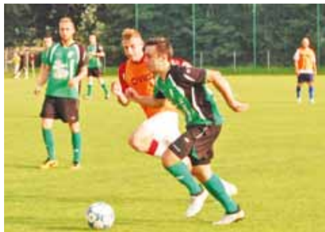
Zespół Pelikana II Łowicz już za tydzień zaczyna zmagania w IV lidze.