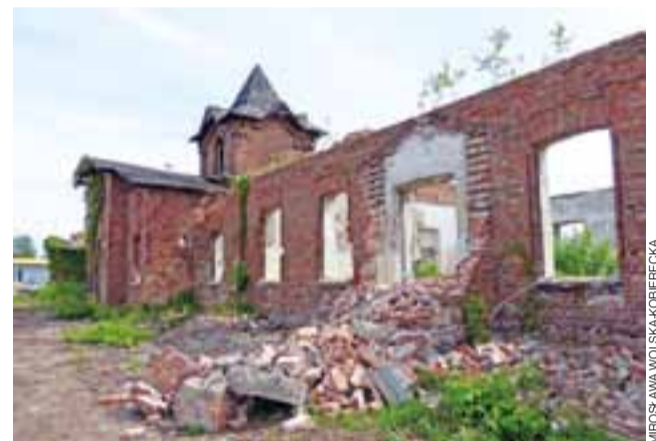
A tak jeszcze w ubiegłym roku wyglądał budynek rzeźni przy ul. Nadburzańskiej.

– Szkada tego obiektu – powiedział nam łowicki przedsiębiorca, prowadzący nieopodal swoją działalność. W jego odczuciu to polityka miasta sprzed 20 lat, polegająca na pozbywaniu się wielu obiektów, także przemysłowych,