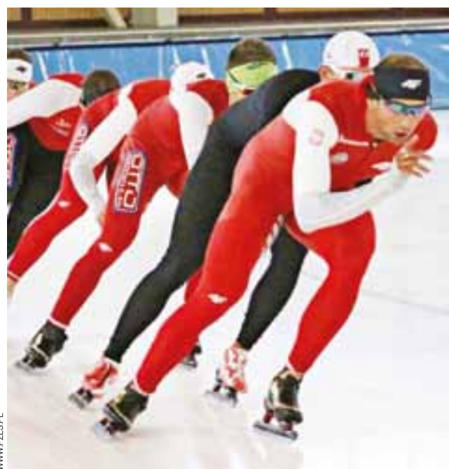
Nasi kadrowicze na zgrupowaniu w Berlinie.

SOBOTA, 12 SIERPNI: ■ 9.00 – Boisko przy I LO im. Józefa Chełmońskiego w Łowiczu, ul. Bonifraterska 3; II turniej eliminacyjny XVI edycji Otwartych Mistrzostw Łowicza w siatkówce plażowej; ■ 11.00 – Stadion OSiR im. 10 PP w Łowiczu, ul. Jana Pawła II 3; Sparingowy mecz piłki nożnej juniorów starszych A1: MUKS Pelikan-1999 Łowicz – UKS Piotrcovia Piotrków Trybunalski. Gogo