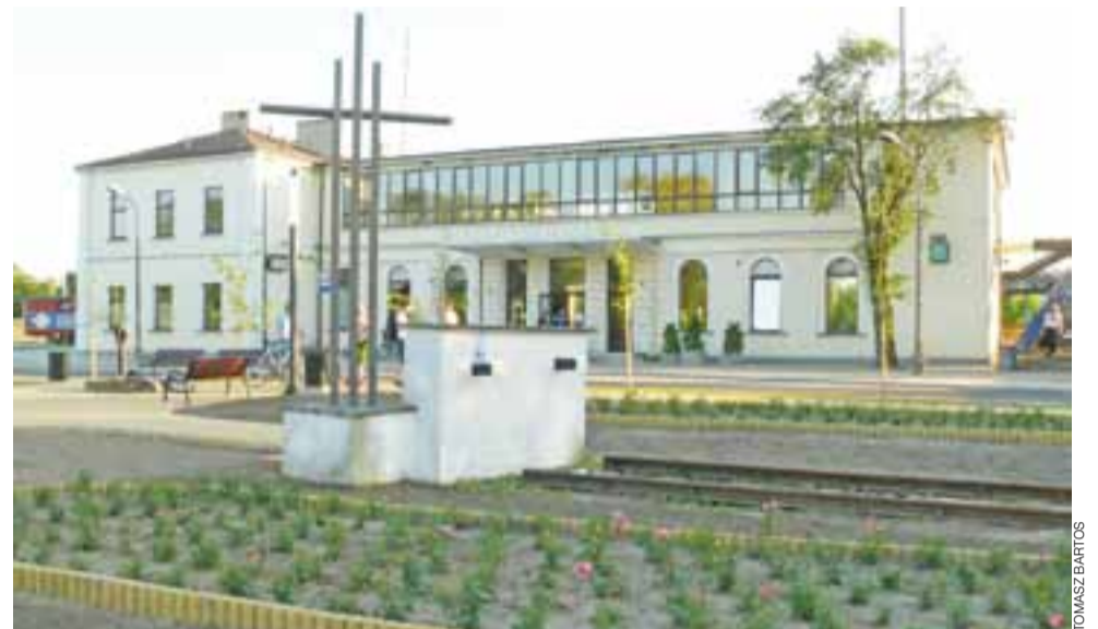
Skwer przy dworcu Łowicz Główny został już doprowadzony do ładu, rosną na nim róże i drzewa, niebawem pojawi się trawa.

Wiele osób zwracało nam uwagę, że skwer przed dworcem Łowicz Główny, na którym wycięte zostały niemal wszystkie drzewa w czasie przebudowy ulicy Dworcowej, został zamieniony w pustynię. Dziś jednak, po skończonym pracach przy zagospodarowaniu i dokonanych nasadzeniach, miejsce to można odkryć na nowo, jako przyjazne dla oka, choć brakuje jeszcze trawy na trawnikach.