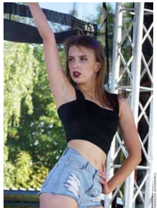
Tancerki grupy Bayera podgrzewały atmosferę skąpym strojem i energicznym tańcem.