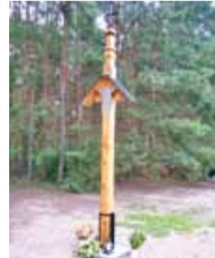
Replika XIX-wiecznego krzyża w Świącach została ustawiona 8 lipca.

eksponowany. Sobotnia uroczystość poświęcenia była zwieńczeniem akcji ratowania krzyża. Wzięli w niej udział członkowie PTTK oraz kilkudziesięciu mieszkańców Świąc i wsi położonych w najbliższym sąsiedztwie. – Jestem pełen podziwu dla wszystkich, którzy zaangażowali się