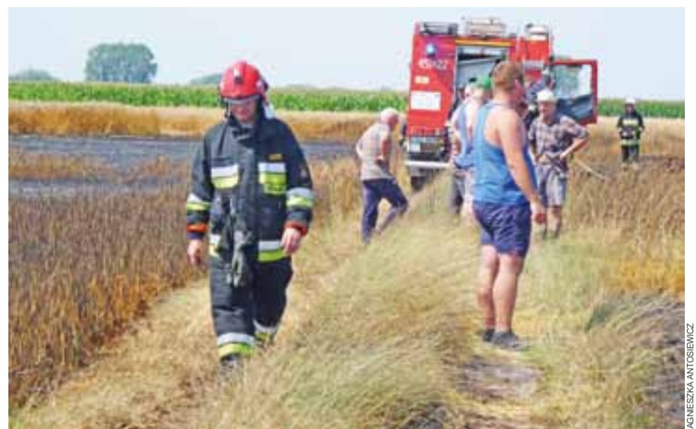
Strażacy i rolnicy połączyli siły w walce z pożarem na polach w Róźycach i Wejscach.

– Na naszym polu była pszenica, nic w sumie nie zostało. Każdy jest roztrzęsiony, bo wiado-