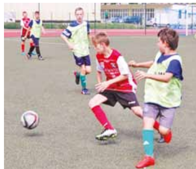
Pelikan 2004 przygotowuje się z nowym trenerem.

■ Sparingi MUKS Pelikan-2004 Łowicz: 2017.08.04 (ptk), godz. 13.00: MUKS Pelikan-2004 Ło-