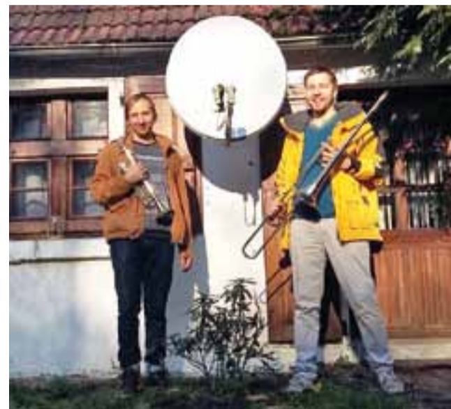
WCIAS (We Call it a Sound).