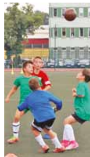
Młodzi zawodnicy w pierwszym sparingu zremisowali.

■ Sparingi MUKS Pelikan-2006 Łowicz: 2017.08.02 (śr), godz. 14.00: MUKS Pelikan-2005 Łowicz – MUKS Pelikan-2006 Łowicz, 2017.08.09-17 (śr-cz): Obóz sportowy w Jantarze, 2017.08.19