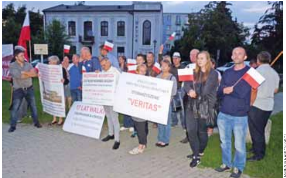
Na Końskim Targu, z transparentami, kontrmanifestowało środowisko Klubu Gazety Polskiej, partii Wolni i Solidarni oraz osób, które czują się pokrzywdzone przez sądy.

Łowicz | Konflikt wokół reformy sądownictwa