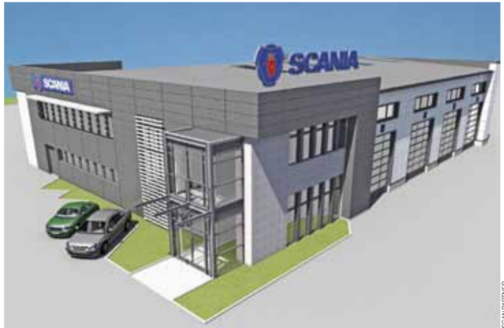
Wizualizacja budynku stacji, który ma stanąć przy ul. Prymasowskiej już na początku 2018 roku.

Łowicz | Skan-Partner buduje swoją nową siedzibę