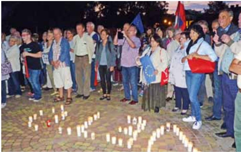
Spotkaniu przed sądem tradycyjnie towarzyszyło utworzenie napisu „Veto” ze świeczek.