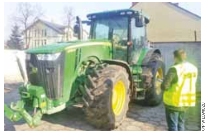
Na naszym terenie nie spotkamy ciągnika takich gabarytów jak ten skradziony na Dolnym Śląsku John Deere o mocy 360 KM.

Poza tym samobieźna ładowarka to sprzęt drogi i chodliwy. Można przypuszczać, że jest na niego popyt, dlatego jest kradziony. Średniej jakości ładowarka kosztuje około 250 tys. zł netto. Irytacji, a nawet wściekłości rolników, na złotówki nie da się przeliczyć. ■