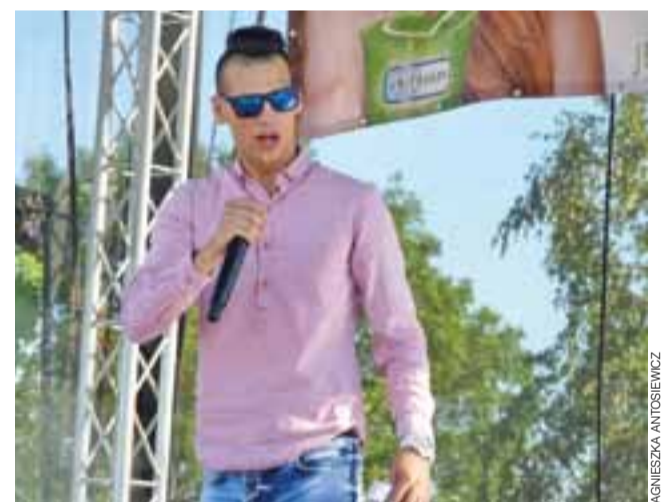
Wokalista zespołu Bayera – na jego punkcie zwirowały fanki.