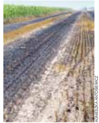
Tak wyglądało rżysko po pożarze. Stapało się po nim jak po rozżarzonych węglach.

Mniejsze arealy traw i rżysk paliły się m.in w Piotrowicach, aa