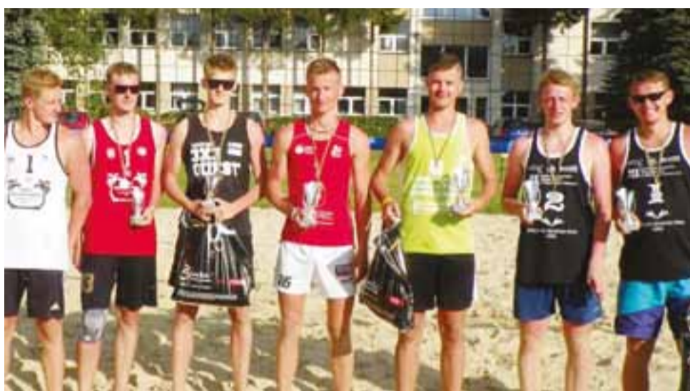
Najlepsze pary 1. turnieju eliminacyjnego.