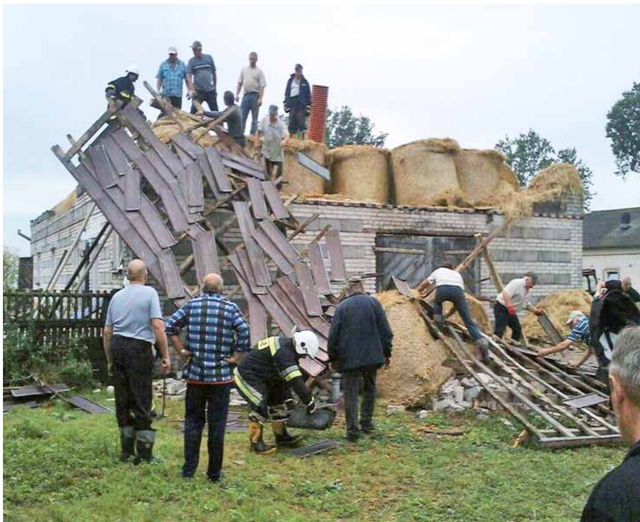
Prace nad rozbiórką pozostałości dachu na budynku inwentarsko-składowym w Wejskach.