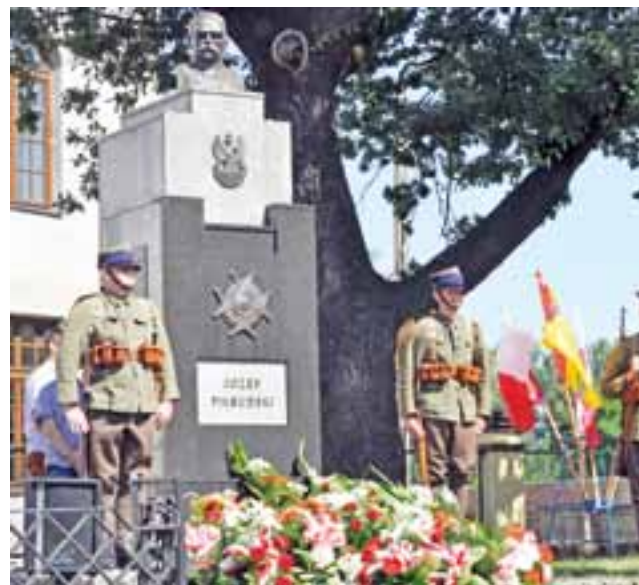
Wartę pod pomnikiem Józefa Piłsudskiego wystawiło Stowarzyszenie Historyczne im. 10 Pułku Piechoty.

Uczestnicy protestu wskazywali, że ich gehenna trwa nieraz po kilka a nawet kilkanaście lat: 10 lub nawet 17, o takich liczbach można było usłyszeć. aa