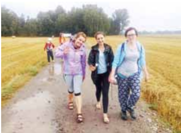
Pielgrzymi chwilę po burzy. Zmęczeni, ale zadowoleni. Zdjęcie z początku pielgrzymki, 10 sierpnia.

lat na Jasną Górę wchodzi w stroju łowickim. Strój łowicki jedzie razem z nią „na pacy” lub dowożą jej znajomi czy rodzina.