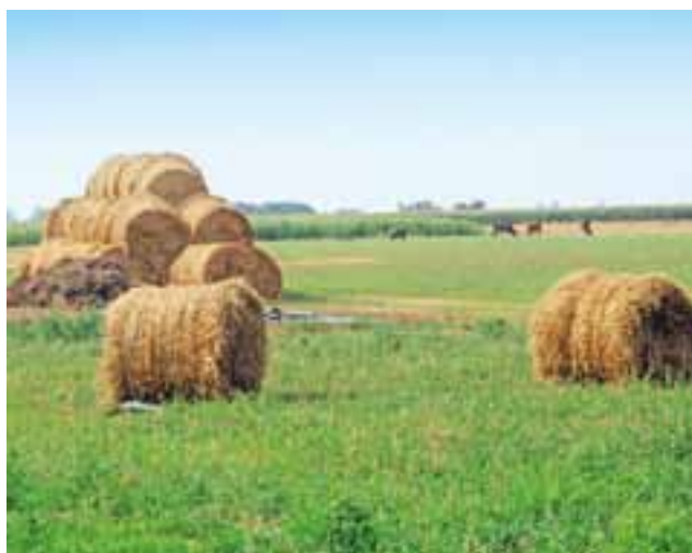
Baloty słomy, które mogą ważyć nawet i 200 kg, podczas wichury „frwały po polu” w Lwówku w gminie Sanniki.