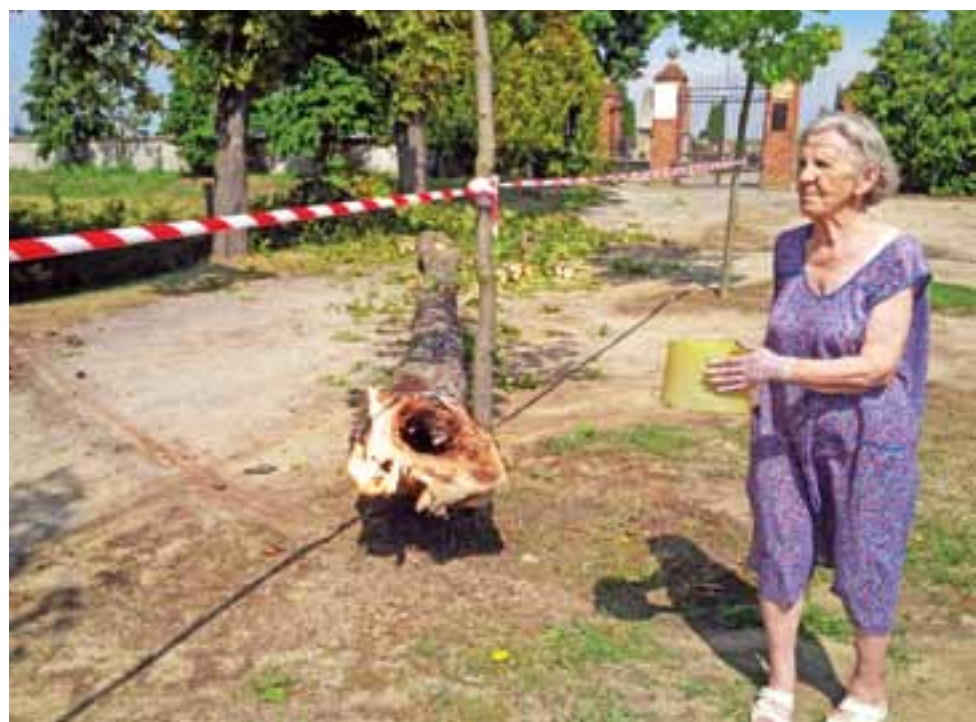
Cmentarz w Ziarkowie Kościelnym nie ucierpiał. Spróchniała gałąź kasztanowca upadła natomiast tuż przed wejściem.