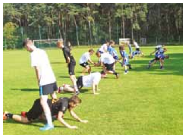
Trening otwarty poprowadzili w Bełchowie trenerzy programu Kluby Orange.

– Rodzice są dla dzieci największym autorytetem – nic więc dziwnego, że młodzi sportowcy zaangażowani w program Kluby Sportowe Orange tak bardzo chcą włączyć rodziców do swoich sportowych aktywności. W Bełchowie, podczas spotkania z Trenerami Orange, zobaczyli jak ćwiczenia sprawdzają się we wspólnych aktywnościach z rodzicami – mogliśmy przeczytać w komunikacie prasowym Klubów Orange.