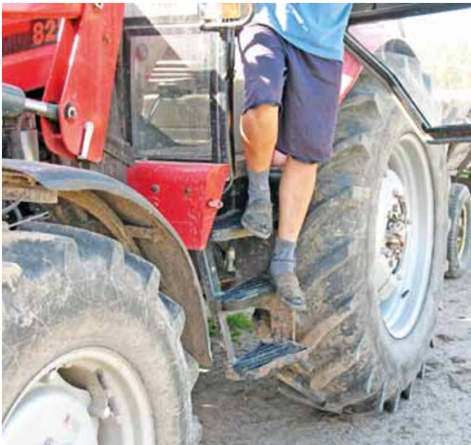
Zdjęcie przedstawiające nieprawidłowy sposób schodzenia z ciągnika (rolnik powinien schodzić przodem do stopni) oraz nieprawidłowe obuwie robocze.

Według statystyk w pow. łowickim najczęściej dochodzi do wypadków podczas wykonywania następujących prac gospodarskich: przemieszczanie się bez obciążenia (np. z domu do budynku inwentarskiego, z jednego budynku do drugiego, z podwórka na pole – 25,7% wszystkich zgłoszeń, obsługa zwierząt – 25,7%, ręczne prace transportowe – 8,6% oraz obsługa i eksploatacja maszyn rolniczych – 8,6%.