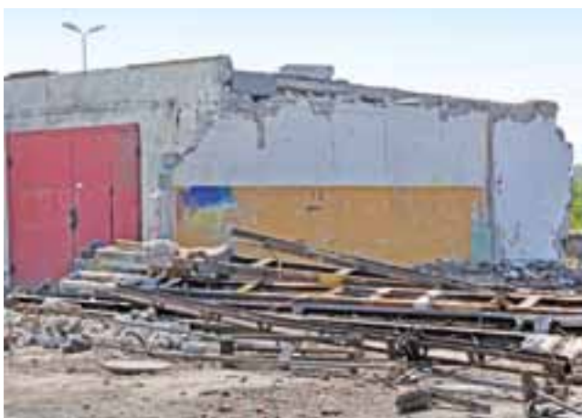
Część starych magazynów będzie wykorzystywana w najbliższych miesiącach jako zaplecze budowy.

Wcześniej wyburzone zostały częściowo wykorzystywane przez kolej budynek magazynowe stojące w tym miejscu. Naprzeciwko – w parterowych budynkach znajdują się pomieszczenia wykorzystywane przez pracowników PKP PLK. – Szkoda, że od razu nie wyburzyli wszystkiego, byłby większy porządek na placu – narzekał pracownik PKP PLK. Całkowiciego wyburzenia firma nie prze-