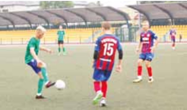
Zawodnicy grali przy padającym deszczu.

Drugi mecz kontrolny mają za sobą juniorzy starsi Pelikana Łowicz. Zespół złożony z zawodników z roczników 1999 i 2000 tym razem zremisował z UKS Piotrcovią Piotrków Trybunalski 1:1.