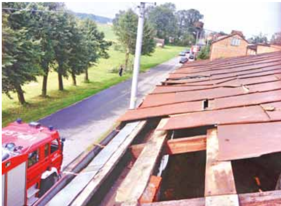
Po wichurze. Tutaj dach został częściowo zupełnie zerwany, a częściowo uszkodzony tak, że wymaga wymiany.