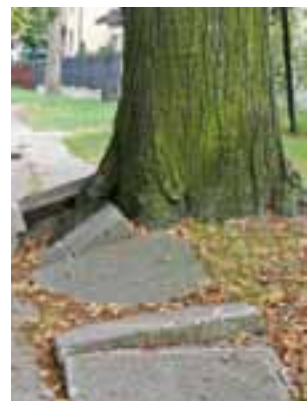
Chodnik przy ul. Żwirki i Wigury cztery lata temu był naprawiany przez ZUK, stan się poprawił, ale mieszkańcy chcą kostki zamiast starych płyt.

Przypomnijmy, że Wig-Kost wykona nowy chodnik wzdłuż ul. Żwirki i Wigury za 127 tys. zł. będzie on miał długość 635 m i szerokość 1,5 m, przy blokach tzw. kolejowych szerokość ta wzrośnie do 3,3 m. Kolejne 82 m chodnika powstanie wzdłuż ul. Poprzecznej w kierunku placu zabaw przy ul. Arkadyjskiej. Utwardzony też będzie niewielki odcinek pomiędzy ul. Poprzeczną i ul. Arkadyjską o zmiennej szerokości od 4,4 m do 1,57 m.