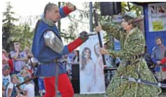
Pokaz polskiej sztuki walki szablą husarską i palcatami w wykonaniu w wykonaniu Signum Polonicus zgromadził wielu widzów.