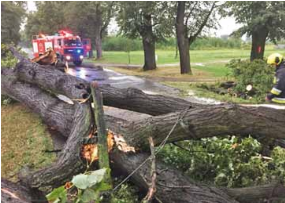
Jedno z trzech drzew powalonych na drodze z Nieborowa do Bolimowa pod Łasiecznikami.

NASI DZIENNIKARZE DO WASZEJ DYSPOZYCJI OD 8.30 DO 15.30 Telefon redakcyjny 500 105 803 e-mail: marcin.kucharski@lowiczanie.info MARCIN KUCHARSKI