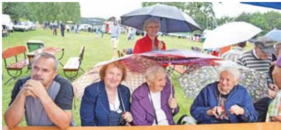
Deszczowe rozpoczęcie imprezy – uczestnicy kryli się pod parasolami, ale z ich twarzy nie zniknęły uśmiechy.

Niedawno podano, że w samym tylko Londynie w ostatnich 15 latach zlikwidowano już 500 kościołów, za to powstało ponad 400 meczetów. Niewesoło jest we Francji, Belgii i w Niemczech. Także w Szwecji. Włosi nie mogą sobie poradzić z ciągle dobijającymi do ich wybrzeży kolejnymi tysiącami zmierzającymi do europejskiego raj. Grecy, choć sami mają gigantyczne problemy, też coś na ten temat wiedzą. A potem w tym raj. emigranci (zwykle młodzi, silni i popędliwi seksualnie) doznają frustracji, bo spodziewali się znacznie więcej niż dostali. I jeszcze sugeruje się im, że mają pójść do pracy. Niejeden koń rasy arabskiej by się uśmieł. A Polska europejskim liberalom podpada, bo nie chce być piątym kołem u wozu. Traktowanym lekceważąco, ale przecież koniecznym. Na dodatek współczesna Targowica nie zamierza zaprzestać szkalowania własnego kraju. Czy dla niej „ten kraj” (jak często mówią) jest Ojczyzną w pełnym tego słowa znaczeniu? Mocno wątpię. ■