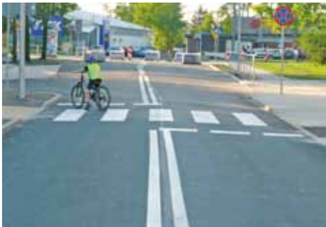
Ulica Dworcowa pozostanie zamknięta dla ruchu do poniedziałku, kierowcy muszą poczekać jeszcze kilka dni.

W poniedziałek otwarta zostanie cała ul. Dworcowa oraz parking, na którym znajduje się 177 miejsc postojowych, w tym 6 dla osób niepełnosprawnych. Kierowcy już od popołudnia będą mogli bez żadnych przeszkód wjechać pod dworzec.