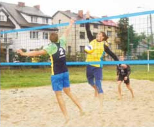
W finale zabrakło tym razem łowickich par.