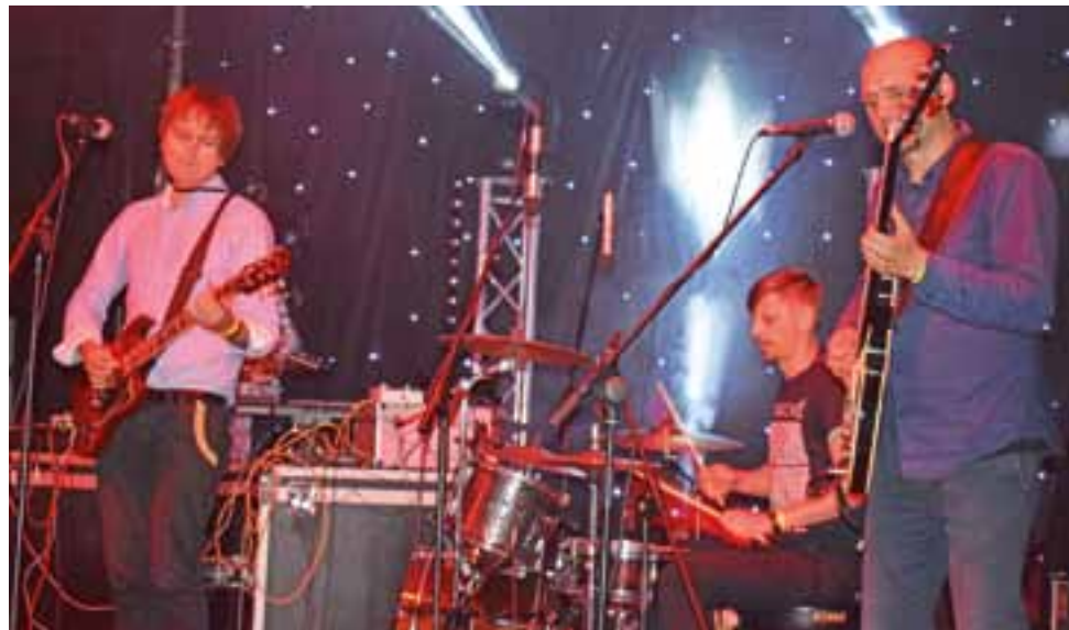
Trupa Trupa – można powiedzieć, że to gwiazda tegorocznego Ł Festiwalu. Wielu miłośników zespołu przybyło do Łowicza specjalnie na ten koncert.

Kolejnym wykonawcą była Trupa Trupa – wielu naszych rozmówców mówiło, że przyszli bądź przyjechali szczególnie