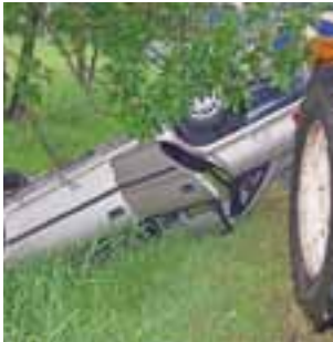
Opel Astra po dachowaniu został wyciągnięty z rowu przy pomocy ciągnika.

Z kolei na następnym zakręcie w stronę Arkadii w rowie znalazło się Audi A6. Kierował nim 73-letni