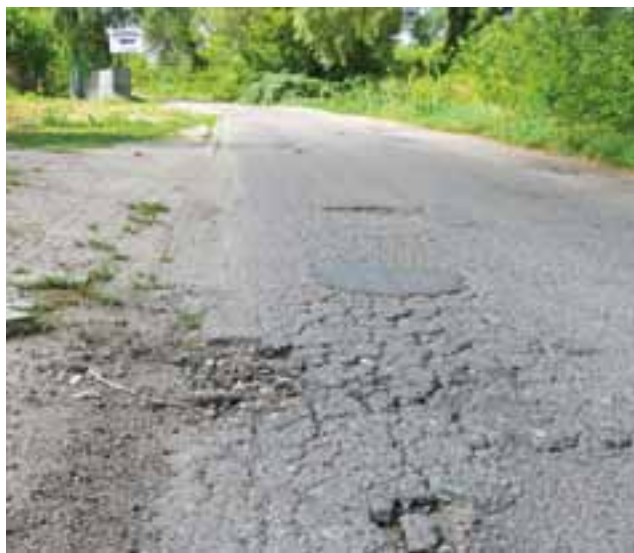
Spękany asfalt na ul. Czajki w sąsiedztwie skrzyżowania z ul. Katarzynów.

Burmistrz Krzysztof Kaliński powiedział nam, że problem z krzakami rosnącymi przy murze bazy kolejowej wynika w dużej mierze z własności terenu. Pobocze, na którym one rosną, nie należy do miasta, ale do kolei. – Zwrócimy się po raz kolejny o możliwość usunięcia tych krzaków do kolei, zrobimy to własnymi siłami – zadeklarował. Dodał też, miasto już interwencyjnie usunęło te gałęzie, które najbardziej zagrażały bezpieczeństwu.