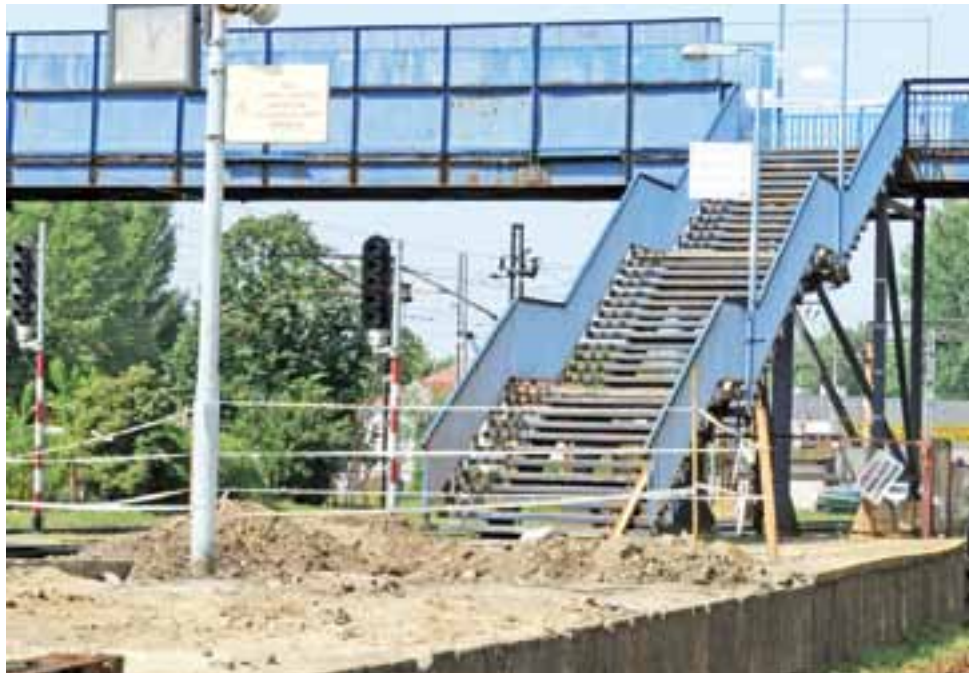
Niebieska kładka – niedługo będzie to już ujęcie archiwalne. Zejście na peron 1 już teraz jest niedostępne dla podróżnych.

Jeśli nie będzie możliwości dojścia na peron 2 od tej strony, to będzie można na niego dostać się wyłącznie przez przejście, które już jest przygotowywane na wysokości drzwi prowadzących do budynku dworca – od strony peronów (tam, gdzie często do ogro-