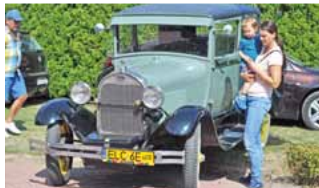
Zabytkowy Ford oraz wiele innych pojazdów, prezentowało stowarzyszenie miłośników starej motoryzacji „Retro Łowiczanka”.