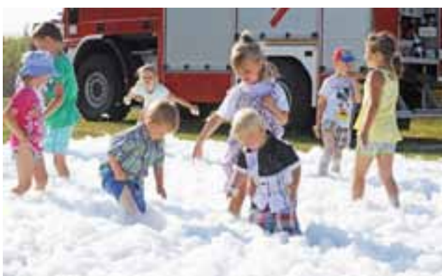
Jedną z atrakcji dla najmłodszych była piana, którą wylali na trawę strażacy z OSP w Bąkowie Górnym.