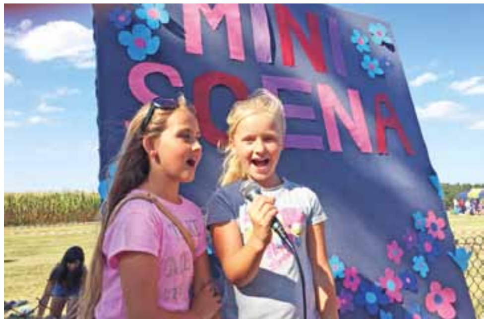
Występy na Małej Scenie: najchętniej swoje ulubione piosenki śpiewały dziewczynki. Chłopcy byli w mniejszości.