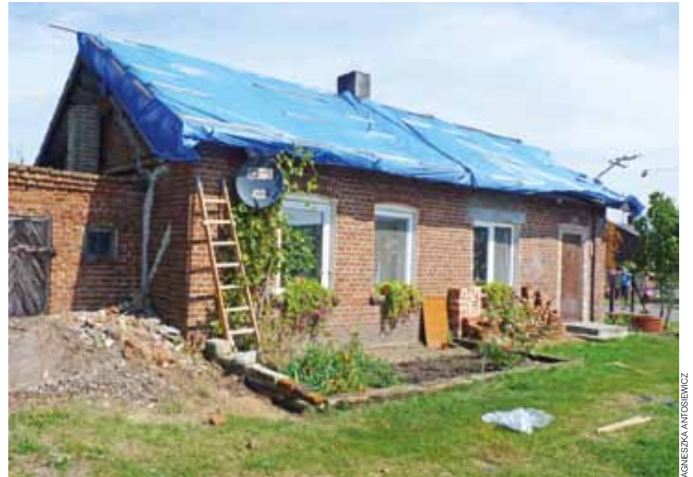
Zerwany dach na domu mieszkalnym w Bielawskiej Wsi.

Po nawałnicy | Szkody są na całym terenie, ofiar na szczęście nie było