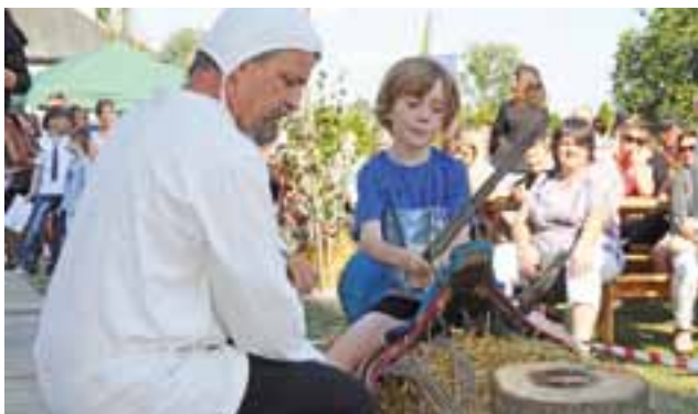
Podczas mini biegu rycerskiego należało m.in. siedząc na siodle przeciąć mieczem lub szablą jabłko na pierku.