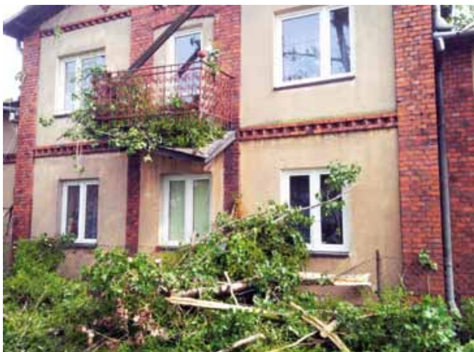
Na budynku dawnego „domu nauczyciela” w Lwówku drzewo oberwało balkon oraz zniszczyło ogrodzenie.

Gdy poszkodowani mieszkańcy, z ogromną pomocą strażaków, zaczęli naprawiać uszkodzenia budynków i urządzeń spowodowane przez czwartkową burzę, byli przy nich w kilku miejscach na naszym terenie dziennikarze Nowego Łowiczana. Oto ich fotoreportaż z tych trudnych godzin.