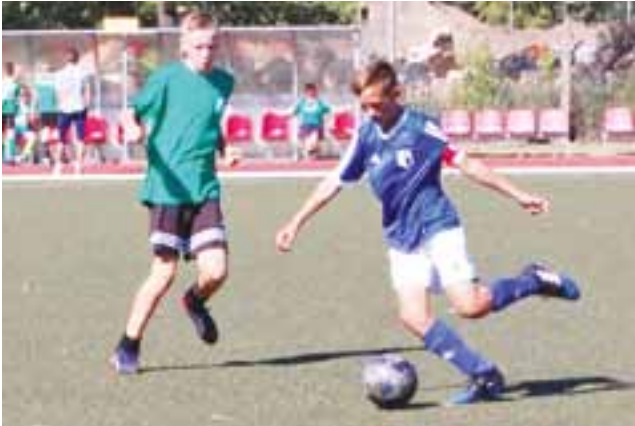
Pelikan 2004 (zielone stroje) nie dał szans Laktozie.

■ UMKS Pelikan-2004 – GLKS Laktoza Łyszkowice 13:0 (7:0)