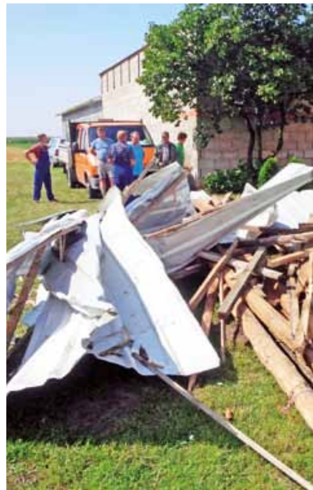
– To wszystko latało po podwórku – relacjonowali świadkowie z Lwówka. Blacha i konstrukcja tego dachu wcześniej spadła na zaparkowany nieopodal samochód.