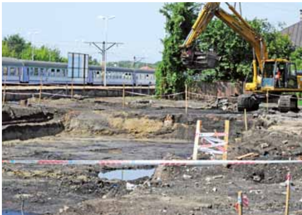
W tym miejscu powstanie budynek nowej nastawni – Lokального Centrum Sterowania.

Obecnie prowadzone są prace ziemne, a sam budynek ma powstać jeszcze w tym roku. Lokalne Centrum Sterowania jest miejscem, w którym system komputerowy pod nadzorem dyżurnych ruchu steruje ruchem kolejowym. W tym miejscu zintegrowane mają być systemy komputerowe, liniowe i stacyjne.