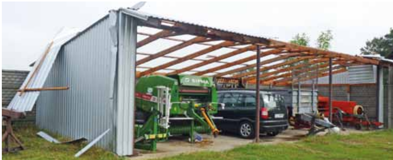
W Mystkowicach wiatr zerwał dach z wiaty, pod którą przechowywany był sprzęt rolniczy i samochód.

Nie tak daleko, również w Mystkowicach Małych, wiatr porwał blaszane garaże i przerzucił je kilkanaście metrów dalej, na podwórko sąsiada. – Potwornie grzmiało, słychać było tylko szum i porwało te garaże, nawet nie było wiadomo