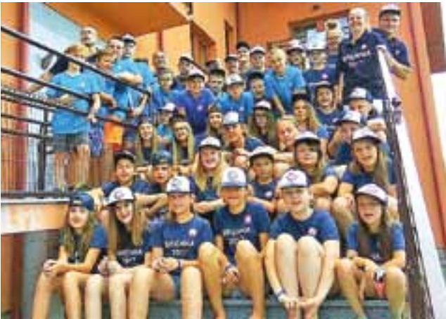
Liczna koszykarska ekipa na zgrupowaniu w Brennej.

Koszykarki i koszykarze UMKS Księżak Łowicz przygotowują się do nowego sezonu na obozie sportowym w Brennej. Ze zgrupowania wrócą w sobotę 19 sierpnia.