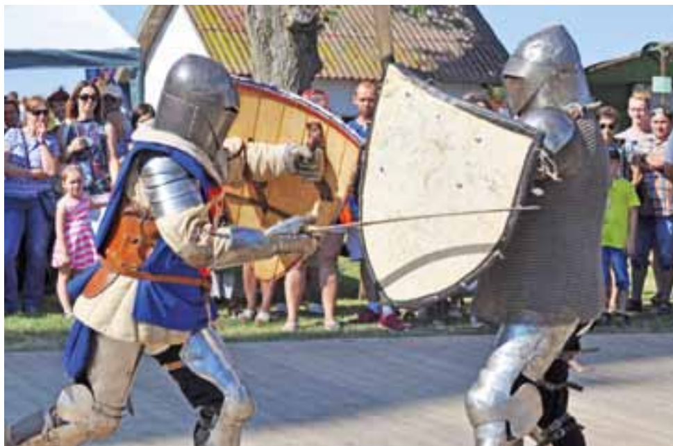
Pokaz walk rycerskich odbył się na drewnianych deskach przed sceną. Ze względów bezpieczeństwa publiczność musiała się nieco odsunąć.

Baków | XV Festyn Rodzinny – Bawiły się całe rodziny