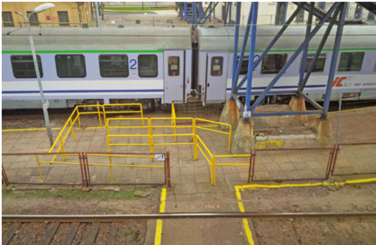
Na peron drugi będzie można się dostać wkrótce wyłącznie przez przejście zabezpieczone „labiryntem”.

ciach, ale wiemy, że stanie się to lada dzień – powiedział nam szef łowickich funkcjonariuszy SOK Sylwester Przybysz.