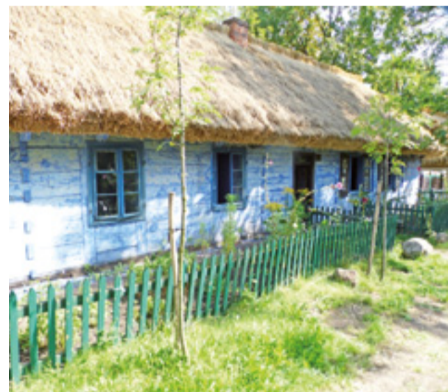
Strzecha na chałupach w mini skansenie. Chciałoby się krzyknąć: „Nareszcie!”.