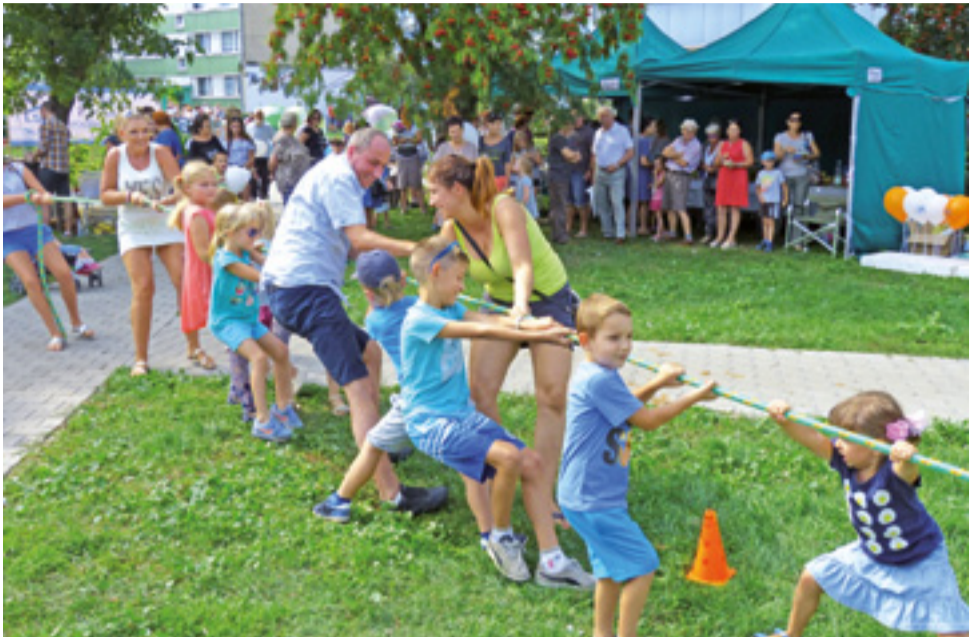
Przeciąganie liny to zabawa, do której nigdy nie brakuje chętnych. Tym razem rywalizację rozpoczęły dzieci, ale stopniowo mogli dołączyć do nich rodzice.