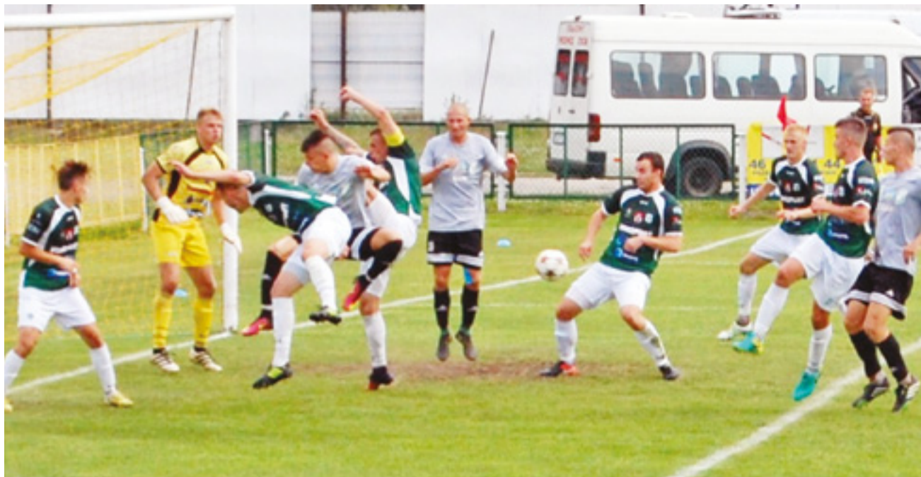
Stale fragmenty gry miały być groźną bronią Ptaków, ale to Sokół objął prowadzenie po rzucie różnym.

Piłka nożna | Relacja z meczu Pelikan – Sokół Aleksandrów Łódzki