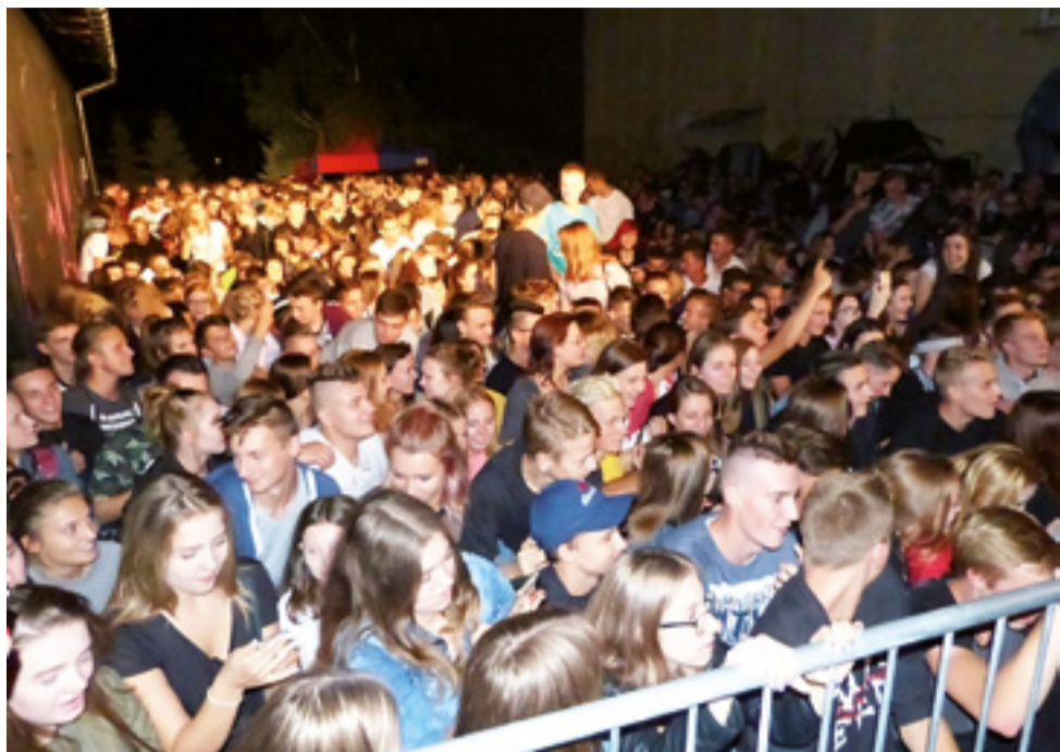
Na dziedzińcu ŁOK pomieściło się około 700 osób. Tak to wyglądało od strony sceny.