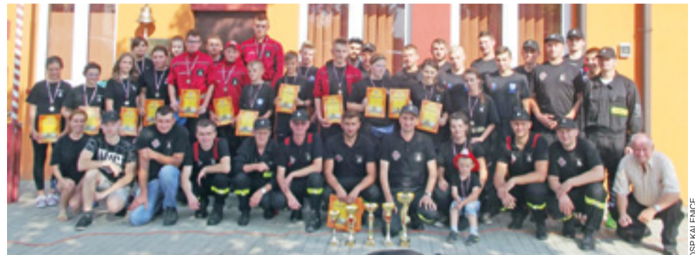
Starsi i młodszy druhowie z jednostki OSP Kalenice, przez swoją remizę, już po zawodach.

Jak pisaliśmy przed tygodniem, faworytem rywalizacji w grupie A