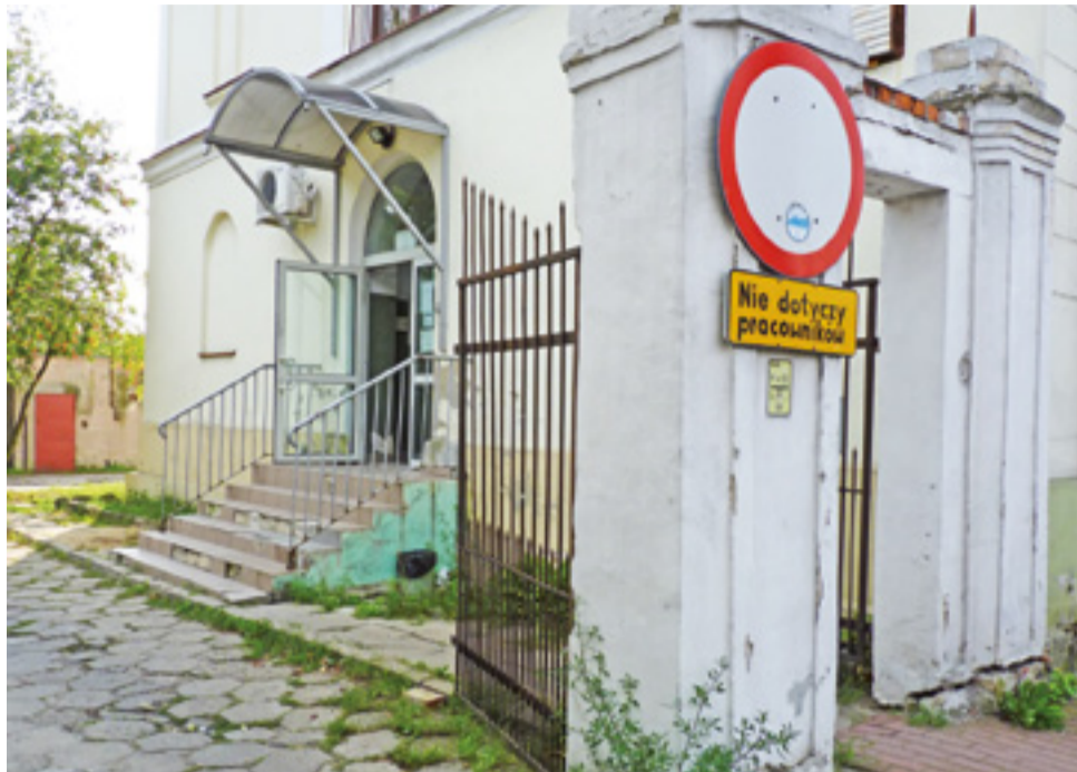
Biurowo powiatowej Agencji Restrukturyzacji i Modernizacji Rolnictwa w Łowiczu mieści się przy ulicy Świętojańskiej.

Jak dowiedzieliśmy się w biurze prasowym ARiMR, głównymi zadaniami tej agencji są: wypłata rocznych dopłat bezpośrednich (co roku wnoszą wnioski o ich przyznanie składa ok. 1,34 mln rolników); udzielanie wsparcia z unijnych programów pomocowych dla rolnictwa (Program Rozwoju Obszarów Wiejskich na lata 2014-2020) i rybactwa (Program Operacyjny Rybactwo i Morze na lata