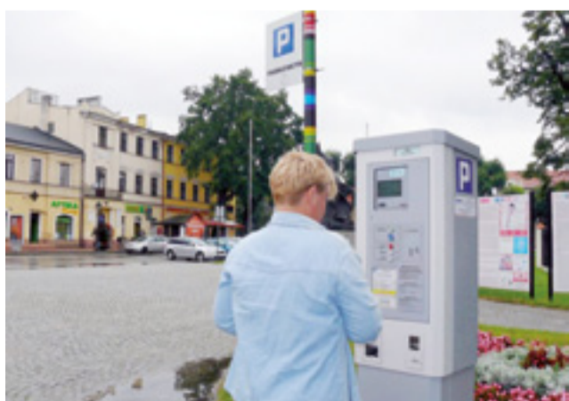
Od piątku, 1 września, zmienia się firma obsługująca Strefę Płatnego Parkowania, prawdopodobnie zmienią się także parkomaty, bez zmian pozostanie natomiast wysokość opłat.

W przetargu wystartowało dwóch oferentów, wymienione już konsorcjum oraz City Parking Group z Grudziądza, która obsługą strefy zajmowała się przez ostatni rok. Do wyboru konsorcjum firm z Poznania skłoniła ratusz cena – zaproponowało ono za usługę 16.605 zł miesięcznie. Przez cały okres obowiązywania umowy będzie to 265.680 zł. City Parking Group zaproponował wyższą stawkę miesięczną – 17.779 zł.