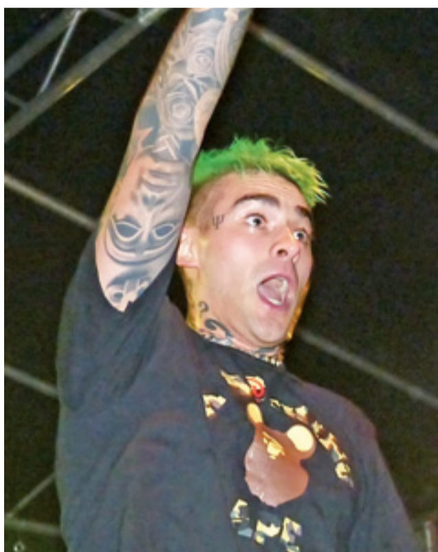
Quebonafide podczas koncertu w Łowiczu zachęcał młodzież do wspólnej zabawy. Robił to skutecznie.