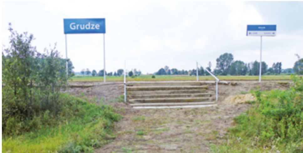
Wszyscy zgadzają się, że przystanek nie może dalej wyglądać w ten sposób i powinien zostać przeniesiony. Nie ma jednak zgody, co do jego nowej lokalizacji.