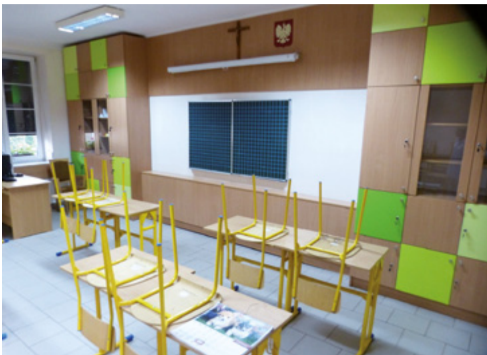
Pracownia dla najmłodszych klas Pijarskiej Szkoły Podstawowej w Łowiczu zaraz po umeblovaniu.

Szkoła poważnie myśli jeszcze o kolejnych pracach, takich jak: wymiana pieca c.o. w kotłowni, ocieplenie i otynkowanie popękane go komina na kotłowni, naprawa tablicy zasilającej z bezpiecznikami, wyposażenie ekopracowni w meble i pomoce dydaktyczne do chemii i fizyki.