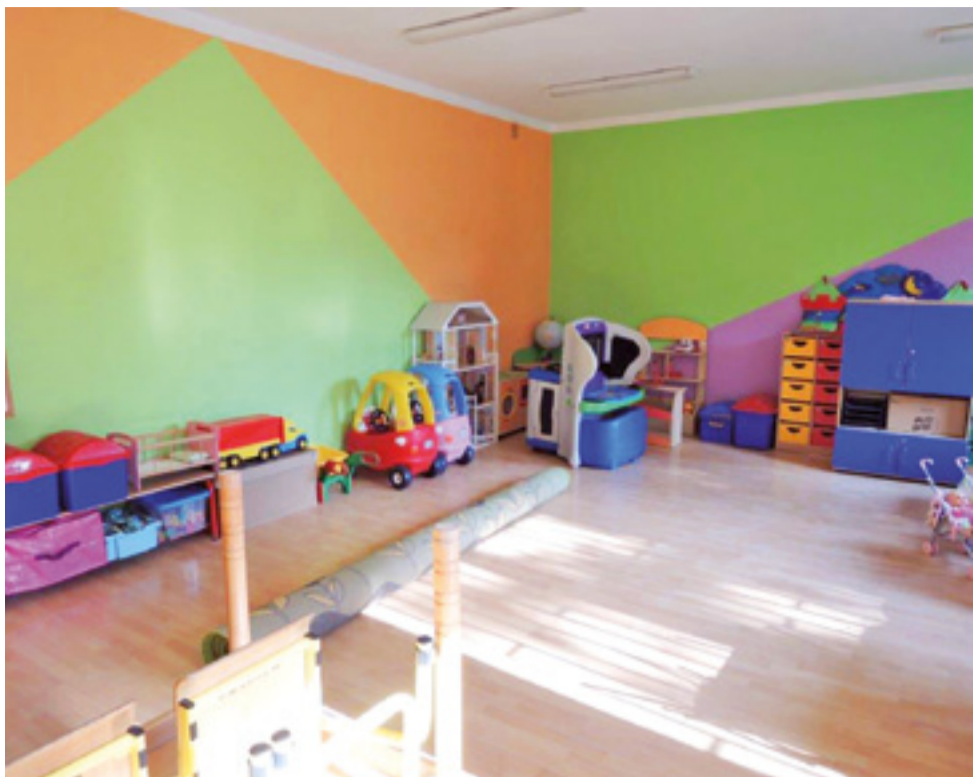
Odświeżone sale przedszkolne w szkole w Kocierzewie czekają na powrót przedszkolaków.

tarza zapłacono z budżetu rady sołectwa Dąbkowic Dolnych, a resztę z budżetu gminy.