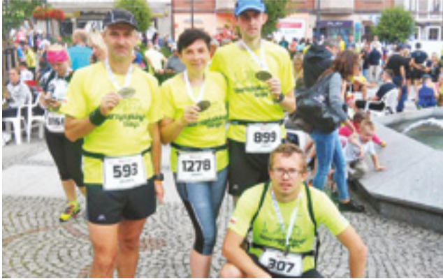
Najmocniejsi biegacze reprezentacji Starzyńskiego Biega na zawodach w Wałbrzychu.