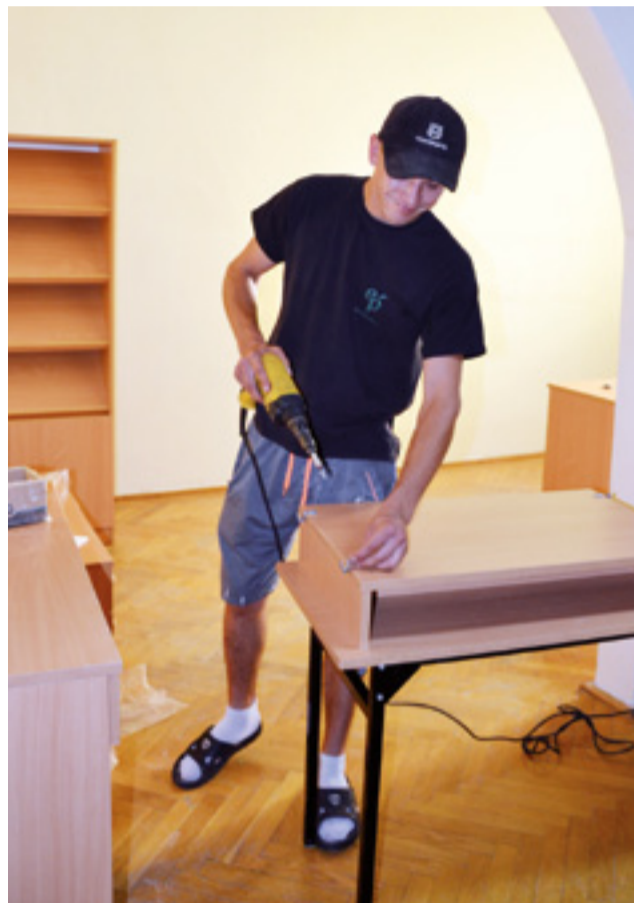
Nowe meble zastaną uczniowie Szkoły Podstawowej im. Józefa Ufy w Mastkach.

Ponadto, jeszcze pod koniec wakacji, miał zostać przeprowadzony poważniejszy remont w sali komputerowej. – Musimy tam wymienić podłogę oraz chcielibyśmy docieplić stropodach nad tą salą. Czekamy na firmę – powiedział nam dyrektor Żywicki. Według niego z planowanymi w tej sali pracami można się uporać w kilka dni. Ponadto planowana jest też drobna naprawa dachu na budynku głównym, w miejscu, gdzie zaczął on przeciekać. – Był apetyt na większe remonty, ale cóż, nie zawsze finanse pozwalają – mówi dyr. Żywicki.