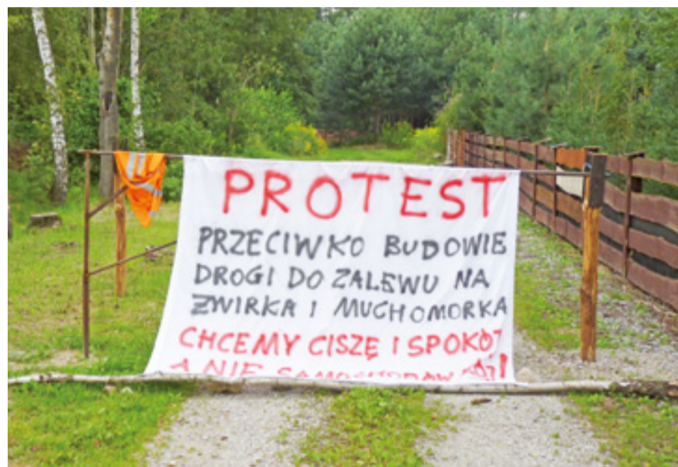
Szlaban na drodze gminnej prowadzącej nad zalew w Ziemiarach.

Po prawie rocznej przerwie spór powrócił jednak na sesję Rady Gminy Bolimów. Był na niej omawiany w kontekście