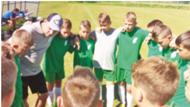
Gracze Pelikana 2005 przed meczem z Jaguarem Gdańsk.