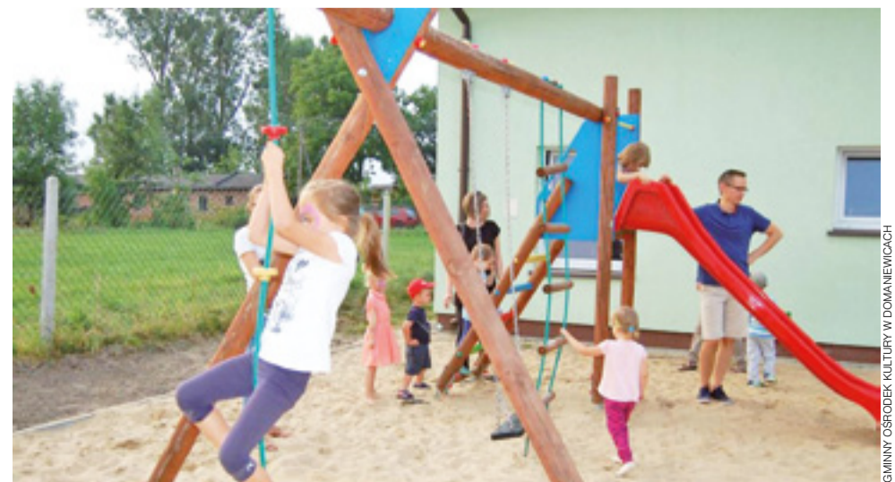
Bezpieczna zabawa! Powstały przy świetlicy w Strzebieszewie plac zabaw zyskał miękkie podłoże z piasku.

Duża frekwencja na otwarciu placu zabaw świadczyła o tym, że inwestycja przy świetlicy jest trafiona. ewr