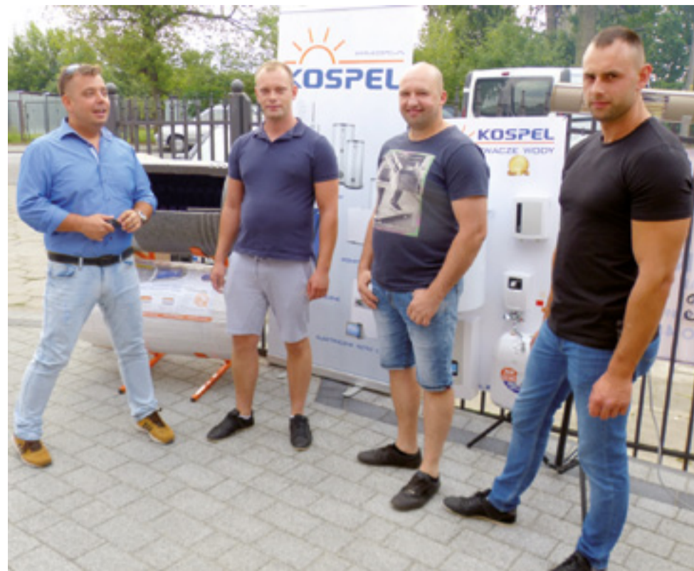
Dla producentów targi do dobra okazją do zaprezentowania swoich ofert i nowości wartych polecenia.