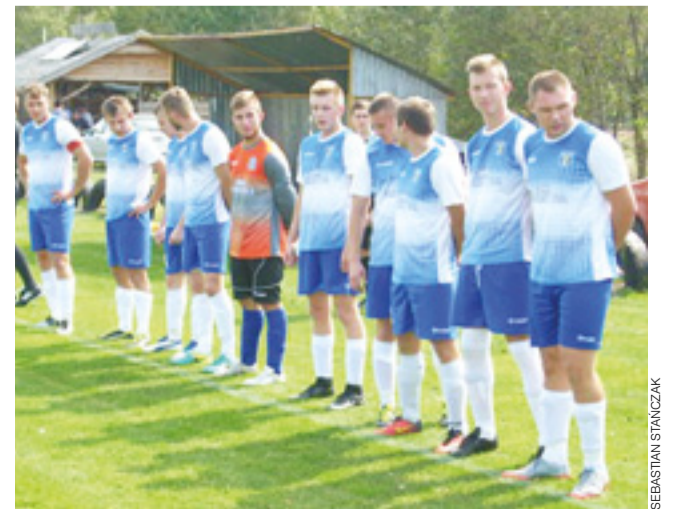
Korona zdecydowanie pokonała Sierakowiankę, na jej terenie.