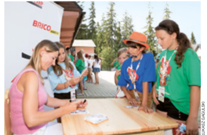
Uczestnicy letnich kolonii mieli okazję spotkać się z medalistką olimpijską Sylwią Gruchałą.

Od 3 do 12 sierpnia troje dzieci z Łowicza spędzało bezpłatne wakacje w górach dzięki drugiej edycji „Wakacji z Muszkieterami”.