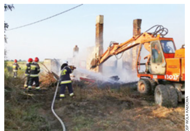
Po spalonym budynku w Borowie pozostały tylko murene kominy. Ogień uszkodził konstrukcję budynku, która runęła.

Właściciel budynku deklorował, że budynek był przeznaczony do rozbiórki. Straty oszacował na 5 tys. zł.