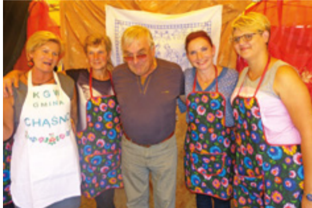
Kobiety z KGW w gminie Chaśno nie należą do osób o słabych charakterach. Pomimo kontroli, pozostały na swoim stoisku, oferując swojskie jadło i bez problemu zgadzały się na robienie zdjęć.

Zwraca uwagę, że tak naprawdę imprez, na którym koła mogą w ciągu roku zarobić pieniądze, nie jest dużo. To mogą być 2-3 okazje w roku. I muszą się napracować, aby przygotować różne potrawy, wkładając w to nie tylko swój czas i pracę, ale też swoje własne składniki, np. jajka czy mąkę. Nie robią tego zresztą dla siebie, ale np. po to, aby do świetlicy kupić 5 nowych firanek na okna. W świetle ich działalności każda kara urzędowa będzie nieadekwatnie wysoka.