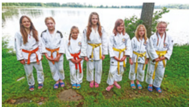
Żeńska część łowickiej sekcji judo.

Treningi na obozie były prowadzone przez czwórkę wykwalifikowanych trenerów, co dawało wszechstronny rozwój zawodnika i leprze wykorzystanie czasu zajęć. Każdego dnia odbywały się ćwiczenia na tatami, w terenie oraz treningi siłowe, a wszystko rozpoczynało się rozruchem i kąpielą w jeziorze.