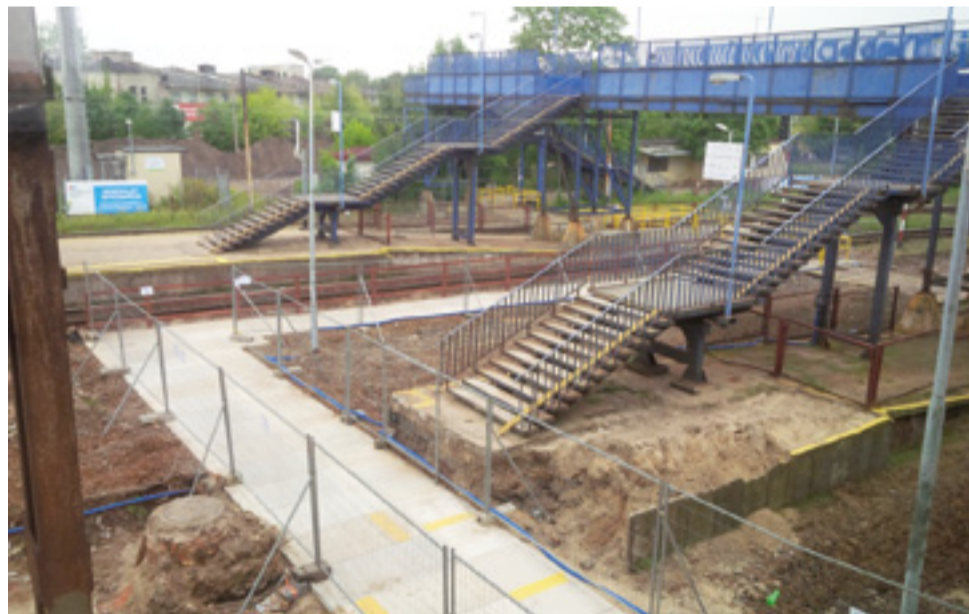
Od strony budynku dworca wyznaczone zostało dojście na peron drugi po betonowych płytach.

Maszynistów i drużyny konduktorskie obowiązywać będą dodatkowe rozkazy o konieczności zachowania szczególnej ostrożności podczas jazdy i o ograniczeniu prędkości.