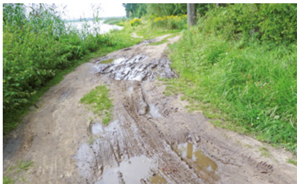
Samochody, które wjeżdżają na teren zalewu, tworzą kołami takie koleiny.