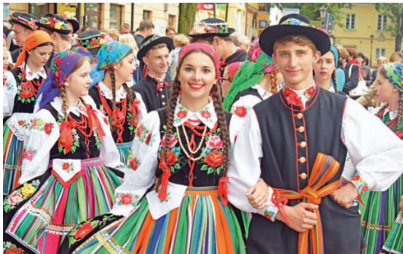
Młodzież z zespołów ludowych w kolorowych pasiach poprowadziła uczestników uroczystości z „Alei Gwiazd Łowickich” na drugą część uroczystości w muzeum.