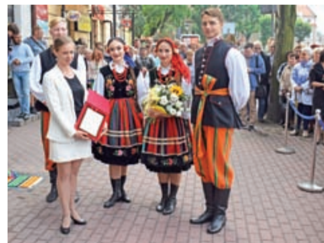
Przedstawiciele Zespołu Pieśni i Tańca Politechniki Warszawskiej.

Po zakończeniu pierwszej części uroczystości uczestnicy przeszli do Muzeum w Łowiczu,