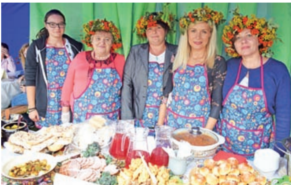
Gospodynie z KGW w Kalenicach przywdziały na głowy kolorowe wianki.

isko informacyjne doradców z ŁODR w Bratoszewicach. Najmłodszy uczestnicy zabawy korzystali chętnie z wydzielonego kąca zabaw lub też z oferty animatorek Kasi i Pauli z „Akcji animacja”.