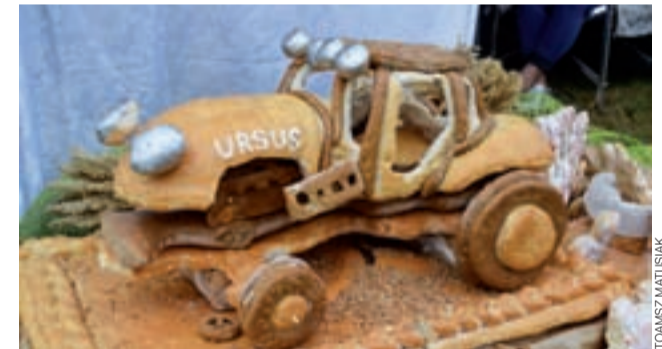
Model ciągnika wykonany w całości z pieczywa był ozdobą stoiska łowickiego biura Łódzkiego Ośrodka Doradztwa Rolniczego w Bratoszewicach.