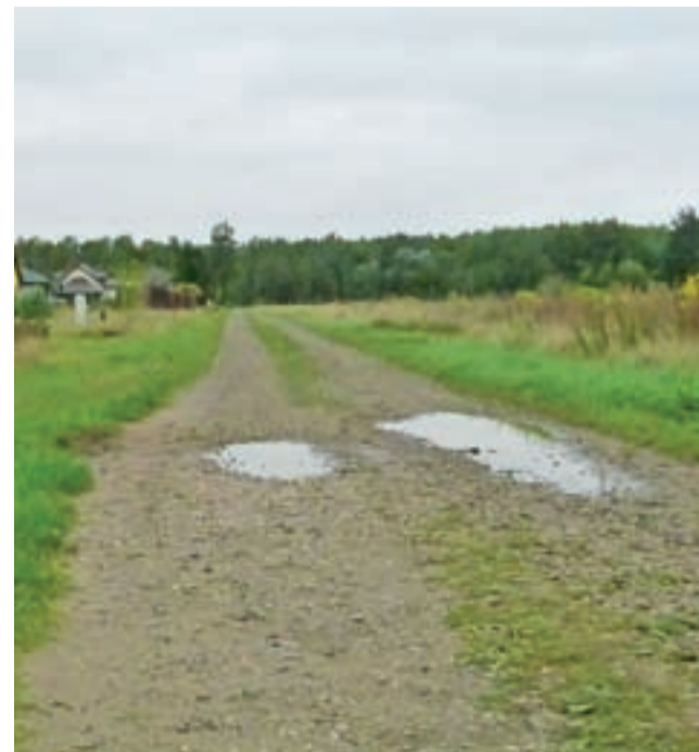
Przy ul. Piaskowej w Mysłakowie widać już nowe domy. Niestety ich mieszkańcy na dobrą drogę będą musieli jeszcze poczekać.

Gmina Nieborów | Radni nie przesunęli pieniędzy na drogi