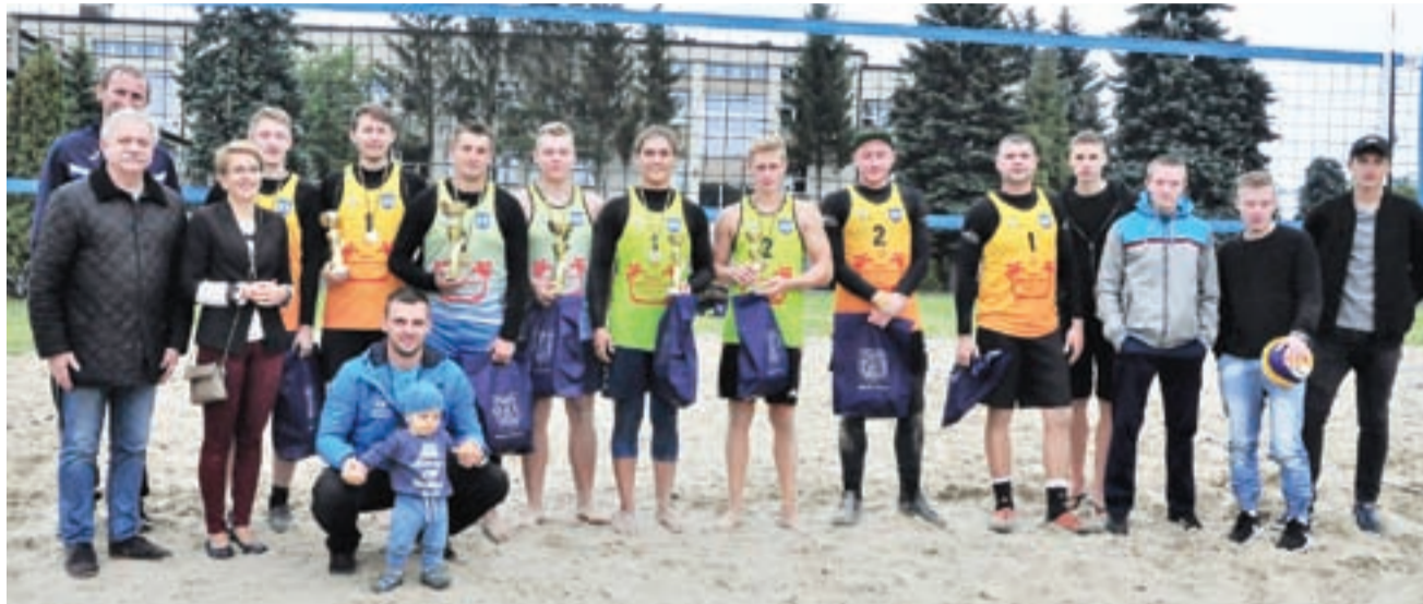
Najlepsi zawodnicy łowickich zmagani w plażówce.