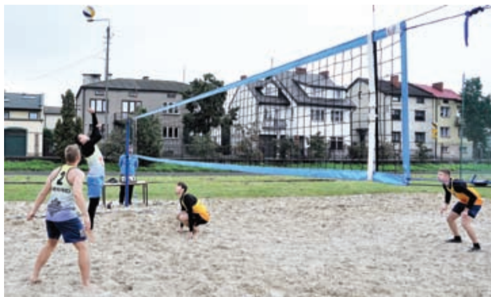
Mecz finałowy był bardzo wyrównany.