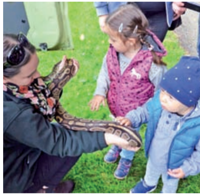
Animatory z płockiego ZOO przyjechali na festyn w Sannikach z żywym wężem.