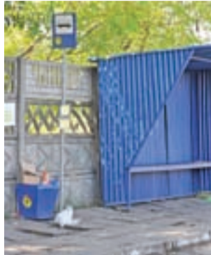
Część autobusów PKS zatrzymuje się obecnie przy niebieskim przystanku MZK przy wejściu na dawny dworzec PKS.

Zamieszanie z autobusami spowodował fakt, że trasy kursowania części z nich były uzgadniane z Urzędem Marszałkowskim w Łodzi i PKS otrzymał pozwolenie na zmianę trasy dopiero od 1 października. W przy-