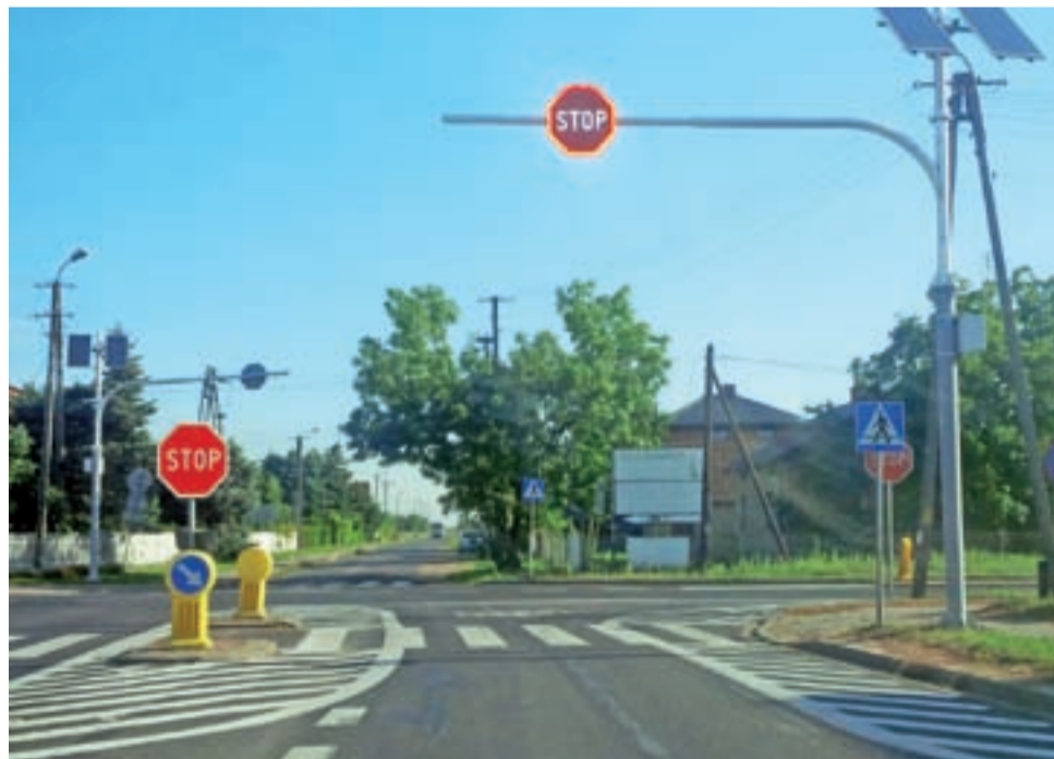
Zmiany organizacji ruchu na skrzyżowaniu dróg wojewódzkich w Sannikach już obowiązują.

Wspomniane zawężenie polega na zlikwidowaniu istniejącego do tej pory prawoskrętu na drodze od strony Osmolina. Szkoda, że zostało ono namalowane na drodze, a nie wykonane fizycznie (np. poprzez dokonanie wygradzenia krawężnikiem), ponieważ część kierowców i tak nie respektuje zmiany i po pasach skręca w pra-