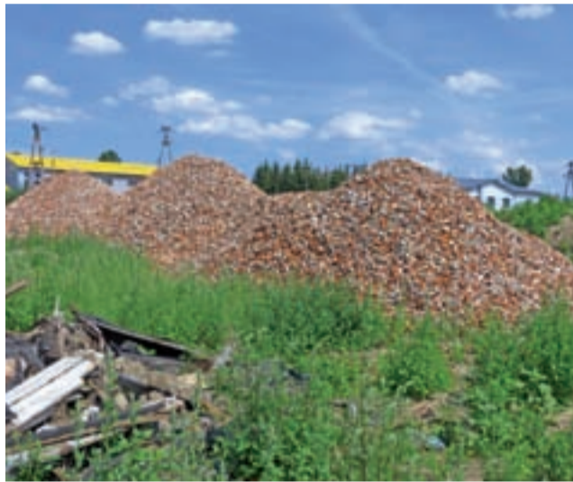
Tak w lipcu od strony Bzury wyglądała działka, na której stał budynek rzeźni. Została na niej tylko sterta gruzu.

wychowywali się na ul. Mostowej, ale w latach 90. osobiście odradzał mu kupno budynku po dawnej rzeźni. – On chciał prowadzić tam ubojnię i przetwórnice wędlin. Ja mu tłumaczyłem, że teraz wszystko musi być po nowemu. Mówiłem: masz działkę na Poznańskiej po ojcu, tam możesz pobudować nowoczesną rzeźnię, ale on nie słuchał