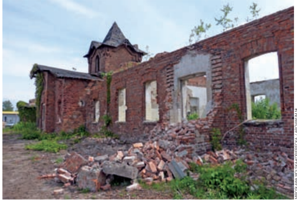
Tak jeszcze w ubiegłym roku wyglądał budynek rzeźni przy ul. Nadburzańskiej.

marnowały. – Nawet włosie było zbierane, potem więźniowie robili z niego pędzelki do malowania. Pędzle do golenia też były z tego wyrabiane – opowiada.