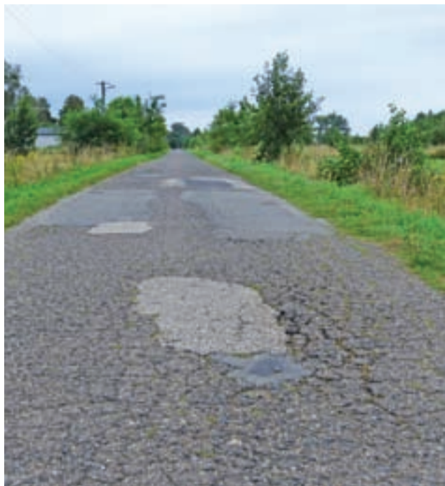
Asfalt na ul. Wschodniej w Nieborowie najlepsze lata ma dawno za sobą. Widać na nim liczne zadolenia, spęknięcia i łaty.