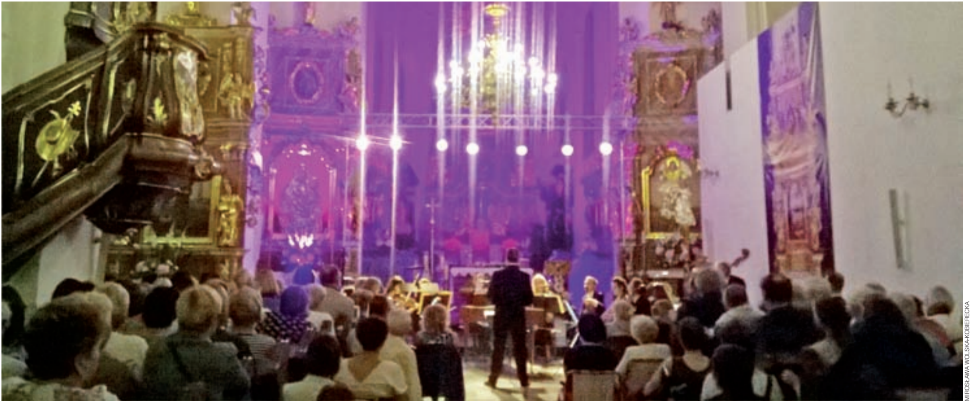
Zgodnie z nazwą festiwalu „Kolory Polski”, ołtarz katedry w czasie koncertu miał barwną iluminację.