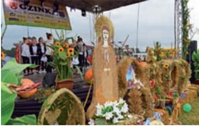
Wieniec pod główną sceną dożynek. Najwyższy na zdjęciu, z Matką Boską, został wykonany przez mieszkańców Popowa.