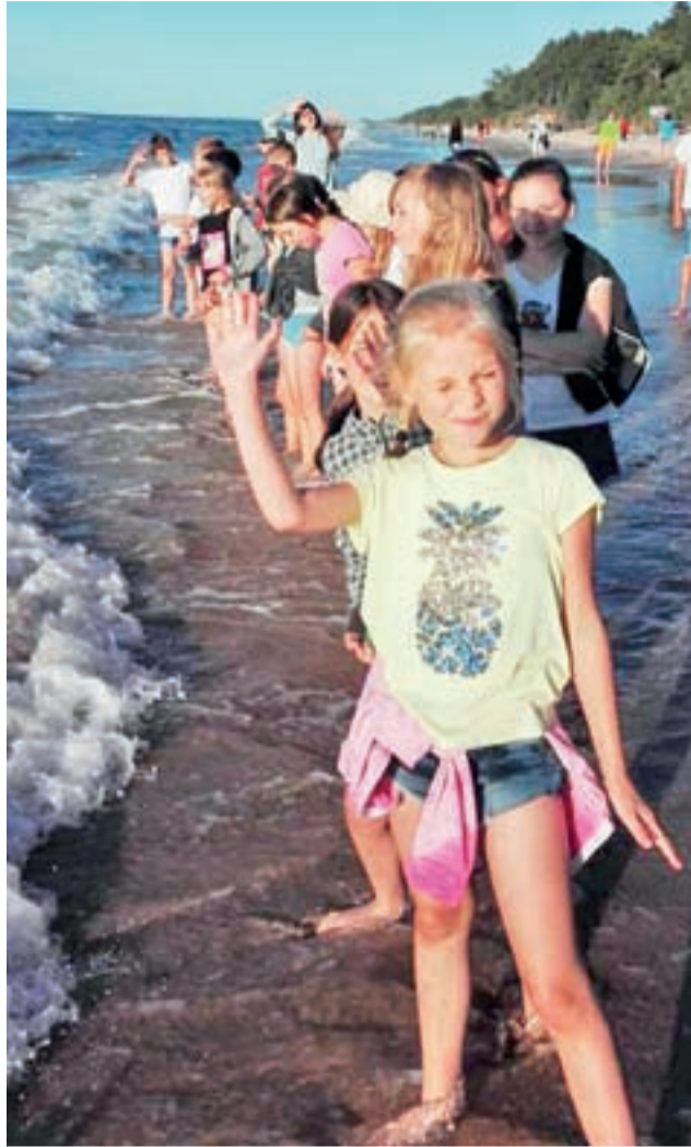
Uczestnicy „Wakacji z Bogiem” na plaży w Gąskach.