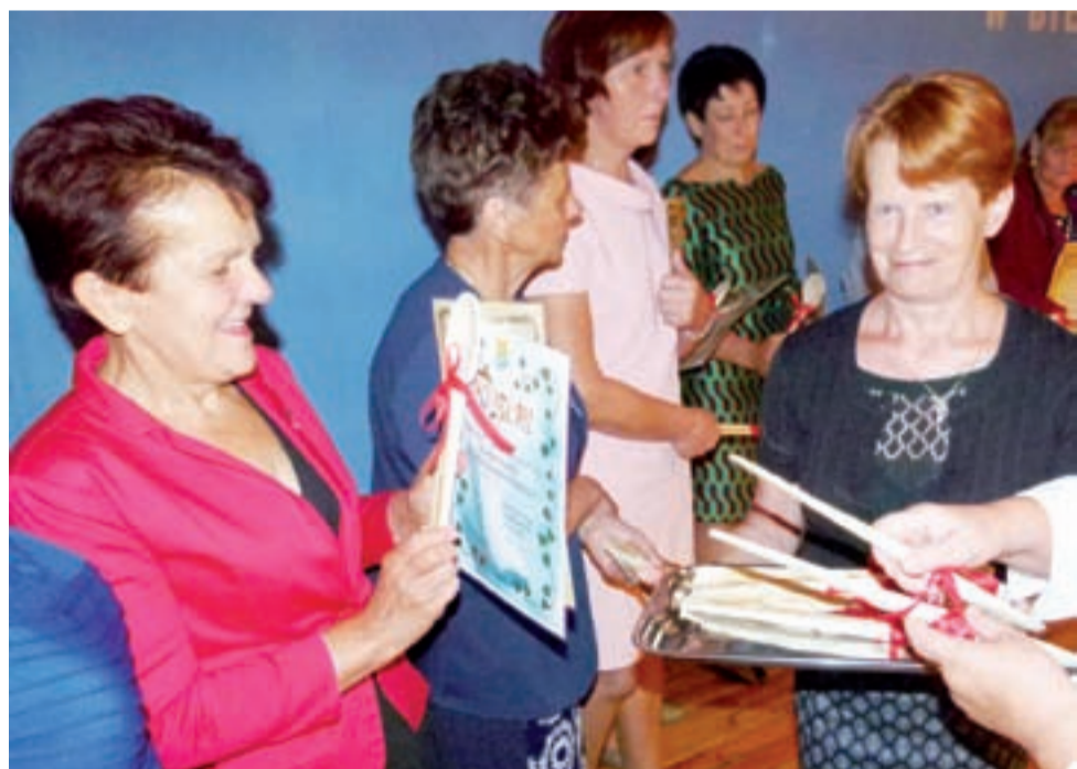
Pamiątkowe chochle. W ten wyjątkowy sposób zarząd KGW w Bielawach podziękował wszystkim członkiniom.

Obszerną galerię zdjęć z uroczystości zamieszczamy pod tekstem na www.lowiczanie.info