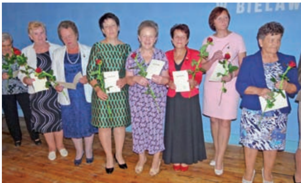
Po dekoracji. Na zdjęciu 7 z 16 pań odznaczonych w Bielawach Orderem Serca – Matkom Wsi.

Podczas jubileuszowego spotkania nastąpiło uroczyste uhonorowanie zasłużonych pań z KGW Bielawy najwyższym odznaczeniem przyznawanym członkiniom kół gospodyń za ich trud włożony w wychowanie dzieci oraz za społeczne zaangażowanie w życie wsi: Orderem Serca