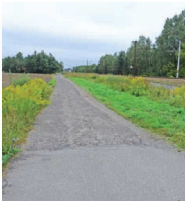
Ulica Polna w Bełchowie biegnie wzdłuż linii kolejowej.

Oświadczenia majątkowe samorządowców z gminy Nieborów. str. 18-19