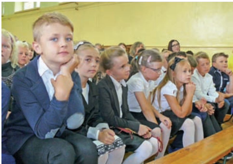
Uczniowie klas III, w czasie inauguracji roku szkolnego w SP 1 w Łowiczu.