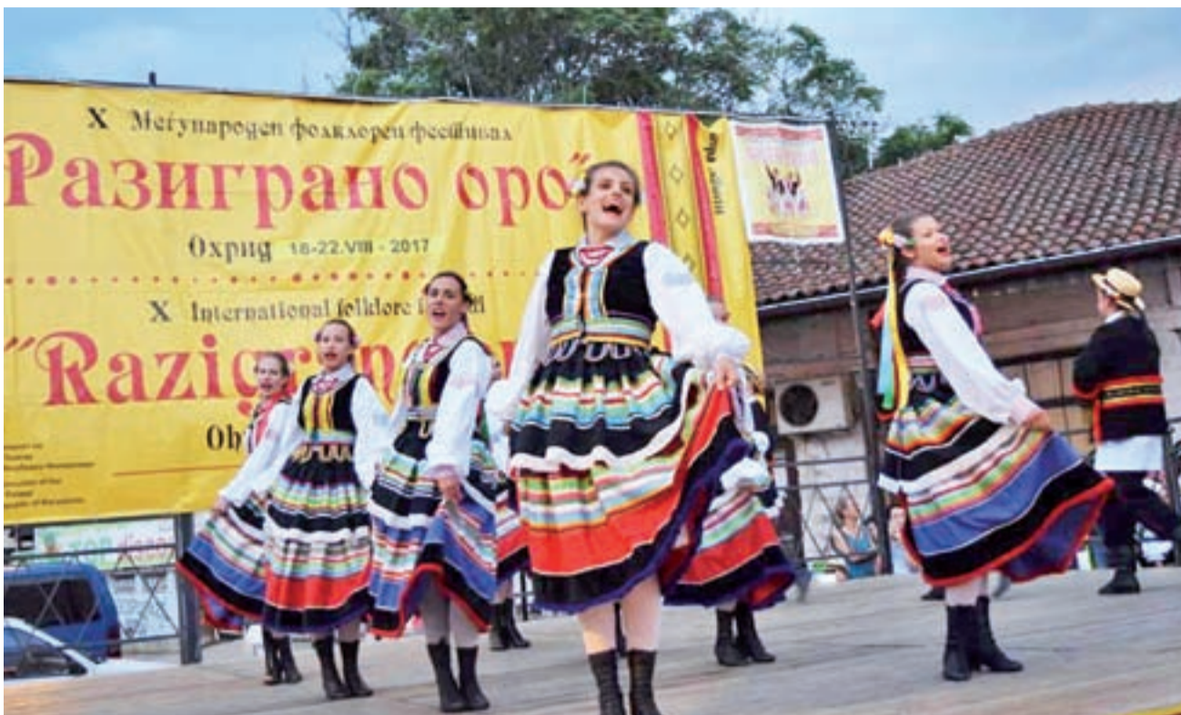
Na festiwalowej scenie. Zespół Kalina w Macedonii.

Oprócz emocjonujących występów na festiwalu i towarzyszącej mu parady zespołów folkowych, Kalina miała okazję sporo poznać. Uczestnicy wyjaz-