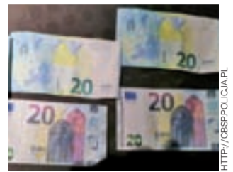
Fałszywe banknoty z wykrytej na terenie gminy Stryków drukarni.

Na wniosek Prokuratury Okręgowej w Łodzi sąd tymczasowo aresztował trzech mężczyzn w wieku 41, 44 i 54 lat, którzy usłyszeli zarzuty związane podrabianiem polskich i zagranicznych banknotów.