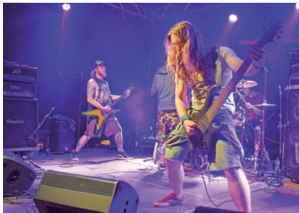
Minetaur po raz pierwszy wystąpił w Łowiczu, prezentując na dziedzińcu ŁOK solidną dawkę death metalu.

Prezentujący się później Shame Yourself to kapela z już dziesięcioletnim stażem, mogący się