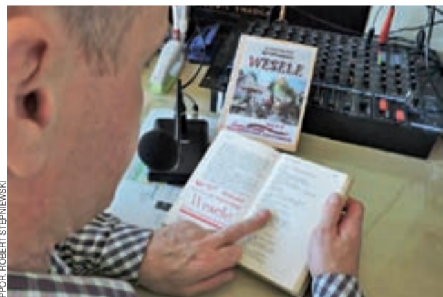
Łowicki ZK uczestniczy w Narodowym Czytaniu od początku akcji.

Na tym nie kończą się obchody Narodowego Czytania w Łowiczu – w najbliższy piątek, o godzinie 12.00, pod gmachem byłego Gimnazjum nr 1 czytanie zorganizuje Miejska Biblioteka Publiczna im. A. K. Cebrowskiego w Łowiczu. tm