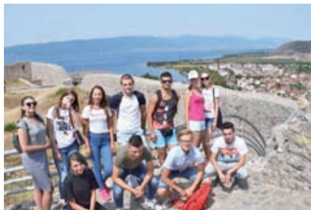
Urzekający widok. Zespół Kalina podczas zwiedzania okolic Ochrydy.