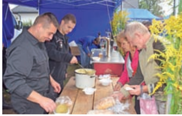
Strażacka grochówka była dla uczestników dożynek jedną z propozycji na ciepły obiad.