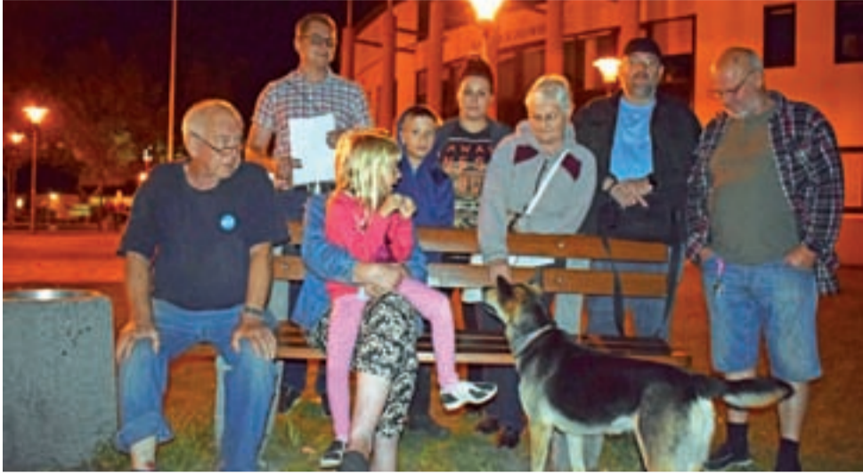
„Spacerowicze” przed budynkiem sądu 29 sierpnia (40. dzień ich akcji).