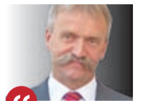
KRZYSZTOF KALIŃSKI Burmistrz Łowicza

Propozycje do budżetu partycypacyjnego można zgłaszać w dowolny sposób: przesać bezpośrednio na skrzynkę mailową burmistrza Kalińskiego (krzysztof.kalinski@um.lowicz.pl) lub, po zapisaniu ich na kartce, wrzucić do skrzynki znajdującej się na bramie ratusza. tb