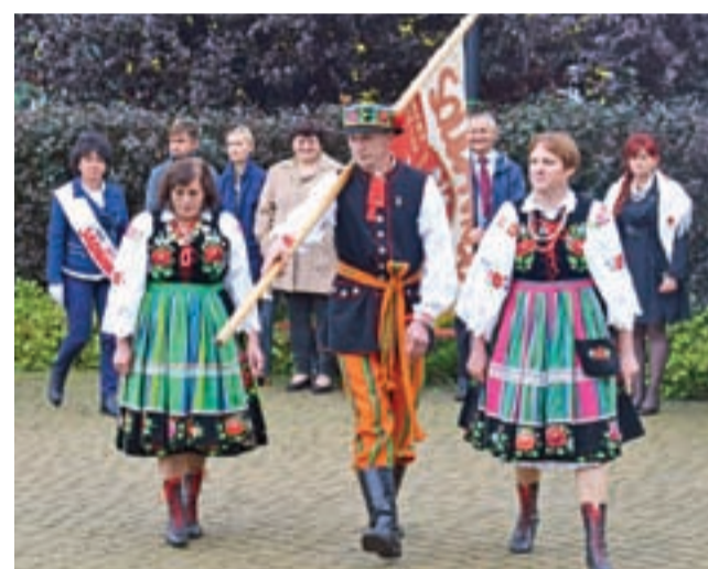
Poczet łowickiego oddziału „Solidarności” nieśli członkowie „Solidarności” z zakładów Agros Nova.