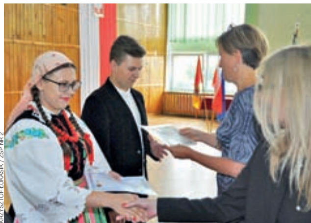
Chwila wręczenia dyplomów laureatom i finalistom Olimpiady Wiedzy o Żywności.