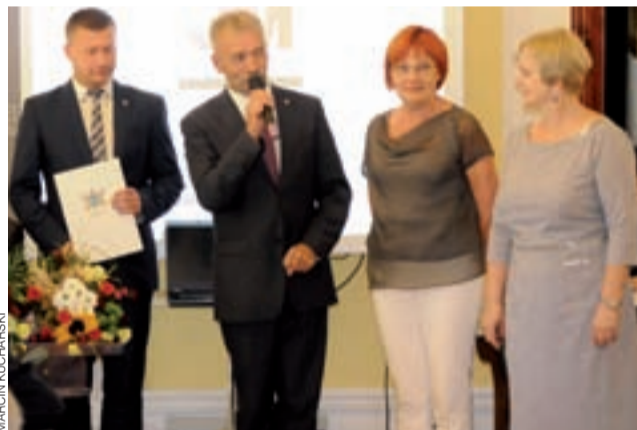
Odchodzącym dyrektorkom uroczyste podziękowano na początku ostatniej sesji Rady Miejskiej w Łowiczu.

Po obiedzie znalazł się też czas na blok rekreacyjno-kulturalny. Trzy pary wzięły udział w konkursie tanecznym na łowickiego oberka, a pięć pań sprawdziło swoje umiejętności kulinarno-piekarnicze w konkursie na najlepsze ciasto drożdżowe. Ta część imprezy była współfinansowana z budżetu Samorządu Województwa Łódzkiego i Gminy Kocierzew Południowy, w ramach projektu „Aktywne sołectwo”. tm