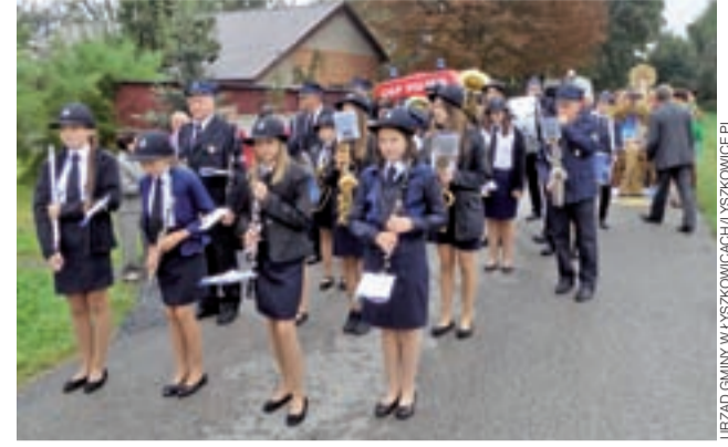
Strażacka Orkiestra Dęta z Łyszkowic – przy takiej okazji nie mogło jej zabraknąć.