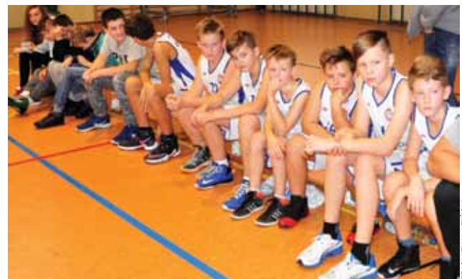
Młodzi zawodnicy Książaka czekają na zwycięstwo na boisku.

Przypomnijmy, że w rozgrywkach U-11, U-12, U-13 i U-14 do gry musi być gotowych 10 zawodników. Trzy pierwsze kwarty gra się po 5 minut różnymi