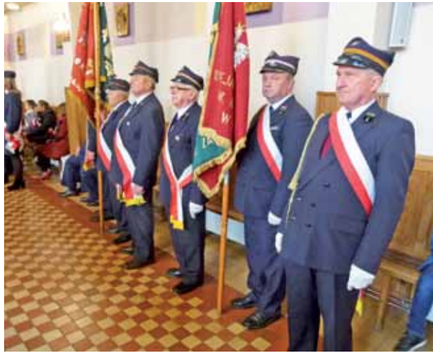
Gościnnie pojawiły się duszpasterstwa kolejarzy z Rogowa i Koluszek.