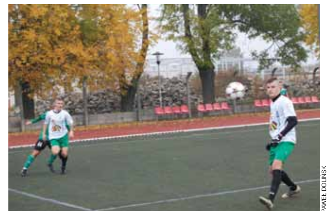
Zawodnicy Pelikana II złapali zadyszke.