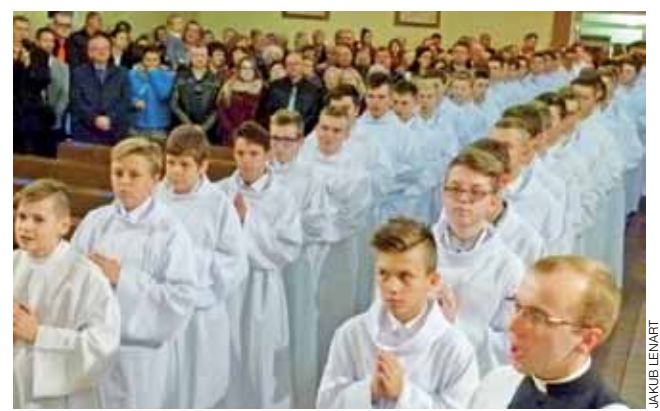
Do niedawna ministranci, teraz już w lektorskich albach.