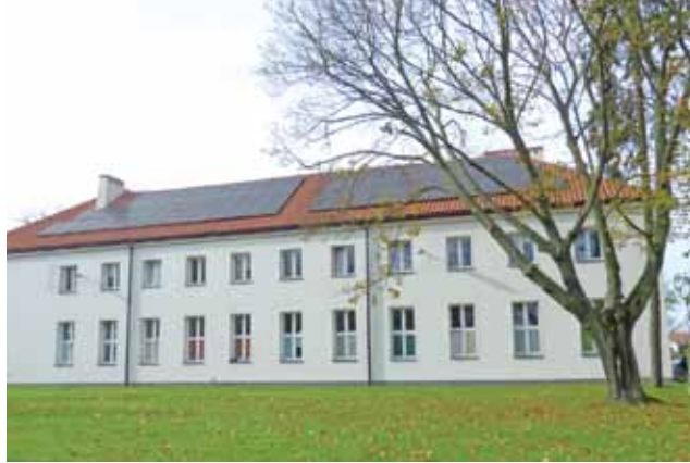
Solary na budynku internatu – jeden z przykładów stosowania OZE w Zduńskiej Dąbrowie.