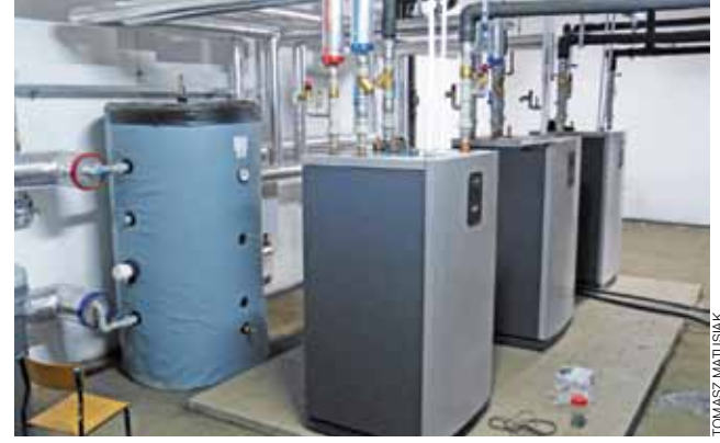
Pieco po termomodernizacji – na razie uruchomiono jeden, co przy tej temperaturze na zewnątrz powinno wystarczać do utrzymania w szkole odpowiedniego poziomu ciepła.