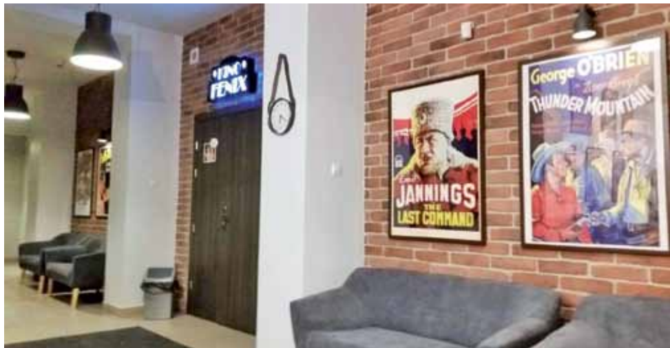
Przeszło rok temu holl i korytarz kina Fenix zyskały klimatyczną odświeżkę.

Kino powstało od podstaw w listopadzie 2006 roku. Ma 11 lat, cały czas się rozwija i zwiększa ilość widzów. W tym czasie otrzymaliśmy dwa największe wyróżnienia: Nagrodę PISF dla Kina (2014) i Nagrodę PISF dla DKF (2017), dwie nominacje do Nagrody PISF (za monografię „100 lat kina w Łowiczu” 2012) i nominację dla DKF (2015), jesteśmy sycyfryzowani, sala ma klimatyzację, są bilety online, fajnie zaaranżowany, klimatyczny hol. Niebawem druga sala. Wiele pieniędzy pozyskiwanych jest ze środków zewnętrznych (konkursy PISF, MKiDN, NCK). Mamy przedstawiciela w Radzie Kin Studyjnych (reprezentuje woj. mazowieckie, łódzkie i lubelskie). Dużo się o nas mówi. I teraz wisienka na torcie: przyjęcie do europejskiej rodziny Europa Cinemas, która skupia najlepsze kina z 42 krajów. Dla mnie to spełnienie marzeń i planów zawodowych. Jak na 11 lat, to bardzo dużo. A przecież po utracie „Bzury” Łowicz miał zostać bez kina.