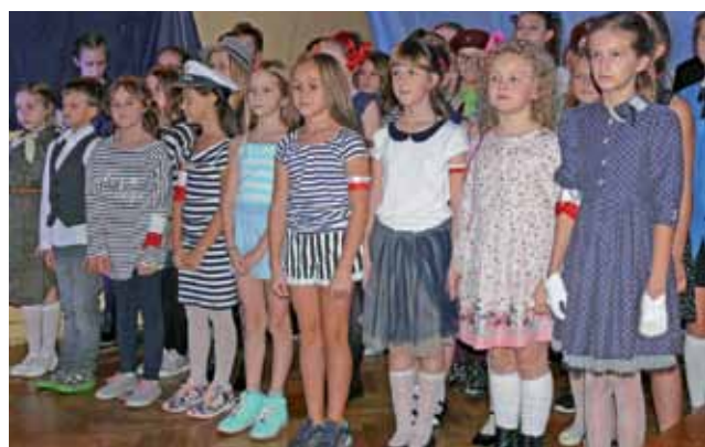
Wykonawcy programu artystycznego – uczniowie „Jedynki”.