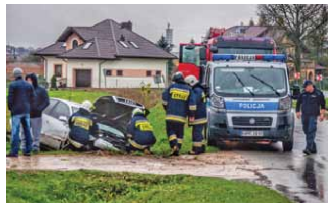
Na miejscu interweniowali strażacy i policjanci , którzy zatrzymali pijanego kierowcę.

Na miejscu interweniowała również straż pożarna. Strażacy zajęli się m.in. odłączeniem akumulatora i zabezpieczyli miejsce zdarzenia. Kierowca nie odniósł obrażeń wymagających hospitalizacji. Badanie alkometrem wy-