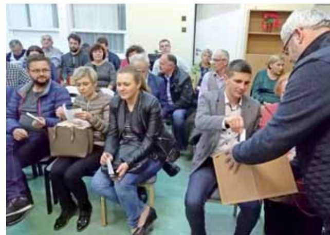
Głosowanie w sprawie budżetu obywatelskiego na Bratkowicach.

Na te trzy propozycje inwestycji na przyszły rok mieszkańcy będą głosować w listopadzie, aby ostatecznie wybrać jedną z nich do realizacji w ramach budżetu obywatelskiego. – Wkrótce wyznaczymy w jakich dniach i w jakich godzinach będzie można głosować osobiście, m.in. w siedzibie zarządu – mówił prze-