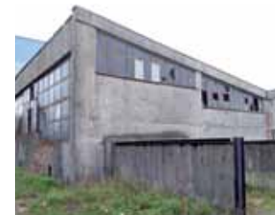
Cztery oferentów walczyło o starą kotłownię naprzeciwko cmentarza na os. Bratkowice.

Dopiero propozycja radnego Cipińskiego okazała się dla większości radnych do przyjęcia. Kluczowa była propozycja, aby kurię „prosić” o odstąpienie od roszczeń od spornej działki, a w zamian za to zaproponować alternatywną. Przegłoszenie oświadczenia zaledwie 9 głosami „za” mieszkańcy przyjęli bravami. Ocenili, że to krok milowy. Czy faktycznie – zależeć będzie od Kościoła. mwk