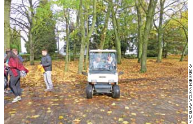
Jedną z atrakcji zwiedzania szkoły była możliwość przejażdżki pojazdem elektrycznym – Melexem.