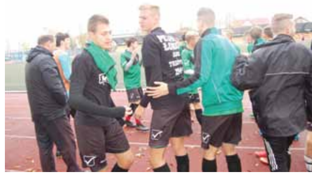
Gracze Pelikana cieszą się z awansu do I ligi wojewódzkiej.