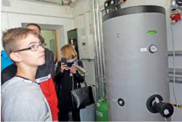
Uczestnicy Ekoforum zwiedzali teren szkoły, m.in. po to, aby poznać zasady działania pomp ciepła w budynku internatu w Zduńskiej Dąbrowie.