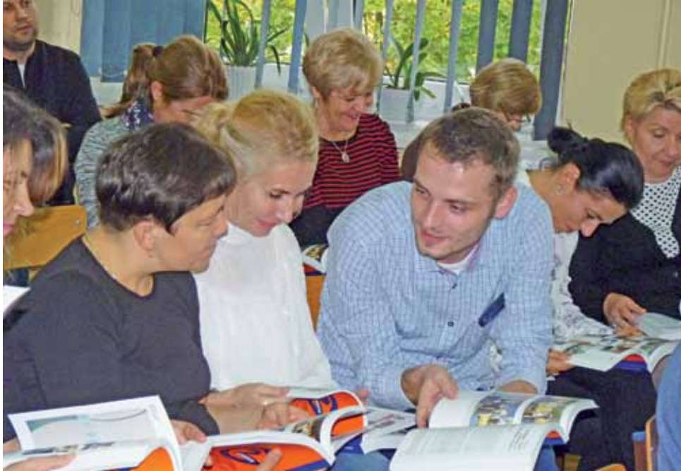
Jak bardzo książka spodobała się nauczycielom może świadczyć fakt, iż zaraz po otrzymaniu egzemplarzy z dedykacjami zaczęli ją z zaciekawieniem przeglądać i żywo wymieniać uwagi.

Autorki wydawnictwa przyznały, że pomysł jego opracowania zrodził się w niekorzystnym dla Gimnazjum nr 2 czasie, gdy było