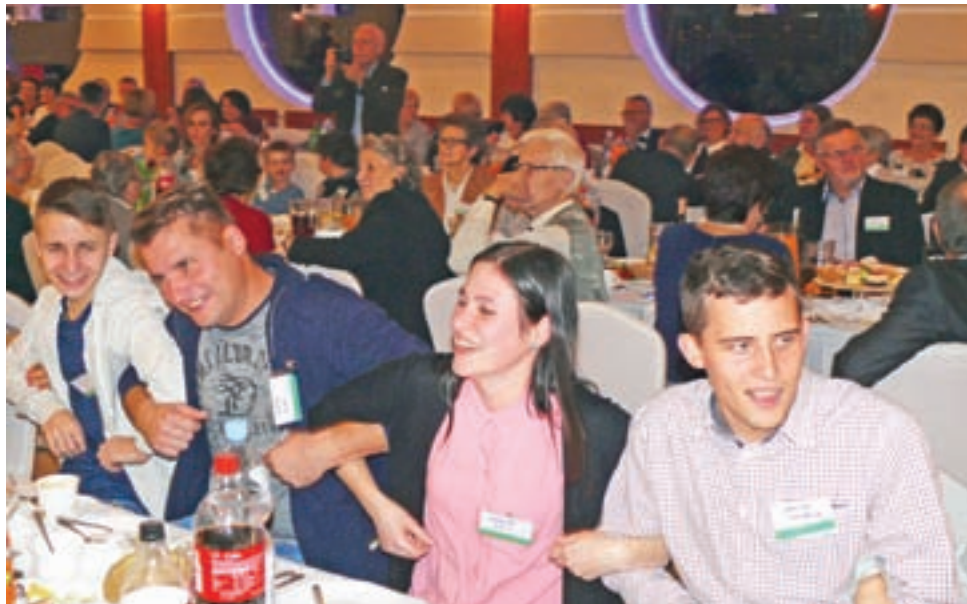
W czasie spotkania na Szkiełkach śpiewano, bawiono się przy stołach, ale także tańczono na parkiecie.

– Na spotkanie wybrałam listopad nieprzypadkowo. Większość rodziny to nadal rolnicy, tak jak ponad 100 lat temu Ludwik i Marianna. W listopadzie ustają już