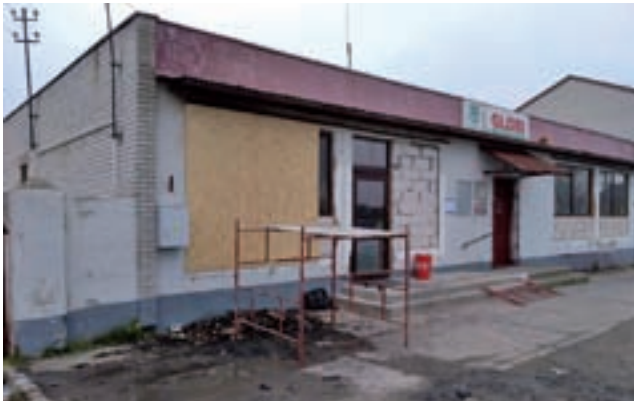
Sklep spalił się w środku, płomienie nie wydostały się na zewnątrz.