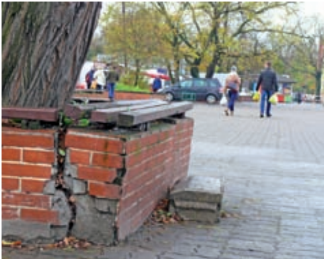
Jedna z oderwanych ścian zielonego „kwadratu” przy miejskim targowisku powoli zaczyna się przechylać, grożąc przewróceniem.

- przeczytasz w następnym NŁ, 16 listopada.