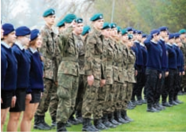
Raz w roku bolimowska szkoła ponadgimnazjalna przeżywa święto, w czasie którym uczniowie klas mundurowych składają ślubowanie.