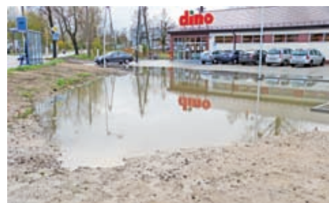
Obszar pomiędzy parkingiem i ulicą jest położony wyraźnie niżej. Zdjęcie wykonane 23 listopada, obecnie trwają prace nad wyrównaniem tego terenu.

Zajrzeliśmy w to miejsce w piątek, 3 listopada. Woda stała we wgłębieniu na terenie pomiędzy ulicą a parkingiem sklepu, od którego ta część terenu jest oddzielona wysokim krawężnikiem. Ulica jest położona znacznie wyżej, więc trudno się dziwić, że woda z niej spływa. Wgłębienie mieści się już poza obszarem dopuszczonym do użytkowania, ale może mieć na niego wpływ. Bez wejścia do wody i wykonania pomiaru trudno powiedzieć czy jest głębokie. Dookoła trwały jeszcze prace porządkowe, tymczasowo przerwane na czas opadów, więc zapewne in-