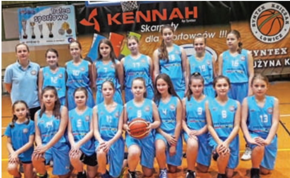
W Łodzi łowiczanki nie miały szczęścia i przegrały dwa mecze.

W kolejnym turnieju nasze dziewczyny zaprezentują się