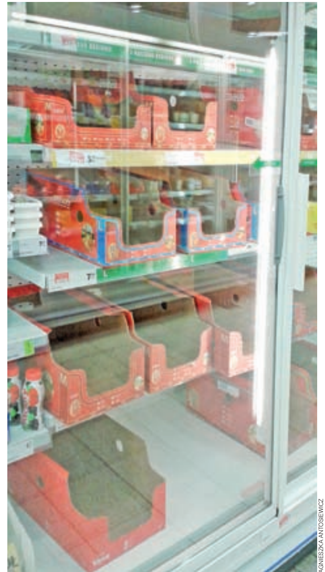
W niektórych supermarketach w Łowiczu można spotkać puste półki w dziale z jajkami.

Kryzys na polskim rynku jajek to dowód na to, jak uwarunkowania gospodarcze w Euro-