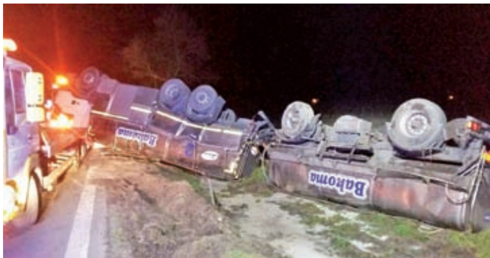
Przewrócona cysterna z mlekiem - wtorek, 7 listopada wieczorem.

Kierowca MAN-a, by uniknąć zderzenia, zjechał na prawe pobocze, po czym dachował na grząskim gruncie. – Nie doszło do kontaktu samochodów. Policjanci ustalili, że kierujący samochodem osobowym, jadąc od strony Kom-