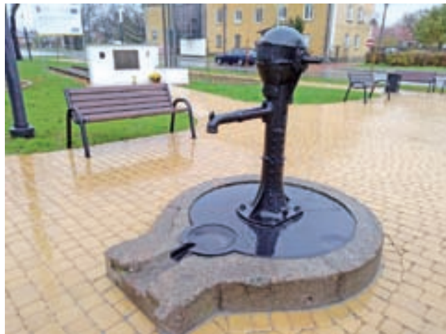
Unikatowa pompa została odmalowana i ustawiona ponownie na skwerze przed dworcem PKP Łowicz Główny.

Prelegent omawiał jej budowę, pokazując żeliwną podstawę z lemem służącym do odprowadzania nadmiaru wody, do którego przymocowana jest kolumna pompy. Co ciekawe, napisy na pompie są w języku francuskim. Widoczna jest też na niej naprawa zrobiona sposobem gospodarczym – jest to kawałek blachy na kolumnie, zamocowany śrubami. Prawdopo-