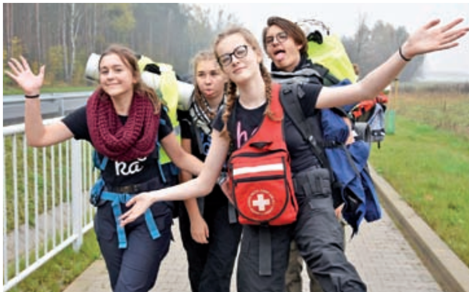
Patrol Bakłażany na trasie pieszego rajdu do Stachlewa - jak widać humory dopisują, a uczestnicy są na tyle rozgrzani, by maszerować w bluzkach na krótki rękaw.

Pierwszy patrol był na miejscu chwilę po 20.00 wieczorem, zaś po 23.00 dotarły 3 ostatnie patrole harcerzy starszych z Hufca Łowicz.