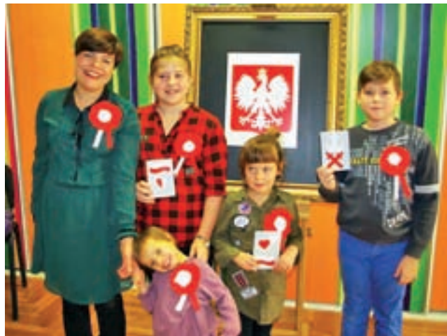
Uczestnicy warsztatów „Świętujemy niepodległą” prezentują wykonane ozdoby.

Film „Edziu nie piskej!” można obejrzeć w domu. Płyty DVD z filmem można otrzymać za darmo w kasie kina, aż do wyczerpania nakładu. Powstało 300 kopii DVD, z czego kilkadziesiąt trafi do szkół z terenu powiatu łowickiego. Część otrzyma także główny bohater i jego rodzina. Niewykluczone, że w przyszłości zostanie także zorganizowana kolejna projekcja w kinie Fenix.