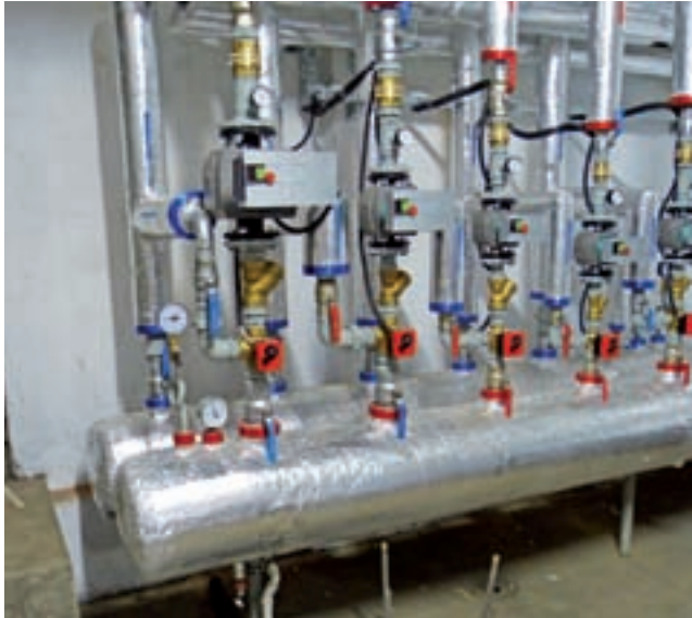
Po termomodernizacji system ogrzewania jest zautomatyzowany, człowiek musi jedynie od czasu do czasu doglądać urządzeń.

Zrealizowanie tego przedsięwzięcia to niewątpliwie duży sukces gminy, bo stan budynku szkoły pod tym względem był problemem poruszającym od lat, utrata ciepła powodowała bardzo duże koszty ogrzewania. Przeszło trzy miliony złotych to najwyższe pozyskane dofinansowanie zewnętrzne w historii gminy Łyszkowice, jak i w ogóle wszystkich gmin wiejskich z powiatu łowicz-