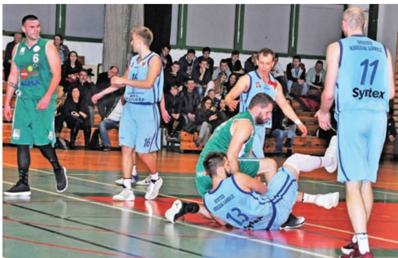
Tylko momentami sobotni mecz był zacięty.

Po zmianie stron gra była w miarę wyrównana, ale goście nawet nie starali się „zerwać” do odrabiania strat. W ostatniej kwarcie Książacy dobili Sokola. Rywal przyjechali tylko w ośmiu i nie wytrzymali kondycyjnie trudów tego pojedynku. Nasi koszykarze mocno zaczęli ostatnią odsłonę i w końcówce meczu wypracowali sobie 30 oczek przewagi. Trener Kucharek