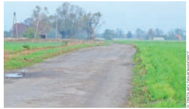
Jest lepiej, lecz nie idealnie. Droga powiatowa Oszkowice – Piaski Bankowe po jesiennej naprawie nawierzchni, stan na 6 listopada.

My byliśmy na miejscu, w Oszkowicach, w poniedziałek, 6 listopada. Po słonecznym i bezdeszczowym weekendzie woda z wcześniejszych opadów wciąż