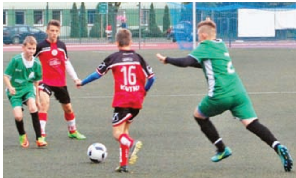
Pelikan 2004 wywalczył z Różą komplet punktów.