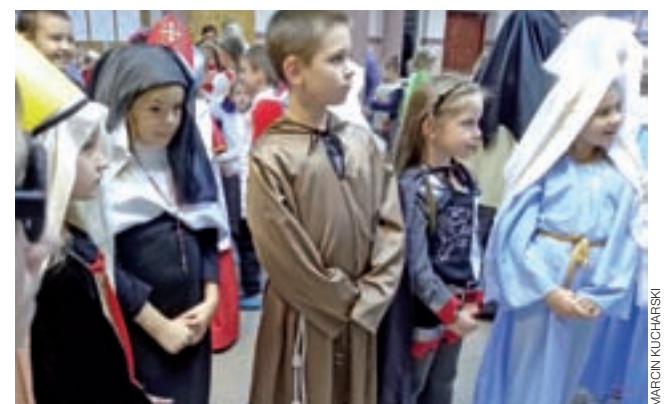
Najpierw modlitwa, później bal w przebraniach świętych.

Już podczas ogłoszeń parafialnych mówił, że Noc Świętych ma być alternatywą dla Halloween, aby dzieci zamiast przebrać się za straszdyła i maskary, wcieliły się w świętych i żyły według ich przykładu. Ksiądz proboszcz już zapowiada, że za rok planuje powtórzyć spotkanie w formie Balu Wszystkich Świętych, które zostanie poszerzone o zabawę i poczęstunek.