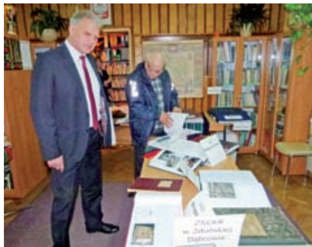
Wystawę kronik szkół, sołectw i organizacji społecznych będzie można oglądać jeszcze w bibliotece w Zdunach przez blisko 2 tygodnie.

Święto Jesieni zakończył podwieczerek, podczas którego podano ciastka z jabłkiem, sok jabłkowy oraz jabłkowy cydr. ■