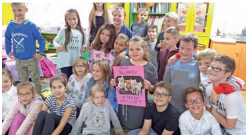
Przygotowanie paczki dla Oliwki sprawiło dzieciom z „Dwójki” dużo frajdy - co widać po twarzach.

Wstęp na premierę jest wolny, ale reżyser prosi, aby zabrać ze sobą karmę dla bezdomnych zwierząt, zwłaszcza kotów, aby pomóc w ten sposób innym zwierzętom. opr. mwk