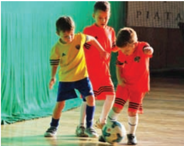
Zawodnicy UKS Soccer Kids w walce o piłkę.