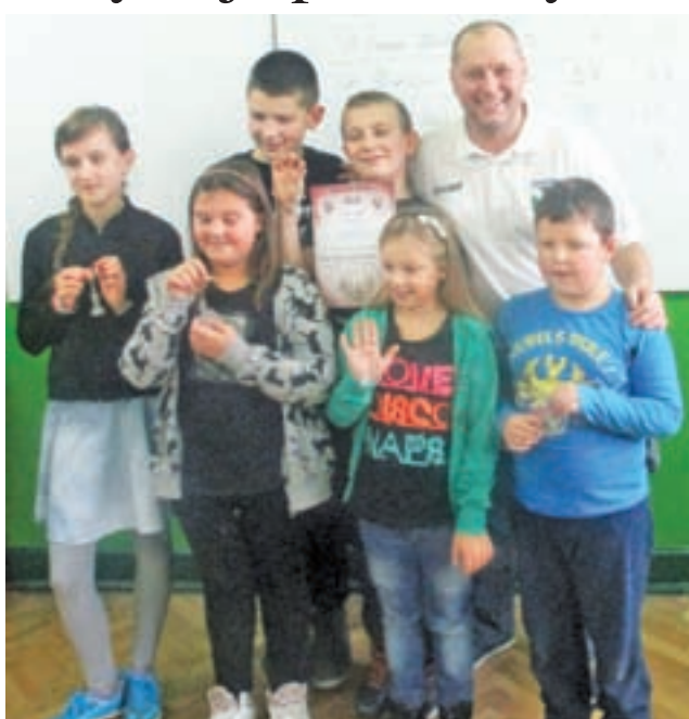
Zwycięska ekipa Pałacu Nieborów wraz z trenerem

Do pierwszego turnieju zgłosiło się 6 ekip, które rozegrały turniej systemem każdy z każdym. Do tabeli głównej liczone były małe punkty, co oznaczało, że każda partia miała bardzo duże znaczenie dla klasyfikacji końcowej.