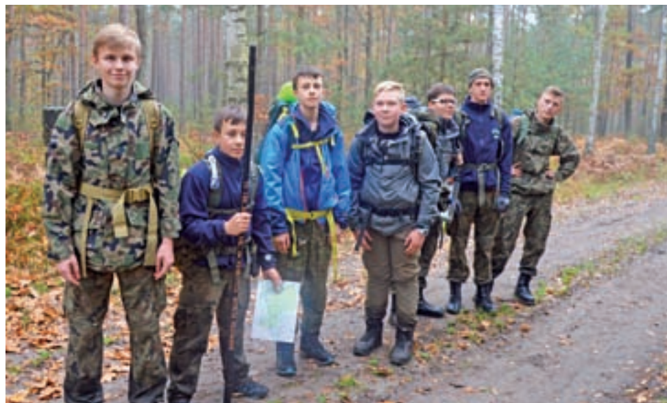
Dziwiąta Siła z Tomaszowa Mazowieckiego okazała się pierwszą, ponieważ trasę rajdu pokonała najszybciej.

I miejsce na trasie harcerskiej zajął wspomniany patrol z Hufca Tomaszów Mazowiecki „Dzie-