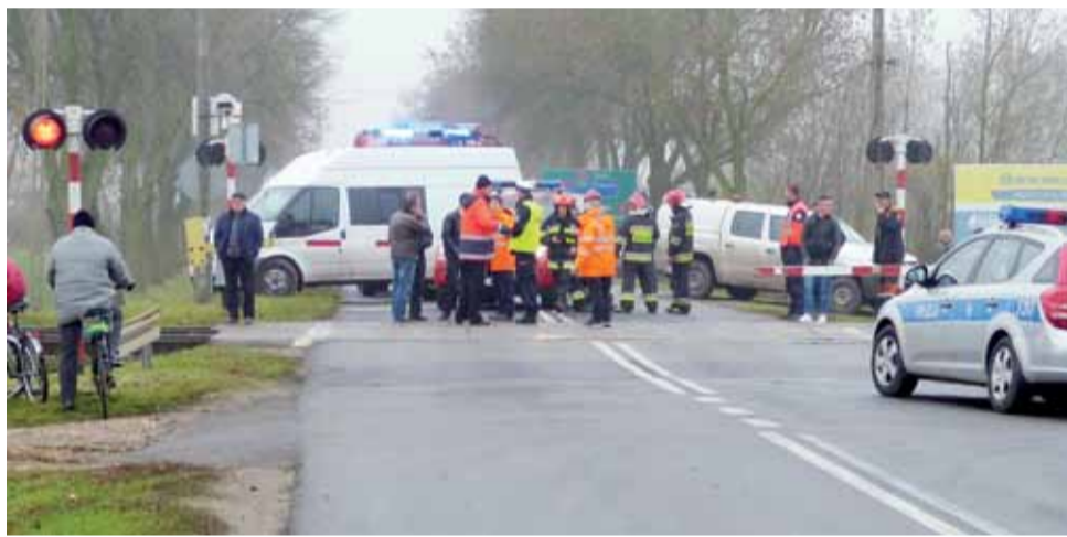
Tragiczny wypadek na przejeździe w ul. Płockiej sprawił, że został on na około 2 godziny wyłączony z użytkowania. Tyle potrzebowały służby, aby zabezpieczyć ślady i sprawdzić czy wszystkie urządzenia zabezpieczające są sprawne.