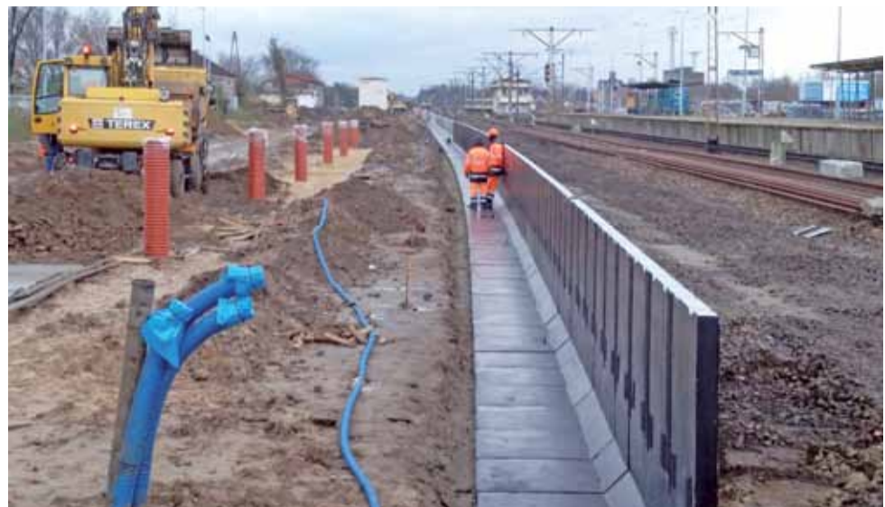
W tym miejscu powstanie peron 1.