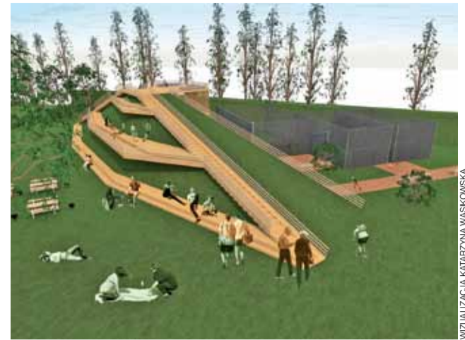
... jak i latem.

fa. W internecie projekt cieszy się dużym zainteresowaniem, większość osób reaguje entuzjastycznie, choć nie brakuje sceptyków, którzy uważają go za zbyt czyny.