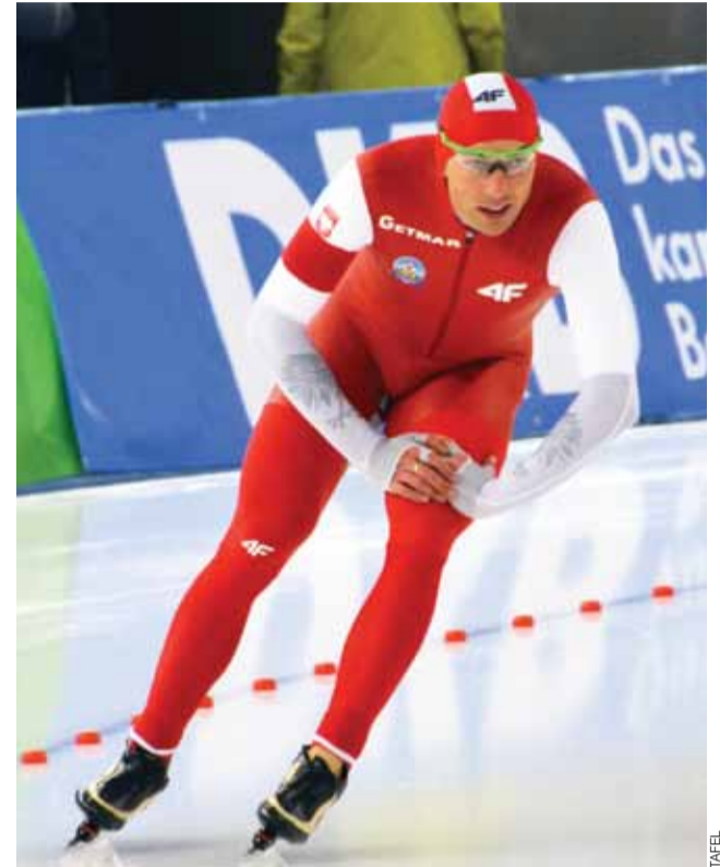
Zbigniew Bródka na zawodach Pucharu Świata w Berlinie.