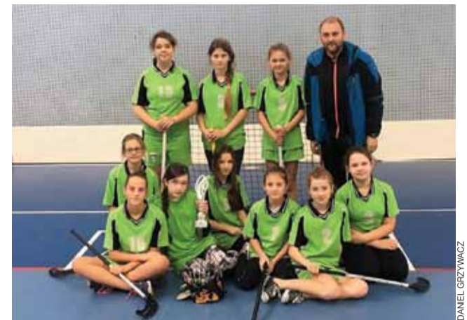
Uczennice z SP Bednary wygrały zawody powiatowe, rejonowe