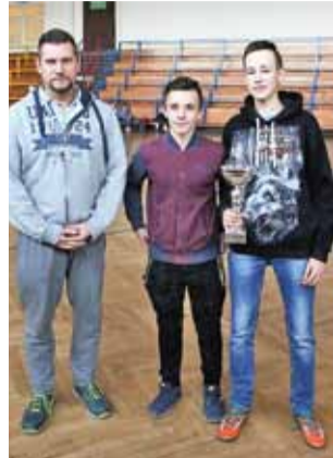
Gimnazjaliści z Kompiny wygrali turniej powiatowy.

w Popowie – Szkoła Podstawowa w Domaniewicach 3:0