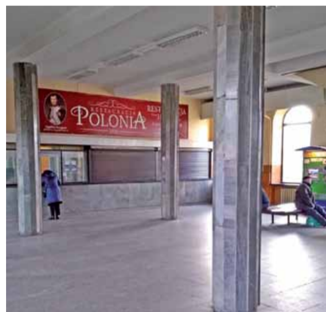
Remont jest planowany, tylko nie wiadomo kiedy się rozpocznie.