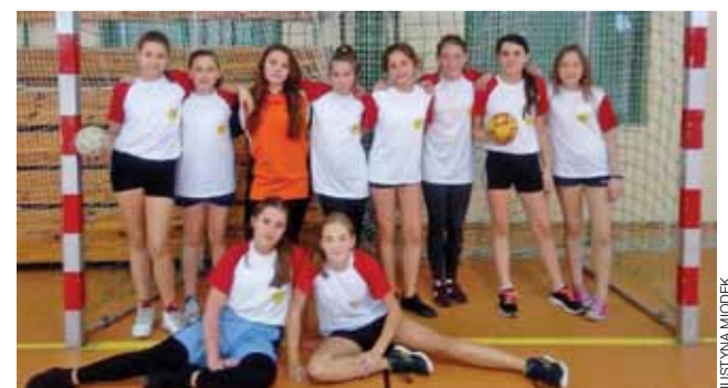
Dziewczyna z SP 4 Łowicz zdobyły mistrzostwo Łowicza.