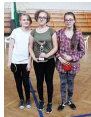
Tenisistki z Bielaw zostały mistrzyniami powiatu łowickiego.

■ Mecz o 1. miejsce: Gimnazjum w Bielawach – Gimnazjum w Sobocie 3:2