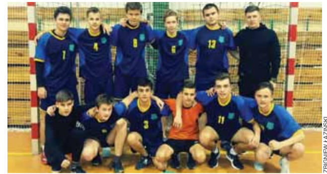
Ekipa Pijarskiego Gimnazjum odniosła cenne zwycięstwo w finale.