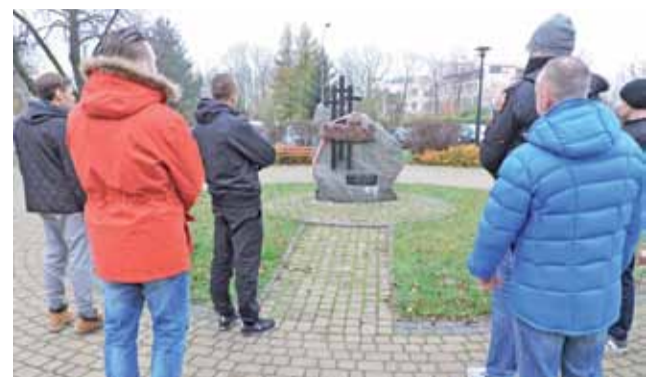
Więźniowie pod pomnikiem na skwerze Solidarności.