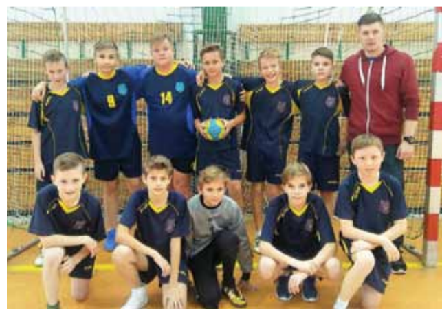
Ekipa SP Pijarska wygrała zawody miejskie.

Trzecie miejsce wywalczyła SP 7 w Łowiczu (nauczyciel w-f Zbigniew Łaziński), która w poprzed-