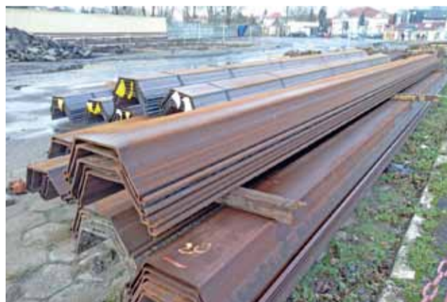
Stalowe grodzice, kotwy itp. są składowane m.in. na terenie dawnego dworca PKS przy ul. 3 Maja w Łowiczu.