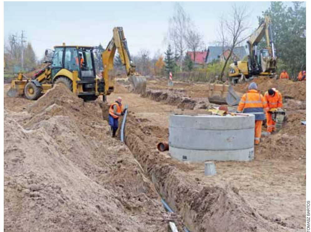
Prace na ul. Dmowskiego koncentrują się obecnie na budowie kanalizacji sanitarnej i deszczowej oraz wodociągu.

Warto dodać, że niewiele powiatów ma sztandar i symbole władzy stosowane powszechnie przez samorządy miast. Przeszukiwania sztandarów powiatów w internecie nie są jednak bezskuteczne. My natrafiliśmy np. na informacje o sztandarach powiatów sandomierskiego, pączęzańskiego, a powiat wrocławski chwali się nie tylko płótnem, ale też innymi symbolami – łańcuchem starosty, łańcuchem przewodniczącego oraz laską ceremonialną. mwk