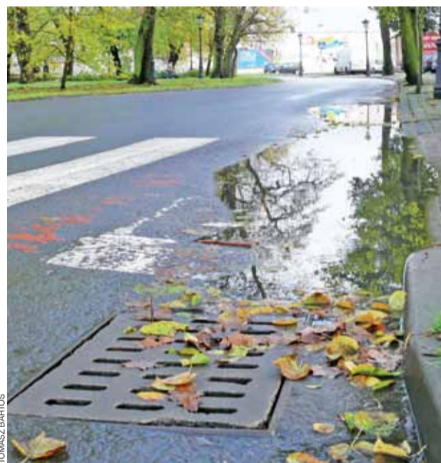
Aby piesi nie musieli skakać nad kałużą wystarczy o kilka centymetrów obniżyć kratę kanalizacji deszczowej.

Listę wszystkich projektów zgłoszonych do BO Łowicza publikowaliśmy w poprzednim numerze NŁ i na naszej stronie Łowiczanie.info. Głosowanie potrwa do 11 grudnia. aa