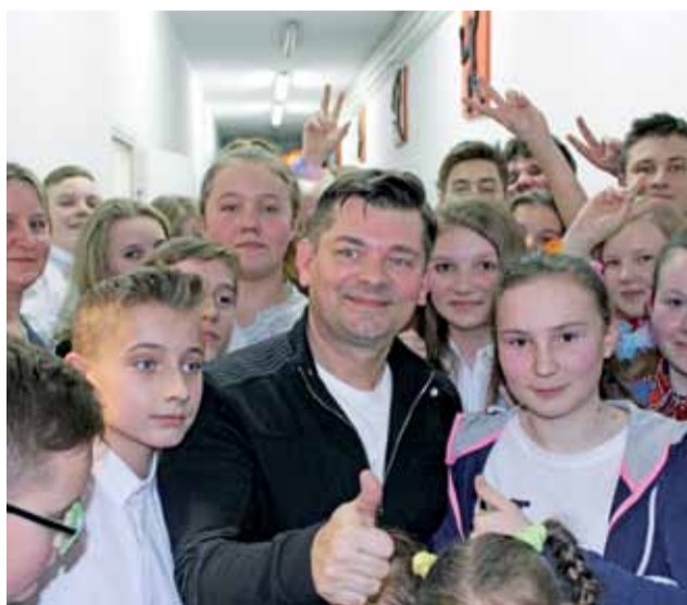
Foto z gwiazdorem. Zenon Martyniuk z wianuszkami młodych fanów, uczniów Zespołu Szkół w Lubiankowie.

Przypomnijmy, że po raz pierwszy w ubiegłym roku ŁOK przeprowadził plebiscyt, w którym poprosił o wybór artystów na łowickie imprezy. Najwięcej głosów zyskał Dawid Kwiatkowski – na jego koncercie na Dniach Łowicza bawiły się tłumy młodych ludzi. Spośród wybranych wykonawców udało się zaprosić też kilku innych, jak Saszan i Kamil Bednarek.