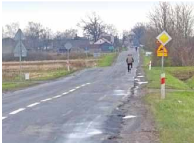
Tu doszło do śmiertelnego wypadku. Droga wojewódzka 703 w Piotrowicach. Stan nawierzchni i pobocza pozostawia wiele do życzenia.

Policja pod nadzorem Prokuratury Rejonowej w Łowiczu wyjaśnia okoliczności śmiertelnego potrącenia pieszego na drodze wojewódzkiej nr 703 w miejscowości Piotrowice, do jakiego doszło w niedzielę 19 listopada przed godziną szóstą rano.