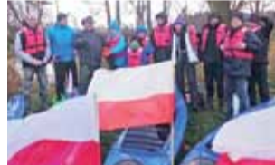
IV Kajakowy Spyw Niepodległości – Bzura 2017.

11 listopada Szkolny Klub Turystyki Kajakowej przy Zespole Szkół Centrum Kształcenia Rolniczego w Zduńskiej Dąbrowie zorganizował IV Kajakowy Spyw Niepodległości – Bzura 2017 na odcinku Strugienice – Łowicz. Uczestniczyło w nim kilkunastu mieszkańców gminy Zduny. Wszyscy mieli do kajaków przywiązane biało-czerwone flagi. Spyw odbywał się w przyjaznej atmosferze, a silny nurt rzeki, po-