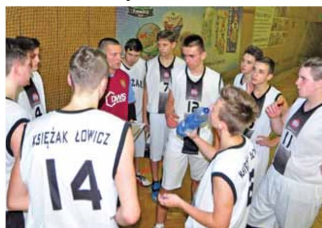
Ekipa UMKS Księżak jak na razie nie poczuła smaku zwycięstwa

– Mimo tego, że przegraliśmy, to był dobry mecz. Kiedyś z tą