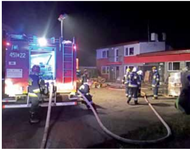
W akcji gaśniczej magazynu (parterowa część budynku) zaangażowanych było 39 strażaków z PSP oraz OSP.

“Dlaczego strażacy nie mogli pozwolić, żeby kobieta „dowodziła”? Ich zdaniem wprowadzała ona chaos w prowadzeniu akcji gaśniczej.