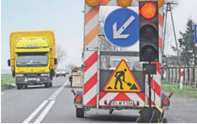
W okolicach Karsznicy w gminie Chąsno ruch odbywał się wahadłowo.