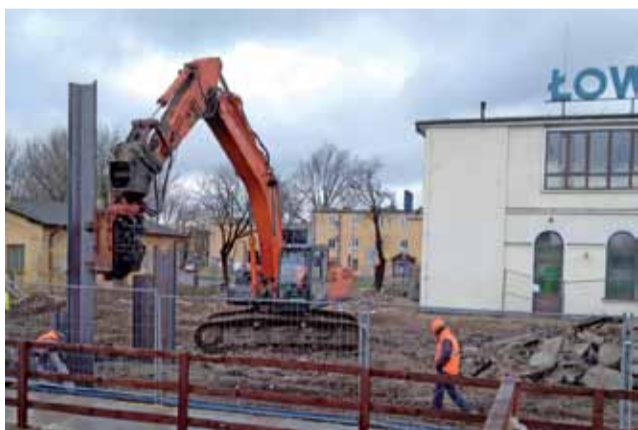
Grodzice wciskane są w grunt z wykorzystaniem wibromłota zamontowanego na koparce.

Przyjęcie uchwały budżetowej oraz związanej z nią wieloletniej prognozy finansowej zaplanowano na sesji Rady Miejskiej 28 grudnia. ■