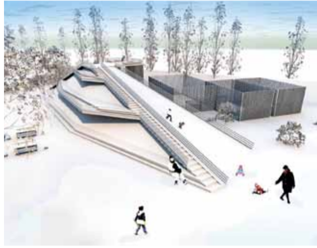
„Góra Frajdy” ma być atrakcyjna zarówno zimą...

Projekt zakłada budowę: stoku dla sanek zimą, rowerów latem; tarasów widokowo-rekreacyjnych z miejscami do siedzenia; najdłuższej w Łowiczu zjeżdżalni rynnowej; wygodnych schodów prowadzących na szczyt górki na Błoniach; placu do gry w minigol-