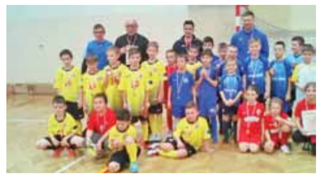
Wszyscy byli zwycięzcami w turnieju w Bielawach