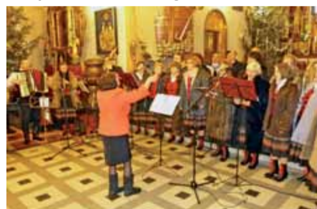
Koncert kolęd. Dla parafian kościoła św. Marcina w Strykowie wystąpił zespół ludowy Okaryna.

Zespół Okaryna przyjechał do Strykowa z gminy Andrzejów, gdzie skupia pieśniarzy i instrumentalistów z Justynowa i Janówki. Artyści zagrali i zaśpiewali wybór kolęd w ludowych aranżacjach. Strykowie usłyszeli m.in.: „O gwiazdo betlejemską”, „Teraz śpij Dziecinno mała” czy pastorałkę z folkowym refrenem „Hejże ino, dyna dyna, narodził się Bóg dziecina”. W przerwach między utwo-