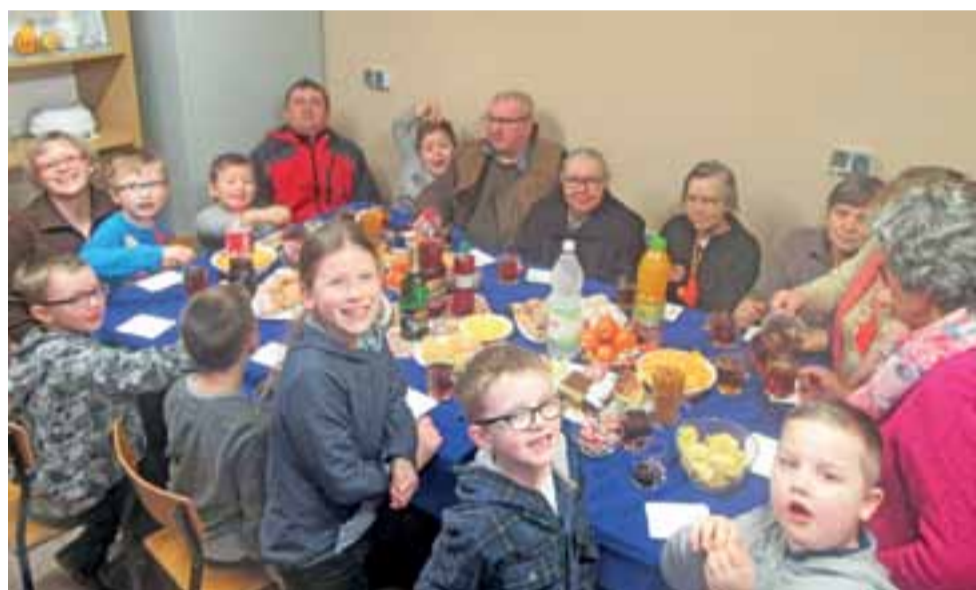
Dzień Babci i Dziadka w Piaskach Rudnickich. Po zabawie na świeżym powietrzu przyszedł czas na poczęstunek.

Rozpoczął się doroczny waleńtkowy konkurs fotograficzny Zakochane Zdjęcie, organizowany przez Dom Kultury w Niesułkowie. Prace można zgłaszać do 10 lutego. Konkurs przeznaczony jest dla mieszkańców miasta i gminy Stryków nie zajmujących się fotografią zawodowo. Każdy z uczestników może zgłosić 3 zdjęcia i dostarczyć je w formie co najmniej 13 na 18 do siedziby niesułkowskiego lub strykowski ośrodka kultury. Autorzy najciekawszych prac zostaną zaproszeni na uroczystość rozdania nagród, którą zaplanowano na 13 lutego, o 16.00, w Domu Kultury Niesułków. Wystawę pokonkursową będzie można oglądać od 21 lutego. IJS