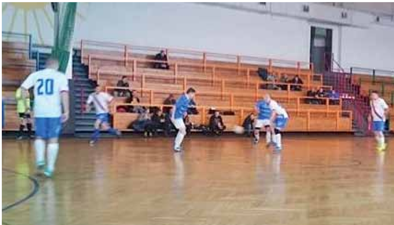
Druga drużyna Błękitnych Dmosin (niebieskie koszulki) w ostatnim czasie nieco obniżyła loty, ale wciąż ma szansę na podium IV Ligi ŁoLiF.