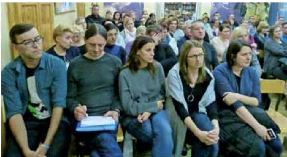
W spotkaniu z burmistrzem i przedstawicielem kuratorium udział wzięła liczba grupa nauczycieli Gimnazjum nr 2 oraz rodzice.

Następnie przedstawił wypracowaną już koncepcję zmian w oświacie, która zostanie przed-