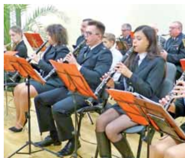
Występ orkiestry podczas sobotniej uroczystości w remizie OSP Sanniki.