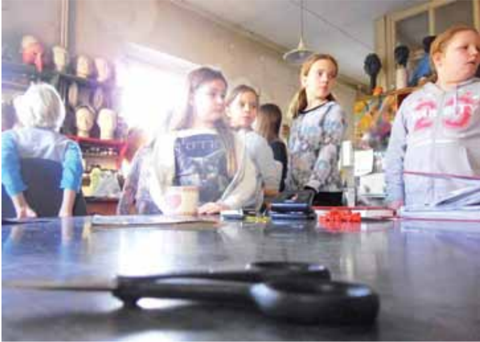
Zajęcia i warsztaty w Łodzi na dobre pobudziły kreatywność uczestników.