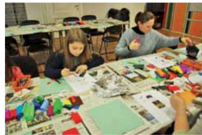
„Księżacki kolaż” – warsztaty z 29 stycznia.

Już tydzień później, 29 stycznia, na pożegnanie ferii zorganizowano zajęcia „Księżacki kolaż tęcza barw w stroju łowickim”. Po obejrzeniu muzealnej kolekcji uczestnicy, wykorzystując różnorodne materiały plastyczne, stworzyli techniką kolażu prace w kolorystyce charakterystycznej dla łowickich strojów ludowych.