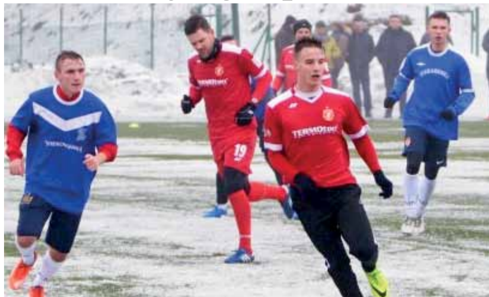
Zjednoczeni Stryków (niebieskie koszulki) szykują się do kolejnych meczów sparingowych.

Warto przyrzeć się także wynikom rywali Zjednoczonych w walce o punkty w IV lidze. W pojedynku dwóch czołowych ekip Warta Działoszyn pewnie