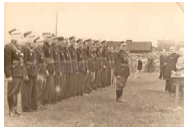
Lata 30. Pierwszy okres w bogatej historii orkiestry.