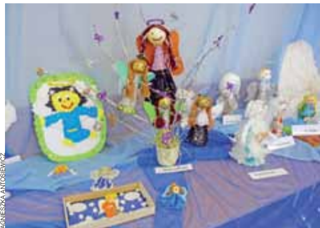
Wystawę prac, w której znajduje się 70 aniołów, wykonanych różnymi technikami, można oglądać w sali biblioteki do końca tygodnia.

Z nami też dwa seanse „Aż do piekła” Davida Mackenziego, będącego zgrabnym połączeniem kryminału z dramatem społecznym. Więcej jednak przed nami – w ramach festiwalu zostanie zaprezentowane jeszcze 16 filmów (wiele z nich po dwa seanse) i trzy koncerty. Festiwal potrwa do 26 lutego. tm