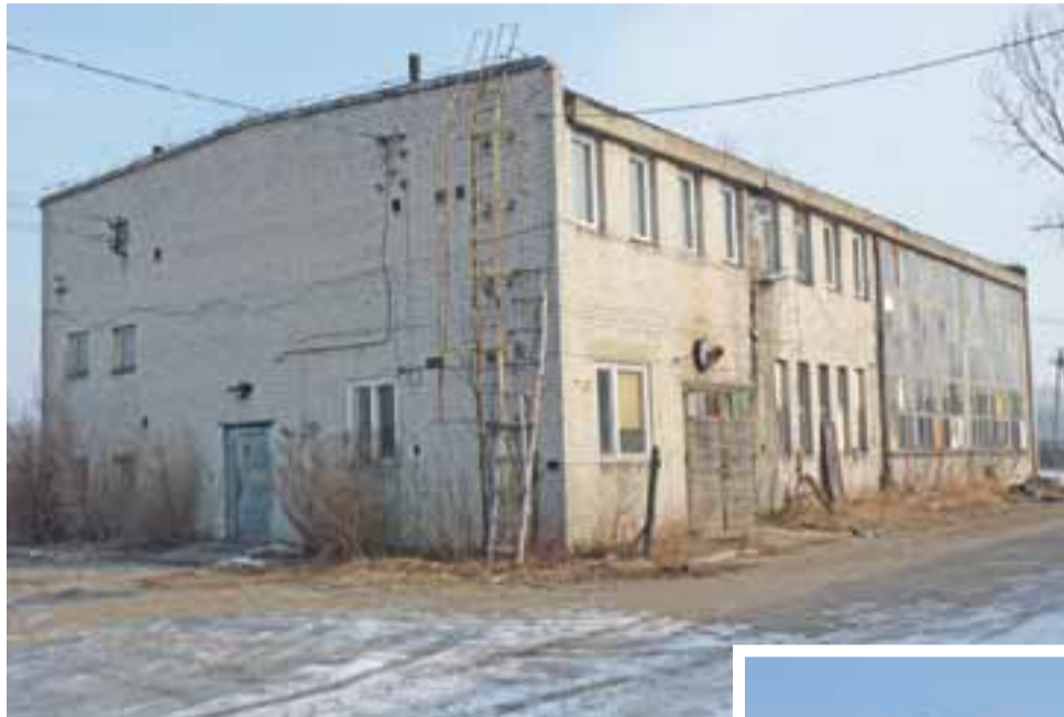
Budynek główny SKR. Jedynymi rezydującymi jeszcze w nim osobami są księgowa i pracownik, którzy porządkują sprawy Spółdzielni.