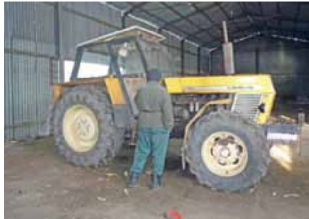
To jeden z ciągników marki Ursus, jaki pozostał do sprzedania z majątku Spółdzielni. Większość maszyn została już wyprzedana.

Łowicz | Zespół Szkół Ponadgimnazjalnych nr 3