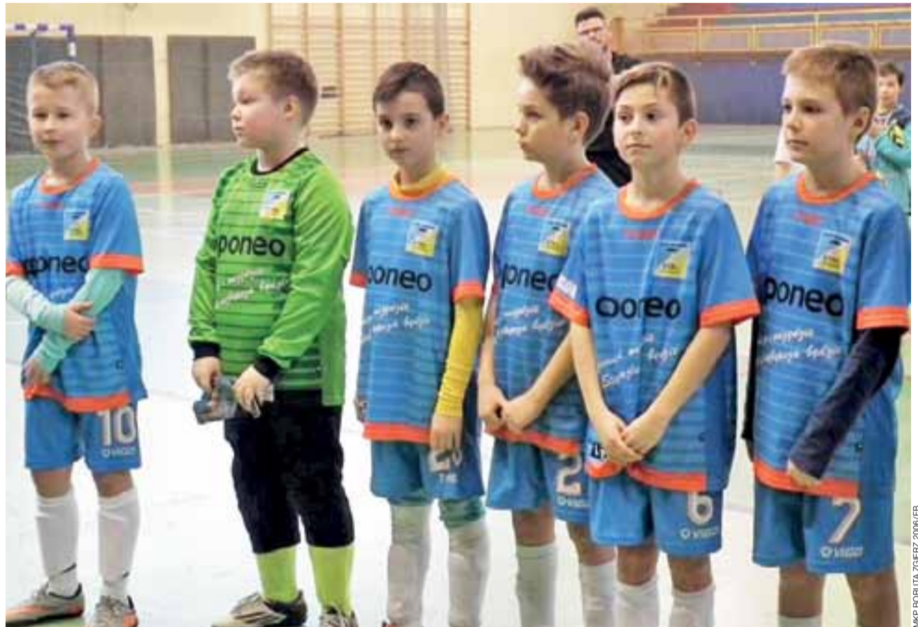
Młodzieży piłkarze Stali Głowno odnoszą sukcesy mimo krótkiego stażu treningowego.

■ Grupa B: Boruta I Zgierz - Widzew II Łódź 13:0, Stal Głowno - Termi Uniejów 2:0, Boruta I Zgierz - Termi Uniejów 0:1, Widzew II Łódź - Stal Głowno 1:4, Boruta I Zgierz - Stal Głowno 3:0, Widzew II Łódź - Termi Uniejów 2:2.