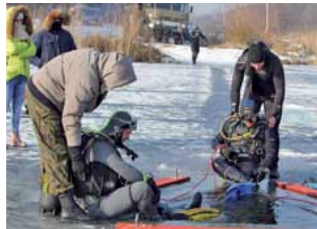
Przerębel w kształcie trójkąta już został wycięty w lodzie, a jego brzegi zabezpieczone czerwonymi deskami. Za chwilę nurkowie wejdą do wody.

Trudność zadania wynika przede wszystkim z grubości lodu, który z 15-18 cm, jakie miał przed 2 tygodniami, zwiększył się do 20 cm. I – jak podkreśla prezes – bar-