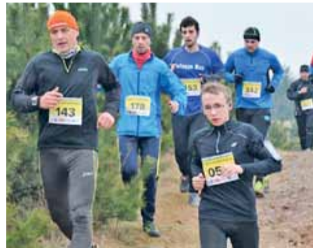
Uczestnicy Biegu Powstańca mogą liczyć na ciekawą, ale trudną trasę.