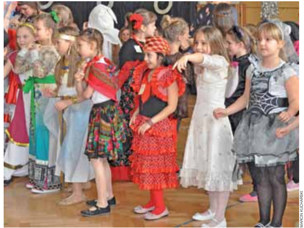
Królowe, księżniczki i inne bajkowe postaci wypełniły we wtorek, 31 stycznia salę gimnastyczną Trójki. Zabawa była wspaniała.

Zapraszamy do obejrzenia galerii zdjęć na www.lowiczanie.info