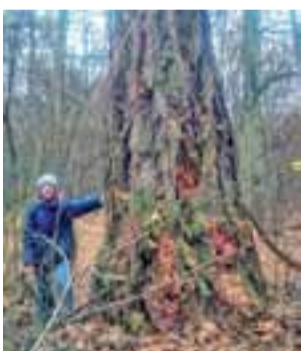
Modrzew polski z Trębaczewa.