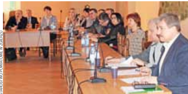
Przedstawiciele służb weterynaryjnych oraz zarządzania kryzysowego z urzędów miast i gmin wypracowali wspólne procedury postępowania na wypadek pojawienia ptasiej grypy.

wypracowali wspólne procedury postępowania na wypadek pojawienia się takich przypadków również na tym terenie. Powiatowy Lekarz Weterynarii przekazał zalecenia, których powinni przestrzegać hodowcy drobiu, aby zminimalizować ryzyko zarażenia. Chodzi przede wszystkim