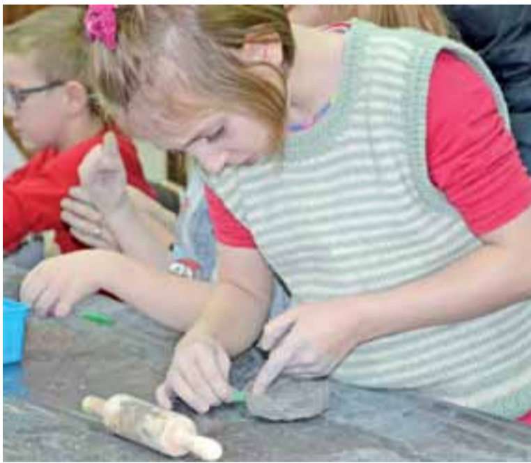
MIEJSKI OŚRODEK KULTURY