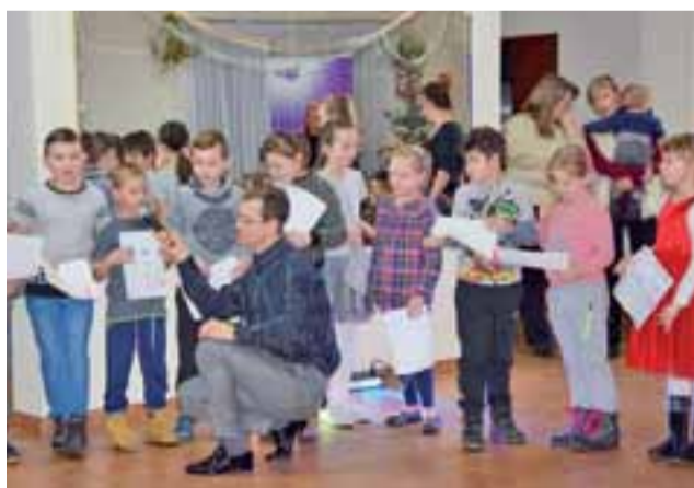
Jedną z atrakcji choinki w Zelgoszczy był konkurs plastyczny o wymarzonych świętach.

Muzyka i taniec serwowane przez DJ Show nie były jedynymi atrakcjami. Oczekiwanie na Mikołaja, który dla każdego dziecka przyniósł upominek, uprzyjemniły konkursy, gry i zabawy z nagrodami. Nie zabrakło słodkiego poczęstunku. Swój wkład w to, czym dzieci zostały obdarowane, miały również firmy, których