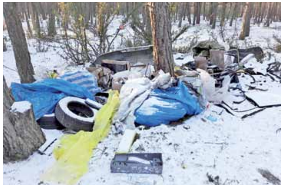
Tak wyglądał las w okolicach Woli Zbrożkowej po „wizycie” 44-letniego mieszkańca Zgierza

Tym razem udało się pokrzywdzonego namierzyć. Już na pierwszy rzut oka widać, że Krzysztof B. ucierpiał w ataku z sierpnia 2015. poważnie. Do dziś porusza się o kulach i to ze sporym trudem. str. 2