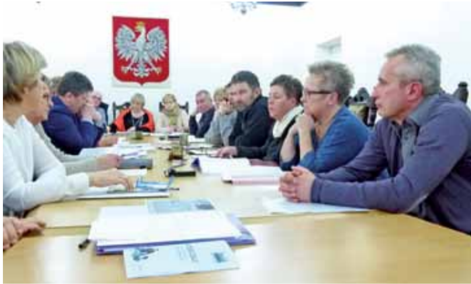
Twardy orzech do zgryzienia. Trwa dyskusja nad kształtem sieci szkół miejskich po reformie. Głowno, 30 stycznia.

Przed omówioną wyżej wymianą koncepcji na funkcjonowanie sieci szkół, w dyskusji raz jeszcze mowa była o proponowanym przez burmistrza pierwotnie rozwiązaniu – czyli utrzymaniu trzech podstawówek i „naturalnym” wygaszeniu gimnazjum, przy równoczesnym zatrudnianiu jego nauczycieli w szkołach podstawowych. Drugi i wcześniej nie dyskutowany wariant zakłada włączenie gimnazjum do jednej ze szkół podstawowych, najprawdopodobniej najbliższej położonej SP nr 2, z zapisaniem, że zajęcia odbywałyby się w jej budynku głównym oraz w budynku obecnego gimnazjum. Zgodnie z zapisami prawa oświatowego to rozwiązanie można wdrożyć we wrześniu 2017 r., we wrześniu 2018 r. lub, najpóźniej, we wrześniu 2019 r. Z dniem włączenia gimnazjum do podstawówki nauczyciele gimnazjalni staliby się z automatu jej pracownikami. W budynku gimnazjalnym na ul. Kościuszki najprawdopodobniej uczyłyby się klasy starsze – VII