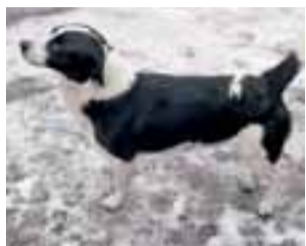
To te psy zabrał ze sobą upośledzony mężczyzna.

furtkę. Wówczas musiały spotkać mężczyznę, z którym udały się na wędrowkę w kierunku Brzeziny. Psy ponoć są nierozłącznymi kompanami z podwórka, co wyjaśniałoby fakt, że gdy mężczyzna przywiązał jednego z nich rajtuza, drugi poszedł za nim dobrowolnie.