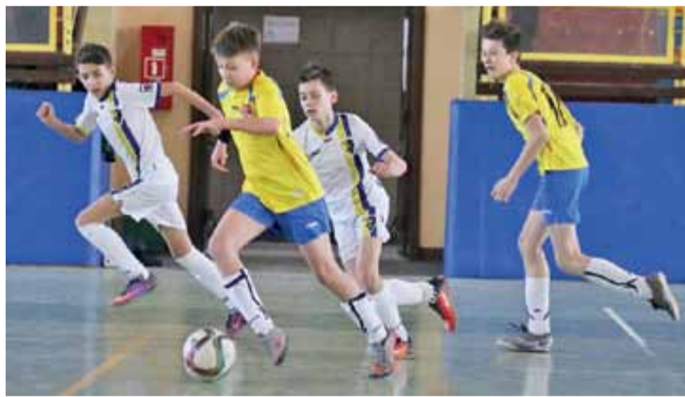
Młodzi piłkarze Zjednoczonych (białe stroje) tym razem musieli uznać wyższość rywali.

W zmaganiach na zakończenie ferii zimowych w niedzielę, 29 stycznia udział wzięło 10 zespołów. Najpierw grano w ramach fazy grupowej, a później bezpośrednio w walce o poszczególne miejsca. Zjednoczonym nie udało się awansować do strefy medalowej. Strykowie