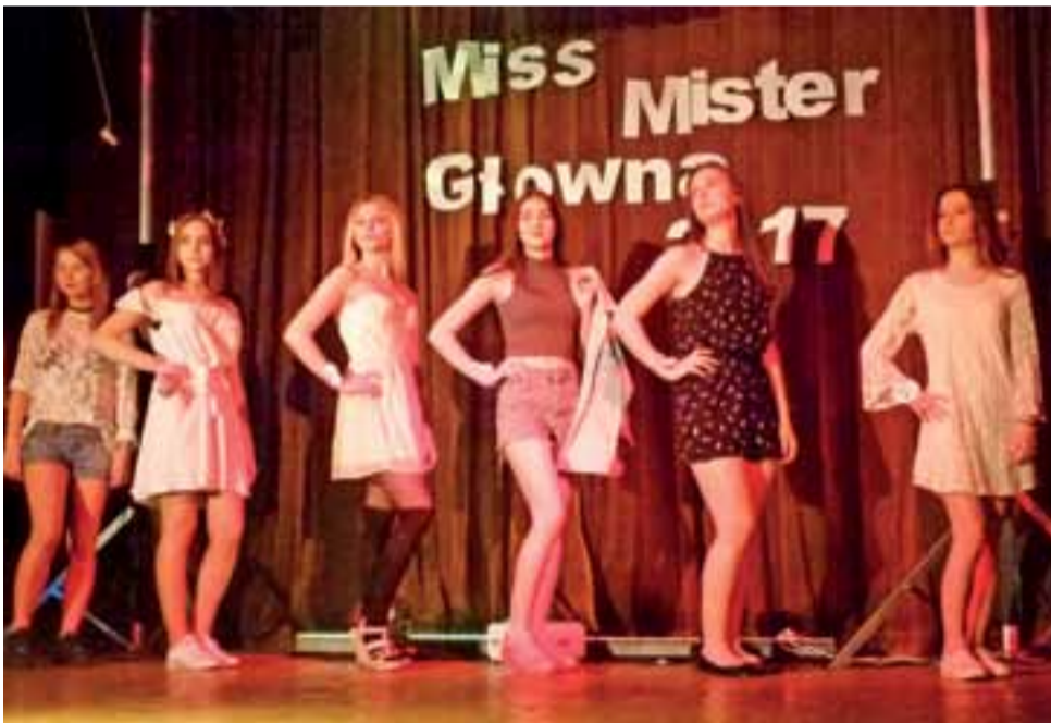
Kandydatki na Miss Głowna w czasie jednej z prezentacji.