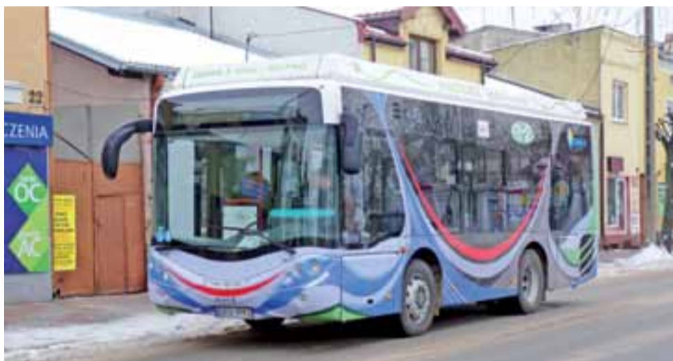
Autobus elektryczny na Łowickiej.