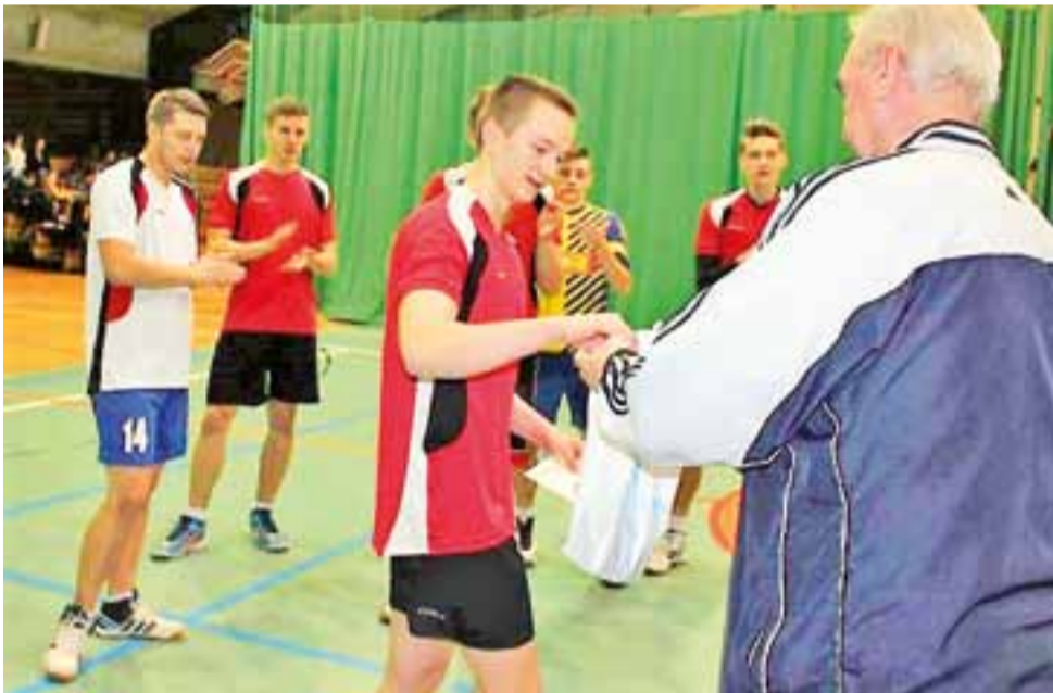
Siatkarze Volleyball Głowno odbierają nagrodę za zwycięstwo w meczu. Głównianie walczą o podium w lidze.

■ Następna, 10. kolejka odbędzie się w sobotę, 25 lutego: GTK Głowno – UMKS Książak Łowicz, ŁKS Szkoła Gortata II Łódź – KKS Pro-Basket Nijhof Wassink Kutno, LUKS Trójka Sieradz – PKK 99 II Pabianice, SKS Start II Łódź – Esbank Junak Radomsko, AZS PWSZ II Skierniewice – pauza.