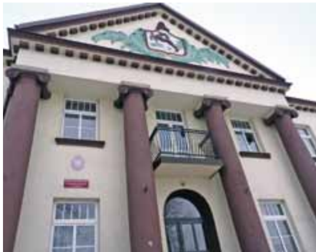
Z wyliczeń gminy wynika, że najstarsza szkoła w mieście nawet mimo okrojonego obwodu nie powinna narzekać na brak uczniów.

Przy okazji reformy gmina Stryków zamierza usankcjonować to, co już od dłuższego czasu funkcjonuje w praktyce. Chodzi o wyjęcie z obwodu szkoły w Dobrej wsi Sosnowiec, z której to dzieci i tak są zapisywane do szkoły przy ul. Targowej. Z prognoz opartych na liczbie dzieci urodzonych i zameldowanych w latach 2010-2014 wynika, że w SP2 w kolejnych latach uczyć się będą po dwie klasy z danego rocznika. W SP1 będą to klasy pojedyncze. Na niektóre podwójne klasy liczyć może liczyć natomiast szkoła w Dobrej, która od lat odnotowuje napływ uczniów.