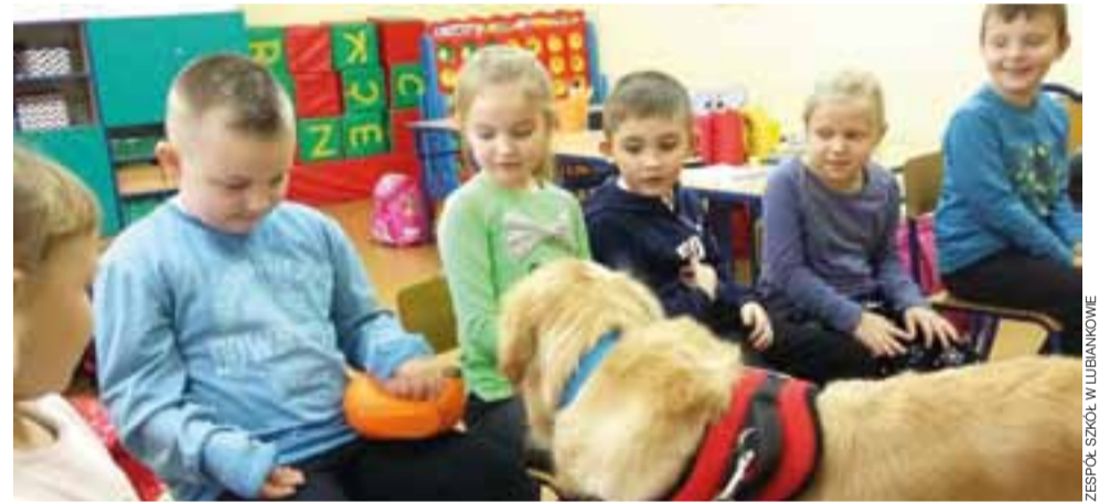
Dogoterapia w Lubiankowie. Zajęcia z udziałem pierwszoklasistów i psa rasy golden retriever.