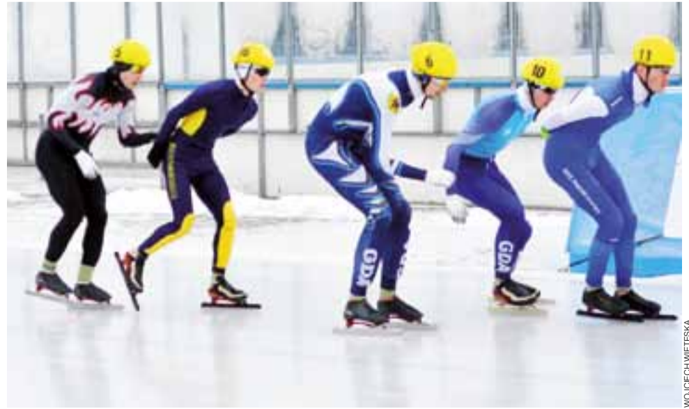
Rywalizacja w short tracku dostarcza wielu emocji. Łyżwiarze pokonują krótki dystans z wielką prędkością.

■ Drużynowy występ chłopców (6 ekip startujących): 5. I zespół UKS Błyskawica, 6. II zespół UKS Błyskawica.