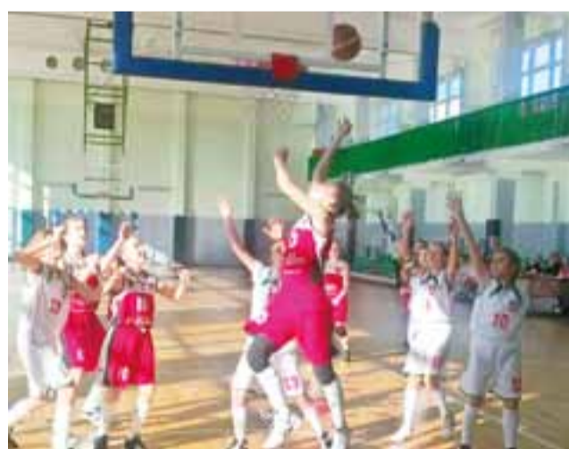
Młodziczki Alles Basket (czerwone stroje) wróciły do gry o 1. miejsce.

TK Basket Stryków - Alles Basket Głowno 34:80 (4:11, 13:14,