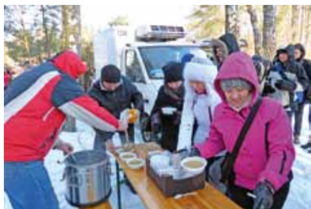
W Joachimowie-Mogiłach, już na początku rajdu, uczestników ugościł wójt gminy Bolimów, fundując gorącą i pożywną grochówkę.