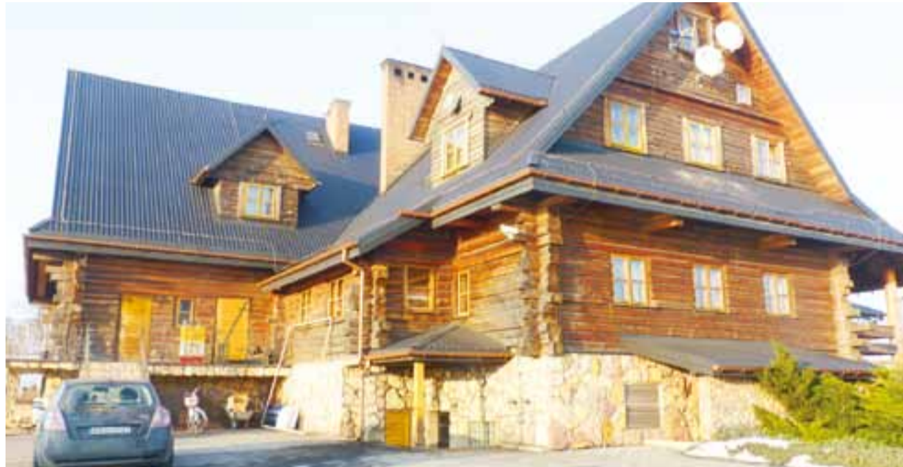
Zajazd „Basior” między Kutnem a Krośniewicami. Tam odbyły się dwa nieformalne spotkania części członków Rady Nadzorczej, na których omawiano planowane zmiany.