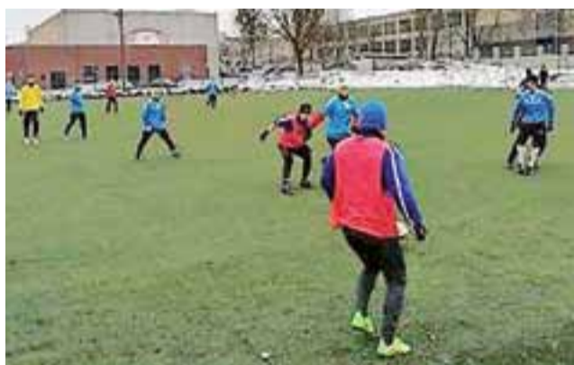
Piłkarze Stali Główno (niebieskie koszulki) w trakcie zimowego okresu przygotowawczego kroczą od zwycięstwa do zwycięstwa. Miejmy nadzieję, że tak samo będzie w trakcie zmagani ligowych.

Mecz zaczął się, co prawda nie po myśli głownian, ale jeszcze przed przerwą podopieczni trenera Tomasza Szcześniaka opanowali sytuację, prowadząc pewnie 3:1. Gole zdobywali zawodnicy zarówno etatowi w bar-