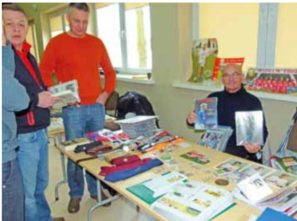
Kolekcjonerzy pamiątek sportowych w Domu Kultury w Niesułkowie.

Transakcji finansowych na giełdzie raczej nie było. Kolekcjonerzy preferowali wymianę barterową.