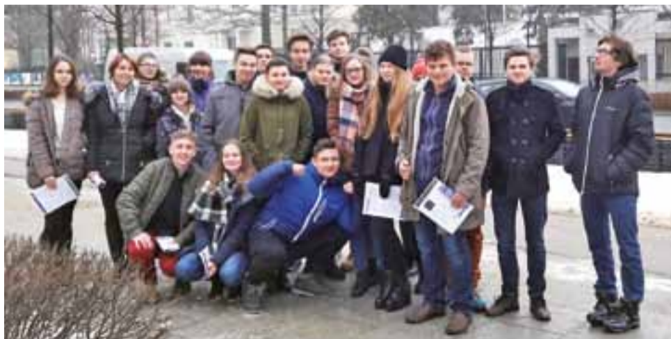
Przed Ambasadą Stanów Zjednoczonych. Licealiści z ZSLG w Głownie na interesującej wycieczce.

Odwołując się licznych przykładów współpracy polsko-kanadyjskiej, nawiązał do obchodzonej w tym roku przez Kanadę 150 rocznicy państwowości, czyli utworzenia w 1867 r. konfederacji. Dyplomata opo-