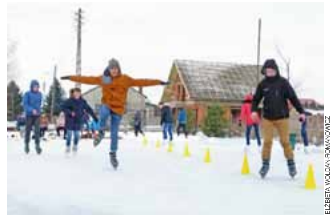
Takie lekcje to lubimy! – twierdzą uczniowie Szkoły Podstawowej i Gimnazjum w Sobocie, którzy na zajęciach wychowania fizycznego uczą się jazdy na łyżwach. Tutaj – zajęcia 10 lutego.

akurat na lodzie byli uczniowie I klasy gimnazjum oraz młodsze dzieci ze świetlicy. Wszyscy przyznali, że utworzenie lodowiska przy szkole to strzał w dziesiątkę i dali nam popis swoich umiejętności.