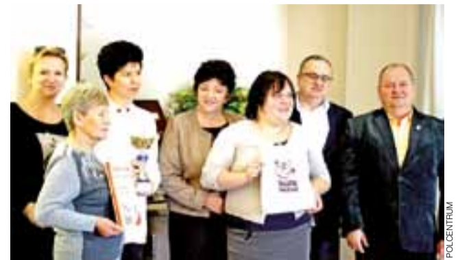
Zdobywcą nagrody w konkursie „Opowiedz...” w tym roku zostało KGW Szczecin, które nakręciło film o swoim projekcie. Na zdjęciu reprezentacja koła, dmosińskiej biblioteki i gminy oraz Polcentrum.