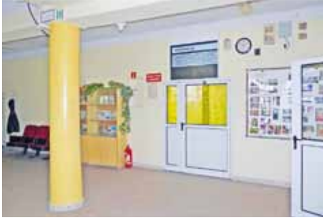
Korytarz łączący główną salę wykładową, mniejszą salę stanowiącą jej zaplecze oraz dawną stołówkę – niebawem wszystko tu się zmieni.

mi do niej dwoma pomieszczeniami: zapleczem oraz pomieszczeniem dawniej stołówki. Po remoncie pomieszczenia będzie można łączyć za pomocą przesuwanych ścianek działowych, co da możliwość wykorzystania ich w dwojaki sposób: jako salę szkoleniową oraz salę bankietową. Przewidziano gruntowną modernizację zaplecza kuchennego i dawniej stołówki, które nie spełniają obecnych wymagań sanitarno-epidemiologicznych. Chodzi również o dostosowanie do obowiązujących standardów sanitariatów, schodów wejściowych do budynku oraz pochylni dla nie-