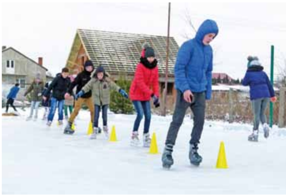
Nauka jazdy ślalomem między pachółkami. Na tafli uczniowie klasy I Gimnazjum w Sobocie.