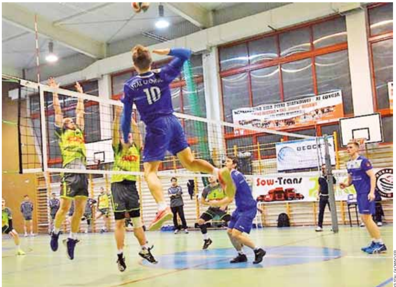
Siatkarze Stali Głowno (niebieskie stroje) mają w tym sezonie ciężką przeprawę, ale czasami pokazują świetną grę i ukryty potencjał.

■ 11. kolejka: Volley Team Żychlin – SMS PZPS IV Spała 0:3 (24:26, 16:25, 14:25), KS Huragan Widawa – KS Stal Głowno 3:0, MUKS Juwenia Rawa Mazowiecka – LUKS