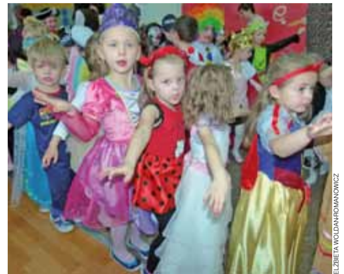
Bal karnawałowy. Tak 7 lutego bawiły się dzieci z Miejskiego Przedszkola Nr 3 w Głownie.

Na ostatniej sesji Rady Powiatu Zgierskiego, 27 stycznia, samorządowiec wniósł interpelację w sprawie zajęcia wspólnego stanowiska w obronie granic administracyjnych gminy Stryków i powiatu.