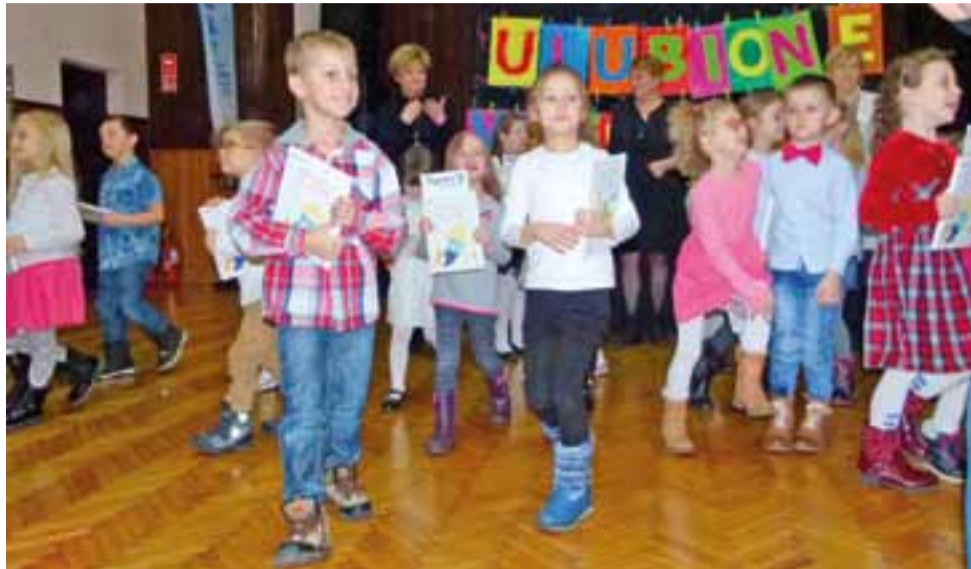
Chwila po podsumowaniu konkursu „Ulubione wierszyki”. Wszyscy uczestnicy otrzymali nagrody.

W sumie z MP1 w „Ulubionych wierszykach” wystąpiło siedmiu dzieci, tyle samo co z Miejskiego Przedszkola Nr 3. Tutaj przedszkolaki przygotowały do występu kilka pań, dzieci wybierały takie wiersze, w których same czuły się najlepiej, a przed