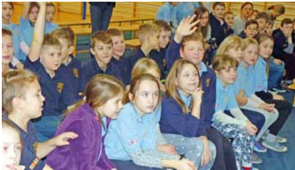
Na początku goście sprawdzili wiedzę uczniów Pijarskiej Szkoły Podstawowej o instrumentach dętych. Okazało się, że wiedzą o nich sporo.

Edukacyjna część spotkania była przeplatana koncertem muzyki rozrywkowej, w której znalazły się tak znane motywy, jak ten z „Gwiezdnych wojen”. aa