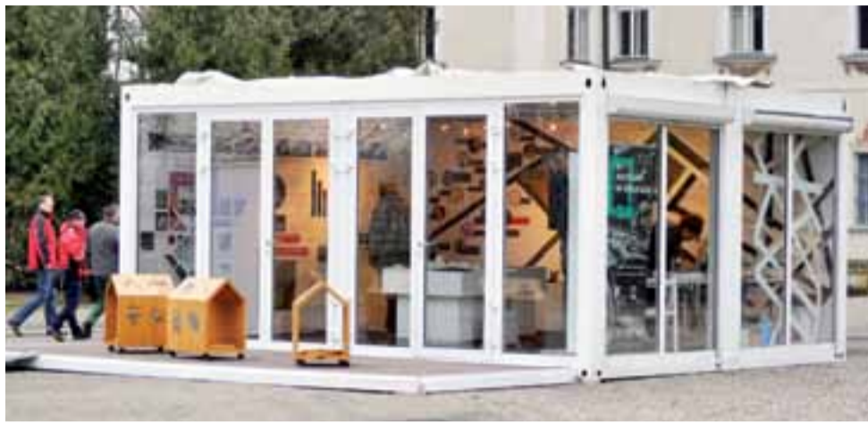
Pawilon, który dzisiaj stoi na Nowym Rynku w Łowiczu, przez trzy dni stał przed pałacem w Nieborowie.

Podczas prelekcji słuchaczom przedstawiony zostanie zarys historii Żydów w Łowiczu, począwszy od najwcześniejszych informacji na temat osadnictwa żydowskiego w okolicach naszego miasta, aż po czasy powojenne. Po wykładzie istnieje możliwość obejrzenia muzealnej