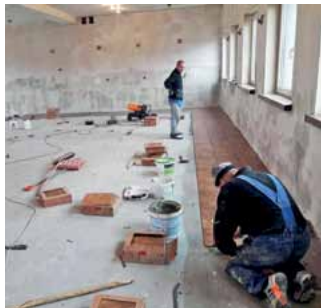
Prace ruszyły. Remont sali OSP w Woli Zbrożkowej.

Na wspomnianym styczniowym zebraniu podsumowano działalność spółki w roku 2016 i nakreślono plany na rok 2017. W ubiegłym roku w ramach konserwacji urządzeń melioracyjnych wykoszono mechanicznie rowy o łącznej powierzchni 36 tys m 2 , przeprowadzono także naprawy uszkodzonych zbieraczy i przepustów. Na prace te, zrealizowane przez firmę Dariusza Śliwkiewicza z Bratoszewic, wydatkowano pieniądze pochodzące z 15-tysięcznej dotacji z Urzędu Miejskiego w Głownie oraz ze składek, których w 2016 r. zebrano 4367 zł. W roku bieżącym dotacja z miasta wyniesie 12 tys. zł, natomiast spółka ubiega się także o środki na swoją działalność w Urzędzie Marszałkowskim (złożono wniosek opiewający na około 4 tys. zł) i zamierza wystąpić o dotację z Łódzkiego Urzędu Wojewódzkiego. Pieniądze znów będą przeznaczone na wykaszanie rowów melioracyjnych w Głownie oraz naprawy awarii według zgłoszeń. ewr