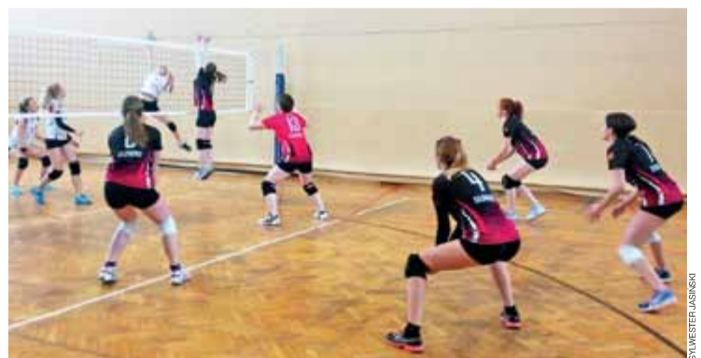
Siatkarki Stali (czarno-czerwone stroje) będą walczyć o mistrzostwo.