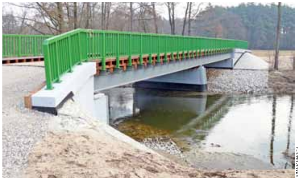
Po gruntownej przebudowie most w Sokołowie prezentuje się okazale.

do Brukseli. Zarządca infrastruktury zapewniał natomiast, że modernizacja linii przyniesie szereg innych korzyści, w tym np. znaczne zwiększenie przepustowości linii, poprawi bezpieczeństwo i nie będzie konieczności ograniczania prędkości na linii w najbliższym czasie. W opinii Fundacji ProKolej celowe byłoby ograniczenie zakresu projektu. Fundacja ta jednocześnie wskazywała m.in., że nie ma wątpliwości co do celowości przebudowy stacji m.in. w Łowiczu oraz planowanego u nas wiaduktu. mak