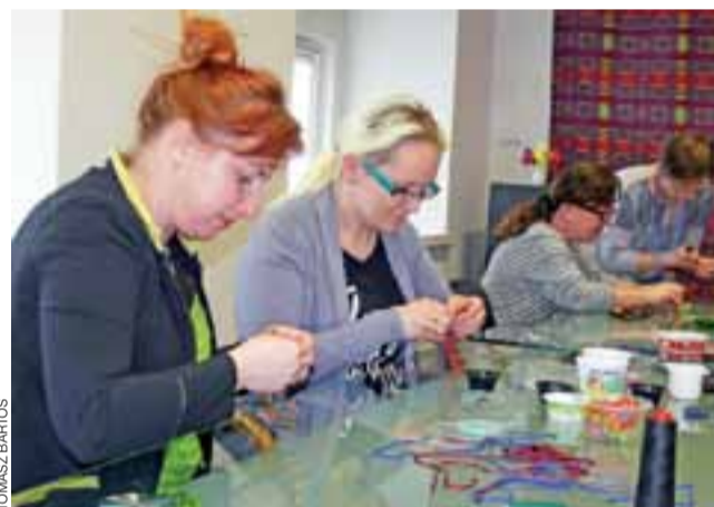
Uczestniczki warsztatów powiedziały nam, że wykonanie bransoletek w technice sutaszu wymagało wiele cierpliwości i koncentracji.

Wszystkie zwycięskie projekty będą realizowane od marca do listopada 2017 roku. ■