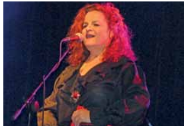
Artyści z Łódzkiego Teatru Piosenki zaprezentowali twórczość Hanki Ordonówny z różnych etapów jej życia.

W programie „Miłość ci nie nie wybaczy” wystąpili dobrze znani tej publiczności artyści z Łódzkiego Teatru Piosenki. Była to opowieść o życiu i twórczości wszechstronnie uzdolnionej Hanki Ordonówny – przedwojennej polskiej piosenkarki, tancerki i aktorki, autorki wierszy i wielu tekstów piosenek. Program piosenek wzbogacony został o informacje