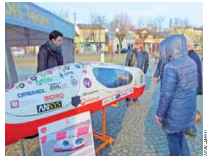
Bolid EcoArrow to rekordzista Polski pod względem oszczędności paliwa.