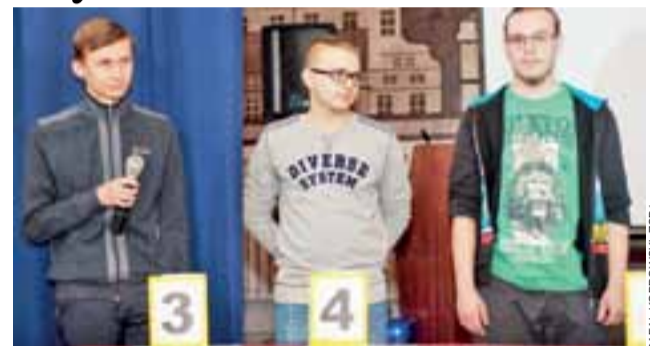
Uczestnicy konkursu odpowiadali na trzy serie pytań: z matematyki, fizyki oraz przedmiotów przyrodniczych.

Po każdej serii pytań oglądali krótkie filmiki, dotyczące motywu przewodniego tegorocznej edycji konkursu, którym były odnawialne źródła energii. Podczas starcia finałowego uczestnicy odpowiadali na pytania dotyczące in-