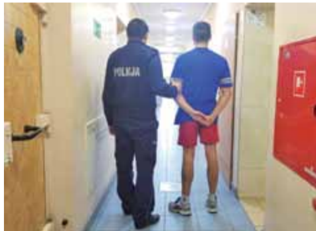
Jeden z zatrzymanych w Głownie. Wraz z kompanem odpowie za rozbój w Głownie.

Jak informuje Komenda Wojewódzka Policji w Łodzi, 7 marca około godz. 4.00, pracownica jednego z salonów z automatami do gier w Głownie zakończyła pracę. Po zamknięciu salonu szła ulicami Głowna mając w torebce pieniądze z utargu. Gdy była na ul. Sikorskiego, została zaatakowana przez nieznanego mężczyznę. Napastnik złapał pokrzywdzoną za włosy, a następnie rozpylił jej w oczy najprawdopodobniej gaz łzawiący. Wtedy wyrwał kobiecie torebkę i uciekł.