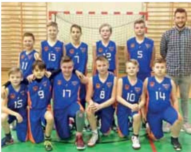
Zacy GTK Głowno podczas finału w Skierniewicach zajęli 3. miejsce.

Z kolei młodzicy Głowieńskiego Towarzystwa Koszykówki pod