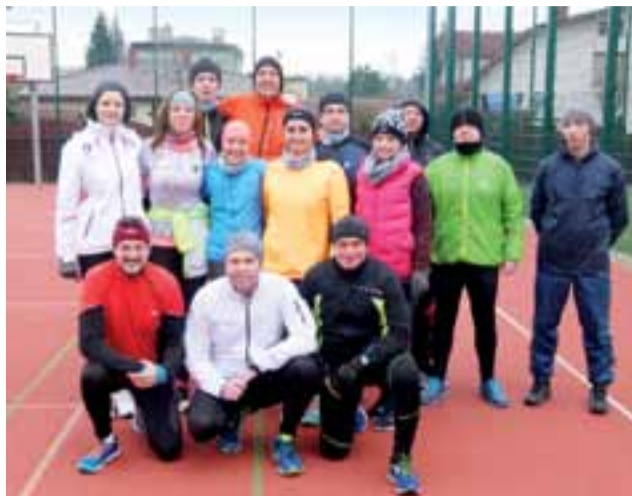
Członkowie klubu „Główno w biegu” na niedzielnych zajęciach.