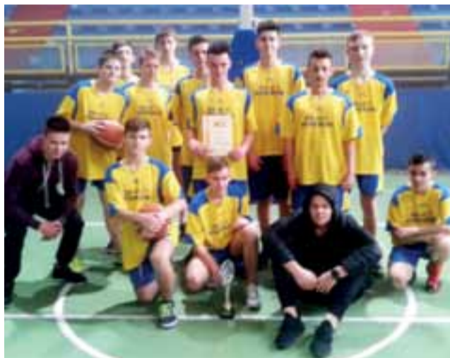
Strykowianie z ZS 1 od kilku lat należą do czołówek szkół w powiecie.

z Zespołu Szkół nr 1 w Strykowie różnicą zaledwie 1 pkt. 24 do 23.