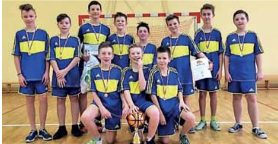
Mistrzowie Gminy ze Szkoły Podstawowej nr 2 w Strykowie byli zdecydowanie nie do pokonania.