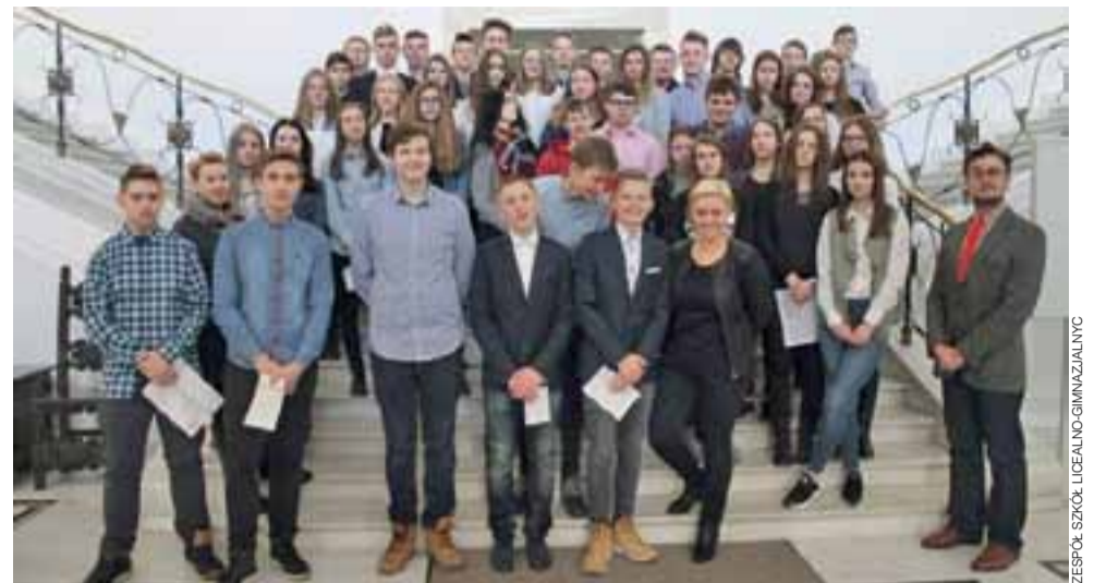
Na korytarzu sejmowym. Gimnazjaliści z ZSLG w Głownie 15 lutego odwiedzili Warszawę.

Głowno | Zespół Szkół Licealno-Gimnazjalnych