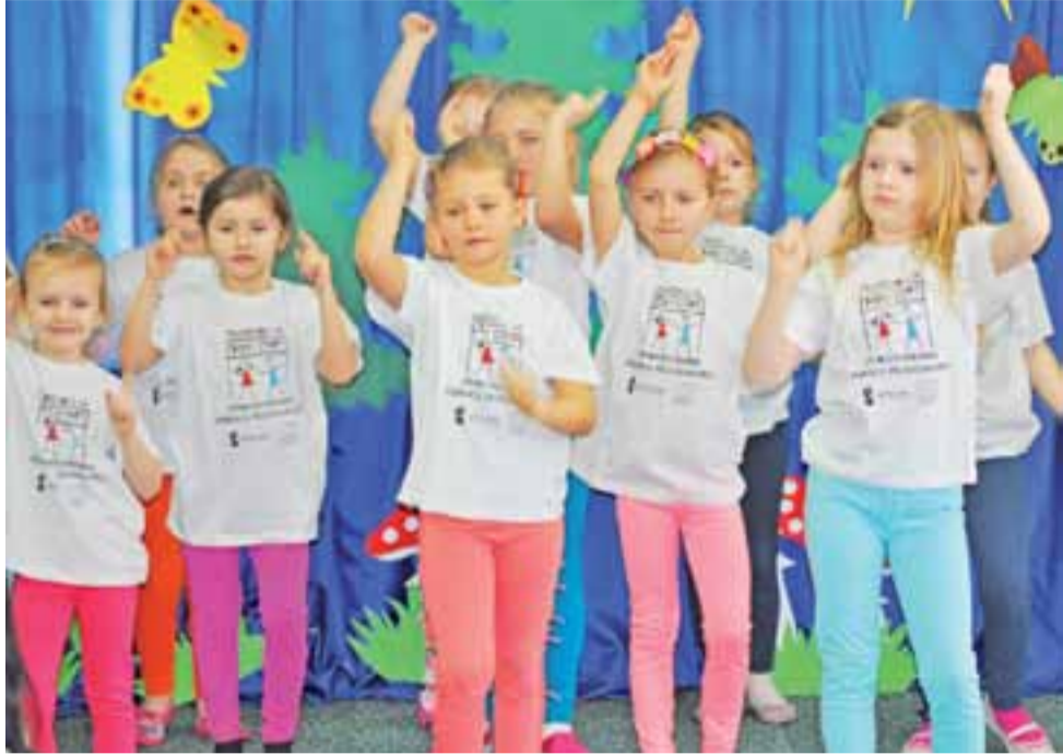
Tęczowe przedszkolaki tańcem zachęcały do zapisywania się do „ich” przedszkola.