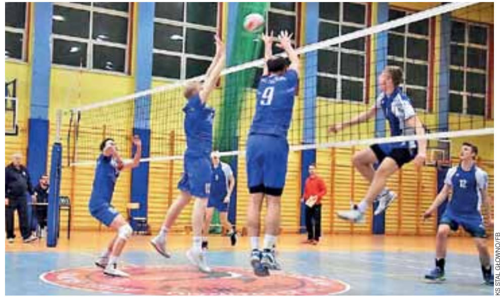
Siatkarze Stali (niebieskie stroje) zakończyli sezon i swoją grą będą cieszyć oko dopiero w przyszłym roku.

■ 14. kolejka: SMS PZPS IV Spała – MUKS Juwenia Rawa Mazowiecka 3:0 (25:22, 25:18, 25:15), LUMKS Kasztelan Rozprza – KS Huragan