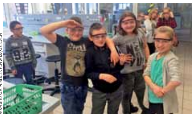
Uczniowie w laboratorium Politechniki Łódzkiej. Przerznięcie zwykłe zarezerwowane dla studentów i naukowców mieli okazję odwiedzić czwartoklasiści z ZSP w Mąkolicach.

Prace artysty będzie można oglądać do 21 kwietnia. ki