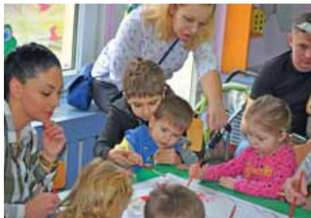
Wspólne malowanie, rysowanie i „poszukiwanie skarbów” było nie lada atrakcją dla najmłodszych.