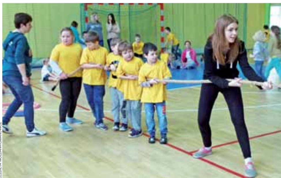
Przebieganie liny. Drużyna Miejskiego Przedszkola nr 3 w Głownie w pełnej gotowości.

strzygnięte, inne (gminny, powiatowy i marszałkowski) są przed ogłoszeniem wyników. „Senior” będzie ponownie składał także wnioski do Łódzkiego Urzędu Wojewódzkiego. W tym momencie ma już zagwarantowane 21.360 zł z miasta na realizację w sumie 4 zadań. Na warsztaty chórálne i wyjazd na ćwiczenia pozyskano 6.360 zł, na współorganizowanie z ZNP kolejnego turnieju siatkarskiego – 2 tys. zł, na projekt wyjazdów krajoznawczych pod hasłem „Poznajemy regiony kraju” – 3 tys. zł, a na różne zajęcia w ramach projektu „Czas wolny z Seniorem” (wyjazdy do teatru, na basen, spotkania z ciekawymi ludźmi itp.) – 10 tys. zł. ■