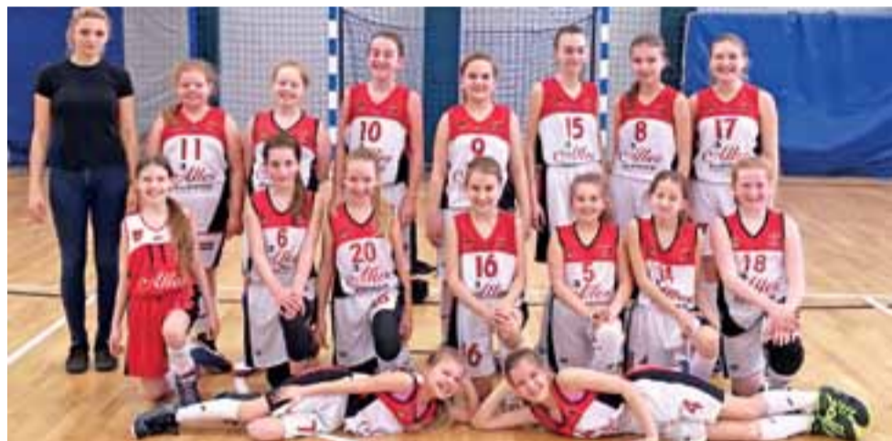
Zaczki Alles Basket Głowno mogą zająć 3. miejsce w rozgrywkach.

Koszykówka | 10. i 11. kolejka WLK U-12 K