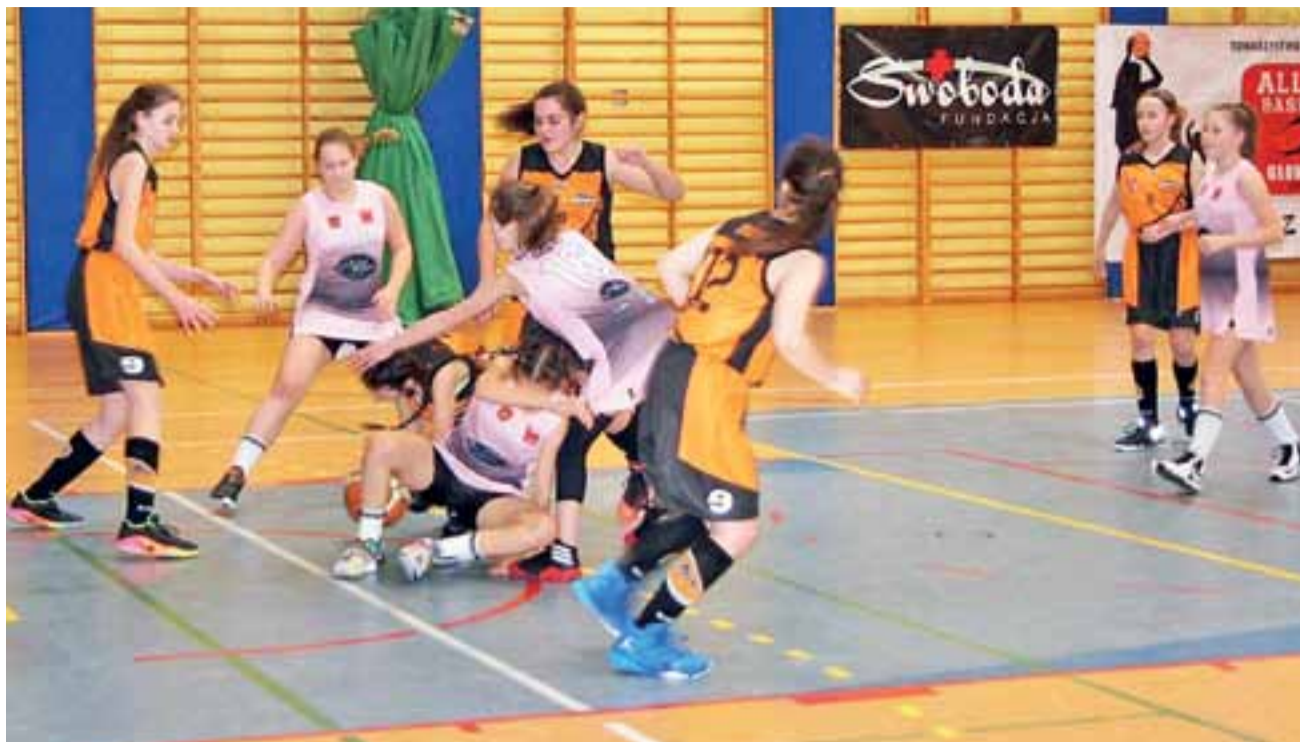
Alles Basket (różowe stroje) jest w tym sezonie w świetnej formie. Młodziczki Głowna mają szansę na zwycięstwo w lidze wojewódzkiej.

Koszykówka | 16. kolejka WLK U-14 K, gr. A