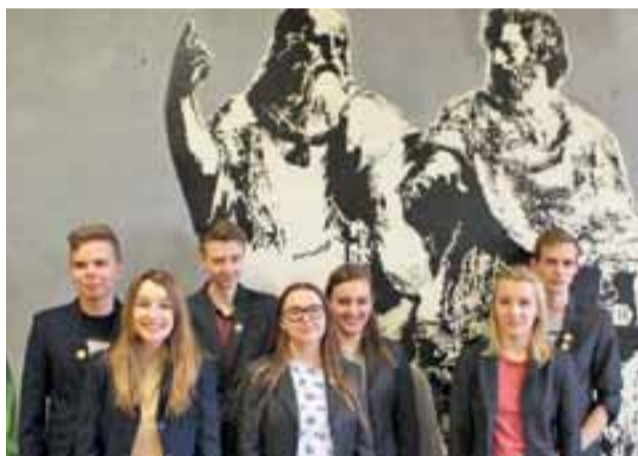
Uczniowie I Liceum Ogólnokształcącego w Łowiczu, którzy wzięli udział w okręgowym etapie XXIX Olimpiady Filozoficznej.

– Te pytania filozoficzne i ciekawość świata w nich są i nagle okazuje się, że jest dziedziną, któ-