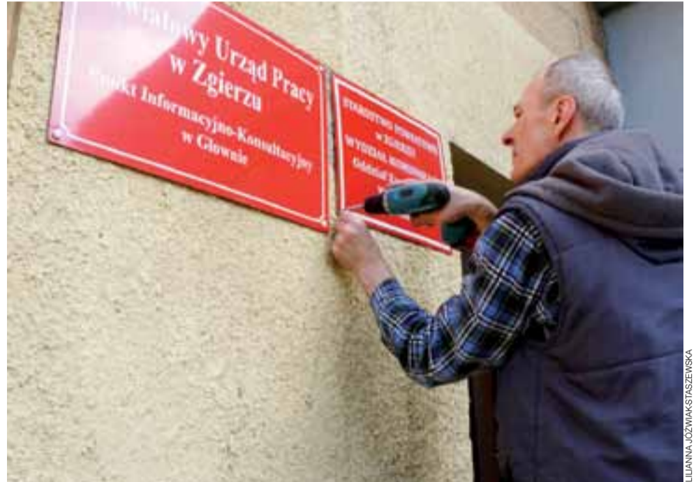
Wymiana tablic na budynku przy ul. Norblina 1 dokonana się już we wtorek, 14 marca.

Oddział znajduje się pod tym samym adresem, gdzie do tej pory funkcjonował Punkt Obsługi Klienta Wydziału Komunikacji, czyli przy ul. Norblina 1, z tą jednak różnicą, że przesunięty został o jeden pokój w głąb korytarza i obecnie zajmował będzie dwa pomieszczenia. Będzie tu można załatwić sprawy związane z rejestracją pojazdów, m.in. rejestracją i przerejestrowaniem pojazdów (krajowych, sprowadzonych z zagranicy), czasową rejestracją pojazdu, odbiorem stałego dowodu rejestracyjnego, zgłoszeniem zbycia i nabycia pojazdu, odbiorem dowodu rejestracyjnego zatrzymanego