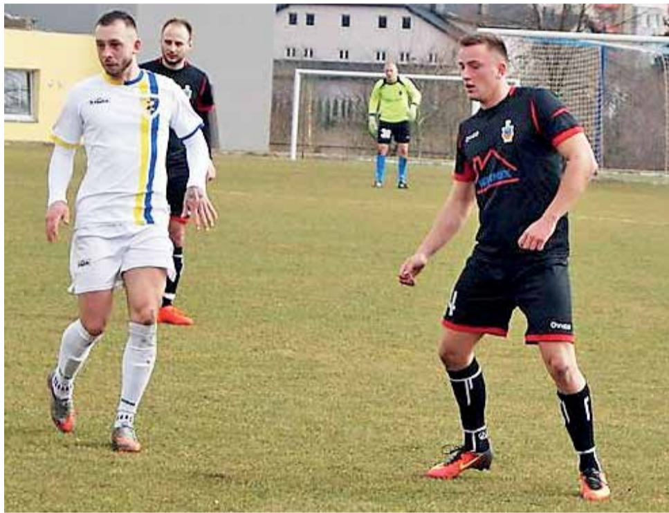
Drużyna Zjednoczonych Stryków (białe stroje) udanie rozpoczęła rundę wiosenną rozgrywek IV ligi, pokonując 2:0 Zawiszę Pajęczno.

Niedzielne spotkanie mogło jednak potoczyć się zupełnie in-