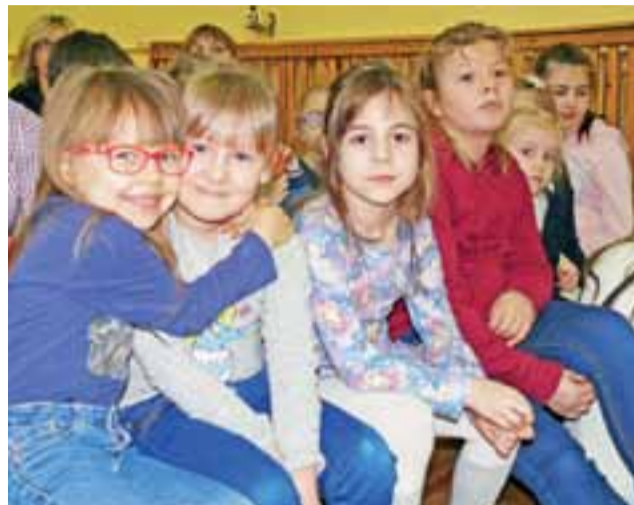
Przyszłym uczniom i uczennicom, które przyszły do „Jedynki” na dzień otwarty dopisywał humor.

Podczas spotkania w sali gimnastycznej dyrektor przekonywała rodziców o wyjątkowej atmosferze panującej w placówce oraz o doświadczonych, wykwalifikowanej kadry, która jest nie tylko otwarta na uczniów, ich problemy, ale także potrafi motywować. Efektem tego są sukcesy uczniów w konkursach przedmiotowych oraz sportowych, w tym drugich należą oni do najlepszych w mieście. Plusem jest też wyposażenie