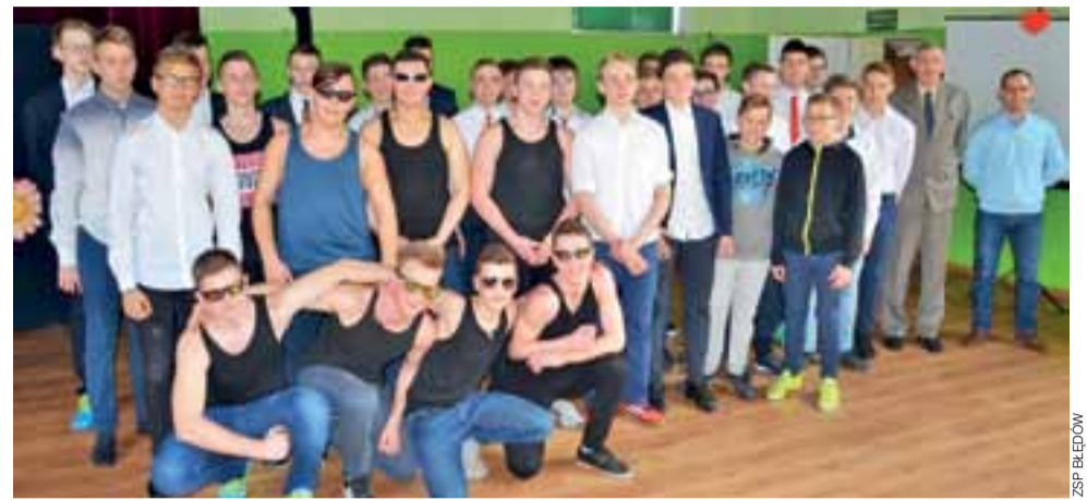
Grupa, która przygotowała szkolny Dzień Kobiet. Dziewczęta były zachwycone niespodzianką.

Bieżących, niezwykle istotnych spraw, wykraczających oczywiście poza lokalne podwórko, jest oczywiście wiele, więc ciąg dalszy uwag i refleksji felietonisty niebawem nastąpi. ■