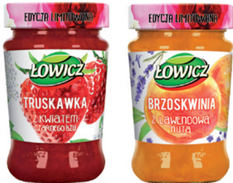
Kulinarne rarytasy – czy staną się rynkowym przebojem?