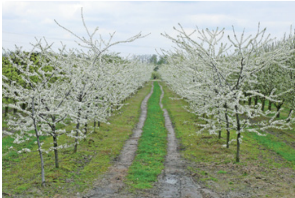
Kwitnący sad w okolicach Kompiny w gminie Nieborów. Wkrótce okaże się, czy kwiaty nie zostały przemrożone.

Według sadownika z Bednar zapowiadane w najbliższych dniach, z wtorku na środę oraz ze środy na czwartek, przymrozki mogą jeszcze spowodować kolejne straty. – Aplikacja pogodowa w moim telefonie dzisiaj wskazuje, że ma być tylko około minus jeden stopień i krótko, więc nie powinno być bardzo źle – uważa. Problem z owocami jabłek mógłby być poważniejszy, jeśli przymrozek utrzymałby się przez kilka godzin, a spadek temperatury sięgnąłby kilku stopni – tak, jak