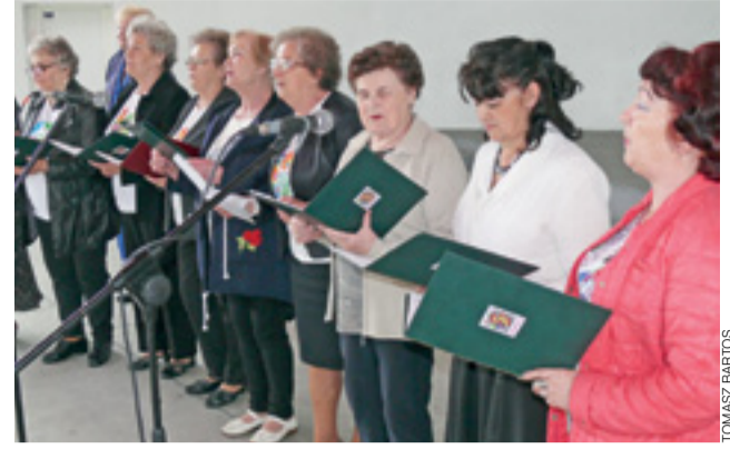
Przed piknikową publicznością na muszli wystawił chór Klubu Seniora Radość.