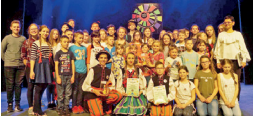
Zespół Pieśni i Tańca „Koderki” triumfował w Sierpcu: młodsza grupa zajęła I miejsce w kategorii dziecięcej, a starsza grupa II miejsce w kategorii młodzieżowo-dorosłej.

Tym bardziej, że spośród 8 zespołów dziecięcych, jury jednomyślnie zdecydowało, że to