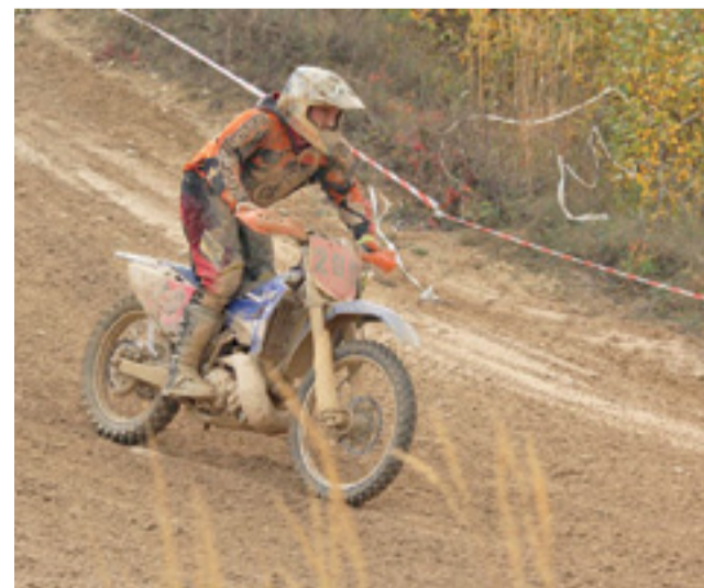
Zawodnicy sekcji motocrossowej Zjednoczonych szykują formę do czerwcowej rundy Mistrzostw Polski, która odbędzie się w Strykowie.

mę przed III Rundą Mistrzostw Polski w motocrossie, która w dniach 10-11 czerwca odbędzie się na torze im. Kazimierza Witczaka przy ul. Warszawskiej w Strykowie. Serdecznie zapraszamy kibiców do śledzenia zmagani strykwianin na własnym terenie.