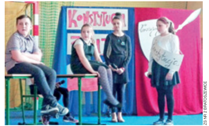
Na żywą lekcję historii uczniowie z klasy V zaprosili Konstytucję Majową.

Zajęciom towarzyszyła galeria prac firmy Kalander, składająca się m.in. z próbek ozdabianych w różny sposób papierów ręcznie czerpanych, zaproszeń urodzinowych czy zakładek do książek. opr. ljs