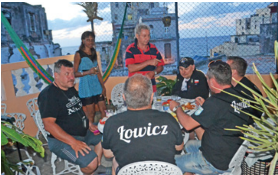
Tak wyglądała kolacja, którą członkowie łowickiej ekipy zjedli wspólnie z Kubańczykami w Hawanie.