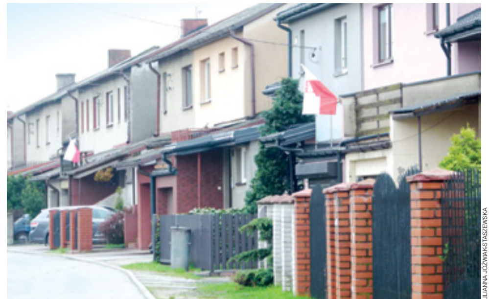
W Strykowie na liście dekomunizacyjnej znalazła się tylko jedna pozycja - ulica Janka Krasickiego (młodzieżowego działacza komunistycznego).

Tym razem radni zdecydowali się pójść przedsiębiorcy na rękę i wyrazili na sesji 26 kwietnia zgodę na obciążenie miejskich nieruchomości wnioskowaną służebnością gruntową. Jak powiedział nam w rozmowie przedsiębiorca, jest on zadowolony z takiego przebiegu głosowania. ■