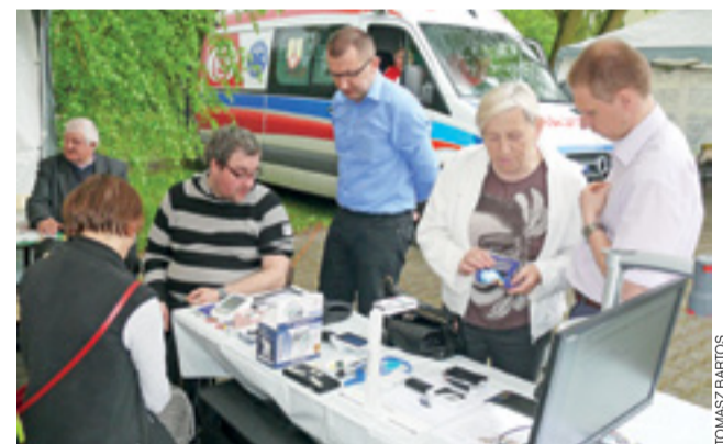
Na pikniku można było m.in. zmierzyć sobie ciśnienie, czy poziom cukru we krwi.

Zanim zabawa na scenie się zakończyła, po sąsiedzku rozpoczęła się II Łowicka Majówka Grillowa. Na polu grillowym, gdzie w ubiegłym roku ustawiono na stałe grille oraz stoły i ław-