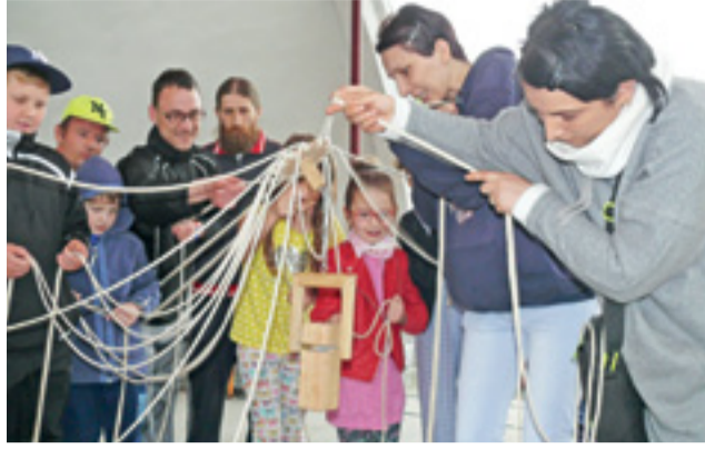
Jedną z konkurencji rozegranych na scenie - układanie wieży z udziałem całej drużyny.