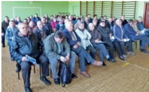
Spotkanie ws. gazyfikacji cieszyło się sporym zainteresowaniem.

W Głownie, póki co, gazu jeszcze nie ma, więc dla uczestników spotkania istotne były koszty przyłączenia się do planowanej sieci. W tym celu istotne były koszty przyłączenia się do planowanej sieci.