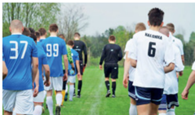
Przedostatnia Kalonka niespodziewanie lepsza od Błękitnych.

■ Następna, 22. kolejka odbędzie się w dniach 13-14 maja: Błękitni Dmosin – Boruta II Zgierz, ŁKS II Łódź – Kotan Ozorków, Huragan Swędów – LKS Kalonka, LKS Dąbrowka – KKS Kuluszki, Kolejarz Łódź – Zjednoczeni II Stryków, Victoria Rąbień – Sport Perfect Łódź, Orzeł II Parzęczew – LZS Justynów.