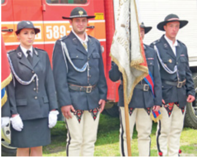
W uroczystości wzięli udział przedstawiciele zaprzyjaźnionego OSP Murzasichle.

Ochotnicza Straż Pożarna ma bardzo ważne znaczenie dla gminy. 10 jednostek, które mamy, pełnią ważną rolę dla naszego społeczeństwa: ochrony mienia, życia, jak również wielu zdarzeń, które mają miejsce na terenie tak skomunikowanej gminy (...). Ta jednostka ma 125 lat. Piękne tradycje. Cieszymy się z tego, że są dobrze wyposażeni. Mają samochody, mają sprzęt, są wyszkoleni (...). Cieszy mnie również to, że ta sfera kultury też gromadzi się tutaj przy jednostce. Nie tylko tej, ale w ogóle na terenie gminy. Czy to Dzień Dziecka, Mamy, Babci, Dziadka – wszystkie te imprezy są organizowane w jednostkach.