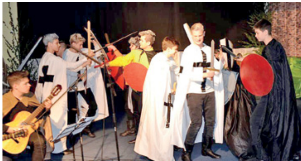
W scenie finałowej Litwini walczą z Krzyżakami i pokonują ich.

Akcja przedstawienia rozgrywała się i na zamku krzyżackim (na scenie sali gimnastycznej), i w pustelni (wież symbolizująca to miejsce specjalnie do tego celu zbudowano na podłodze tej sali), gdzie samotne życie wiodła Aldona. Bohaterami byli Krzyżacy i Litwini, między którymi w scenie finałowej doszło do potyczki. Doszło do przegranej zakonu, którą celowo zaplanował Kon-