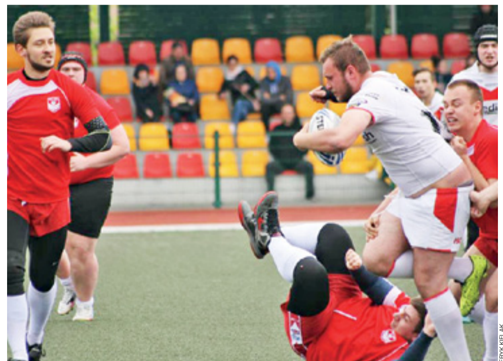
Mecz rugby Biali vs Czerwoni dostarczył kibicom mnóstwo emocji. Autorami wielu spektakularnych wrażeń byli m.in. strykowscy rugbiści z drużyny Byków.