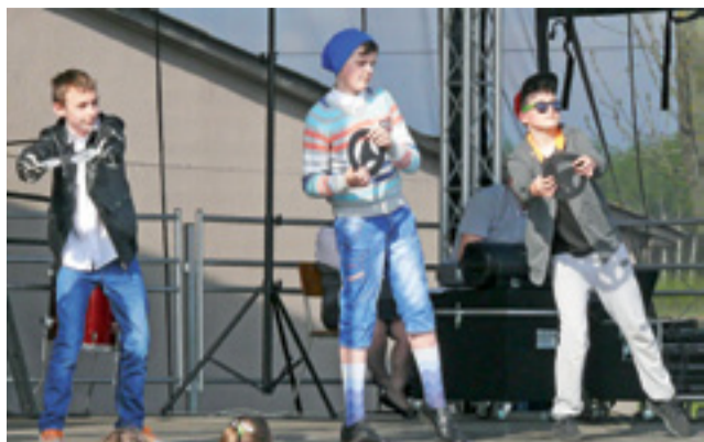
Na scenie oprócz piosenek o bezpieczeństwie uczniowie szkoły w Mysłakowie zaprezentowali scenkę o brawurowo jeżdżących kierowcach.