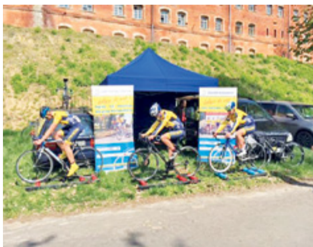
Kolarze LUKS Dwójki Danielo Sportswear Stryków rozgrzewają się pod Twierdzą Modlin przed startem III etapu Małego Wyścigu Pokoju.