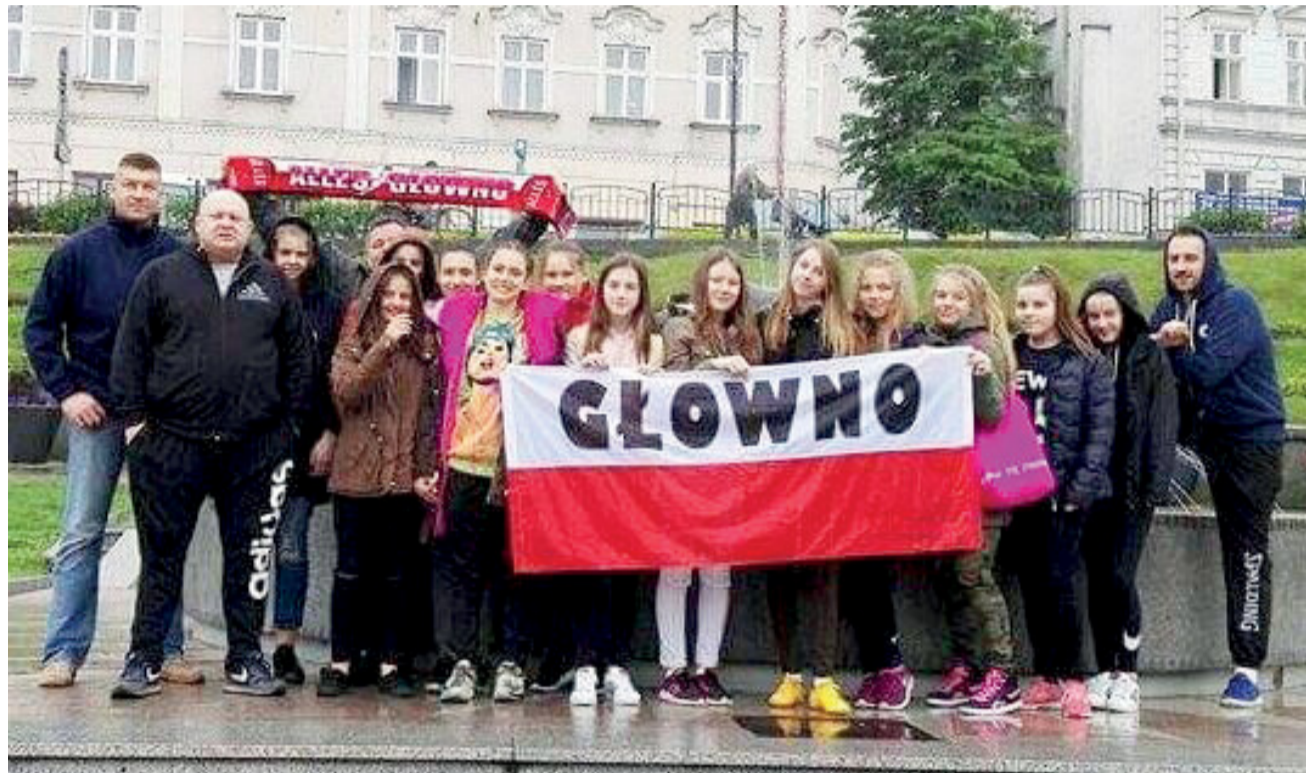
Zespół Alles Basket Głowno mimo odpadnięcia z MP nie ma się czego wstydić. Głownianki godnie reprezentowały swoje miasto i region łódzki.

Młodziczki Alles Basket zajęły 2. miejsce w Wojewódzkiej Lidze Koszykówki U-14, dzięki czemu uzyskały prawo reprezentowania regionu łódzkiego wraz z KKS Pro-Basket Kutno w Mistrzostwach Polski. Komisja Przynawiania Organizacji Turniejów Szczegła Centralnego Polskiego Związku Koszykówki na specjalnym posiedzeniu wybrała organizatorów Turniejów Ćwierćfinałowych MP, a następnie rozlosowała grupy. Koszykarki z Głowna trafiły do grupy IV, która rywalizowała w Przemyślu, a Alles Basket miał zmierzyć się z gospodyniami z Basket Go Przemyśl oraz Pogoni Rudą Śląską i MUKS Poznań. Pojedyńki grupowe odbyły się w dniach 5-7 maja.