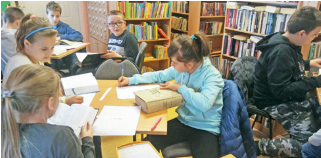
Piątoklasiści rozwiązywali praktyczne zadania z zakresu posługiwania się encyklopediami i słownikami.