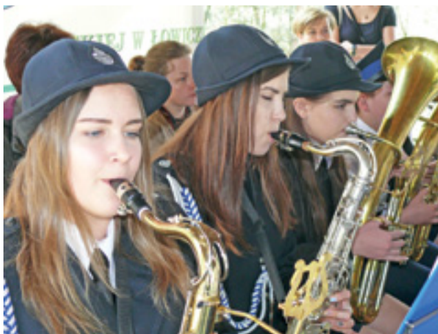
Na zakończenie uroczystości orkiestra z Wicia dała krótki koncert.