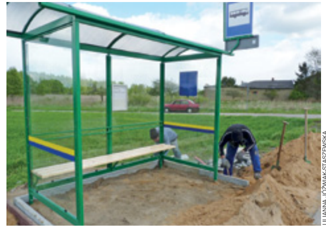
Michałówek. JRP montuje konstrukcje z lakierowanymi stalowymi profilami, pokryciem z poliwęglanu i ściankami z hartowanego szkła.

Oferty złożyły także firmy: ATSys.pl z Katowic i MW Kancelaria z Mikołowa. Obie odrzucono jednak ze względu na to, że oba te podmioty nie spełniały kryterium doświadczenia wymaganego przez magistrat. kl