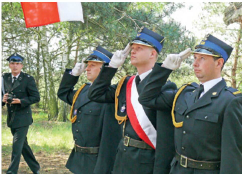
Strażacy jako maszty dla flagi narodowej wykorzystali swój podnośnik hydrauliczny, na zdjęciu chwila jej podniesienia.