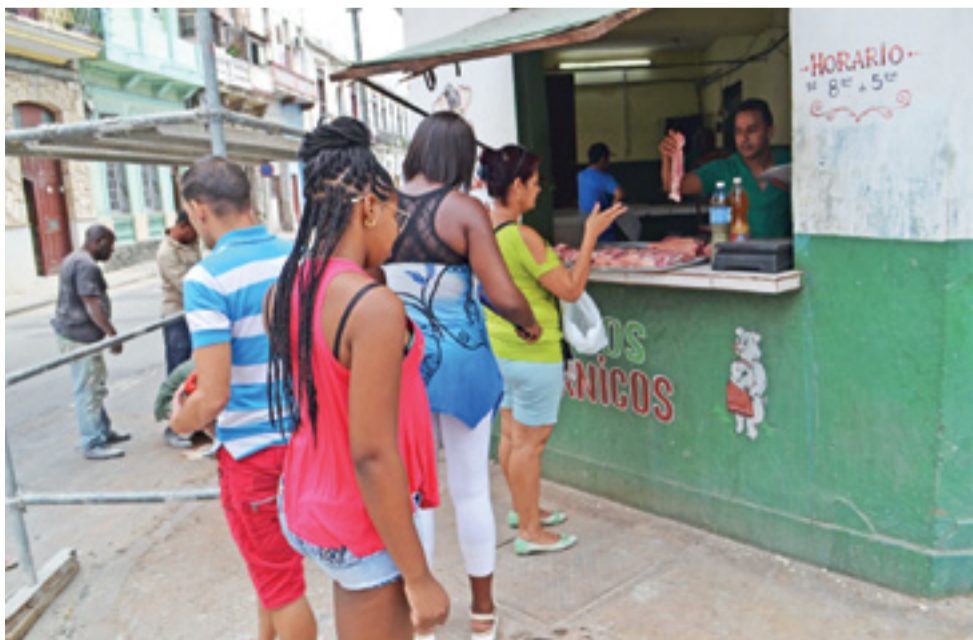
To nie jest kolejka po lody, w sklepie tym sprzedawane jest mięso.