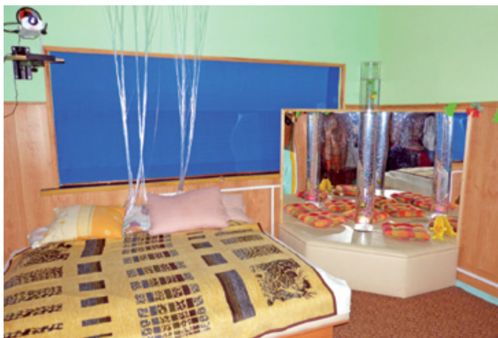
Obecnie wszystkie pomieszczenia, z których korzysta Stowarzyszenie Wolontariatu „Nadzieja”, przystosowane są do prowadzonej tutaj rehabilitacji.