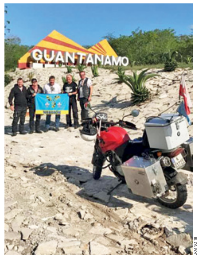
Choć z wjazdu do Guantanamo nic nie wyszło, członkowie łowickiej grupy przywieźli pamiątkowe zdjęcie.