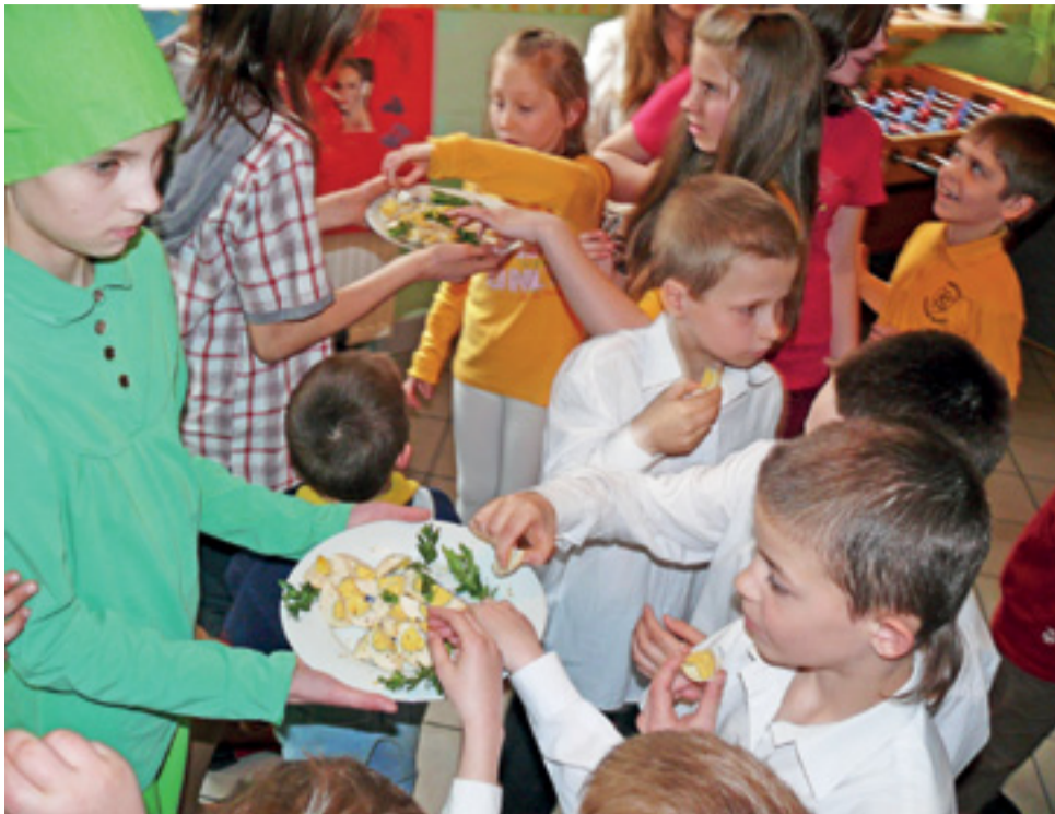
Dzieci ze świetlicy Słonko dzielą się poświęconymi jajkami na spotkaniu przed świętami Wielkanocnymi w 2014 roku.

Jedyną świetlicą, która nieprzerwanie działa w Łowiczu od 2000 roku, jest „Słonko” – prowadzona w parafii Świętego Ducha przez Stowarzyszenie Rodzin Katolickich Diecezji Łowickiej. W obecnej chwili placówka obejmuje opieką 29 dzieci w wieku od 4 lat do 17. Dzieci w wieku przedszkolnym trafiają do niej zwykle wraz ze starszym rodzeństwem.