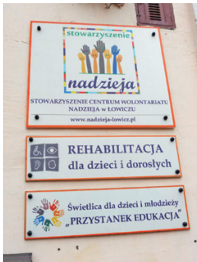
Świetlica dla dzieci i młodzieży została jedynie na tabliczce budynku przy ul. Podrzecznej.

Zainteresowanych prosimy o złożenie aplikacji na adres email: rekrutacja@ekoinstal.net