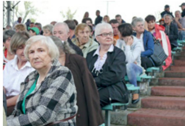
Dało się zauważyć, że widownię Pikniku Europejskiego stanowili w większości seniorzy.

Więcej o organizacjach, które w tym roku wzięły udział w imprezie, można było się dowiedzieć na stoiskach, które ustawiono na placu przy wejściu na teren muszli. Koło Diabetyków oferowało tam m.in. możliwość zbadania poziomu cukru i zmierzenia ciśnienia, Klub Seniora Radość prezentował m.in. swoje książki pamiątkowe, dyplomy, nagrody otrzymane w przeglądach piosenek, Polski Związek Niewidomych na swoim stoisku pokazał sprzęt wspomagający czytanie osób niedowidzących. Polski Związek Emerytów, Rencistów i Inwalidów prezentował swoje kroniki, a Łowickie Stowarzyszenie „Dać Szansę”, Uniwersytet Trzeciego Wieku, Środowiskowy Dom Samopomocy prezentowały rękodzieła swoich członków, wytwory