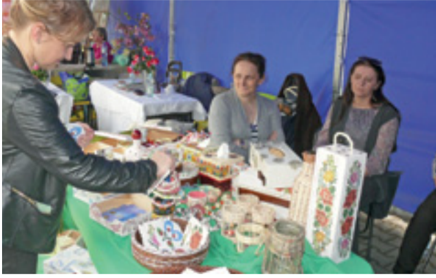
Swoje stoisko mieli także przedstawiciele ŚDS z Łowicza, którzy prezentowali rękodzieła swych podopiecznych