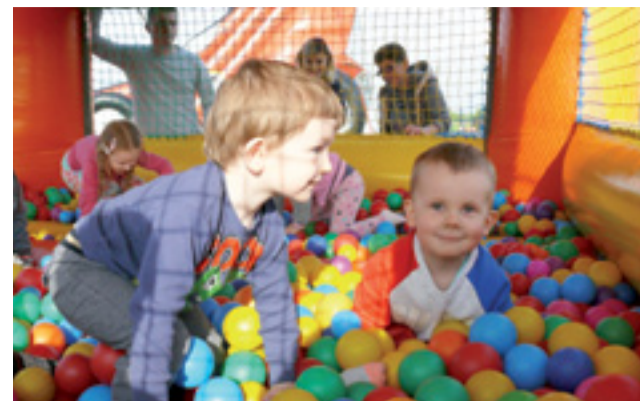
Dla najmłodszych w Mysłakowie czekał dmuchany basen wypełniony kulkami.

Mysłaków | Piknik „Z bezpieczeństwem w tle”