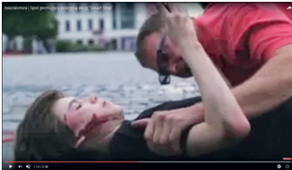
Ujęcie z klipu Smart Stop, który można obejrzeć m.in. na kanale www.youtube.com

We wspomnianej ustawie mowa jest o tym, że zarywanie lub zwałowanie w inny sposób pasa drogowego lub przydrożnego, jak również uszkadzanie skarp rowów lub nasypów jest zagrożone karą grzywny do 1000 zł lub karą nagany. Wójt, którego apel zamieszczony został m.in. na stronie internetowej Urzędu Gminy, ma nadzieję, że spotka się ze zrozumieniem. Liczy na społeczną odpowiedzialność rolników. ewr