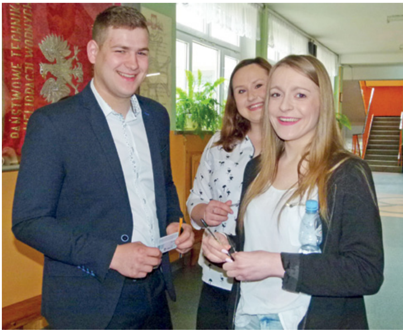
Nastroje przed maturą z matematyki w Bratoszewicach, jak widać na zdjęciu, wcale nie były najgorsze.

roku przyjeżdża ich średnio 100), jak również firm z branży rolnej i ogrodniczej oraz drobnych sprzedawców i gastronomię, które co roku stanowią lubiane przez odwiedzających uzupełnienie targów. Szczegółowy harmonogram tego, co i o której godzinie będzie się działo na terenach wystawienniczych ŁÓDR, zaprezentujemy w tygodniu poprzedzającym imprezę. W tym roku zbiega się ona z inną dużą planerówką w regionie, czyli Dniami Strykowskiej. IJS