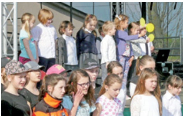
Dzieci ze Szkoły Podstawowej w Mysłakowie zaprezentowały piosenkę o bezpieczeństwie, np. o światłach sygnalizacji świetlnej.