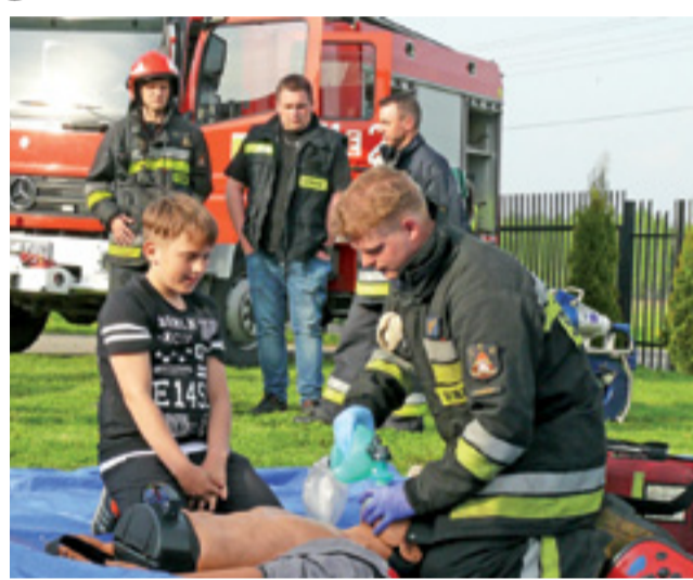
Strażacy z łowickiej jednostki PSP w Łowiczu zademonstrowali m.in. resuscytację osoby nieprzytomnej, do spróbowania swoich sił zaprosili też dzieci z Mysłakowa.

Na scenie wystąpili także uczniowie szkoły, prezentując program związany z bezpieczeństwem,