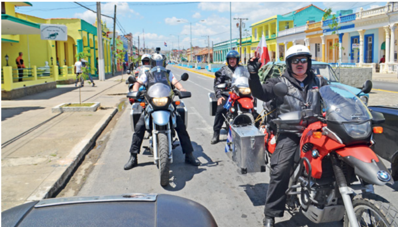
W drodze, w jednym z kubańskich miasteczek. Widok sześciu motocyklistów na potężnych motocyklach robił na Kubańczykach duże wrażenie.

Kubańczycy żyją i mieszkają skromnie, na prowincji w wielu domach nie ma szyb w oknach, są za to okiennice z żaluzjami, którymi reguluje się dopływ powietrza do wnętrza. Tam, gdzie w oknach są szyby, zazwyczaj właściciel zainstalował klimatyzację – ale to w mijanych małych miejscowościach rzadkość. Same domy są kolorowe i często w nie najlepszym stanie.