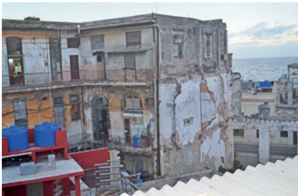
Stara Hawana – jeden z mniej zachwycających widoków miasta, w tle ocean.