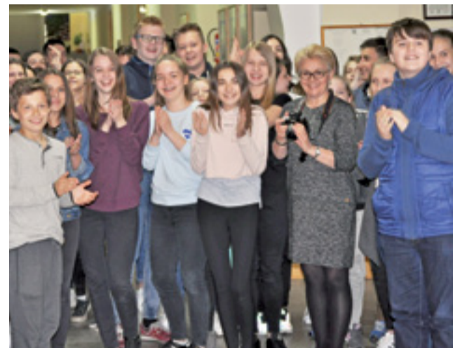
Społeczność Gimnazjum nr 2 w Łowiczu gorąco powitała zagranicznych gości na szkolnym korytarzu.

Powitanie w szkole było głośne i gorące – część z uczniów zna-