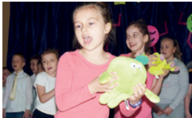
Podczas apelu „Żyj zdrowo!” uczniowie tańczyli do piosenki „Zatańczyły witaminy”.

Jednym z nich było przestrzeganie zasady, aby spożywać 5 posiłków dziennie: śniadanie, drugie