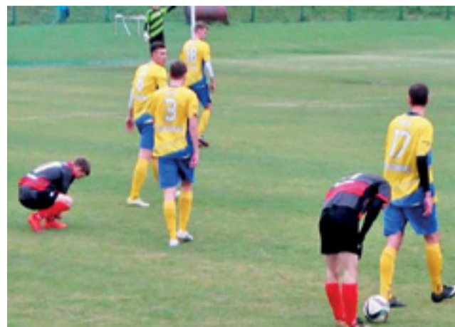
Piłkarze Stali Głowno (żółto-niebieskie stroje) tym razem odpoczywali od ligowych zmagani w Łódzkiej Klasie Okręgowej.