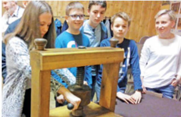
Dzieci mogły drukować swój własny certyfikat młodego czeladnika, potwierdzony lakową pieczęcią i zabezpieczony metodą suchego tłoka.

Warsztaty poprowadziła Czerpalnia Papieru Kalander z Gliwic, która od kilku już lat odwiedza Stryków, a jej zajęcia czy to papirnicze, czy to drukarskie, za każdym razem są jednakowo wciągające. Tym razem sposoby drukowania z czasów Gutenberga poznawali uczniowie klas IV-VI Szkoły Podstawowej w Niesułkowie oraz uczniowie klas V-VI strykowski szkół. Osoby pro-