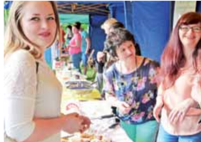
Na stoiskach lokalnych gospodyń oraz rodziców, jak zwykle wesoło, no i smacznie. Ciasta i bigos w ich wykonaniu, zawsze smakują.

Od wczesnego popołudnia w cieniu pałacu i parku wiele się działo. Połączone siły szkół, SPB, KGW, OSP i Rady Sołectkiej, wsparte przez OKiR Stryków, sprawiły, że święto Bratoszewic przybrało, jak zwykle ciekawą formę. O to, by było ciekawie zadbał również uczniowie klas mundurowych bratoszewickiego LO. Kadeci wrócili właśnie z pięciodniowego wyjazdu na poligon Wyższej Szkoły Wojsk Lądowych we Wrocławiu. Zaprawieni w wojskowym rygorze zaprezentowali uczestnikom święta pokaz musztry i żołnierskiej dyscypliny.