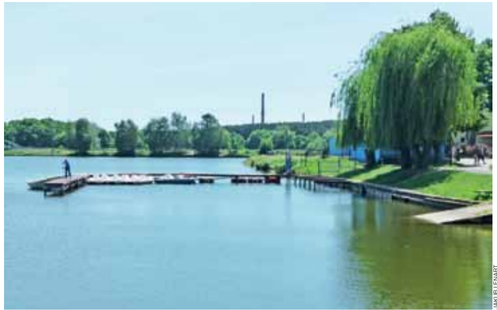
Zaopatrzenie wypożyczalni nad Mrożyczką w nowe rowery na razie nastęrcza problemów.

Przetarg na tegoroczny etap został rozstrzygnięty już w marcu. Wygrał go lokalny Zakład Usług Budowlanych Budmel z Tymianki, który spośród 6 ofertów zaproponował najniższą cenę wykonania zadania. Gmina zapłaci za nie 523.315 zł. Termin wykonania inwestycji mija z końcem lipca. ljs