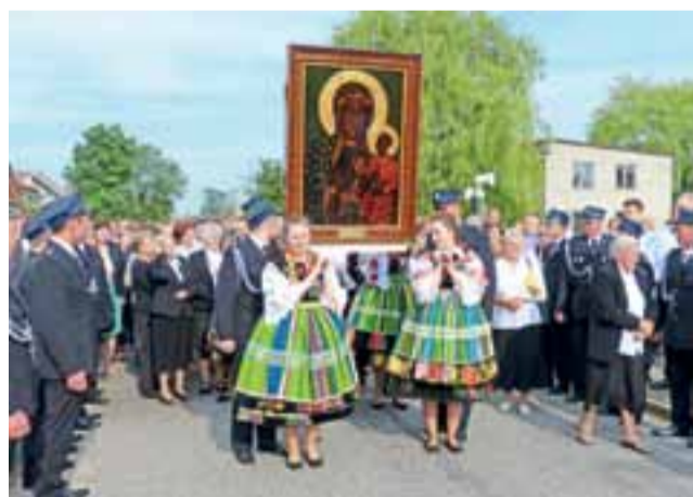
Parafianie w Złakowie mieli szczęście witać obraz przy pięknej pogodzie.