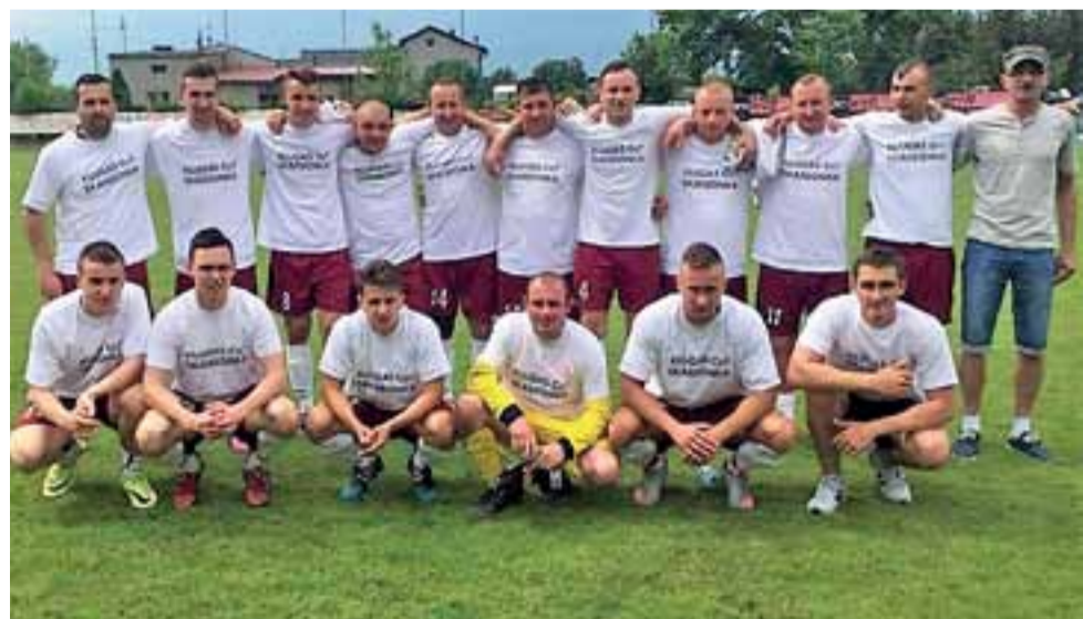
Druga drużyna Zjednoczonych godnie pożegnana trójką zasłużonych dla Strykowa piłkarzy.

W innych meczach A-klasy, gr. II zwraca uwagę wysokie zwycięstwo Błękitnych Dmosin, którzy rozgromili na wyjeździe LKS Dąbrówka 7:0. Ciekawie było także w Swędowie, gdzie miejscowy Huragan po emocjonującym spotkaniu przegrał z łódzkim Kolejarem 2:3. Do zakończenia sezonu pozostała już tylko jedna kolejka, która rozegrana zostanie w najbliższą sobotę, 10 czerwca. Mistrzostwo zapewnił sobie LKS II Łódź. wp