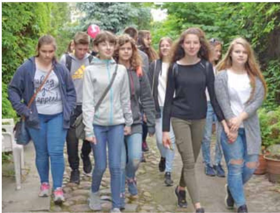
Dziewczęta z klasy II A opuszczają podwórkę Wegnerów. Jak nam powiedziały, miejsce to zrobiło na nich duże wrażenie.

Prawdziwą gratką dla młodych ludzi, szczególnie zainte-