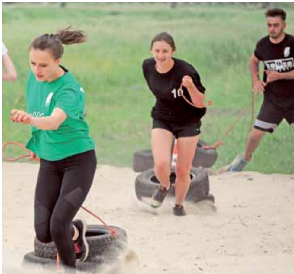
„Spacer z piaskiem” – należało przeciągnąć po piasku na łowickiej plaży oponę. Im szybciej, tym lepiej.