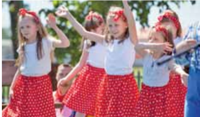
Dzieci ze wszystkich grup występowały dla swoich rodziców.

Po wspólnej modlitwie odbyła się część artystyczna pod hasłem „Rodzice – dzieciom, dzieci – rodzicom”. Na początku rodzice ucieszyli się z zerówki, które w tym roku pożegnają się z przedszkolem, wystawili przedstawienie zatytułowane „Jak