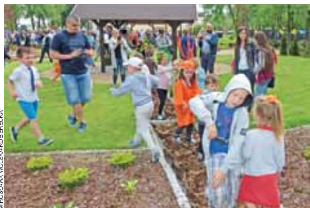
W nowo otwartym ogródku największym powodzeniem cieszyła się ścieżka wyłożona szyszkami.