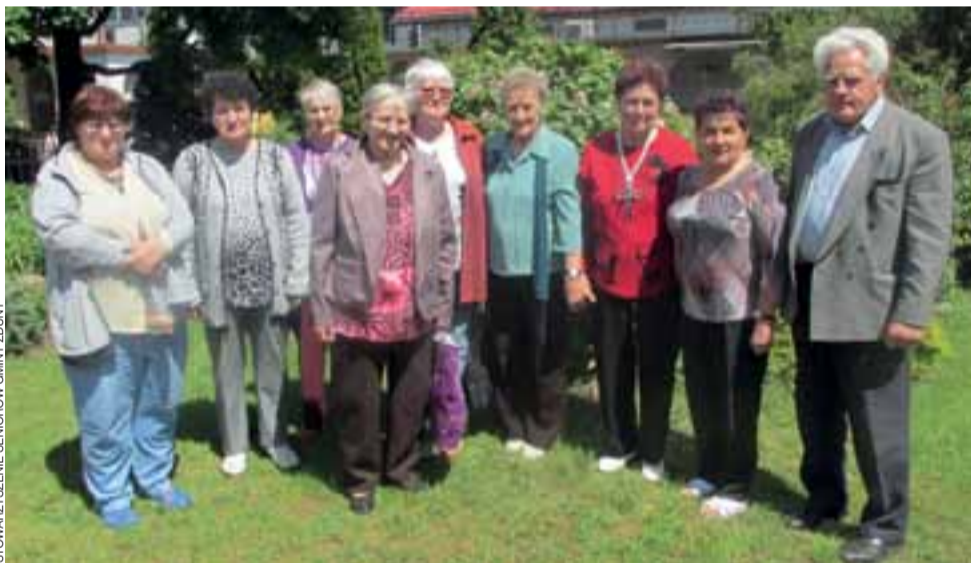
Seniorzy z gminy Zduny w gospodarstwie agroturystycznym w Holendrach.