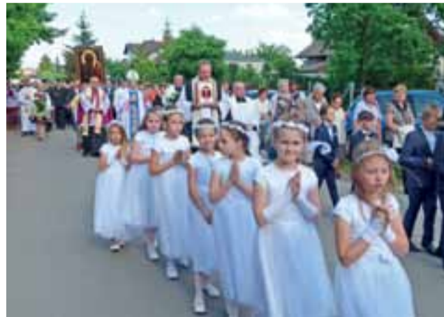
Przed obrazem Matki Bożej Częstochowskiej szły w parafii na Zabrzeźni także dzieci pierwszokomunijne.