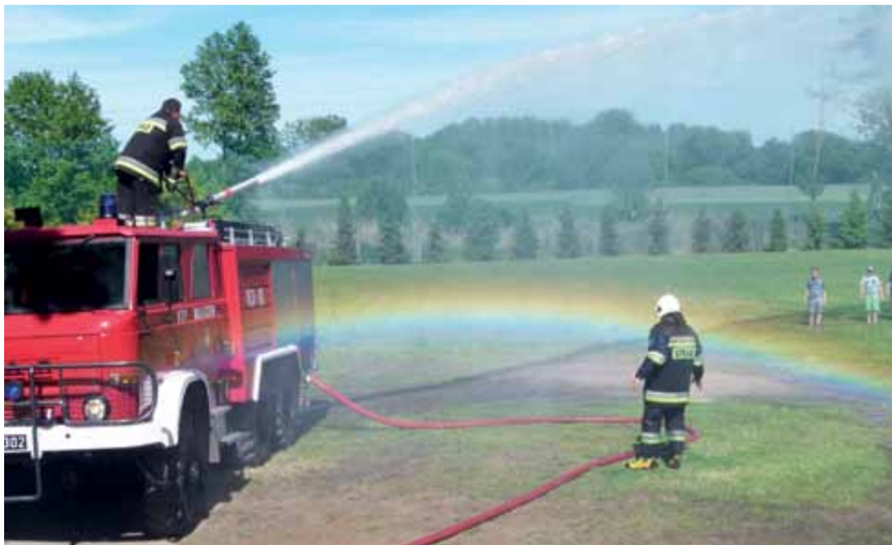
Działko wodne OSP Waliszew przysporzyło dzieciom tym razem frajdy w postaci tęczy i to nie na niebie, a na szkolnym boisku.