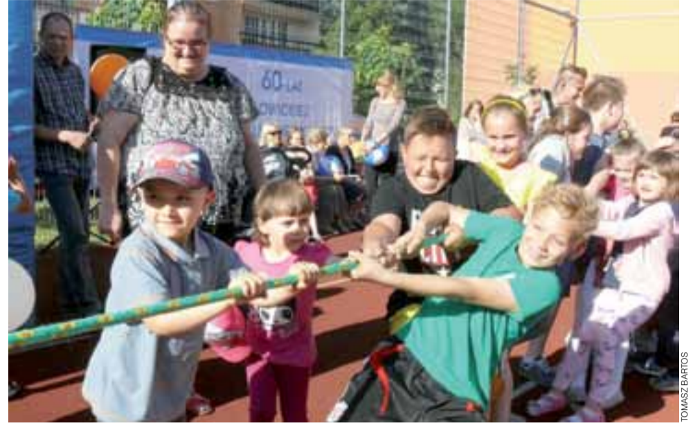
Przeciąganie liny – jedna z konkurencji zorganizowanych przez Pogotowie Artystyczne.

– Dzięki pomocy spółdzielni w naszej kasie zostanie więcej pieniędzy, dlatego sądzę, że może w sierpniu uda nam się zorganizować jeszcze jedną, podobną imprezę ale pod hasłem pożegnania lata.