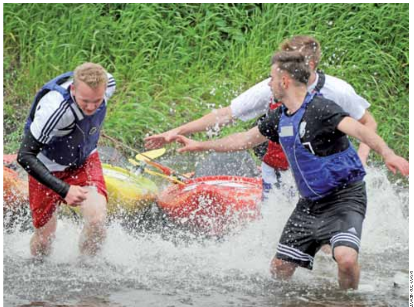
Prawie jak Słoneczny Patrol – żartowali bez złośliwości obserwatorzy armageddonowych zmagających. Męska część ekipy ZSP 4 w Łowiczu.