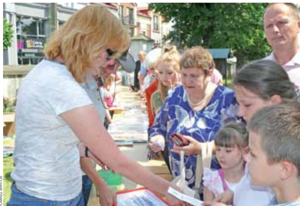
Ogromnym powodzeniem wśród wiernych cieszyła się loteria fantowa, organizatorzy przygotowali ponad 700 losów, za każdym z nich kryła się nagroda.