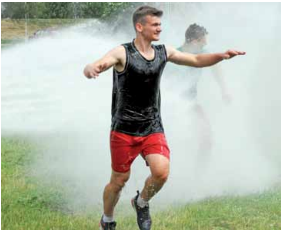
Zimny prysznic na koniec trwającego ok. 20 minut biegu był wręcz orzeźwiający.