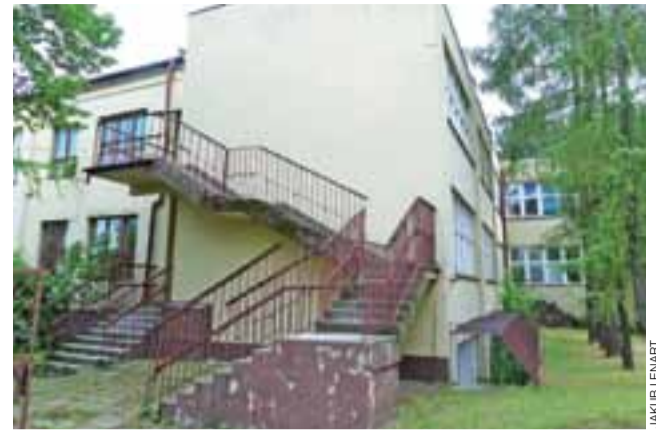
Docelowo szkoła miałaby się mieścić w budynku dawnego przedszkola, ale do tego droga jest jeszcze dość długa.

Władze KLO nie zgadzają się też z opiniami, że powstanie nowej szkoły będzie niekorzystne dla miejskich finansów. Ilość uczniów byłaby niewielka, a do miasta, podobnie jak w przypadku liceum, i tak część pieniędzy wracałaby przecież w postaci opłat za wynajem pomieszczeń.