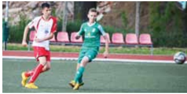
MUKS Pelikan 2002 pokazał, że potrafi grać w piłkę.

Gracze MUKS Pelikan Łowicz z rocznika 2002 mają za sobą kolejne dwa ligowe mecze mistrzowskie. Łowiczanie w środę tygodnia potrafili po raz pierwszy w tej rundzie zaznać smaku zwycięstwa i pokonali w Łowiczu WKS Wieluń 4:2, zaś w weekend Pelikan 2002 nie dał rady liderowi tabeli, przegrywając w Łodzi z ŁKS-em 4:1.