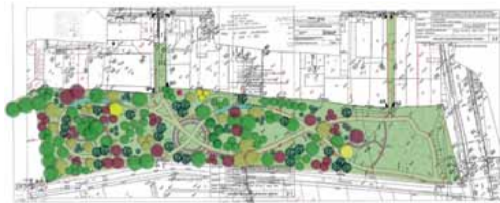
Projekt zagospodarowania terenu nad Moszczenicą autorstwa firmy Traciz.

Dodatkowe pieniądze na zagospodarowanie Mrożyczki pochodzą z wolnych środków budżetowych. Radni na sesji 31 maja jednogłośnie poparli propozycje burmistrza. ki