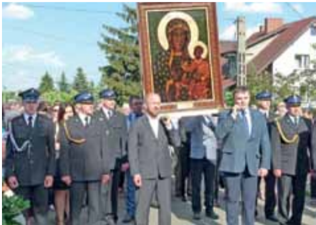
Obraz Nawiedzenia nieśli m.in. członkowie Zabrzeźniańskiego Stowarzyszenia im. św. Jana Bosko.

Wreszcie komenderujący przebiegiem peregrynacji we wszyst-