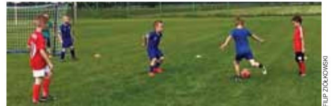
Mecz maluchów zawsze dostarcza wielu emocji.

spokojnie w szatni i jak wybiegli na boisko to grały z takim zapałem i zaangażowaniem, że czasem trudno było w to uwierzyć. Mnóstwo bramek i kupa śmiechu zł