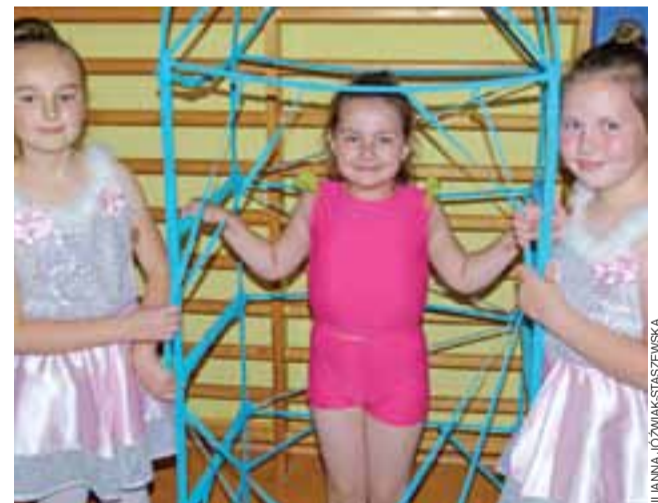
W przerwach między występami małe tancerki chętnie wypróbowały poszczególne elementy scenografii.

Jak zwykle największą nagrodą dla wszystkich występujących i przygotowujących do występów był aplauz widzów, a głowieńskie gale taneczne znane są z tego, że publiczność na nie dopisuje i nagradza jednakowo gromkimi brawami wszystkich występujących. – Muszę powiedzieć, że przychodzę na te konkursy już od kilku lat, a to dlatego, że mam