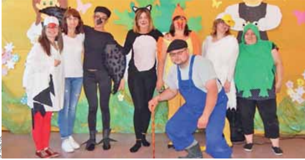
Tak prezentowali się rodzice, którzy odegrali na festynie przedstawienie pt. „Rzepka”.