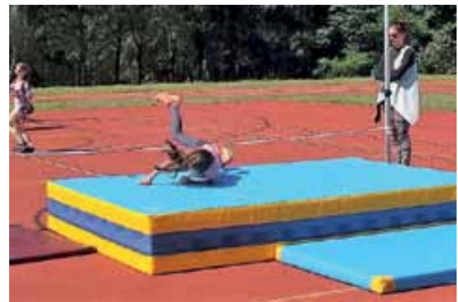
Podczas pikniku przy SP 1 można było spróbować swoich sił w skoku.