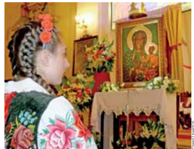
Kopia obrazu Matki Bożej Częstochowskiej w domaniewickim kościele witana była przez dzieci i młodzież ubraną w stroje ludowe.

Terminarz peregrynacji: 16 czerwca – par. Belchów, 17 czerwca – Nieborów, 18 czerwca – Bednary, 19 czerwca – Kompina, 20 czerwca – Kocierzew, 21 czerwca – Boczek, 22 czerwca – par. M.B. Nieustającej Pomocy na Korabce w Łowiczu (misje od 18 do 22 czerwca), 23 czerwca par. katedralna w Łowiczu. Tam misje będą od niedzieli, 18 czerwca do czwartku, 22 czerwca. Zakończenie Nawiedzenia w parafii katedralnej oraz w diecezji łowickiej będzie w sobotę, 24 czerwca. mak