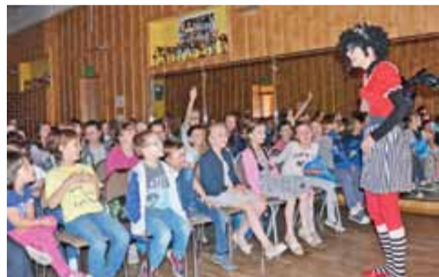
W prezencie dla uczestników konkursu oraz gości biblioteka zaprosiła grupę teatralną Trip z przedstawieniem „Na tropie zaginionej opowieści”.

Specjalną nagrodą dla uczestników konkursu oraz gości, czyli uczniów SP 3 w Głownie było przedstawienie „Na tropie zaginionej opowieści” wykonane przez grupę teatralną Trip z Świętochłowic.