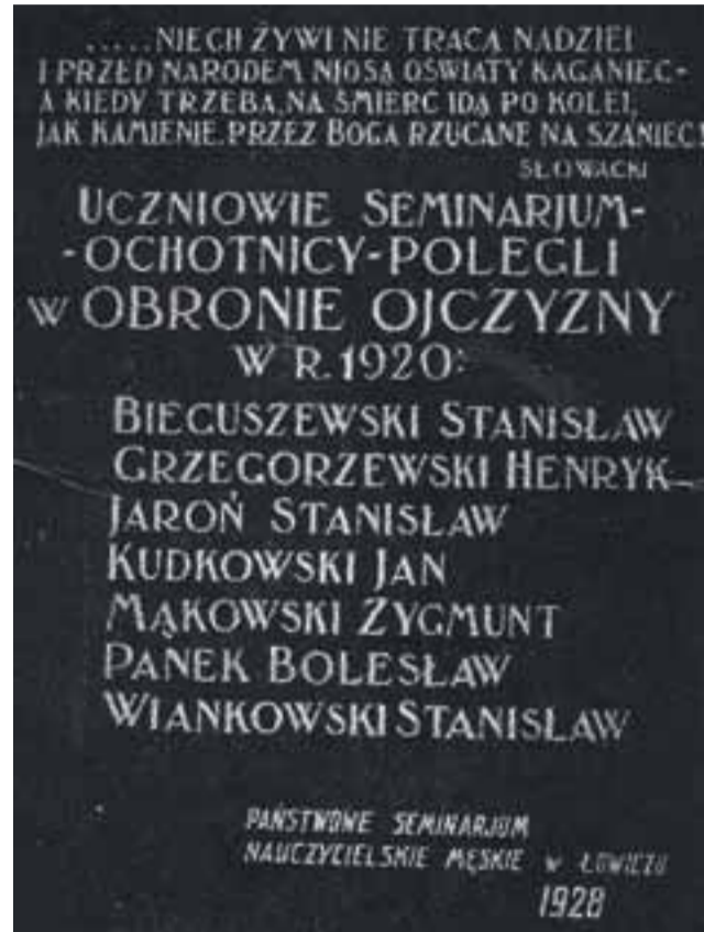
Ta tablica znalazła „schronienie” w kościele ojców pijarów.