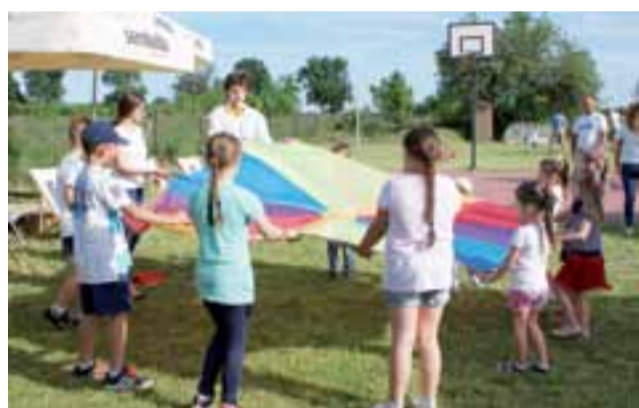
Dzieci bawiły się m.in. kolorową matą animacyjną.