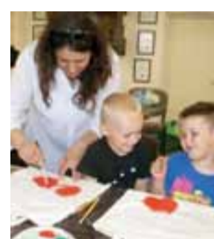
Przygotowywanie ekologicznej torby w kwiatki na Dzień Matki.

– Szczególne podziękowania należą się tatusiom przed-