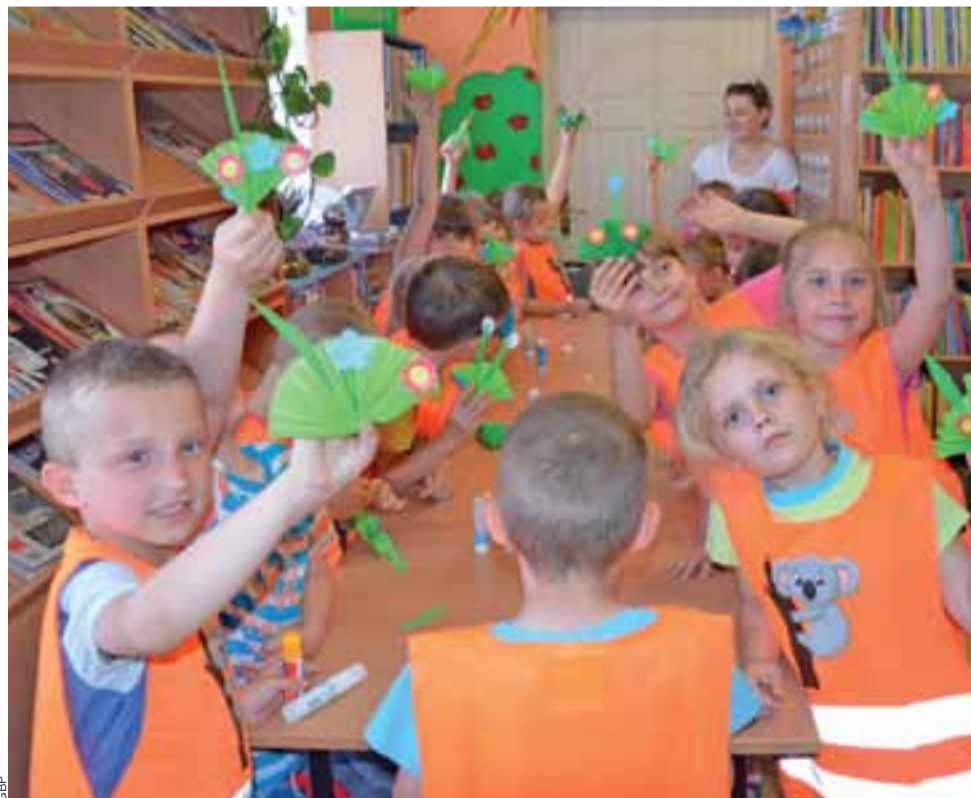
Częścią lekcji bibliotecznej było wykonywanie papierowych bukiecików dla rodziców.