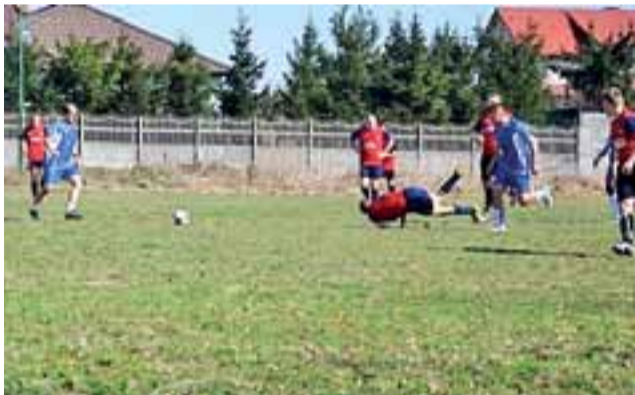
Drużyna Sokola Popów (niebieskie stroje) zakończyła rozgrywki na podium B-klasy, gr. I. Iskra Głowno uplasowała się oczko niżej.