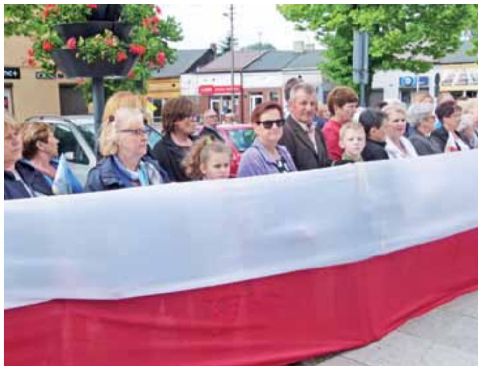
Wielką białą-czerwoną flagą witali 1 czerwca obraz Matki Boskiej Częstochowskiej mieszkańcy parafii św. Jakuba i harcerze. O peregrynacji obrazu czytaj na str. 9.

RZUT OKIEM | WIDAĆ, ŻE TO KRÓLOWA POLSKI