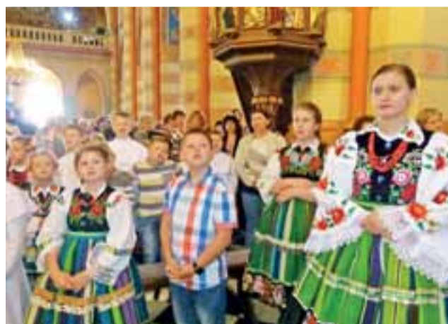
Liturgia w Złakowie Kościelnym rozpoczęła się od śpiewów, w których aktywnie uczestniczyła młodzież, także z miejscowego Koła Misyjnego.