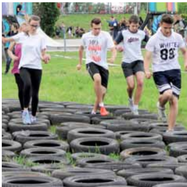
„Koszmar wulkanizatora” – rozsypane opony nie było łatwe do pokonania. Na trasie ekipa z ZSP 1.