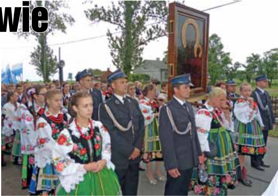
Kopię obrazu Matki Bożej Częstochowskiej niosą parafianki w strojach ludowych, w asyście strażaków.