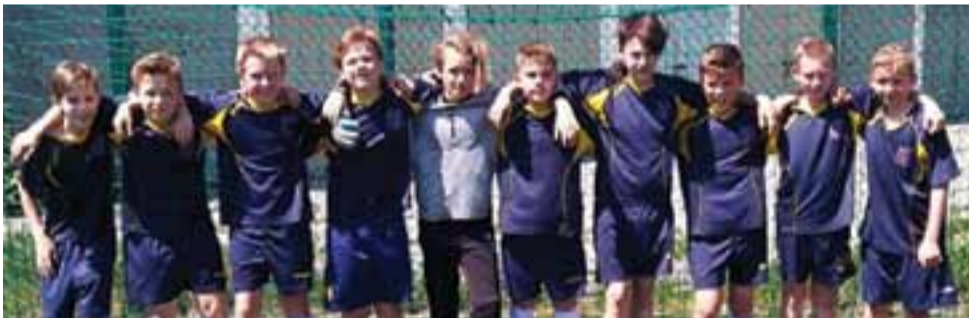
Uczniowie Pijarskiej SPKP sięgnęli po tytuł mistrza powiatu.

– Najważniejszy „mecz sezonu” jakim jest określane to starcie zakończył się remisem 16:16. Rodzice przegrali dwie pierwsze kwarty, trzecia zakończyła się ich jednobramkowym zwycięstwem, natomiast czwarta kwarta to ciągłe ataki i wyjście na prowadzenie dzieci. Remis był sprawliwym wynikiem lecz rozstrzygnięcie przyniosła dopiero seria rzutów karnych, w której lepsi okazali się młodzi zawodnicy Akademii Piłkarskiej – relacjonował szkoleniowiec Akademii. zł