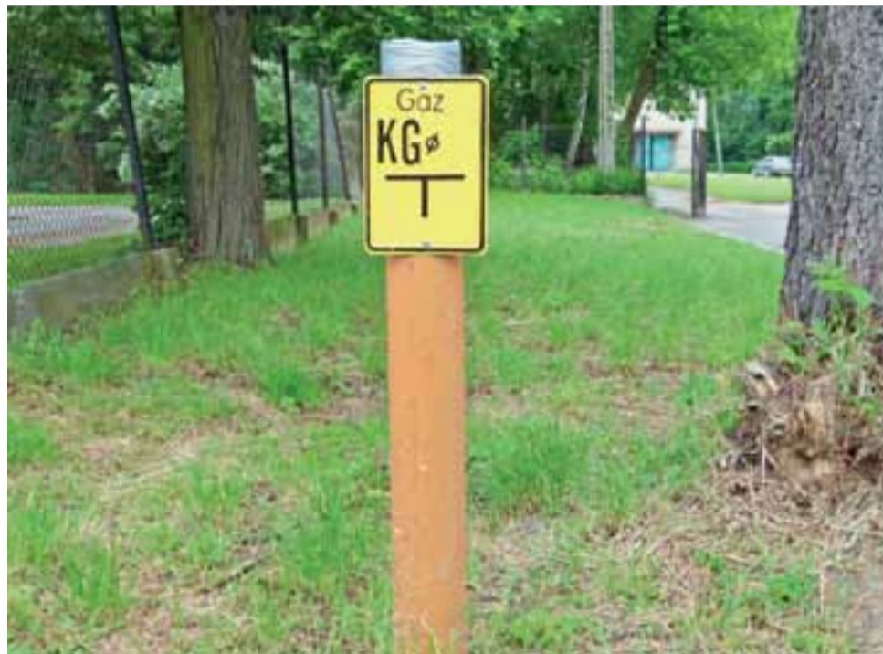
W Strykowie gazyfikacja zakończyła się póki co na ul. Sowińskiego. Spółka zapowiada, że to niebawem powinno się zmienić.