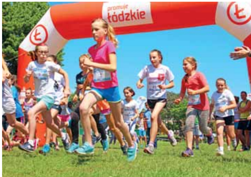
Start jednej z młodzieżowych grup w 2016 roku. W Głownie chętnie biegali wszyscy: i chłopcy i dziewczęta.

Do pokonania będzie dystans ok. 750 metrów. Start dziewczyn-