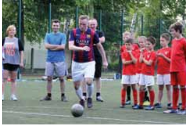
O zwycięstwie w „meczach sezonu” decydowały rzuty karne.