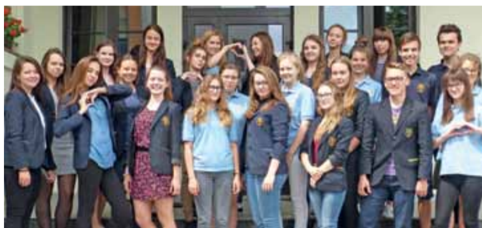
Grupa uczniów Pijarskich Szkół Królowej Pokoju, która wkrótce pojedzie zwiedzać Wiedeń.

Nietypowy był bowiem sposób wyboru uczestników wycieczki. W całości funduje ją szkoła, ma być ona nagrodą za wzorową postawę, życzliwość i gotowość do pomocy innym. Wytypowali ich koleżdy i koleżanki w anonimowym głosowaniu, a właściwie to w ankiecie z jednym pytaniem. Zarówno uczniowie, jak i nawet ich wychowawcy, do końca nie wiedzieli, że jest to konkurs, ani że