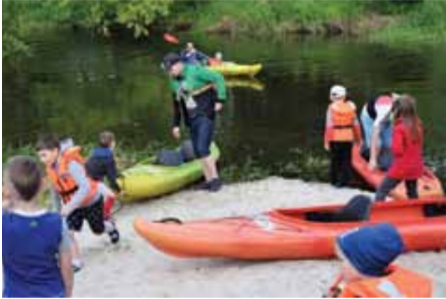
Największym zainteresowaniem cieszyły się kajaki