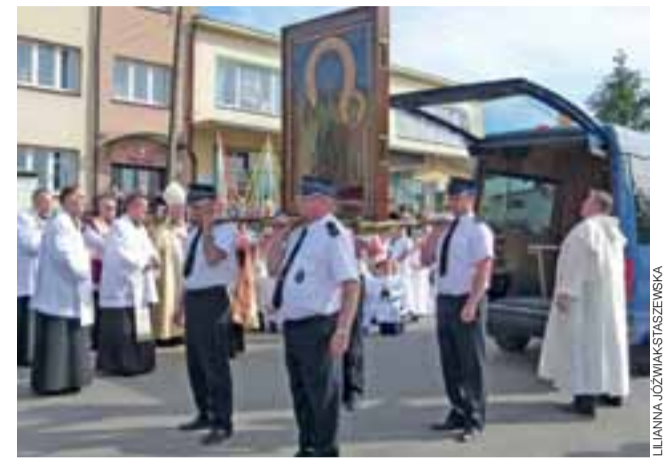
Po przyjeździe samochodu-kaplicy na pl. św. Małgorzaty w Dmosinie. Strażacy ukazują obraz M.B. Częstochowskiej wiernym zgromadzonym na pl. św. Małgorzaty w Dmosinie.

i Męczennicy w Dmosinie. Osinianie witali M.B. Częstochowską na skrzyżowaniu ul. Sikorskiego i Andersa. W uroczystości przekazania Maki Bożej w Jasnogórskim Wizerunku z parafii św. Jakuba Apostoła uczestniczył biskup po-