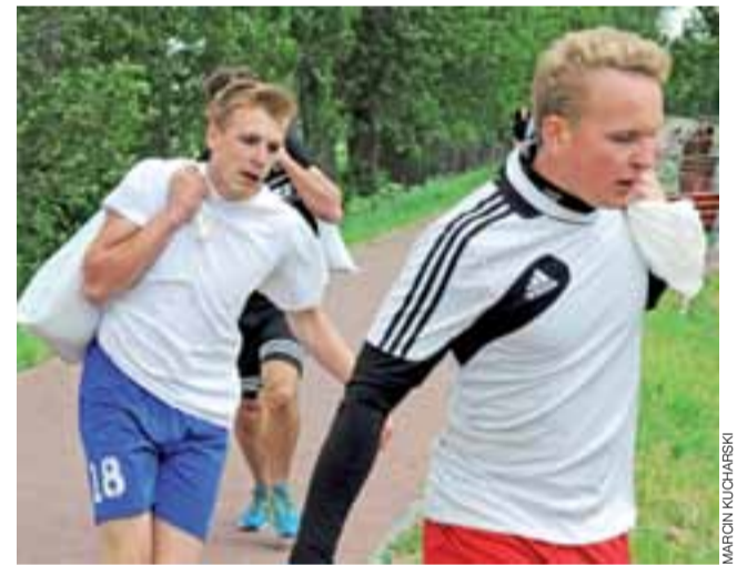
Konkurencja „zakupy w dyskoncie” polegała na przeniesieniu kilkunastokilogramowych worków z piaskiem.

*** Zapraszamy do obejrzenia galerii zdjęć na naszym portalu: www.lowiczainfo.info .