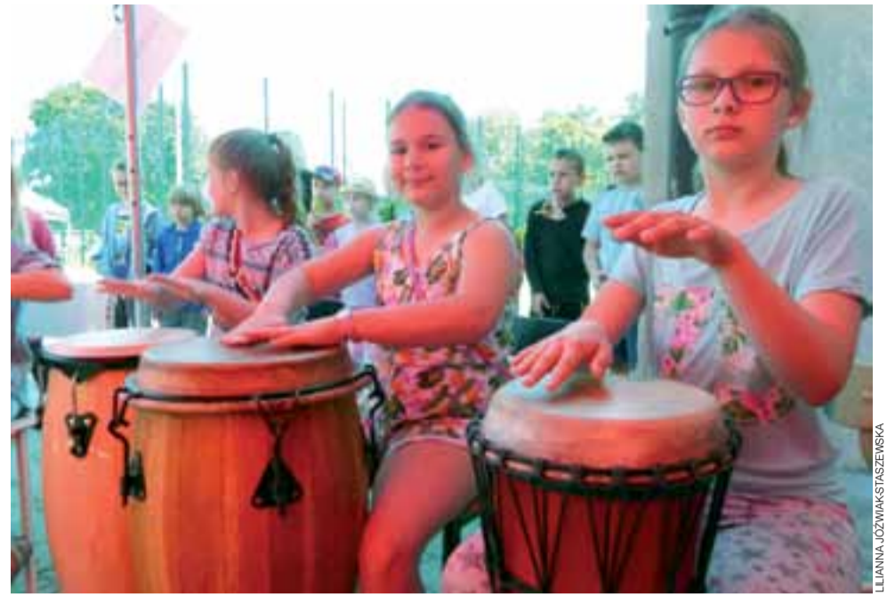
Największego tonu piknikowi nadawały warsztaty gry na bębnach prowadzone przez szkołę Klick&Drum.