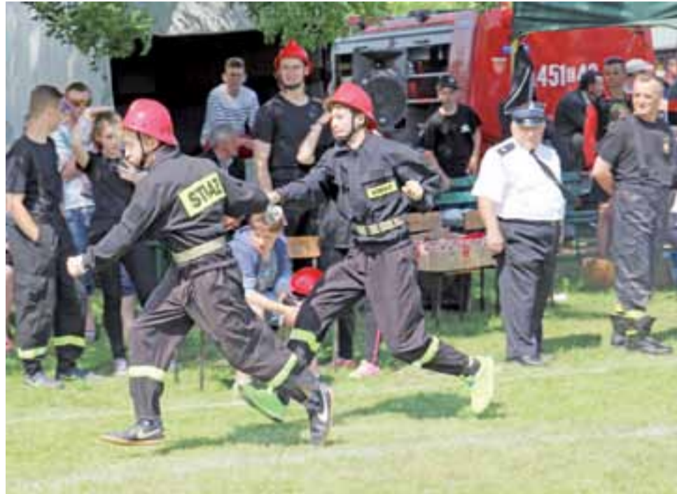
Startują druhowie z OSP w Kiernozi. W tym roku zajęli V miejsce.