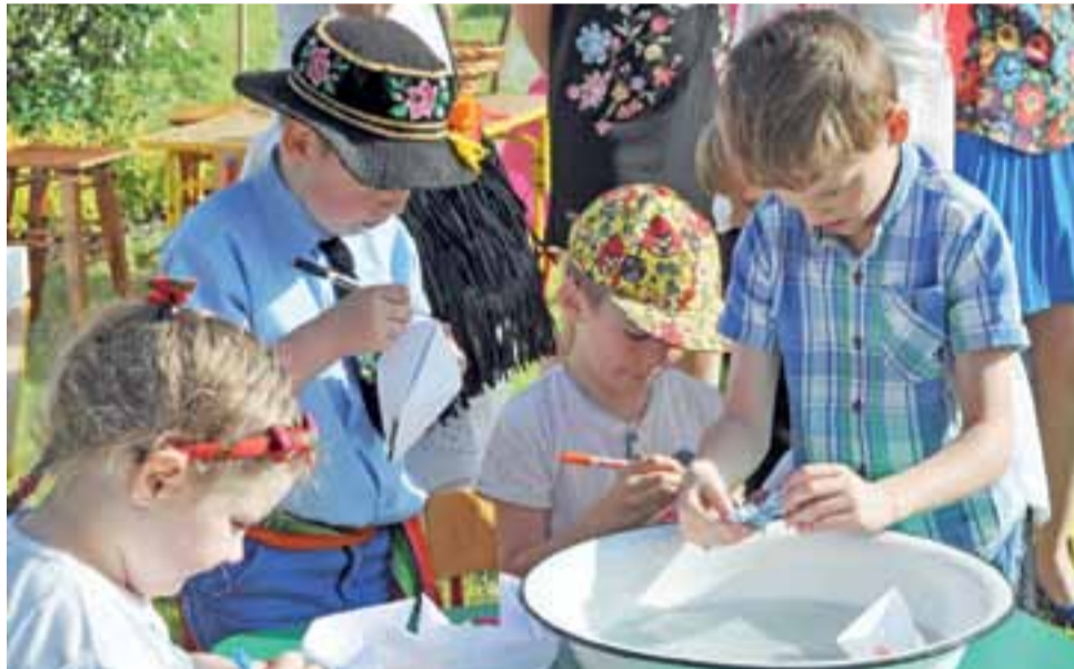
Czasami wystarczy miska z wodą i kartki papieru, żeby zorganizować dobrą zabawę. Było to jedno z wielu stoisk i zabaw proponowanych dzieciom na pikniku „Pod Świerkami”.

Placówką integracyjną przedszkole stało się od września 1998