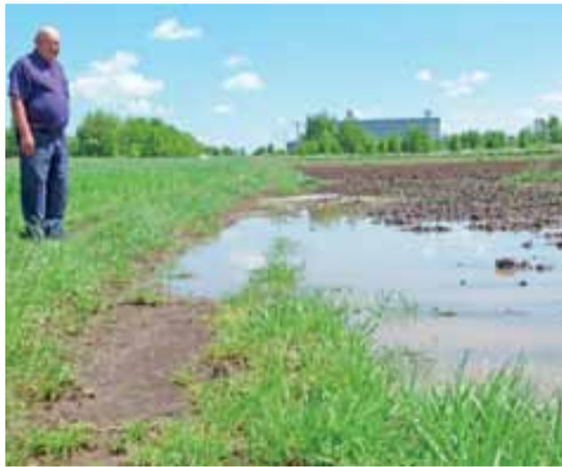
Pismo z Segro to dalszy ciąg sprawy, którą ilustrowaliśmy tym zdjęciem.

Firma odniosła się również do kwestii pozostawienia roślinności zarastającej dno zbiornika wyjaśniając, że nie ma możliwości jej usunięcia czy skoszenia, gdyż pełni ważną rolę, a mianowicie