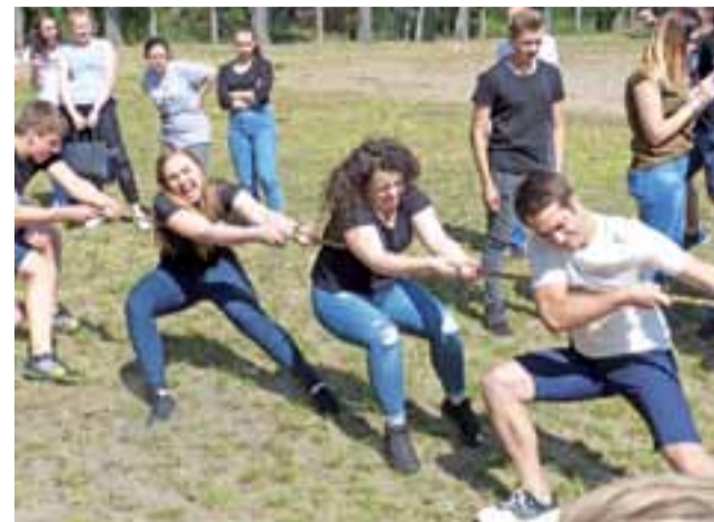
Przeciąganie liny było jedną z ostatnich, rozstrzygających konkurencji, nic więc dziwnego, że budziło duże emocje.

Na ogólną klasyfikację turnieju składały się konkurencje, na ogół te same bądź podobne jak podczas Dnia Sportu rok temu: dart, przeciąganie liny, strzał z pistoletu na wodę, piłka plażowa, „grzybobranie”, bieg tyłem, wyścigi mini rowerkiem, „łowienie rybek” czy wreszcie konkurencja bonusowa, w której trzeba było pozbać przeciwników przywiązanych do ich nogi balonów, jednocześnie broniąc własnego – ostatnia konkurencja była do samego końca