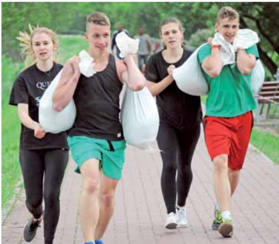
Techniki noszenia worków – „zakupów w dyskoncie” – były różne. Można też było sobie pomagać.