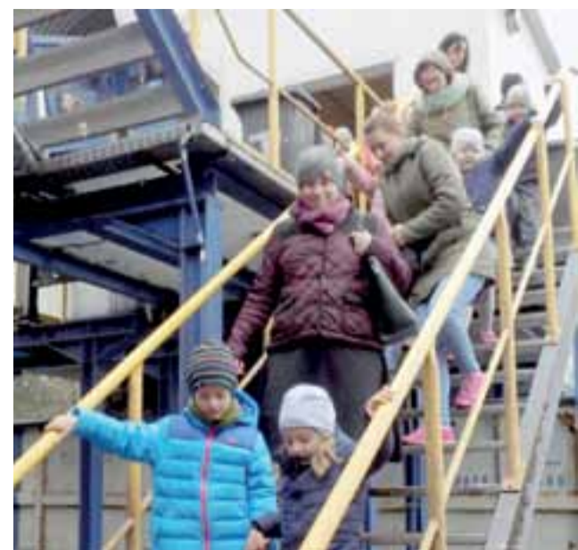
Uczestnicy wycieczki z Przedszkola nr 10 w Zakładzie Zagospodarowania Odpadów w Krzyżanówku koło Kutna.