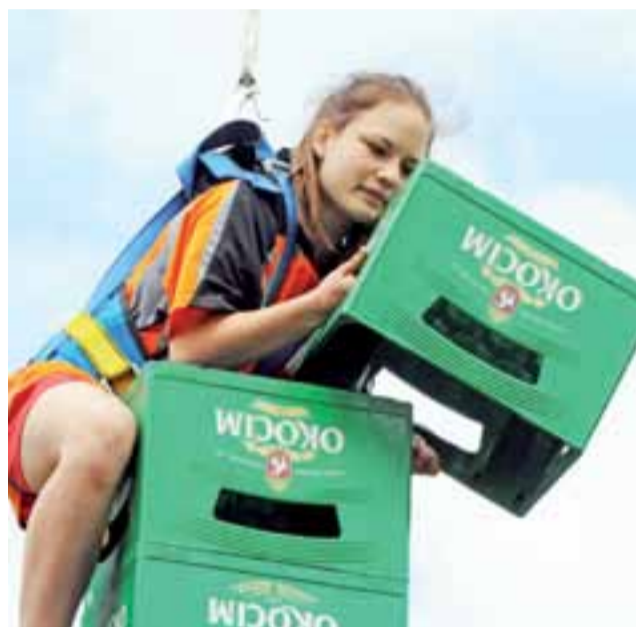
Wspinanie się na wieżę ze skrzynek oraz jednocześnie jej budowanie nie było łatwe. Zawodników ubezpieczali strażacy.

Zawodnicy wspinali się też po linie, przenosili opony, czotgali się