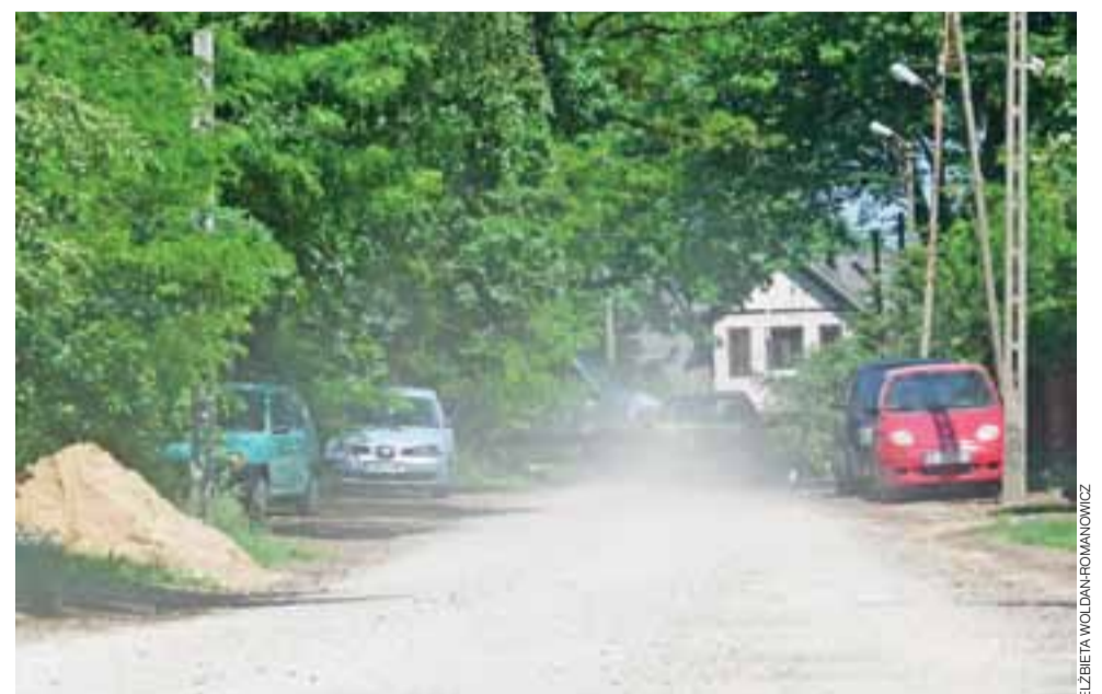
Kurz i nierówności. Ulica Południowa w Głownie w południe, 30 maja.

– Próbowaliśmy tam różnych cudów, żeby tę drogę zrobić, bo to jest droga, która rozproszcza ruch do 18-go Stycznia i Moczydeł (...) Z ulicą Południową nie da się już zrobić nic. Ona jest nie dośc, że nawieziona i wywyższona,