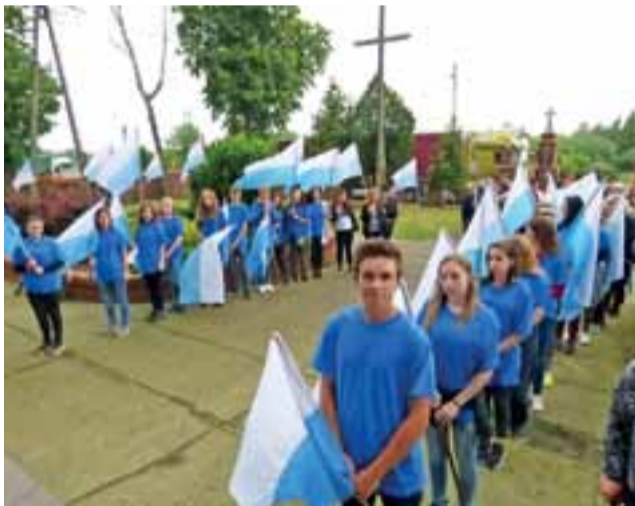
Młodzież z technikum w Zduńskiej Dąbrowie, ubrana w maryjne barwy, stoi na schodach kościoła w Zdunach.

który przed wizytą obrazu prowadził misję. Zaprosił on do niesienia obrazu matki, potem ojców i młodzież, którym asystowali strażacy.