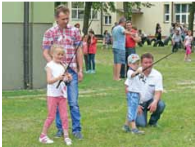
Członkowie Polskiego Koła Wędkarskiego w Bolimowie przeprowadzili dla dzieci konkursy, w których musiały one np. umieścić ciężarek zawieszony na końcu żyłki w tarczy.