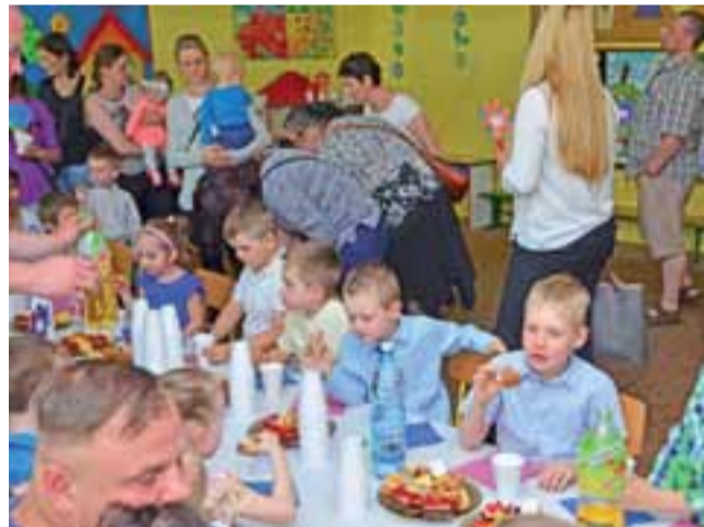
Podczas święta rodziców, nie zabrakło też czasu na poczęstunek.

„Kubusie Puchatki” zaprosiły swoich rodziców do przedszkola we wtorek, 23 maja. Tego dnia czekało na gości wiele atrakcji. W oficjalnej części dzieci zaprezentowały wiersze, piosenki i tańce raz wręczyły rodzicom upominki, którymi były papierowe kwiatki w doniczkach. Potem nauczycielki zaprosiły rodziców do obejrzenia wystawy, na której znalazły się namalowane przez dzieci portrety rodziców.