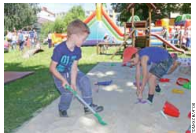
Ileż można zjeżdżać na dmuchańcach? Tych dwóch chłopców w czasie pikniku w Przedszkolu nr 4 wybrało zabawę w piaskownicy.

Dyrektor placówki Urszula Różycka powiedziała nam, że piknik, organizowany w przedszkolu w czerwcu, łączy Dzień Dziecka, Dzień Mamy i Dzień Taty, ma integrować i bawić – i, jak podkreśliła, spełnia swoją funkcję. – Cieszy mnie to, że widzę wśród bawia-