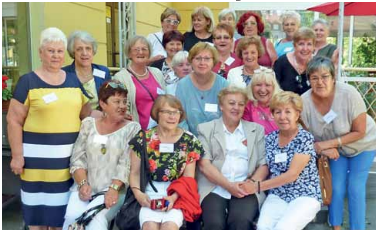
Złota Matura – 1967-2017 Restauracja Polonia.