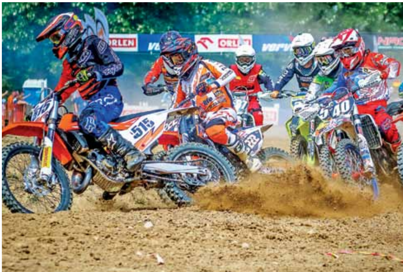
Szaletnica i efektowna jazda zawodników motocrossu to jeden z głównych czynników przyciągających kibiców do Strykowa.