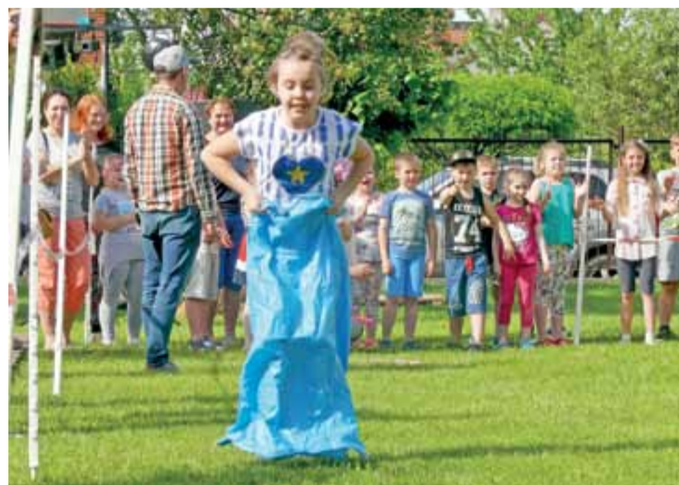
Wyścig w workach na festynie w Sobocie to stały element gier i konkursów. Wszystkie dzieci świetnie dawały sobie w nim radę.

Odbył się także mecz w piłkę nożną, w którym zmierzyli się ze sobą drużyny gimnazjalistów oraz