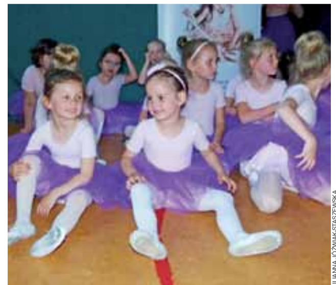
Chwila relaksu przed występem ocenianym przez profesjonalne jury.

dwie wnuczki tańczące w Goldzie i Iskierkach: jedną starszą, drugą młodszą i obydwu zawsze kibicuję. Miło jest popatrzeć na ich radość z występów, a i wido-