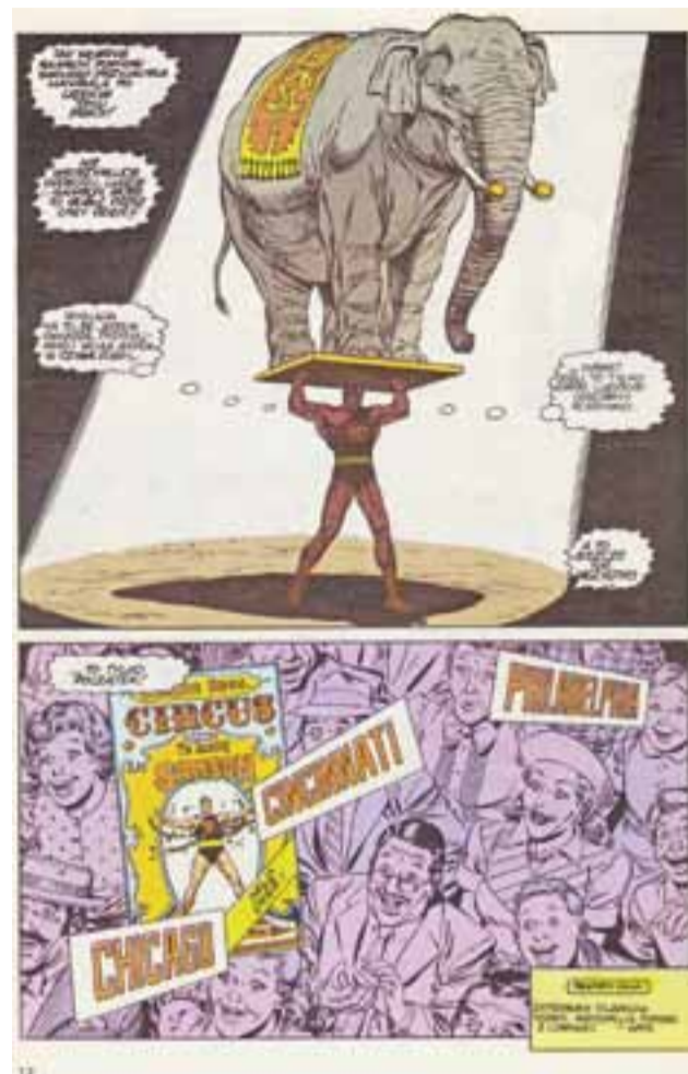
Zishe Breitbart był tak silny, że mógł unieść słońca, co chętnie podchwycili twórcy komiksów.

Na stronach kreskówki Superman zostaje przeniesiony w czasie i budzi się w środku wojny, w roku 1943, w cyrku, z którym później podróżuje po całej Ameryce. Znowu wykonuje te same popisowe numery, które miały miejsce, gdy był jeszcze w ziemskim wcieleniu, jako Zishe Breitbart. To właśnie w czasie tych występów podziwiają go przyszli twórcy komiksu o Supermanie: Jerry Siegel i Joe Shuster. W pewnym momencie siłacz trafia do warszawskiego getta, widząc ogrom cierpienia, wypowiada swoją wojnę III Rzeszy, zatrzymuje pociąg z ludźmi wiezionymi do obozów kon-