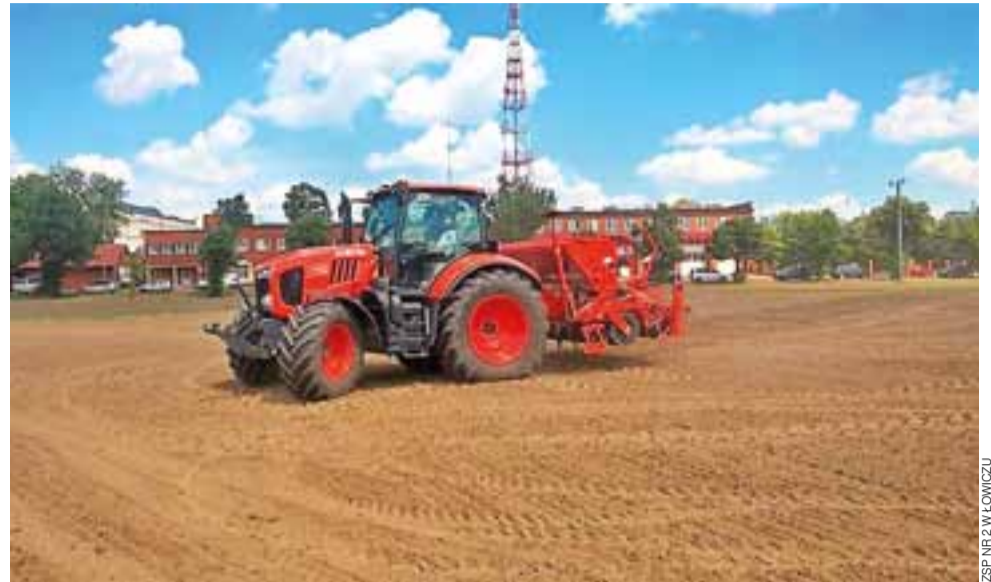
Prezentacje maszyn rolniczych i prac polowych przyciągały największą liczbę zainteresowanych.