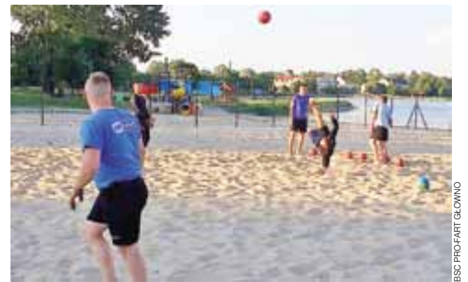
Piłka na plaży w Głownie nad Mrożyczką dostępna dla każdego.