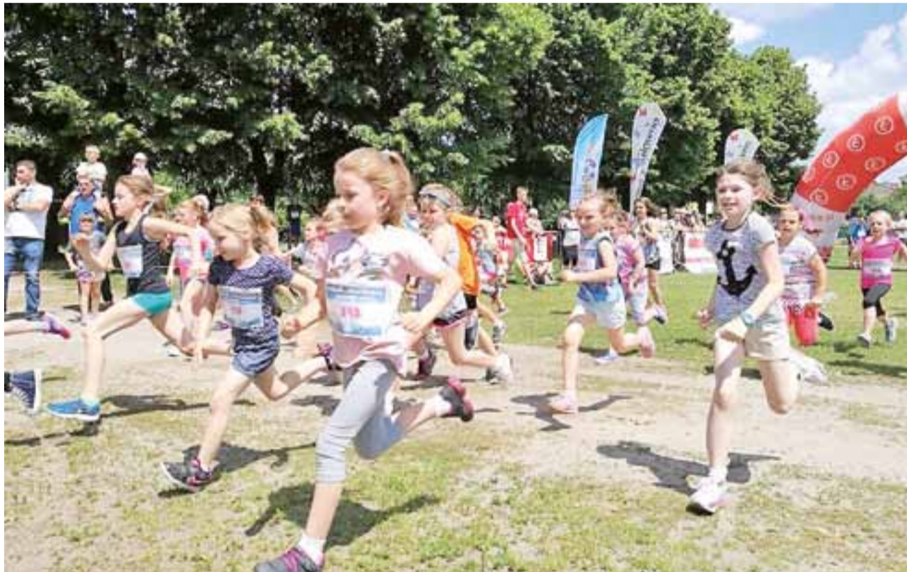
Start dzieci do biegu podczas VI Ogólnopolskiego Rodzinnego Pikniku Biegowego w Głownie. Dziewczęta dały z siebie wszystko.

Organizatorami tegorocznych zawodów była Gmina Miasta Głowno oraz Klub Sportowy Głowno w Biegu. Partnerami imprezy byli Miejski Ośrodek Kultury Głowno, Miejski Zakład Komunalny Głowno, Związek Harcerstwa Rzeczypospolitej w Głownie i Młodzieżowa Rada Miejska Głowno, a patronat medialny nad Piknikiem sprawowały Wieści z Głowna i Strykowa. Celem imprezy było promowanie sportu i biegania jako formy aktywnej rekreacji rodzinnej, integracja wielopokoleniowa, wzmacnianie więzi rodzinnych, promowanie zdrowego stylu ży-