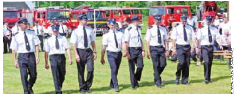
Wzorowi Strażacy. Druhowie ochotnicy wystąpili przed front szyku, by odebrać zaszczytne odznaczenia.

Oficjalną część obchodów jubileuszowych poprowadził pre-