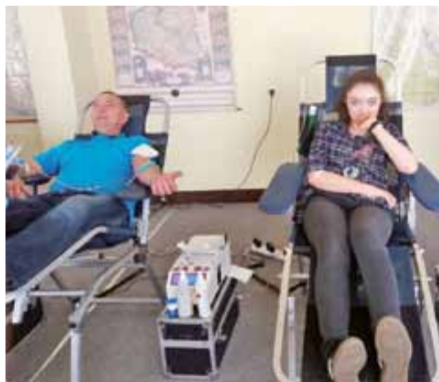
Chociaż dawców było tym razem mniej niż poprzednio, to i tak wciąż można mówić o dobrej frekwencji. f

Poprzednią zbiórkę w Urzędzie Gminy zorganizowano 28 marca, relacjonowaliśmy ją na naszych łamach – wtedy zebrano aż 21,5 l krwi, co przerosło nawet ocze-