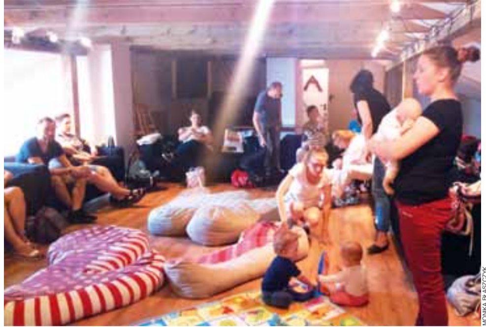
Podczas spotkań na strychu ŁOK w ramach Mlekokotki panowała kameralna atmosfera. Oprócz mam z dziećmi, uczestniczyli w nich także tatusiowie.

Akcja odbyła się ramach Tygodnia Promocji Karmienia Piersią. Podobne Mlekokotki od kilku już lat odbywają się w różnych miastach w Polsce. aa