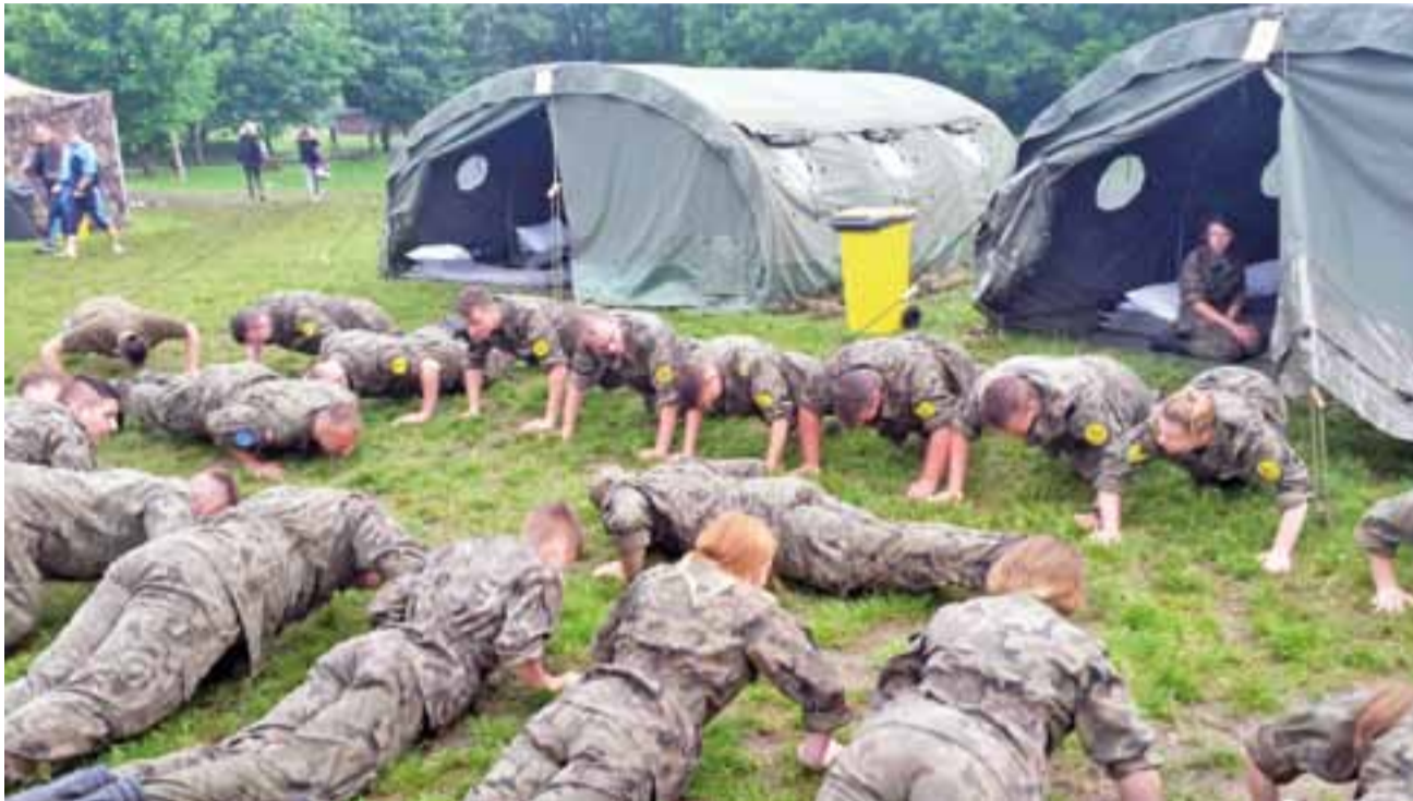
Ćwiczenia sprawnościowe to chleb powszedni poligonowych zgrupowań.

Było ciężko. – Pierwsze wrażenie? Puste pole, a dookoła las. Już sama budowa obozowiska i rozkładanie wojskowych namiotów, w których mieliśmy mieszkać przez 5 dni, nastęczyła może nie dużo, ale jednak kłopotów. Niektóre części stelaży nie pasowały,