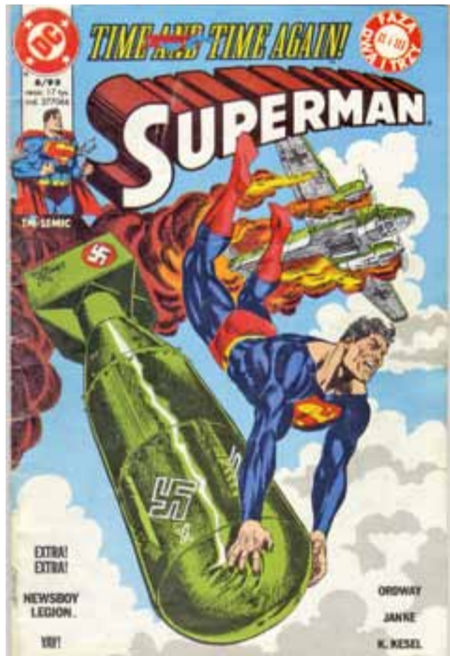
Scan komiksu nawiązującego do autentycznych wydarzeń z życia Zishego Breitbarta. Superman 6/93 Wydawnictwo TM-SEMIC.