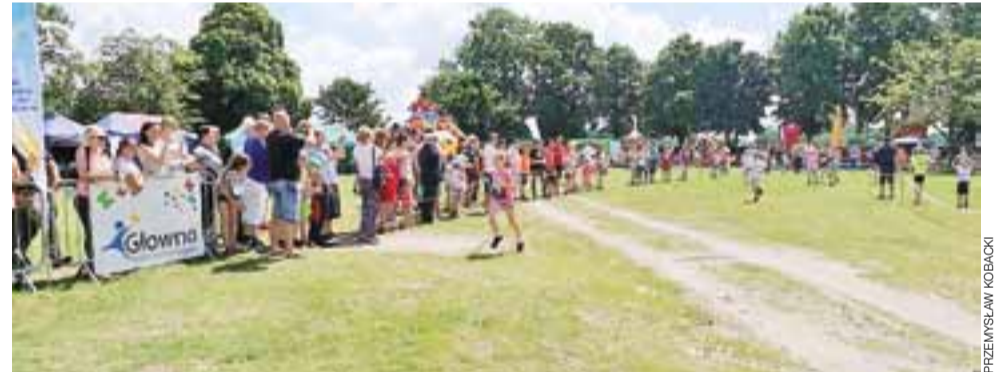
Przy trasie uczestnikom biegu dopingowali kibice, których tego dnia w Głownie pojawiło się kilkuset.

W niedzielnym Pikniku wystartowały dzieci i młodzież w kilku kategoriach wiekowych, a także grupa open od 18 roku wżwży. Najmłodszy mieli do pokonania dystans od 100 do 750 m, młodzież 14-16 lat i 17-19 lat 1150 m, natomiast grupa open zmierzyła się z trasą wokół zalewu Mroźyczka o długości 4750 m. Udział w biegu