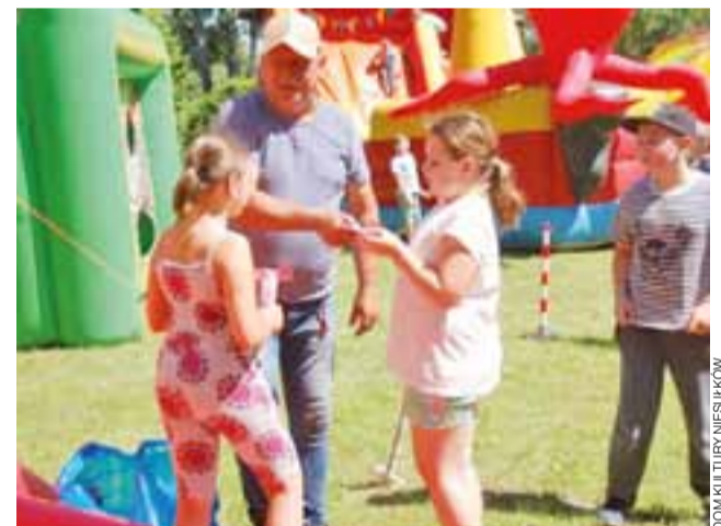
Dla uczestników pikniku przygotowano m.in. dmuchane zjeżdżalnie i inne atrakcje, jak w wesołym miasteczku.