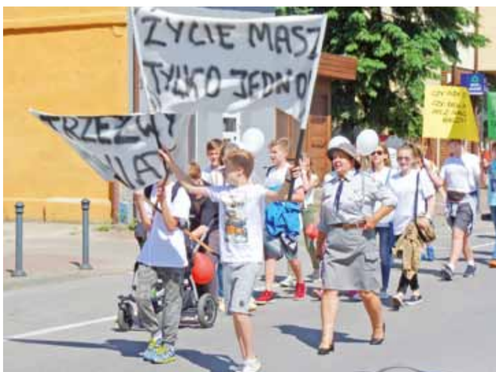
Przeciwko dopalaczom i innym używkom protestowały dzieci i młodzież w Głownie 9 czerwca. Czy z tej akcji profilaktycznej zostanie w głowach? Więcej – strona 7.