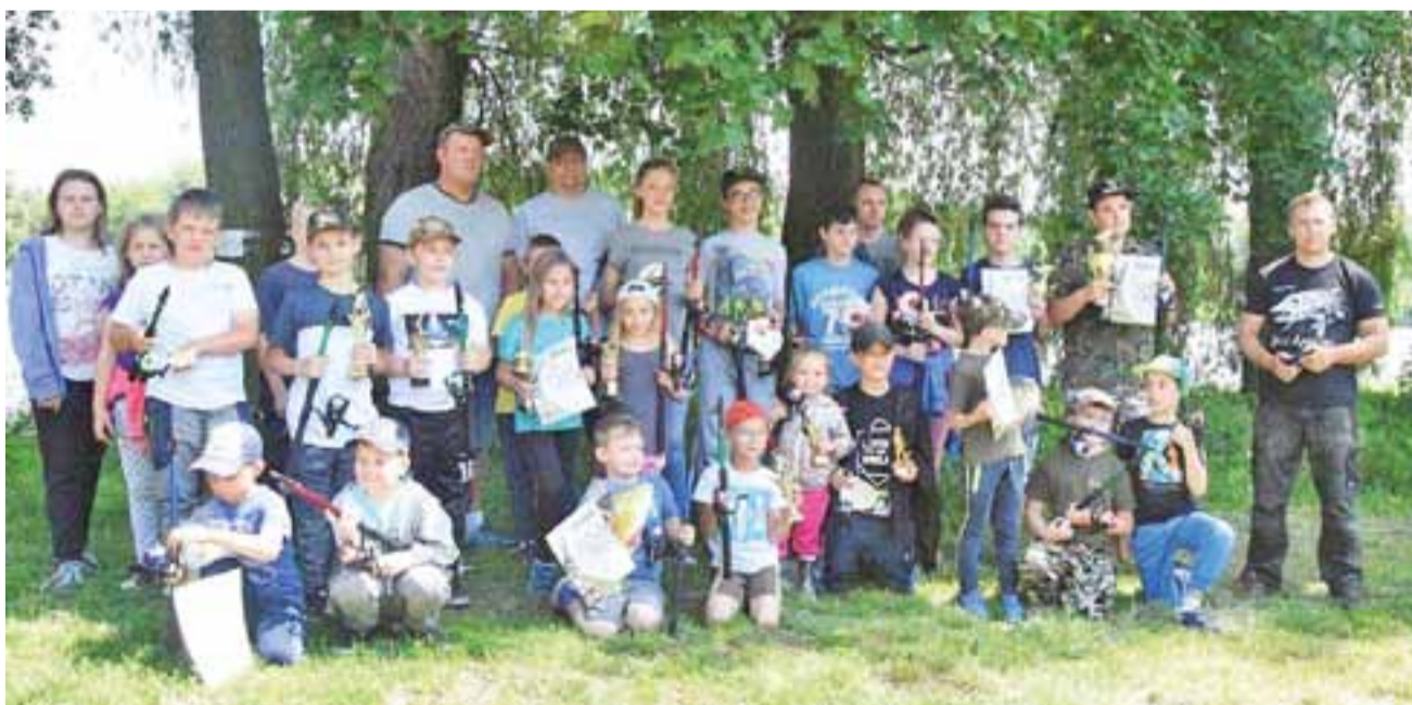
Wędkarski Dzień Dziecka. Wspólne zdjęcie na podsumowanie zawodów.